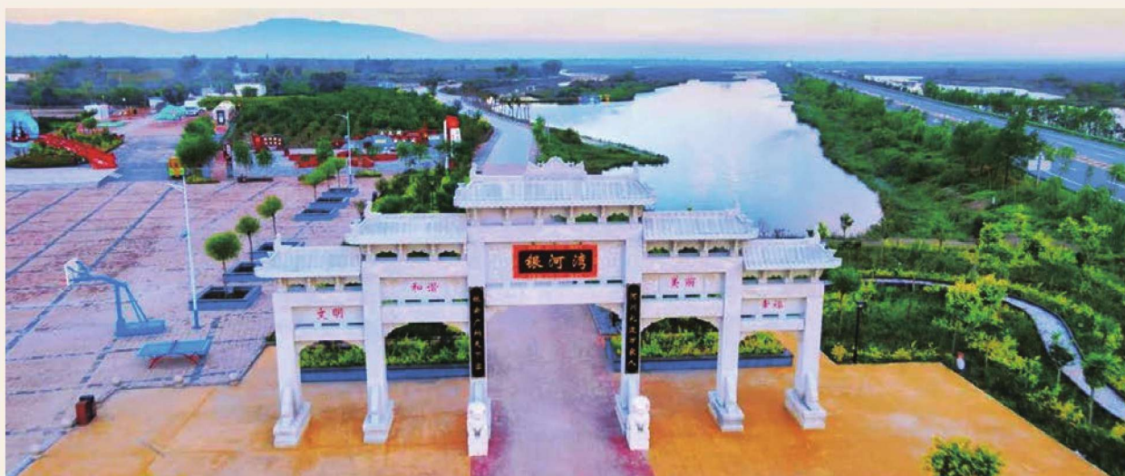
惠农区礼和乡银河湾湿地公园