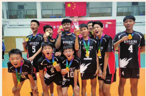
12月9日，石嘴山市第四中学男子代表队在自治区排球锦标赛中获得第一名