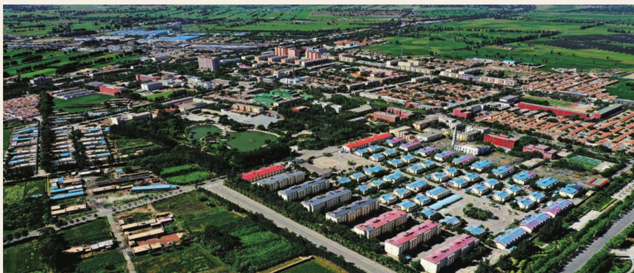
红果子镇全貌——陈小组