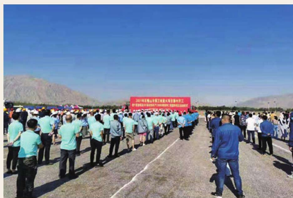
7月16日,石嘴山市第三批重大项目集中开工仪式惠农分会场