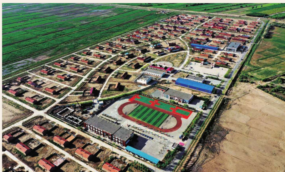
海燕移民新村俯瞰图