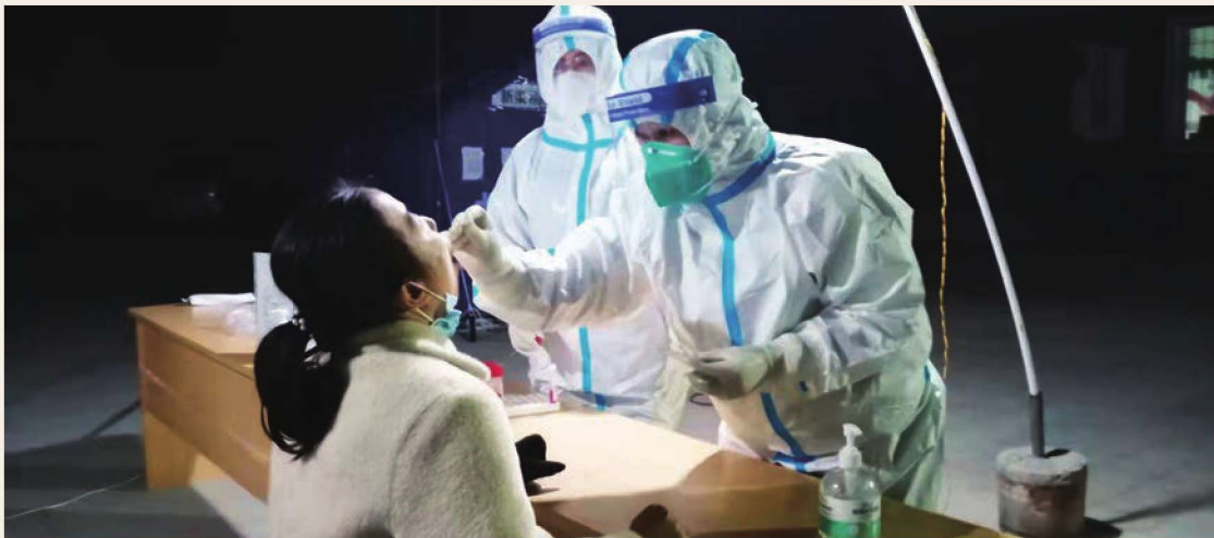
10月23日，惠农区妇幼保健计划生育服务中心支援银川核酸检测队在兴庆区新渠稍村开展大规模核酸采样工作