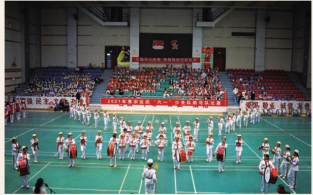
5月31日，惠农区团委、惠农区少工委举办惠农区2021年庆六一少先队鼓号队比赛