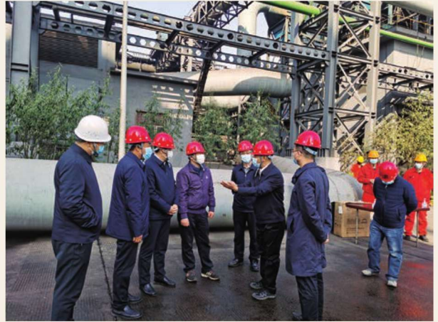
11月3日，自治区副主席吴秀章在惠农区调研危化企业安全生产工作