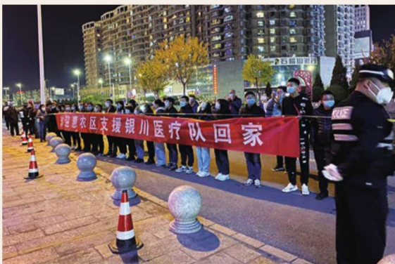
11月4日，惠农区迎接援助银川“10·17”疫情医务人员回家