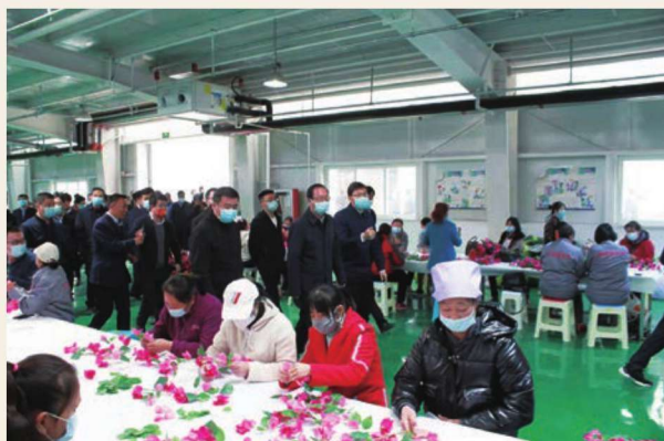
惠农区引进闽宁合作企业，实施人造花制作项目，带动300名残疾人实现灵活就业