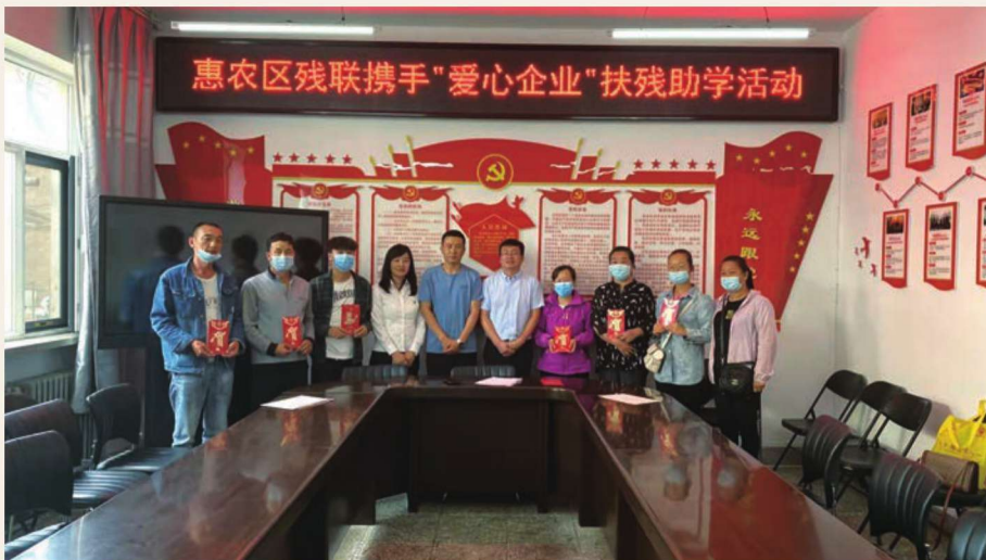
8月27日,惠农区残联携手爱心企业为考入大中专院校的残疾人家家庭学生及残疾学生发放扶残助学金