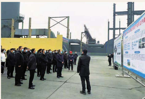
12月8日,石嘴山市工业转型观摩会惠农区现场