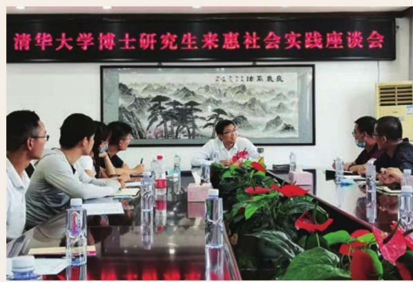
7月31日,惠农区举办清华大学博士生实践团集中座谈会