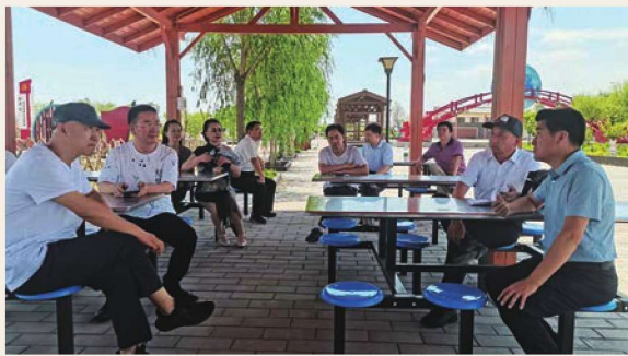
6月27日，惠农区在银河湾举办2021年惠农区在外人才“回乡行”活动