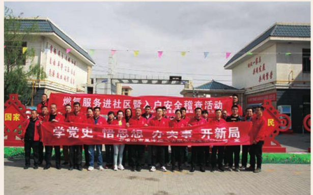
银河苑社区燃气安全宣传活动