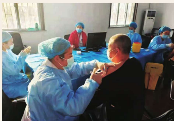
组织开展新冠肺炎疫苗接种工作