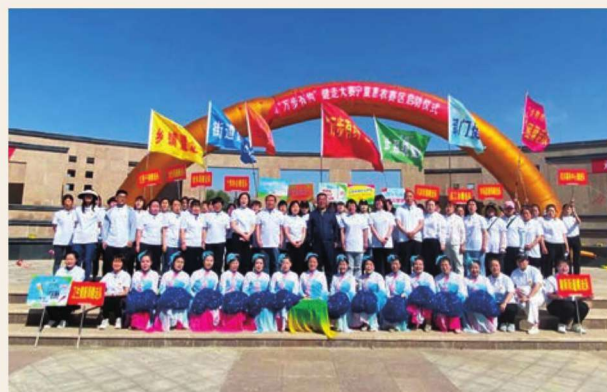
5月28日，举办全国第六届“万步有约”健走大赛宁夏惠农赛区启动仪式