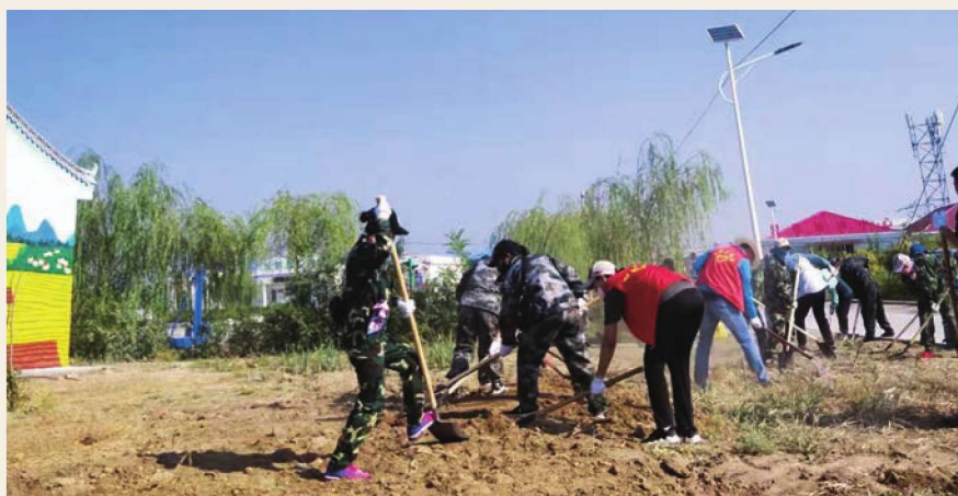
9月1日，综合执法局干部职工到惠农区燕子墩乡海燕村开展环境整治行动