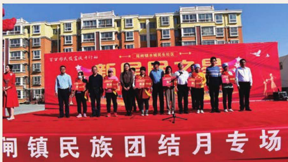
9月30日，惠农区尾闸镇举行水城民生社区“新居民之星”表彰大会