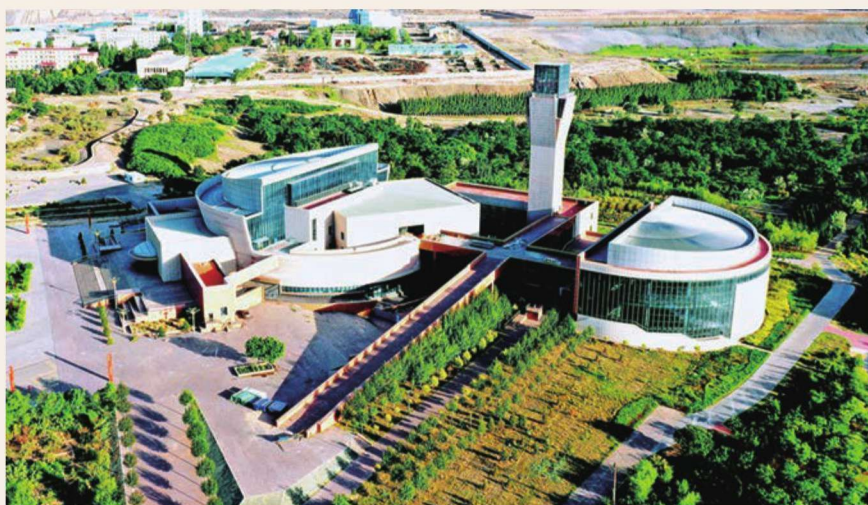
宁夏煤炭地质博物馆