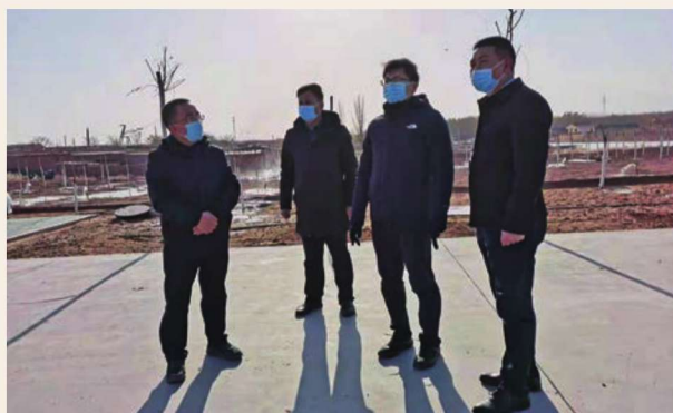
11月10日，区委书记王宇翔视察南湖避险搬迁及生态修复治理工程施工情况