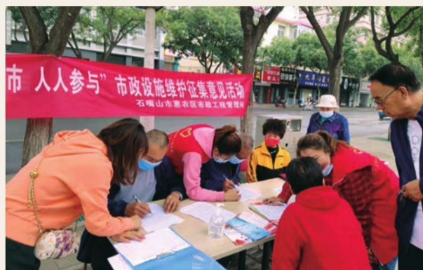
9月18日，惠农区市政工程管理所在文景广场开展市政设施维护意见征集活动