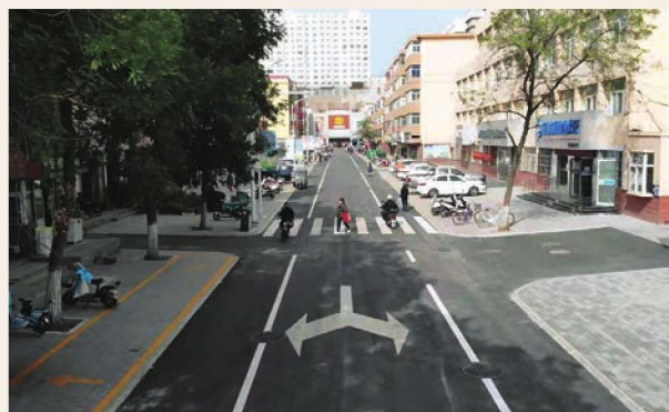
春晖南路改造后面貌图