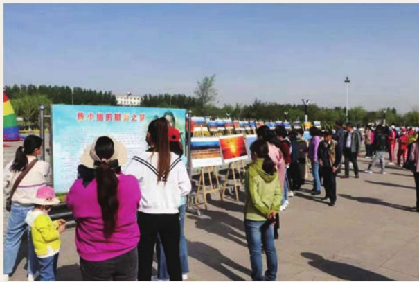
5月8日，惠农区举办“我家黄河岸 群鹤舞满天”庆祝中国共产党成立100周年主题摄影展