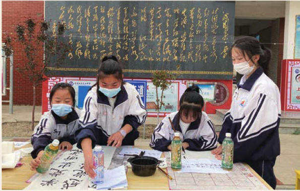
4月23日，惠农区师生代表在市四中参加“回顾光辉党史 喜迎建党百年”书法比赛