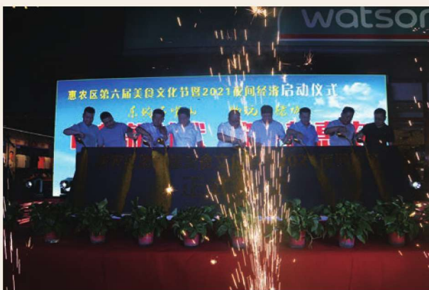
7月2日,惠农区第六届美食文化节暨2021夜间经济启动仪式现场