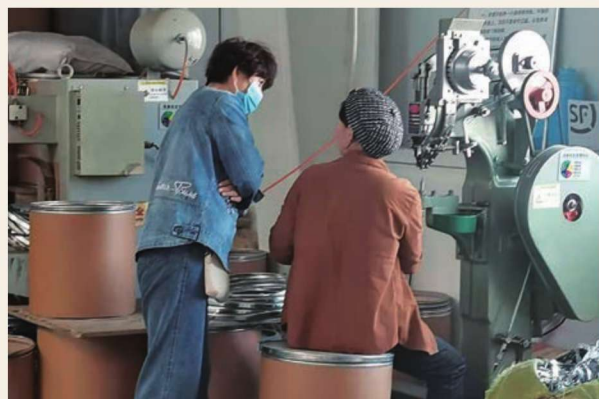
银河苑社区扶贫车间