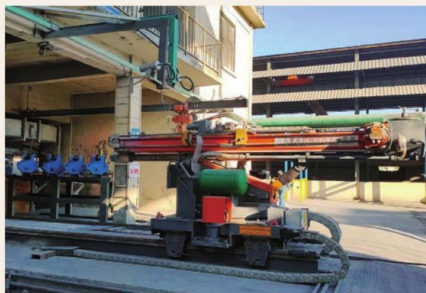
锦华项目电石出炉机器人