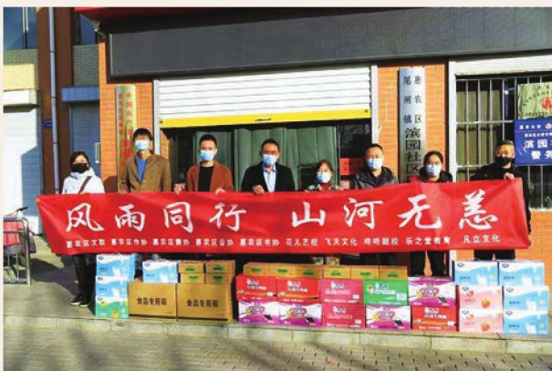
11月18日，惠农区文联各协会会员慰问疫情防控卡点