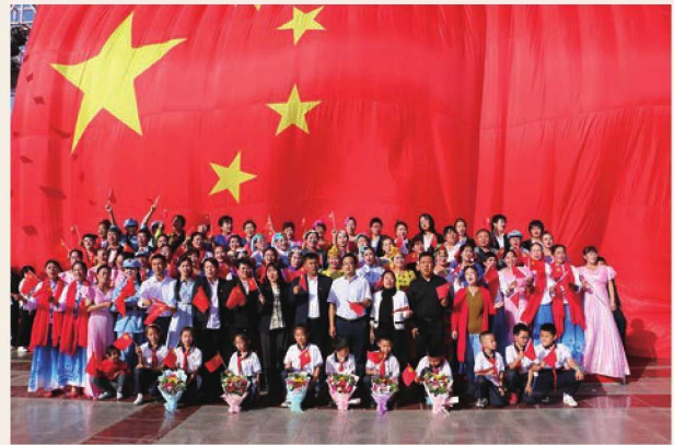
9月30日，惠农区举办“中华民族一家亲 喜迎国庆心连心”活动