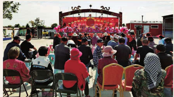
9月26日，惠农区庙台乡通丰村举行“兰花芬芳巾帼红”庆丰收文艺演出