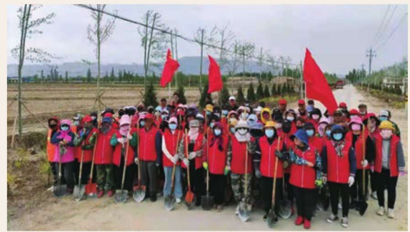
5月15日，惠农区尾闸镇组织全体镇村居干部开展人居环境整治工作