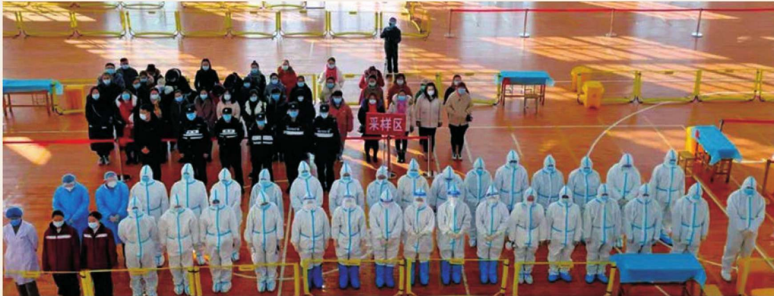
2月10日，惠农区组织开展全员新冠肺炎病毒核酸应急检测演练