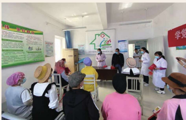
5月25日，惠农区妇幼保健计划生育服务中心在海燕村开展孕期保健健康教育讲座