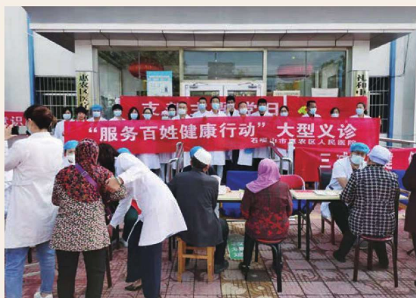
惠农区人民医院到礼和乡开展医疗下乡活动