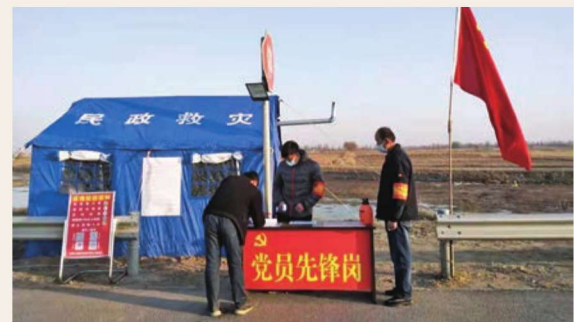
10月29日，惠农区燕子墩乡14个疫情防控卡点中的一处，党旗高高飘扬在抗疫一线