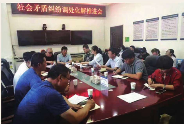
6月26日,惠农区信访局组织各乡镇街道办信访工作分管领导开展社会矛盾纠纷调处化解推进会