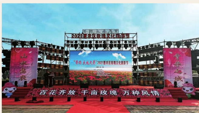
6月12日，“香约 大地天香”2021 惠农区玫瑰文化旅游节盛大开幕