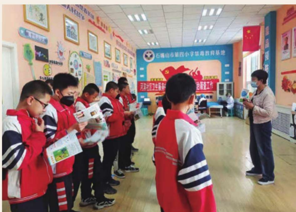
惠农区疾病预防控制中心在惠农区第四小学开展包虫病筛查及健康教育