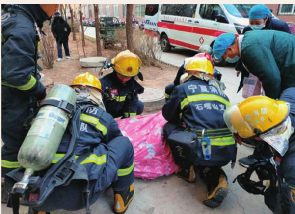
12月17日，惠农区消防大队营救被困群众