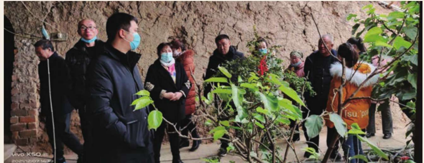
2月8日，银川市2021年高素质农民培训设施蔬菜种植观摩团观摩园艺镇底埂村“南果北种”特色采摘园