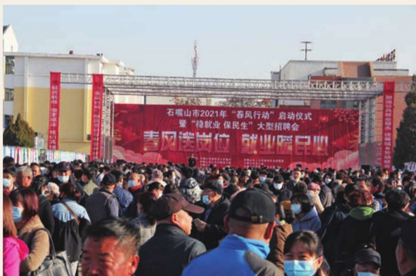
3月2日,石嘴山市2021年“春风行动”启动仪式暨“稳就业 促民生”大型招聘会