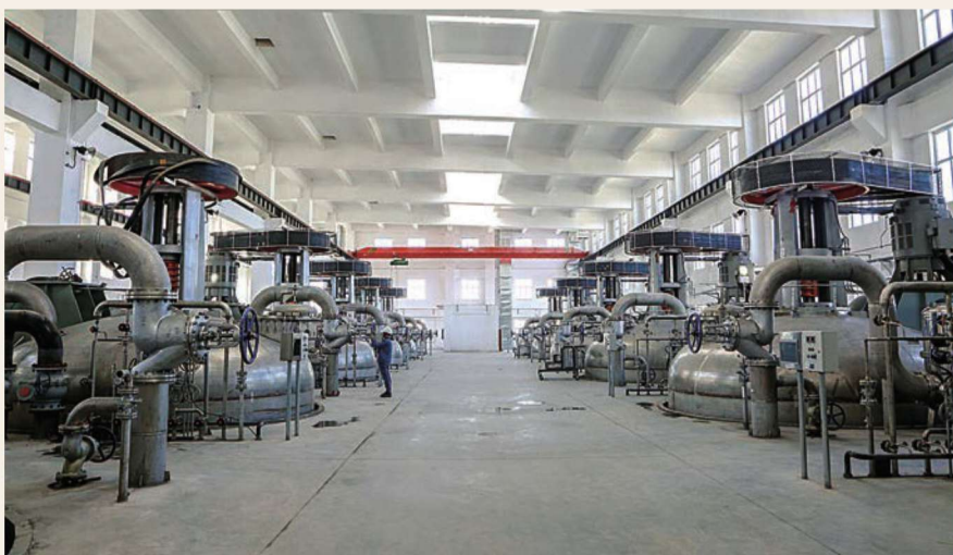
恒力生物月桂二酸项目现场