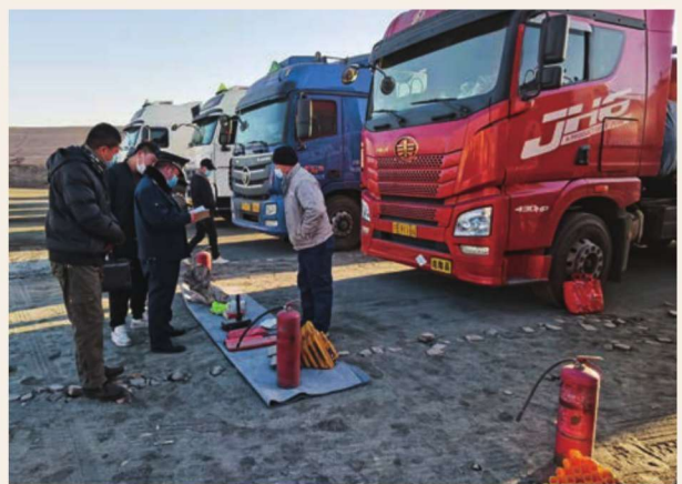
12月20日，惠农区运输管理大队对危险货运车辆进行检查