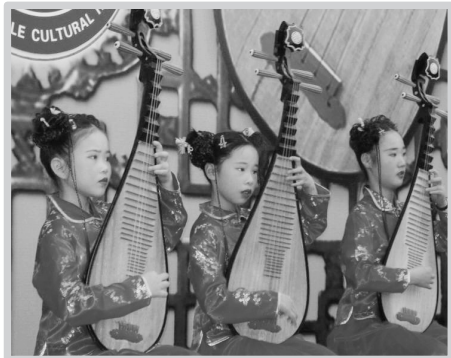
雏鹰民乐团演出场景

2012年11月3日，绍兴市城市广场和越王城文化广场上喜气洋洋、热闹非凡。由中共绍兴市委宣传部、绍兴市文化广电新闻出版局举办的“绍兴市群众文艺原创作品专题展演”在那里演出，四方百姓被绍兴市各地的优秀作品深深地吸引着，其中有个特别的节目——雏鹰民乐团代表越城区参演的平湖调新曲《古越新颜书风流》。22名特长少年用长笛、古筝、中阮、琵琶、二胡等器乐现场演奏，铿锵嘹亮的童音，婉转悠扬的古韵，经过孩子们的精心演绎，赢得