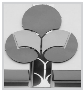
塔山中心小学校徽

但人民政府要办的事千头万绪，不可能把所有性质的学校全部接收过来，只能先接收一部分小学。原来的国民学校，包括私立学校和教会学校，就只能依靠原校董会和政府给予的适当补贴，以民办公助形式存活。所以当时的承天附小经济相当困难，教会方面已无从依靠，只能靠学费收入和政府的一点补助存活，当时教师的工资是相当微薄的。