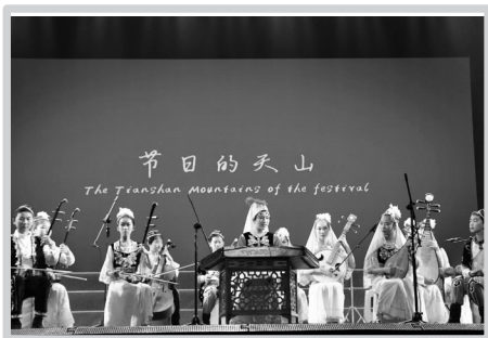
雏鹰民乐团演出场景