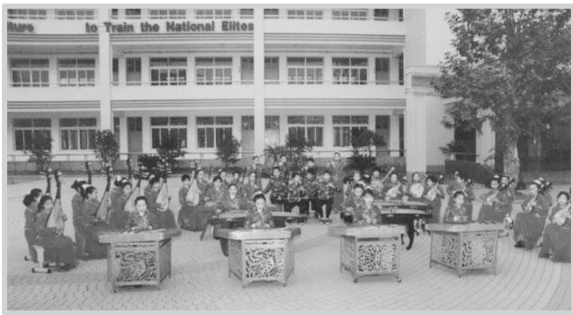
雏鹰民乐团演出场景

1995年，塔山中心小学成立了绍兴市首个学生乐团——雏鹰民乐团，培养了一批批具有民乐才艺的人才。这支由古筝手、扬琴手等组成的“精锐部队”，成为学校一块耀眼的牌子。