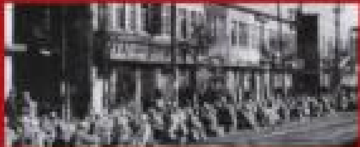
Photograph of the building shown in the adjacent image.