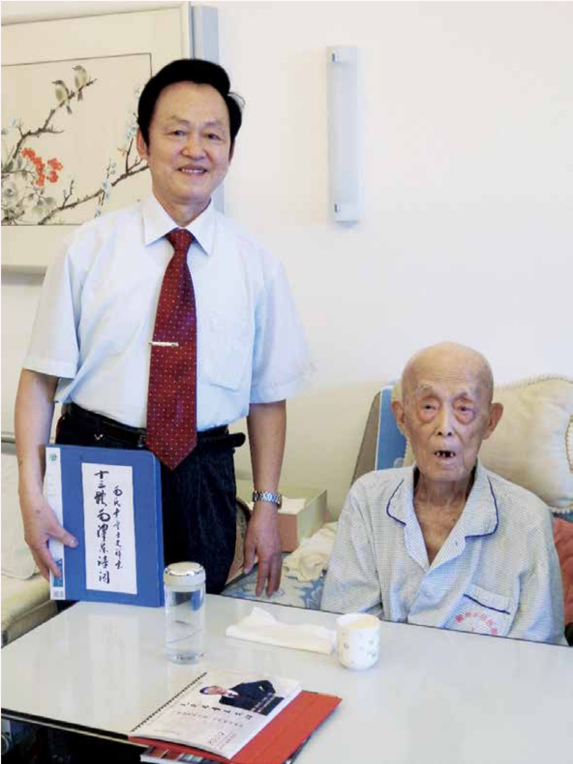
2008年7月，作者王文祥同国学大师季羨林在一起