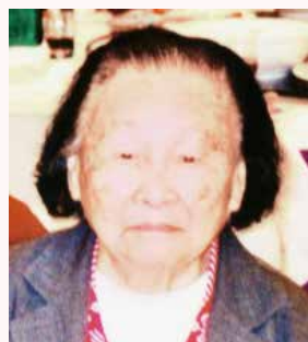
革命老红军 谢觉哉夫人王定国