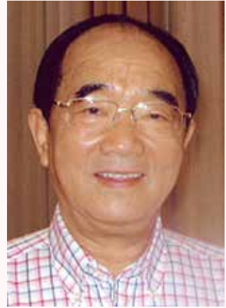
文化部原常务副部长 高占祥同志