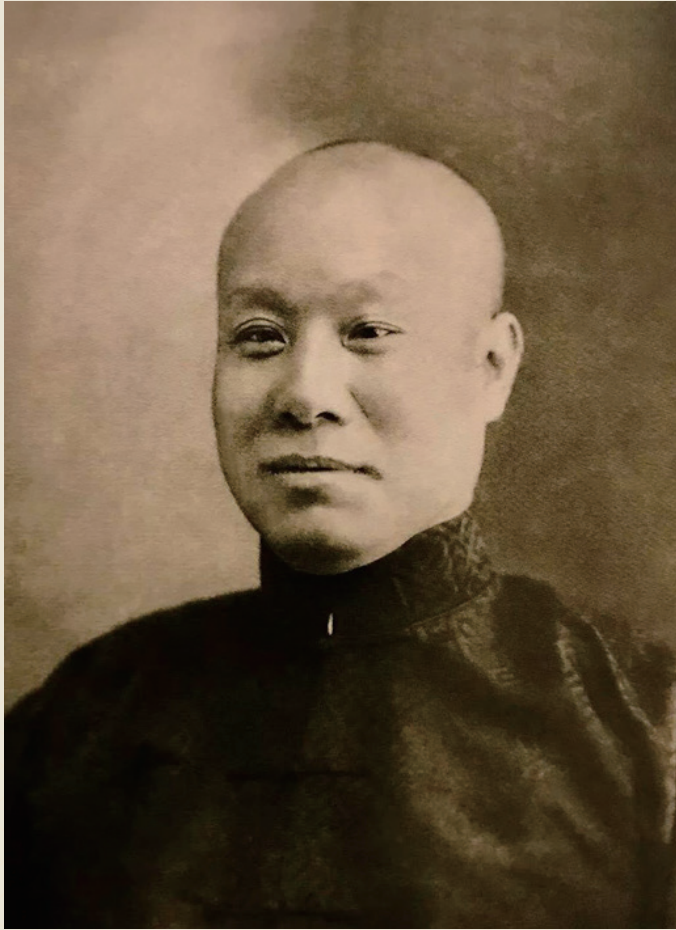
京剧丑角名家、著名戏曲教育家、中国戏曲学校原校长 萧长华先生