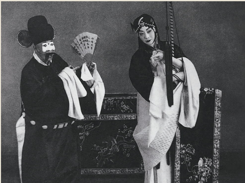
萧长华、梅兰芳之《审头刺汤》