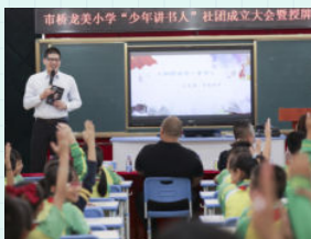
※ 广州市番禺区市桥龙美小学