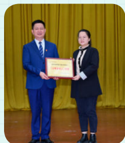
※ 东莞市石龙镇第三中学