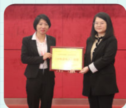
※ 韶关市碧桂园外国语学校