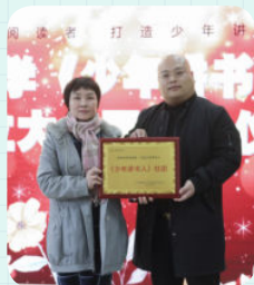
※ 广州市越秀区桂花岗小学