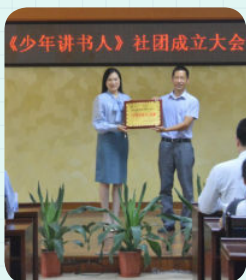
※ 佛山市顺德区均安中心小学