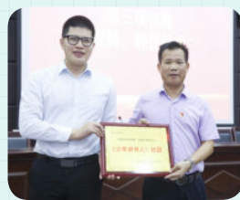
※ 佛山市南海区里水镇旗峰小学