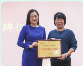
※ 佛山市南海区里水镇里水小学