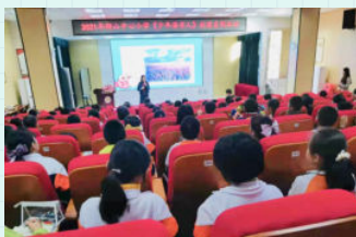
※ 佛山市南海区狮山镇狮山中心小学