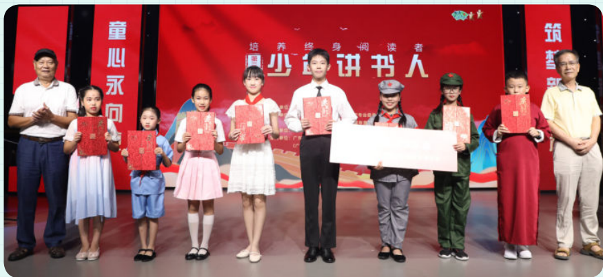
※ 第三季部分“金牌讲书人”与嘉宾合影留念