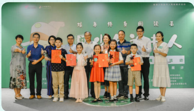
※ 第一季“5强”与专家评委、嘉宾合影留念