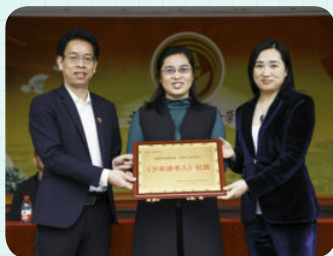
※ 广州市越秀区八一实验学校