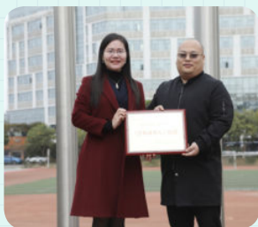
※ 广州大学附属小学