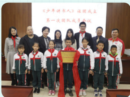
※ 广州市黄埔区九龙第一小学