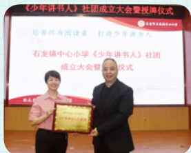
※ 东莞市石龙镇中心小学