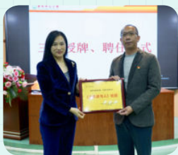
※ 佛山市南海区狮山镇罗村中心小学