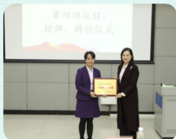
※ 佛山市南海区丹灶镇金沙小学