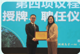
※ 中山市三鑫双语学校