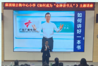
※ 东莞市麻涌镇古梅中心小学