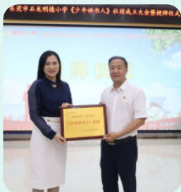
※ 东莞市石龙明德小学