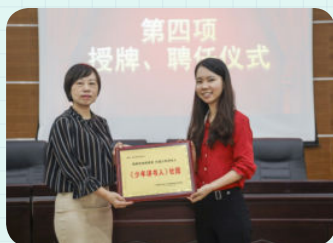
※ 广州市番禺区红郡小学