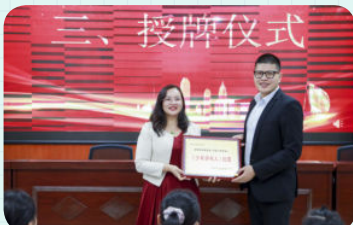
※ 东莞市黄江镇实验小学