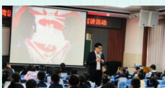
※ 珠海市金湾区第一小学