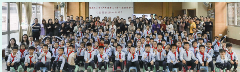
※ 广州市越秀区桂花岗小学