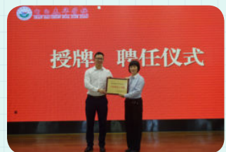
※ 茂名市电白区春华学校