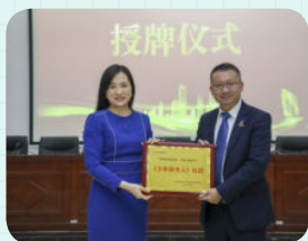
※ 惠州市光正实验学校