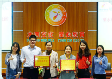
※ 佛山市南海区里水镇同声小学