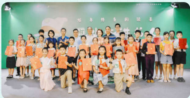
※ 第一季“金牌讲书人”与专家评委、嘉宾合影留念