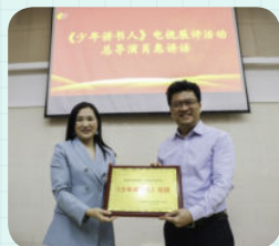
※ 佛山市南海区石门实验小学