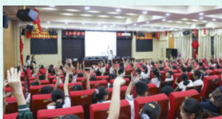
※ 佛山市南海区里水镇旗峰小学