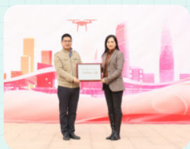
※ 深圳市深中南山创新学校