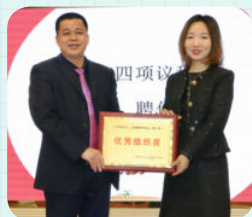
※ 台山市台城第二小学