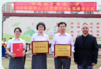
※ 广州南方学院番禺附属小学（原华师附中番禺小学）