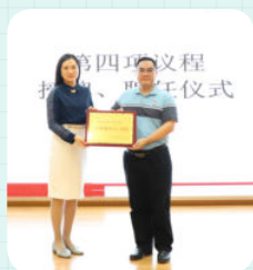
※ 广州市番禺区南雅学校