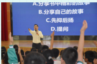
※ 茂名市电白区春华学校