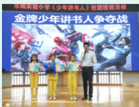
※ 东莞市东城实验小学