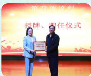
※ 广州市番禺区恒润实验学校