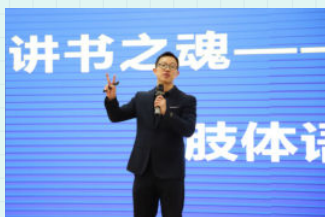
※ 广州市番禺区南雅学校