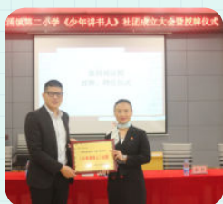
※ 东莞市麻涌镇第二小学