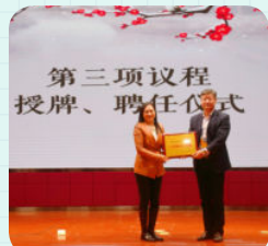
※ 东莞市麻涌镇大步实验小学