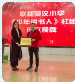
※ 佛山市南海区狮山镇联和吴汉小学