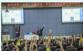
※ 佛山市南海区丹灶镇罗行小学