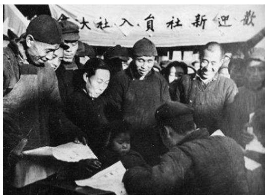
农民报名参加农业合作社