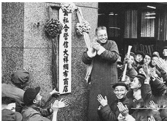
上海市信大祥绸布商店庆祝公私合营