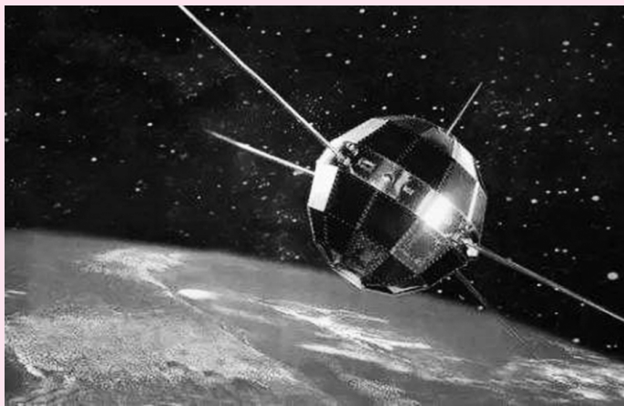
“东方红一号”人造卫星

1970年4月24日,中国自主研发的第一颗人造卫星“东方红一号”发射成功,《东方红》乐曲响彻太空,拉开了中国探索太空的帷幕。中国成为世界上第五个独立研制并发射人造卫星的国家,国际威望空前提高,一个东方航天大国从此崛起。