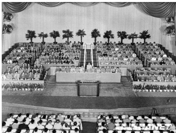
中国共产党第八次全国代表大会会场

党的八大指出,社会主义改造完成后,我国社会主义的主要矛盾已经不再是无产阶级同资产阶级之间的矛盾,而是人民对于建立先进的工业国的要求同落后的农业国的现实之间的矛盾,是人民对于经济文化迅速发展的需要同当前经济文化不能满足人民需要的状况之间的矛盾。因此,党和全国人民的主要任务是集中力量发展生产力,尽快把我国从落后的农业国变为先进的工业国。