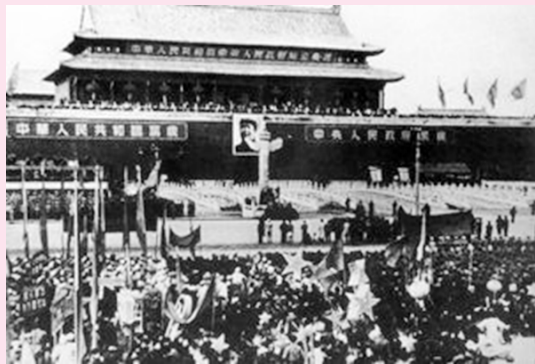
开国大典时的天安门广场

会议结束后,中央人民政府主席、副主席及各位委员集体出发,前往天安门城楼出席开国大典。下午 3 时,北京 30 万军民齐集天安门广场,举行隆重的开国大典。毛泽东主席在天安门城楼上向全世界庄严宣告:“中华人民共和国中央人民政府今天成立了!”