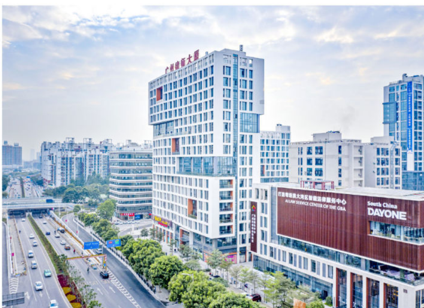
2020年，广州法律服务集聚区吸引一大批法律服务机构进驻。图为广州律师大厦（白云区融媒体中心供稿）