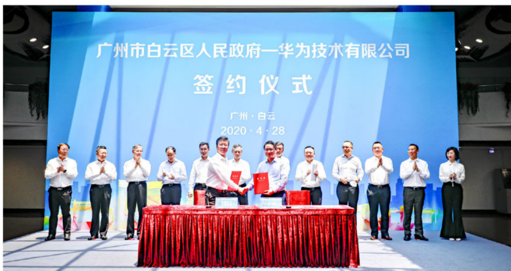
2020年4月28日，广州市白云区人民政府—华为技术有限公司签约仪式举行