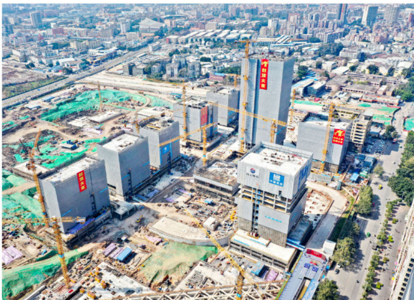
2020年12月17日，广州设计之都项目首批办公楼封顶（白云区融媒体中心供稿）