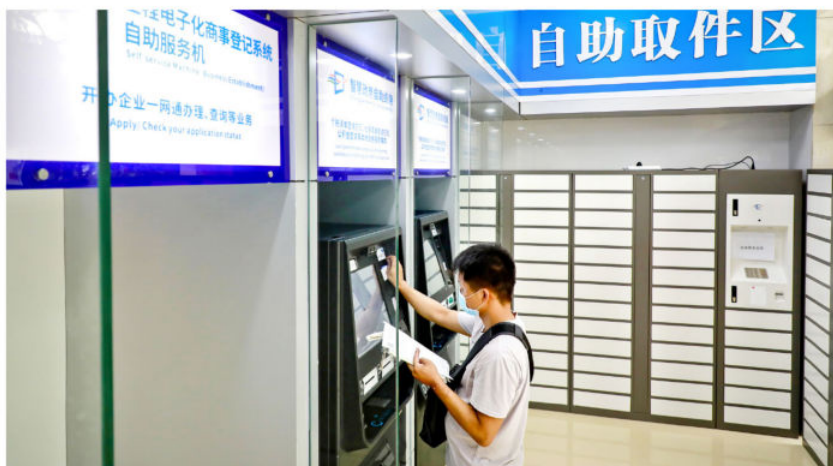
2020年, 政务服务中心改造后增设的白云智慧政务24小时自助服务区