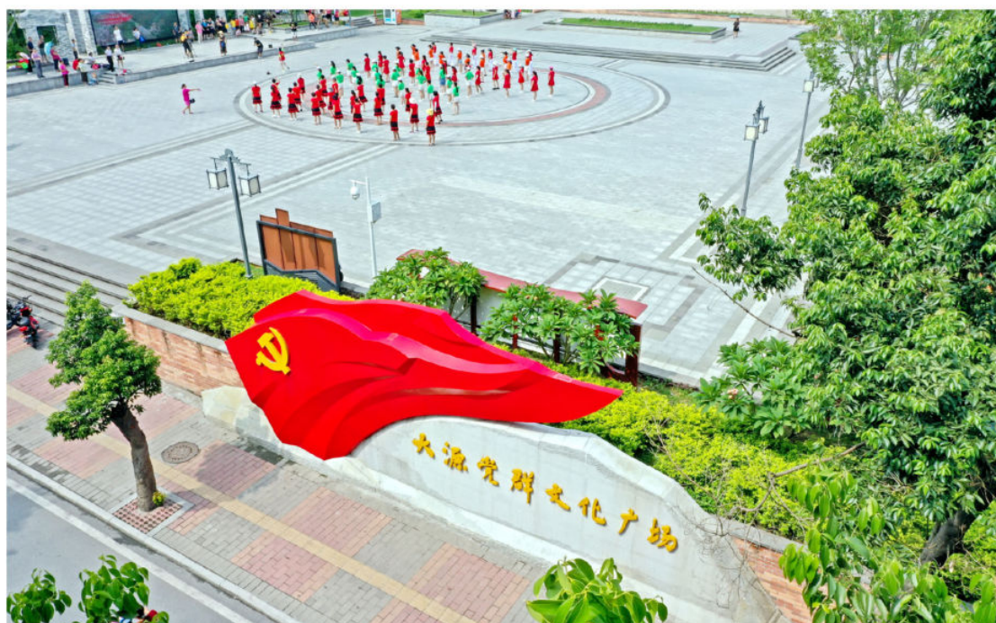
2020年，重点村综合整治后的大源村