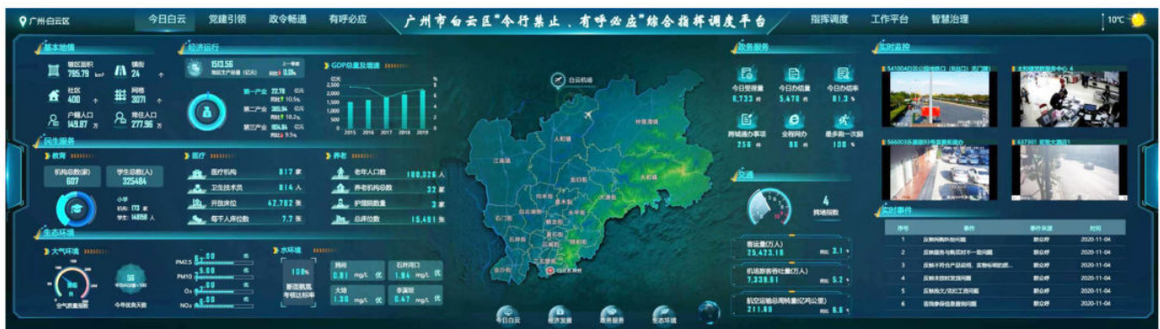
2020年，白云区新上线的3.0版“令行禁止、有呼必应”综合指挥调度平台