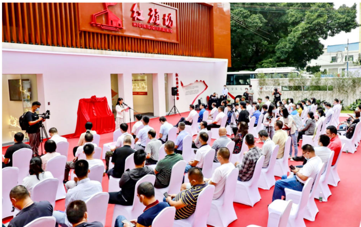
2020年9月27日，嘉禾街新村红色历史展陈馆——红旗坊正式开馆

2020年，白云区抓住干部尤其是“一把手”这个关键，坚持正确用人导向，建设了一支干事创业、作风优良的干部队伍。打造了“4+5+1”基层党建制度、“党支部建在经济社、业委会和网格上”等党建品牌，有力整顿了35个软弱涣散党组织，基层党组织战斗堡垒和党员先锋模范“两个作用”充分激发。正风肃纪反腐的有效做法上升为制度机制，村社换届选举“六公开”（公开报名、公开申报、公开廉洁参选、公开廉洁竞选、公开集中承诺、公开履职就职）新模式获“中国廉洁创新奖”，反腐败斗争取得压倒性胜利，落实全面从严治党主体责任考核连续2年全市第一。