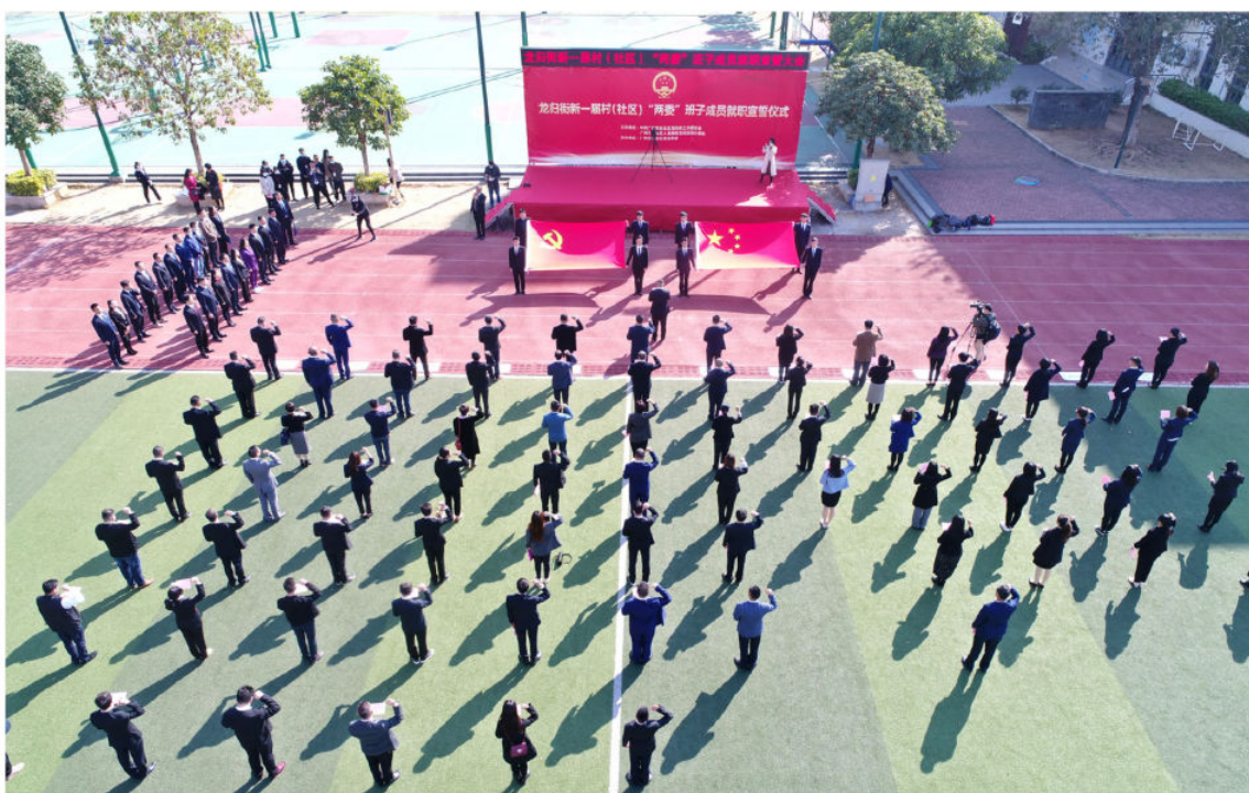
2020年,龙归街新一届村(社区)“两委”班子成员就职宣誓大会