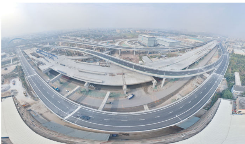
2020年12月30日，白云机场第二高速北段工程通过交工验收（白云区融媒体中心供稿）