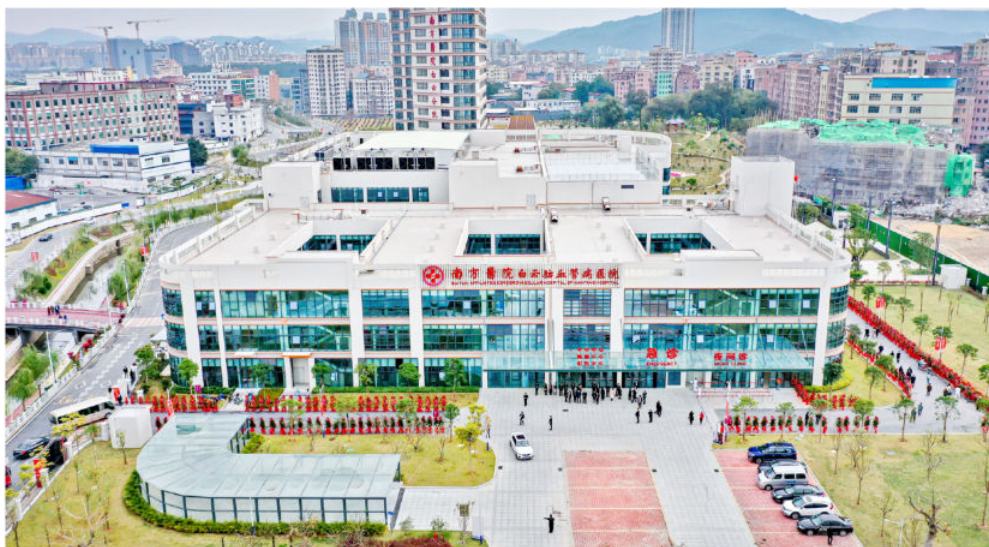
2020年12月18日，南方医科大学南方医院白云分院正式开业