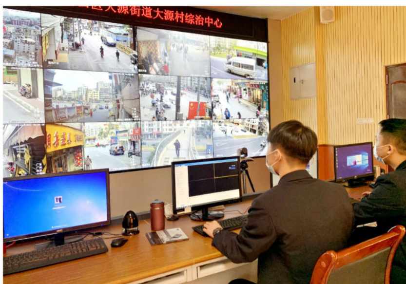
大源村综治中心