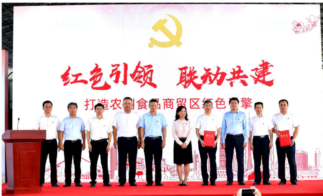
2020年9月9日，广州市“小个专”（小微企业、个体工商户、专业市场）党委与白云区松洲农副食品流通商贸区党委在江南市场召开“红色引领 联动共建”推进会 (白云区组织部供稿)