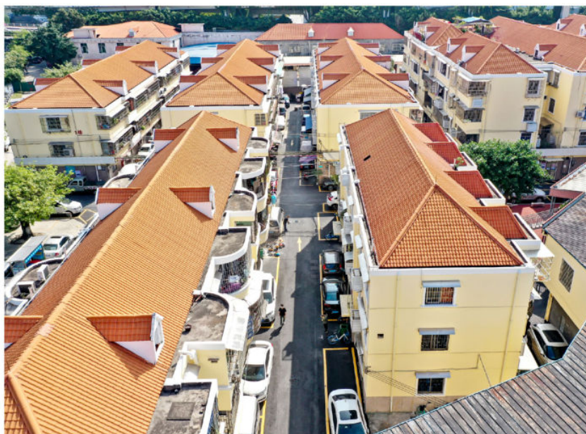
微改造后的三元里街华园北小区 (白云区融媒体中心供稿)