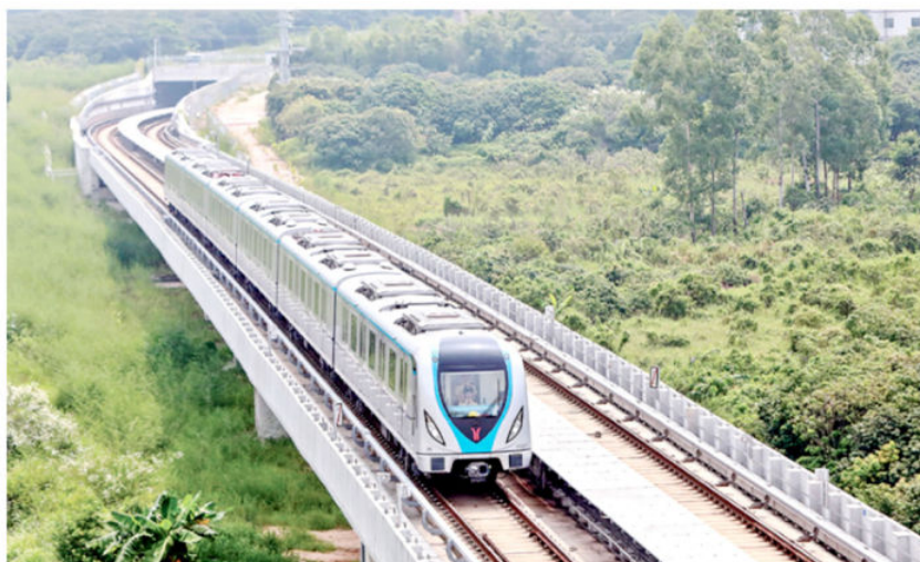
至2020年末，白云区已开通6条地铁线路。图为地铁14号线行驶在钟落潭镇 (白云区融媒体中心供稿)