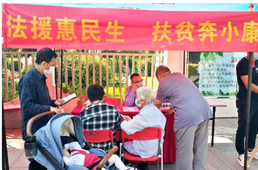
2020年10月26日，白云区首个省级法治文化主题公园揭牌，现场设“法律援助惠民生 扶贫奔小康”咨询专岗，为群众提供法律咨询 (白云区司法局供稿)