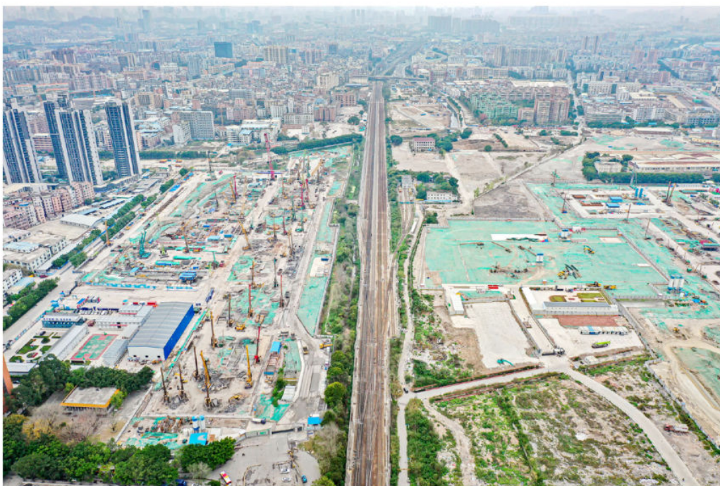
2020年3月2日，建设中的白云火车站

2020年，白云湖数字科技城、现代都市农业示范区全面动工，白云新城集聚一批总部企业。广州白云火车站核心区征拆工作全部完成；广州设计之都19栋大楼在建，其中11栋已封顶，获评“广州市村级工业园高质量发展试点园区”；法律服务集聚区扩容提质，“一带一路”律师联盟广州中心、广州国际商贸商事调解中心等42家法律服务机构入驻。成功引进华为广州研发中心、中关村信息谷创新中心、广东省新兴激光等离子体技术研究院、北大科技园等重大创新项目落户发展。