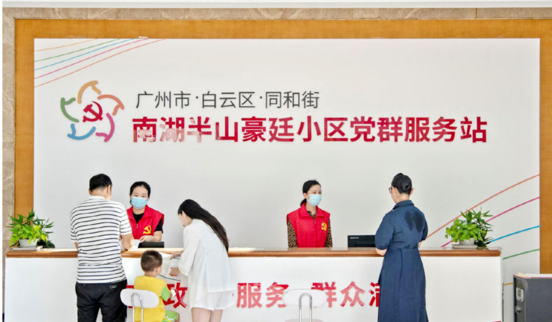
2020年,白云区打造“党支部建在经济社、业委会和网格上”党建品牌。图为同和街南湖半山豪庭小区党群服务站