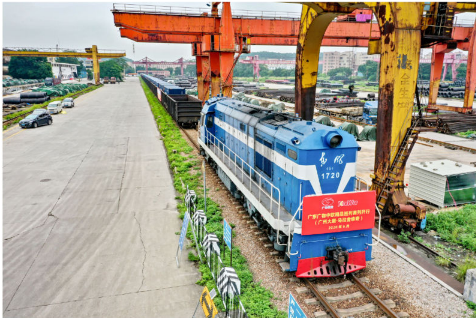
2020年6月6日，中欧班列平台首列中亚班列正式启程

2020年，白云区的7项国家级、省级改革试点任务全面落实，机构改革、太和镇行政区划调整顺利完成。出台实施“六大惠企”政策，全年减税降费超98亿元，新登记企业达7万户，增长27%。乡村振兴基金募集超10亿元，3.0版“令行禁止、有呼必应”综合指挥调度平台初步建成，“办事不用跑”事项比例达92%，荣获2020年度中国政博会“四大奖项”，营商环境排名全国百强区第七，被评为河长制湖长制工作真抓实干、成效明显的全国10个先进县（区）之一，并被国务院予以督查激励。四个重点村综合整治实现从“乱”到“治”，大源村获评“全国乡村治理示范村”。中欧班列发出300次专列并实现返程、货物总值超17亿美元。成立港澳台青年创新创业服务中心，打造2个市级示范基地。