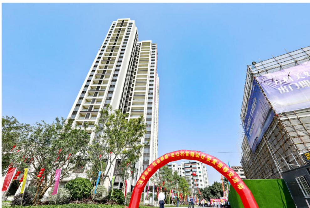
2020年11月5日，田心村首期回迁安置房完成集体移交

2020年，白云区民生和各项公共事业支出近160亿元，占一般公共预算支出84.2%，十件年度民生实事全部兑现。南方医院白云分院新院区开业运营，新增医疗机构50家、床位超1100张。全年城镇新增就业30323人，推进“粤菜师傅”“广东技工”“南粤家政”三项工程，建立区级工匠培育工作室32家，保障农民工工资支付考核连续3年被评为全市A级。荣获省双拥模范区“十连冠”。矛盾纠纷多元化解平台入选全国政法优秀创新案例，诉前、裁前调解成功率居全市第一。实现区、镇街、村（社区）三级公共法律服务平台全覆盖，创建3个省级法治文化主题公园、示范村（社区）。对口帮扶的贵州荔波、平塘、罗甸县脱贫摘帽，英德市35条相对贫困村贫困人口全部达到脱贫标准。