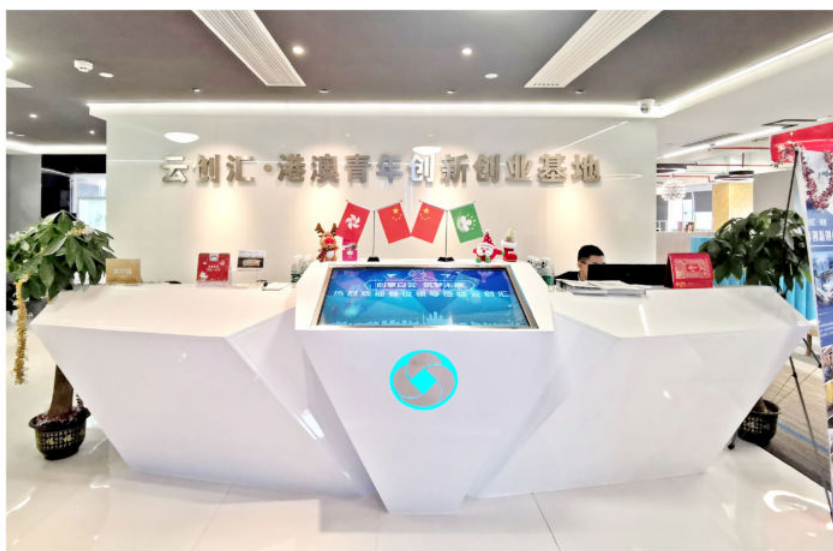
云创汇·港澳青年创新创业基地