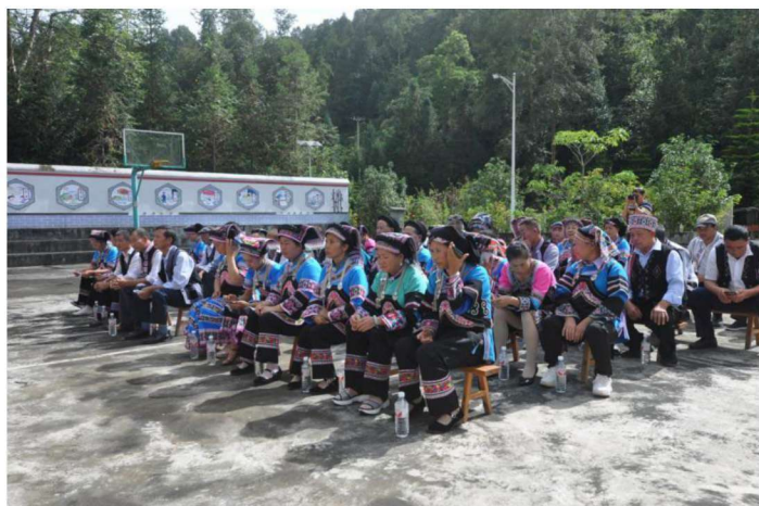
◀河口县布依族民间文学收集整理出版动员会（二）