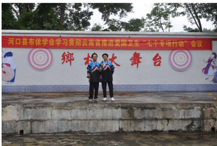
▶河口县布依族民间文学收集整理出版动员会文艺演出（三）