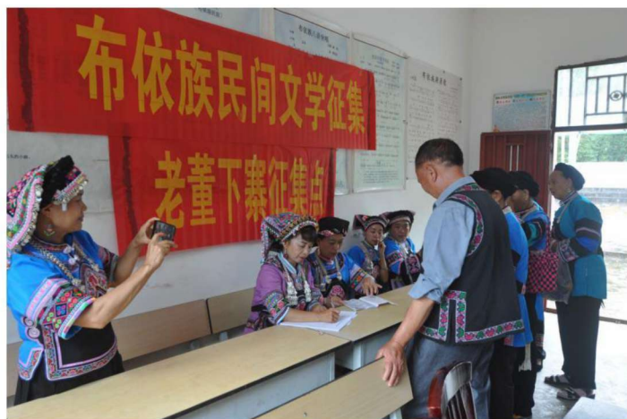
◀河口县布依族民间文学老董下寨征集点