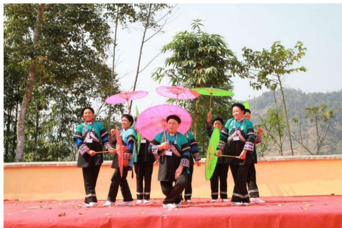
◀河口县布依族民间文学收集整理出版动员会文艺演出（二）