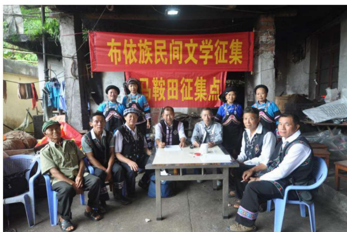
▶河口县布依族民间文学马鞍田征集点