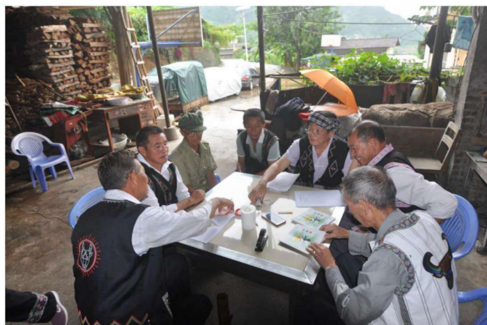
◀河口县布依族民间文学马鞍田征集点