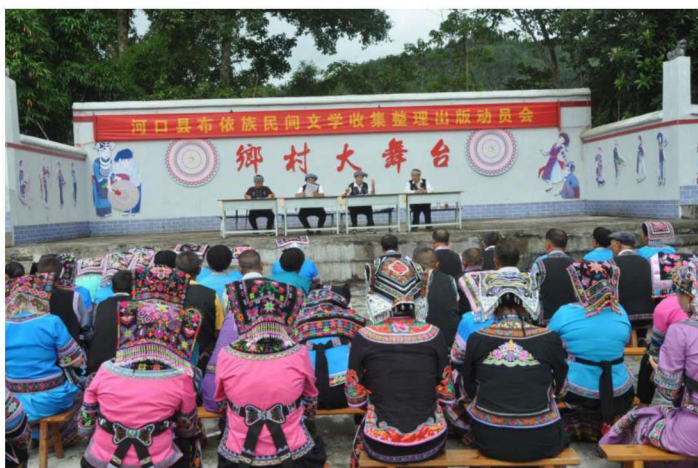
▶河口县布依族民间文学收集整理出版动员会（一）