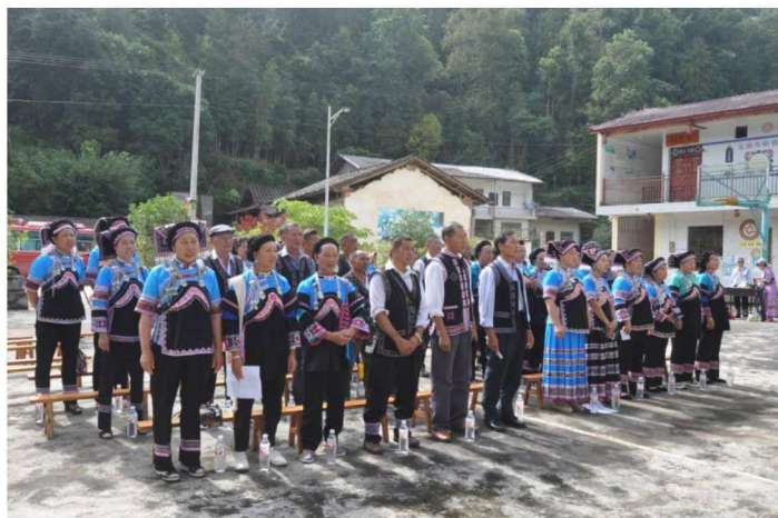
◀河口县布依族民间文学收集整理出版动员会（三）