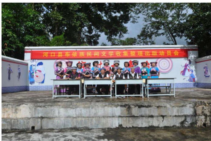
▶河口县布依族民间文学收集整理出版动员会演员和布依学会班子合影