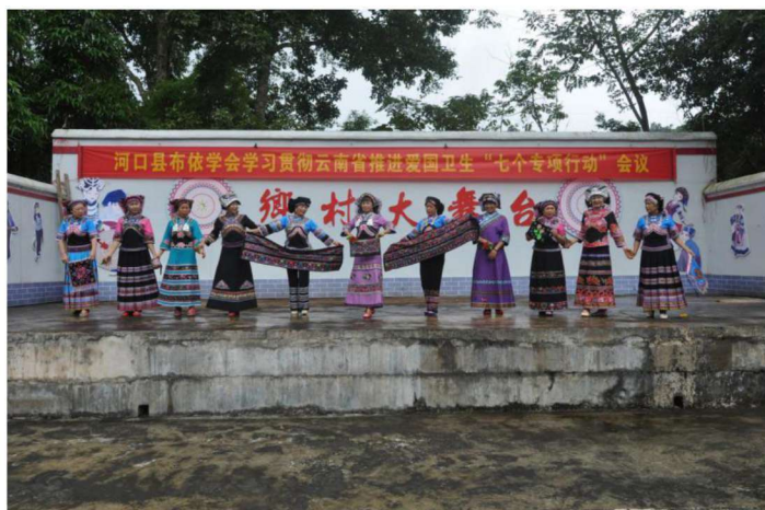
◀河口县布依族民间文学收集整理出版动员会文艺演出（一）