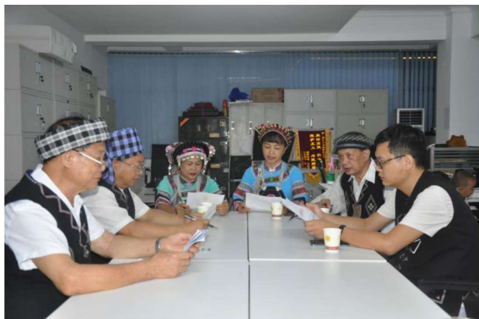
◀河口县布依族民间文学领导小组在研究工作