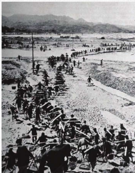
修建新津机场的宏大场面。除有少量人力车外，基本上都是挑夫

新津机场位于成都南郊，始建于1928年，时刘文辉以“塘汛故址”3700多亩地为基础，再毁青苗谷田1000亩修建成型。抗战开始后，这座机场被指