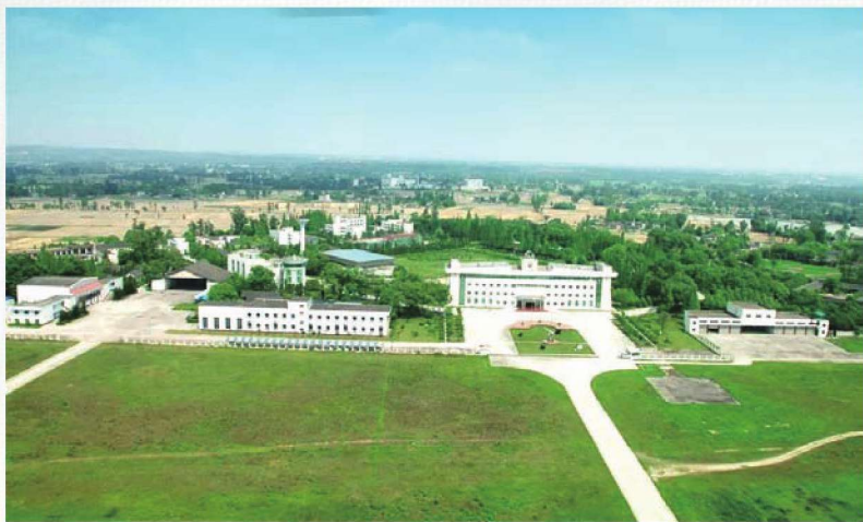
新津机场抗战旧址远景

后查资料求证，扩建机场时大量的土方砂石，除用架子车、独轮车运送外，都靠箩筐扁担挑。民工们靠人力牵引来驱动的石碾，为钢筋混凝土浇筑，大者重约15吨，一人多高，需80人才能拉动；小者重约8吨，约1.5米高，50人方可拉动。而制造石碾的水泥，是通过被称为“死亡航线”的“驼峰航线”空运到现场的。美军第14