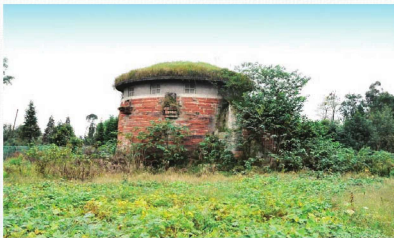
新津机场抗战旧址——碉堡

航空队司令陈纳德将军在战后写道：“驼峰运输机没有吨位装运开路机、压路机或轻便的降落用板钢席。我们在华的100多个机场，都是千千万万的中国男人、女人和小孩流着汗血，辛苦地徒手筑成的。”