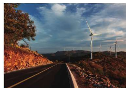
/ 胜境 / 40—56