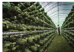
/ 兴业 / 57—64