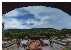
/ 古风 / 14—18