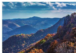
/ 奇观 / 19—39