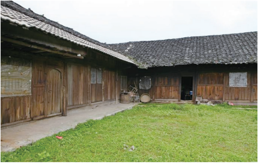
湘鄂西中央分局旧址