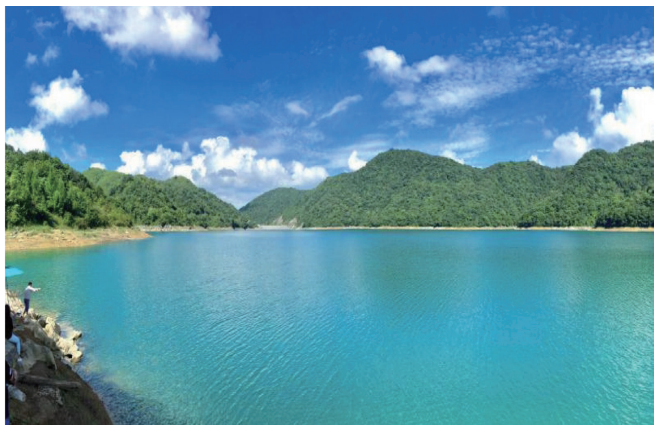
1971 年建始用 10 年时间全人工修筑的 42 坝水库