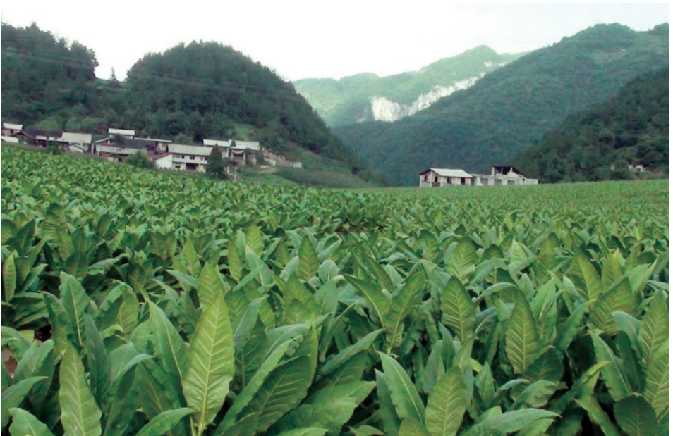
建始白肋烟出口基地