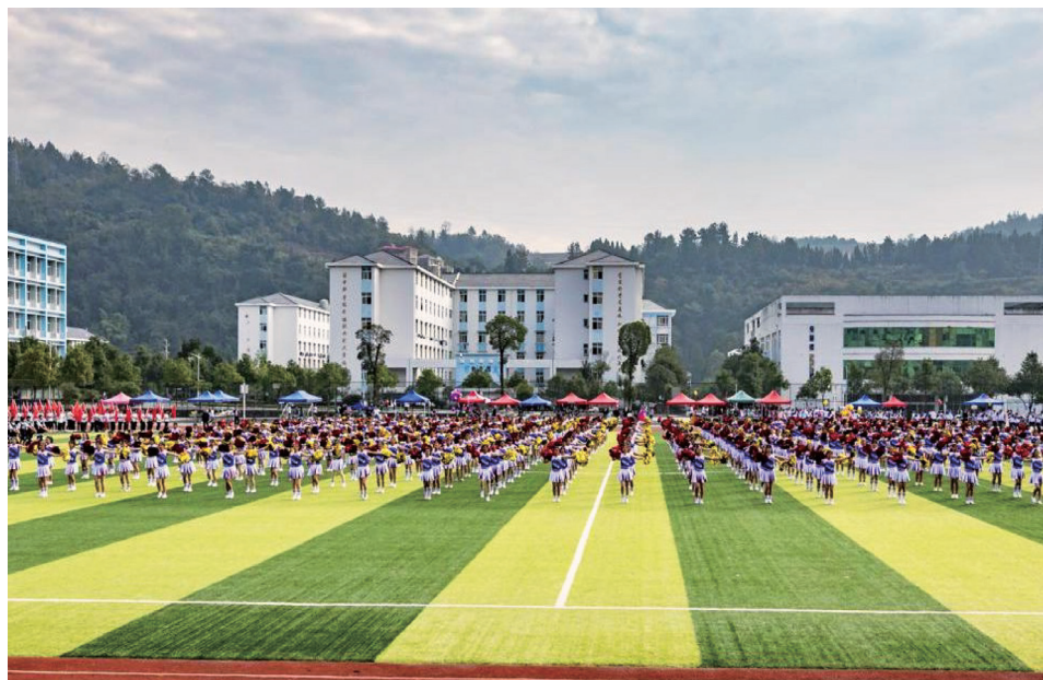
建始革命老区在教育新区举办艺术节