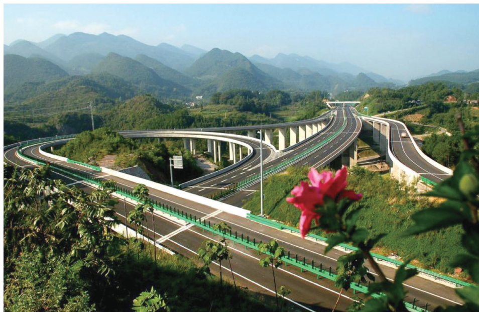
2009 年 12 月开通的沪蓉西高速公路建始出口