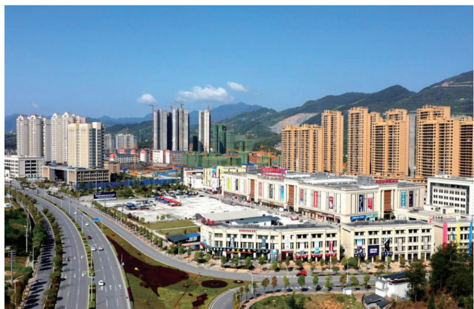
持续推进中的建始新城区