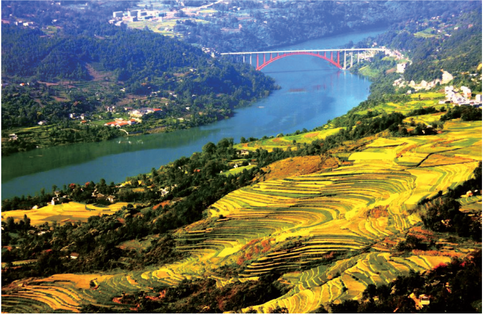
2007年12月建成通行的景阳河大桥将革命老区联成一体