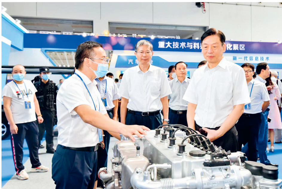
2020年8月23日，自治区党委副书记孙大伟（前排右一）参观2020年广西创新驱动发展成果展

来，鹿心社书记还先后到广西飞南铜资源利用有限公司、三江口新能源电动车产业园、广西汇元锰业有限责任公司、广西福斯派环保科技有限公司、柳州津晶电器有限公司、广西博睿恩金属科技有限公司、柳州螺蛳粉产业园等开展调研指导。