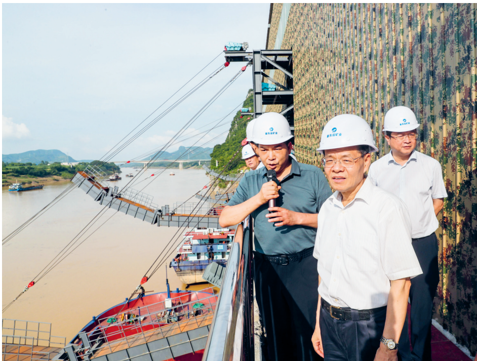
2020年7月2日，自治区主席陈武（中）在来宾市广西新东运矿业有限公司调研

项、固根本，在引领促进和服务保障两新组织高质量发展上提质聚力，两新组织党建工作取得明显成效。4月，在中央组织部召开的基层党建工作重点任务推进会上，我区在发言中介绍了提升两新组织“两个覆盖”质量的经验做法。11月，在国家市场监管总局召开的全国市场监管系统“小个专”党建工作会议上，自治区市场监管局作为发言单位，又一次介绍了我区“小个专”党建工作的经验做法。《光明日报》、《中国组织人事报》、中组部《党建研究》等报道了我区两新组织党建工作的经验做法。