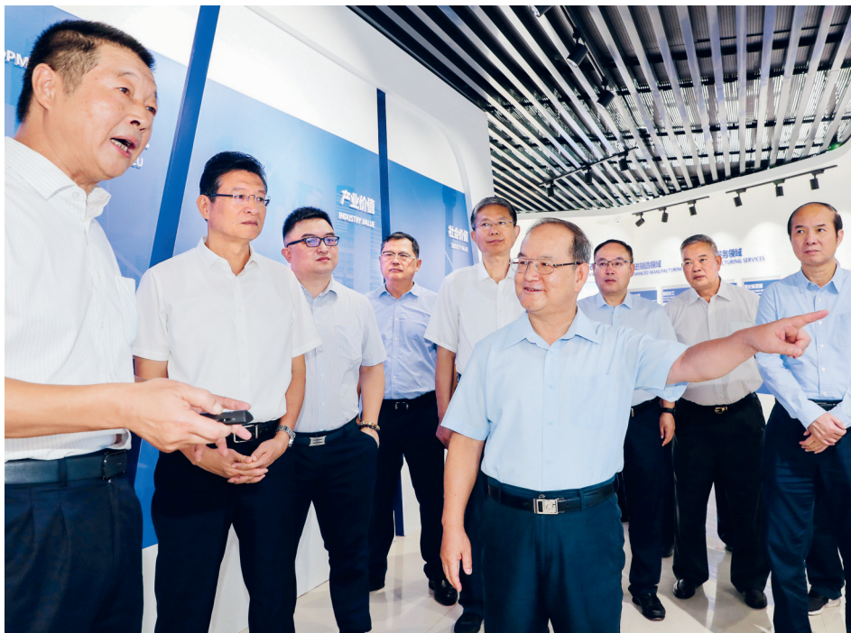
2020年8月11日至12日，自治区党委书记鹿心社（前排中）在柳州传化公路港物流有限公司考察

2020年，按照中央和自治区党委的决策部署，我们全面贯彻落实新时代党的建设总要求和新时代党的组织路线，以强化政治功能、健全组织体系、提升组织力为重点，把不忘初心、牢记使命作为加强党的建设的永恒课题和全体党员的终身课题，着力抓重点、扬特色、铸品牌，切实补短板、强弱