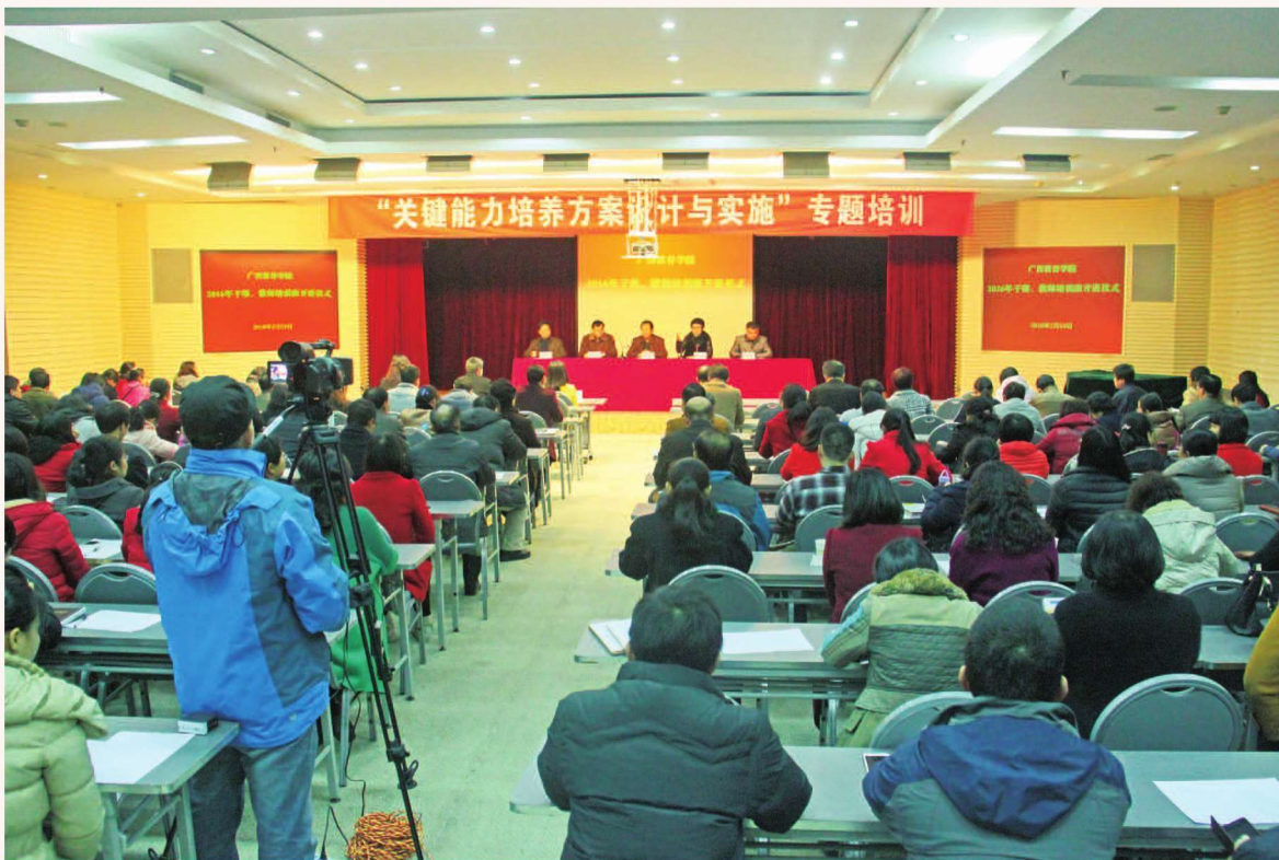
2016年2月24日, “关键能力培养方案设计”专题培训