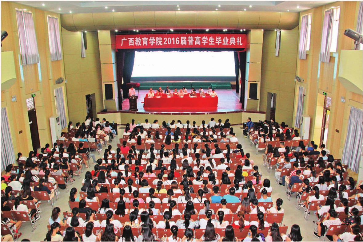
2016年6月28日，2016届普高学生毕业典礼