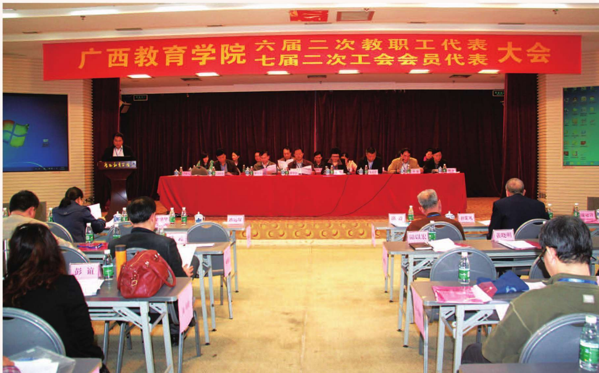
2016年4月1日，广西教育学院六届二次教代会暨七届二次工代会