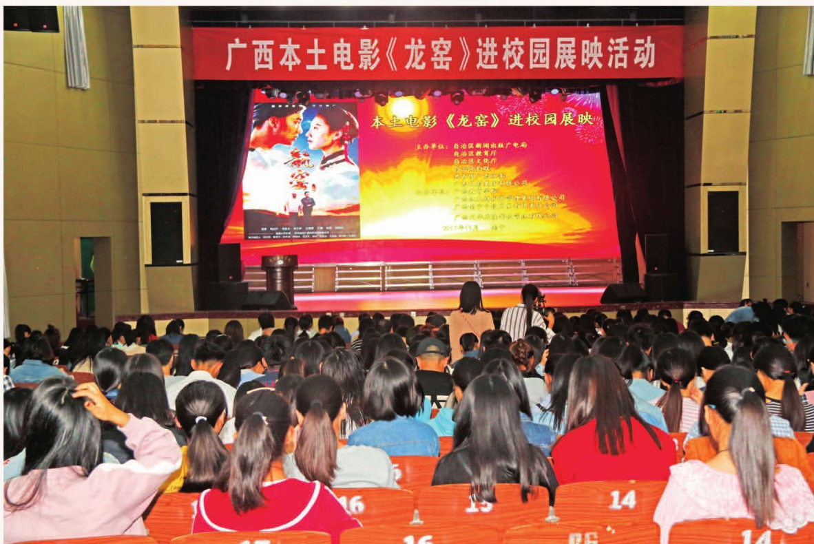
2017年11月8日，广西本土电影《龙窑》进校园展映活动