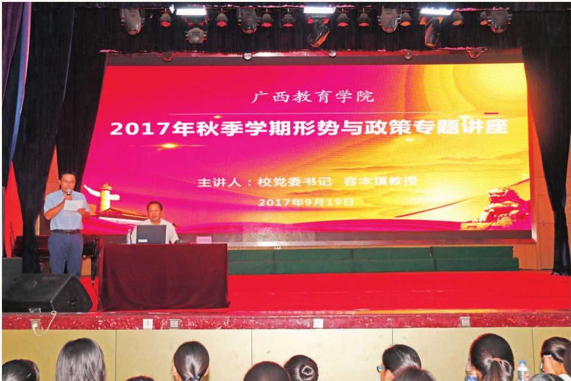
2017年9月19日，2017年秋季学期形势与政治专题讲座