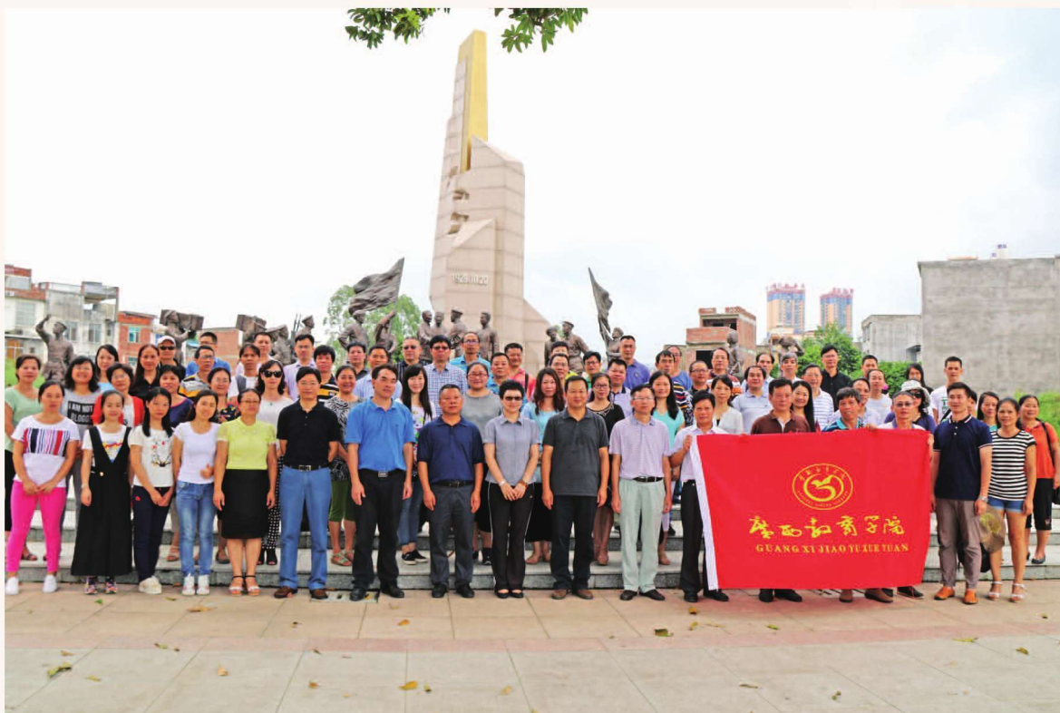
2016年8月27日，“两学一做”学习教育专题培训班