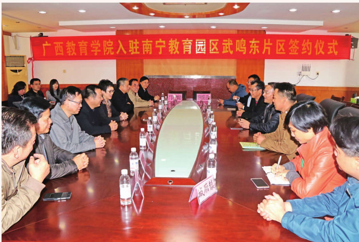
2016年11月28日，广西教育学院入驻南宁教育园区武鸣东片区签约仪式