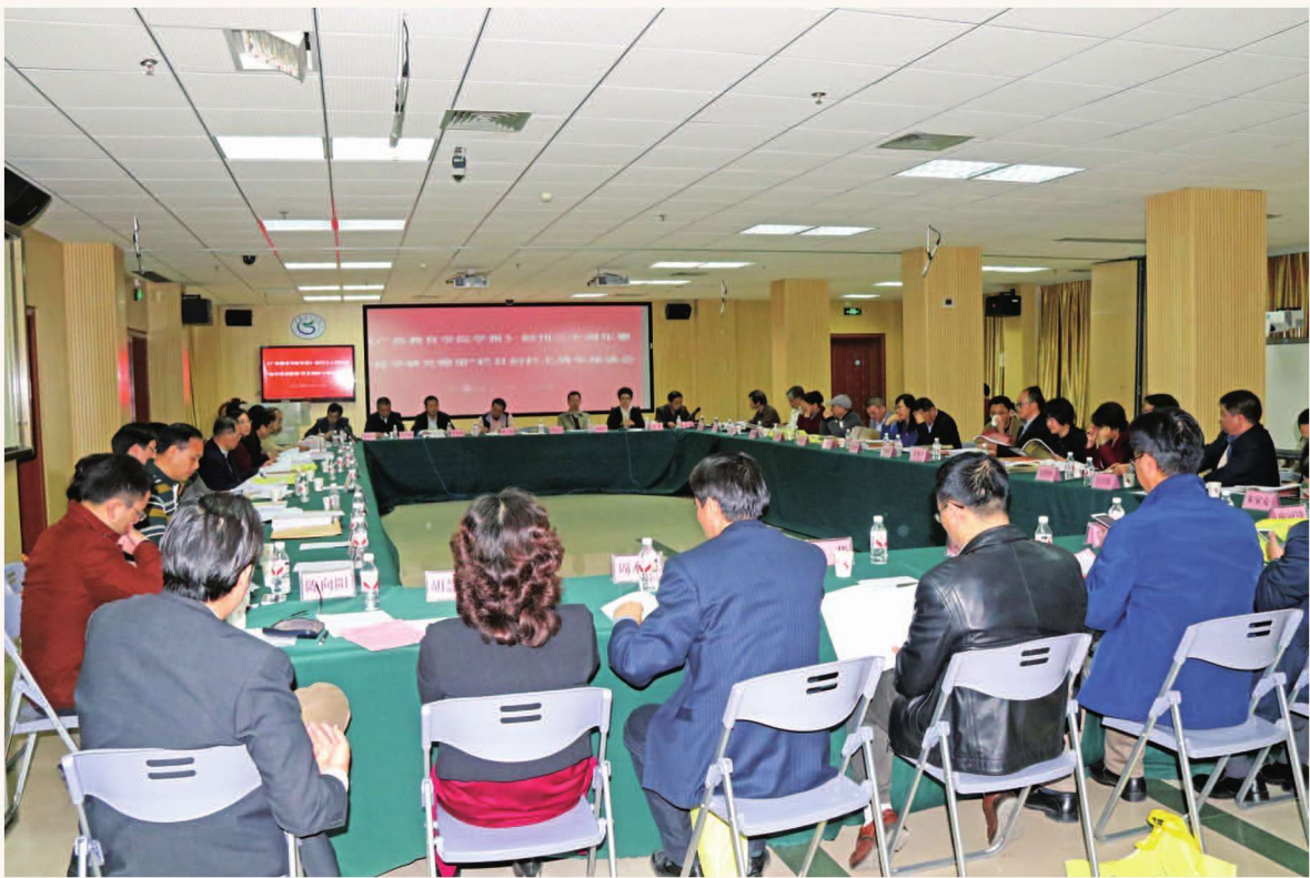
2016年12月22日，广西教育学院召开《广西教育学院学报》创刊30周年暨“桂学研究瞭望”栏目创栏七周年座谈会