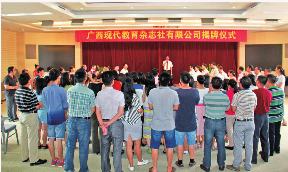
2016年6月20日，广西现代教育杂志社有限公司揭牌仪式