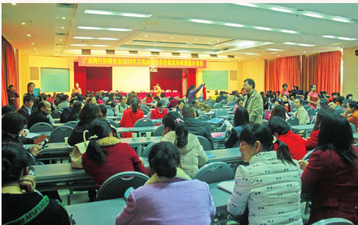
2016年3月17日，广西陶行知研究会2016年工作会议