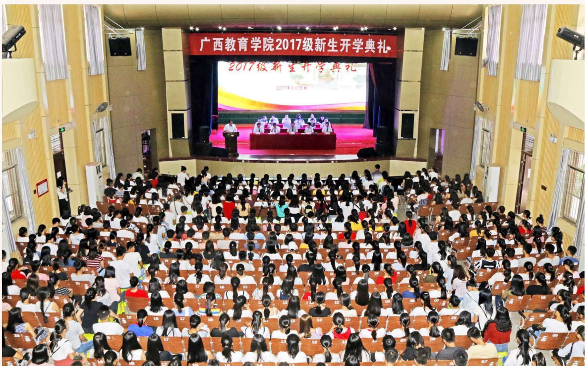
2017年9月15日，广西教育学院举行2017级新生开学典礼