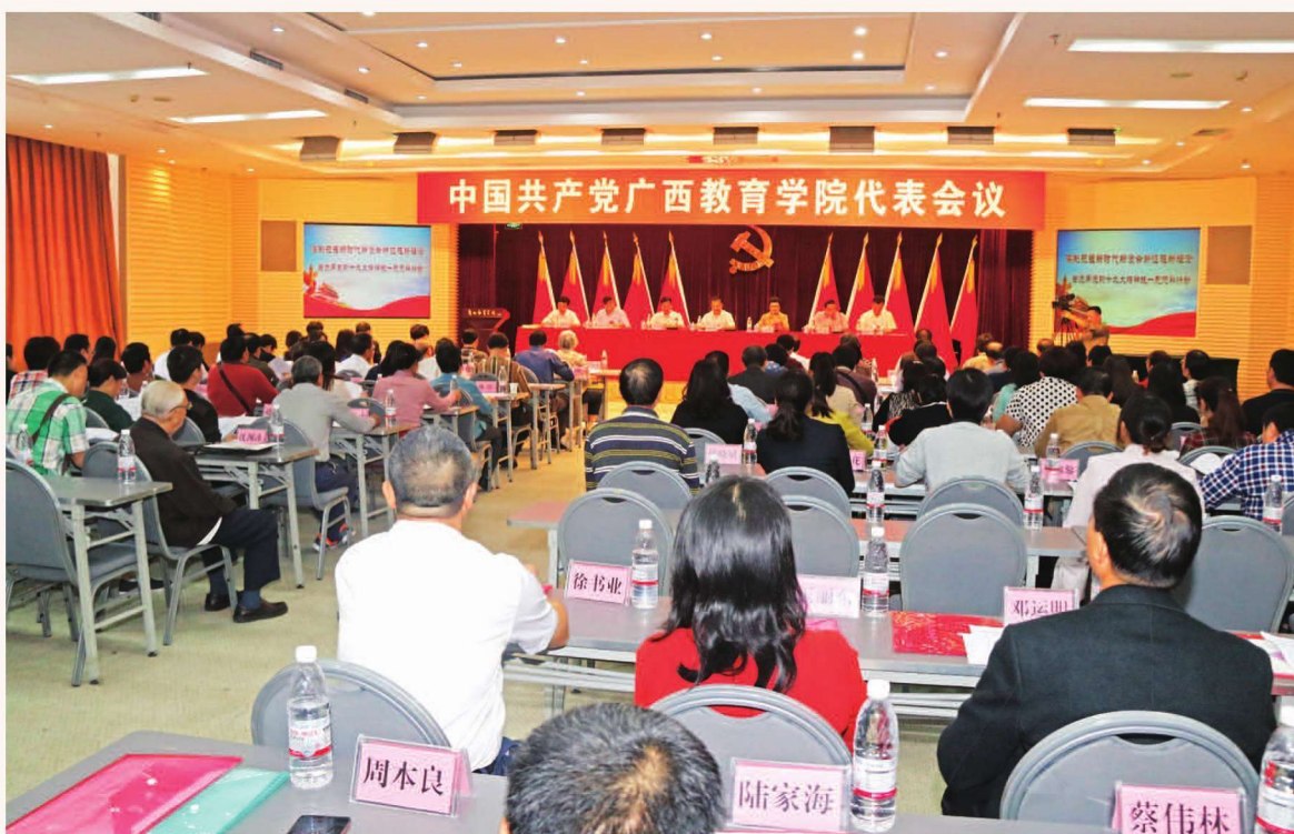
2017年11月15日，中国共产党广西教育学院代表会议