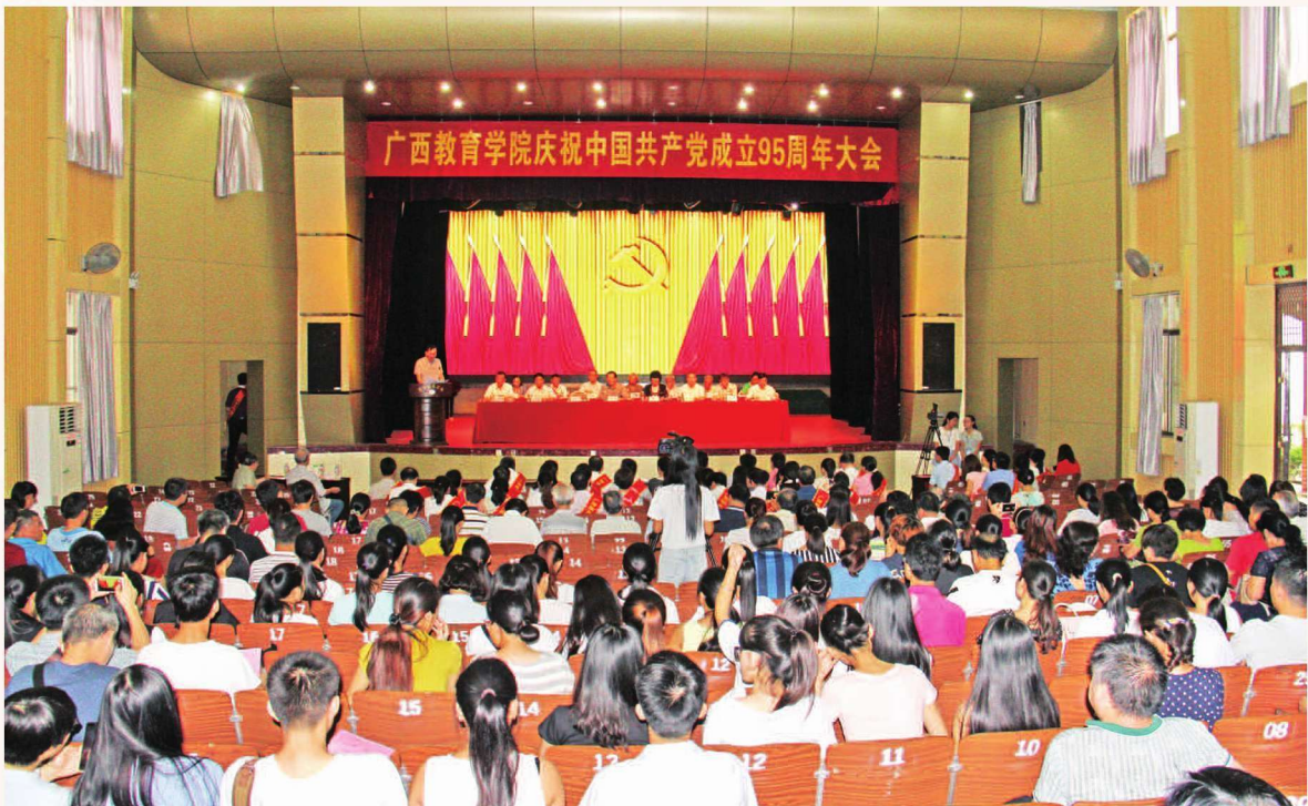
2016年6月30日，广西教育学院庆祝中国共产党成立95周年大会