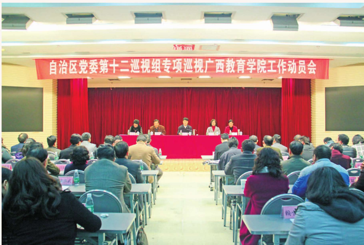
2016年2月24日，自治区党委第十二巡视组专项巡视广西教育学院工作动员会