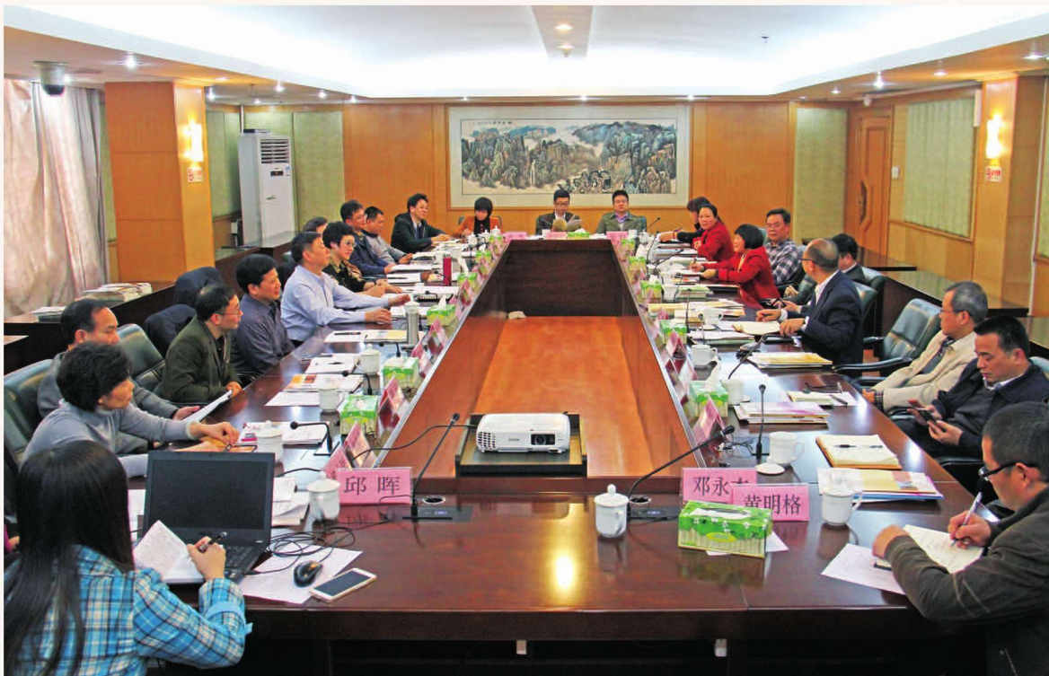
2016年1月7日, 2016年社会服务洽谈会(贵港)