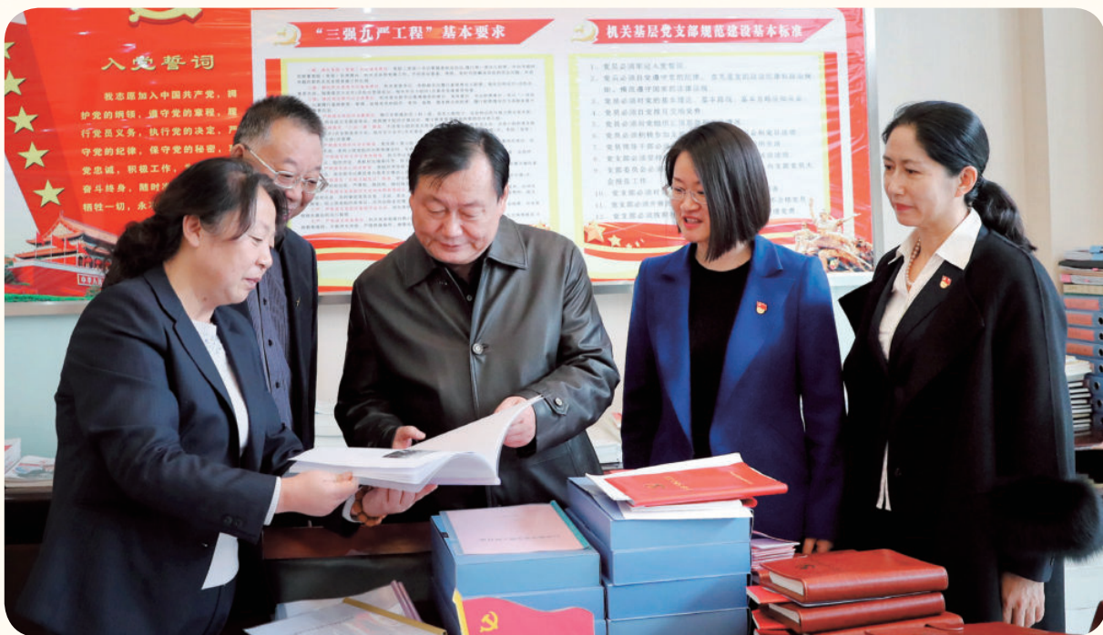
2018年11月28日，国家税务总局宁夏回族自治区税务局党委书记、副局长马建民（中）在宁夏税务干部学校调研党建工作。