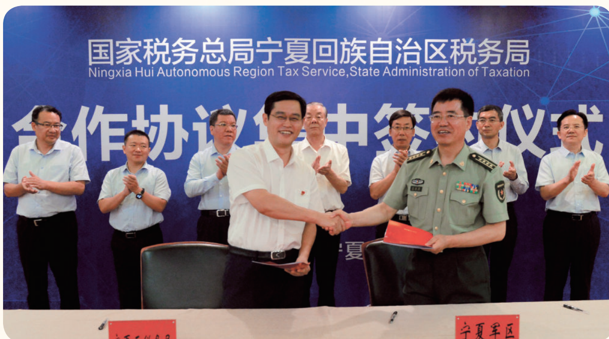
2018年8月2日，国家税务总局宁夏回族自治区税务局联合党委副书记、局长郑文敏（前排左）出席协议集中签约仪式，并代表国家税务总局宁夏回族自治区税务局分别与相关单位签订银税战略合作、税收遵从合作、宁夏境外投资企业合作、军税共建合作等协议。