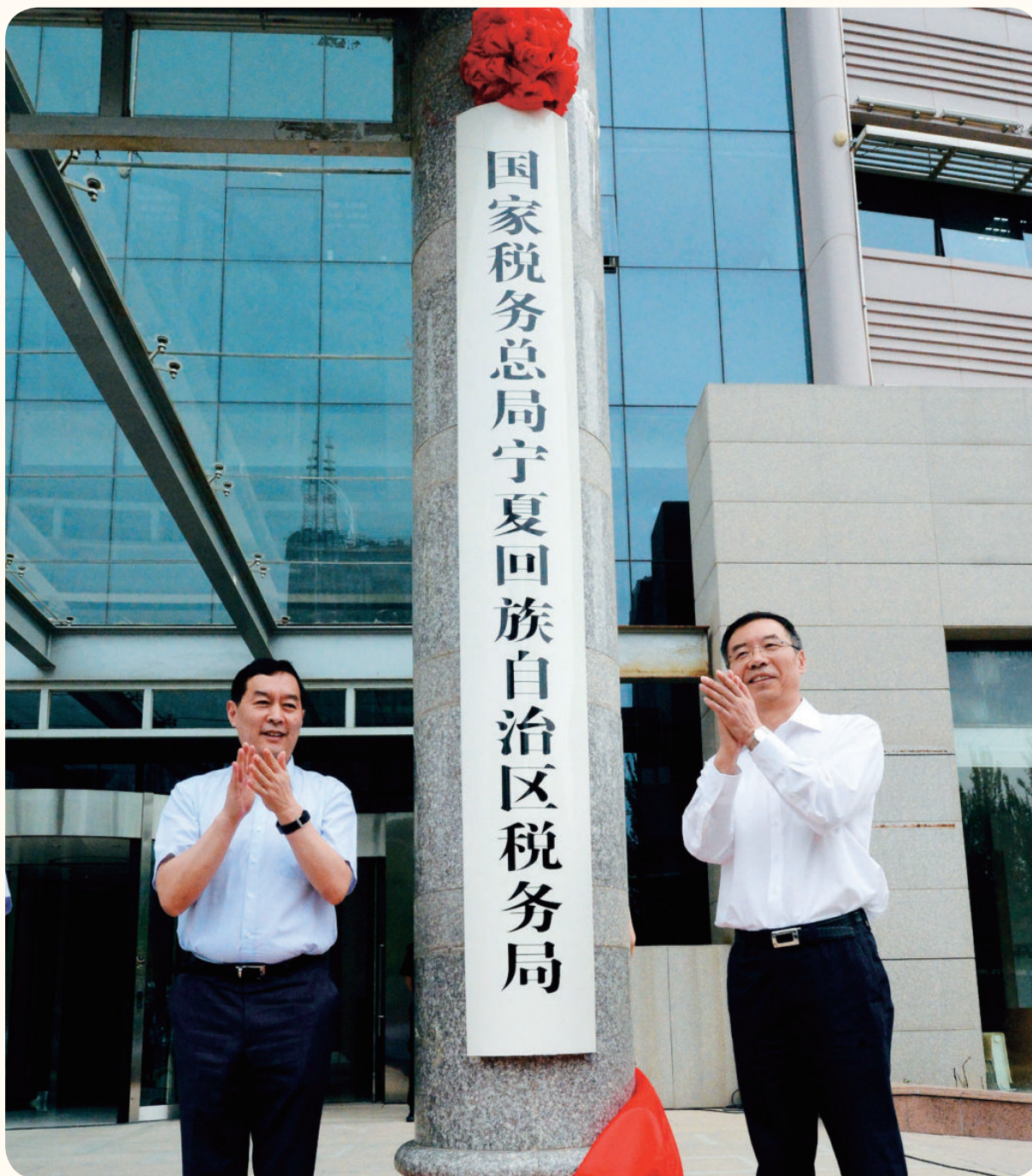
2018年6月15日，自治区党委常委、常务副主席张超超（左）与国家税务总局第30联络（督导）组常务副组长杨峰（右）共同为国家税务总局宁夏回族自治区税务局揭牌。