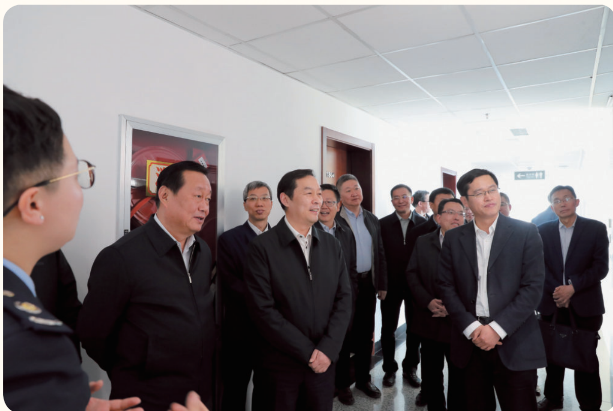
2018年11月22日，自治区党委常委、常务副主席张超超（前排中）在银川市税务局调研指导税收工作。