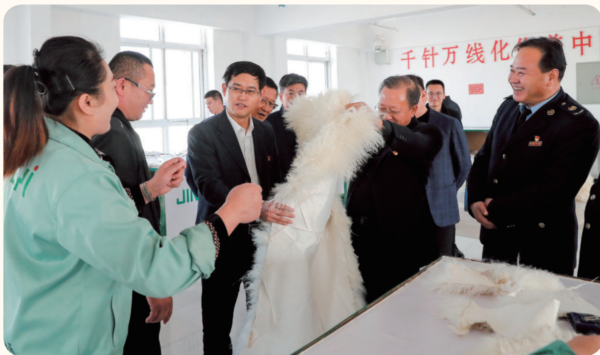
2018年11月28日，国家税务总局宁夏回族自治区税务局党委副书记、局长郑文敏（左三）在吴忠市利通区调研民营企业生产经营情况。