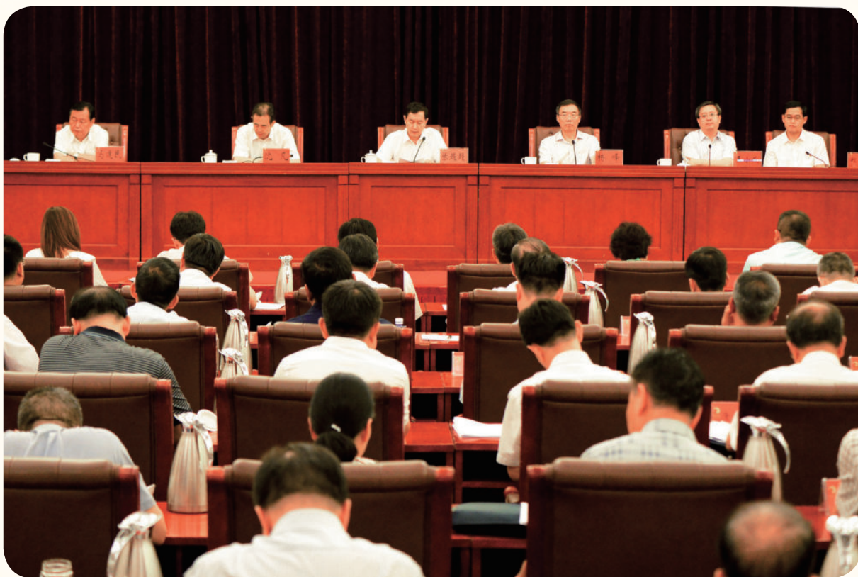
2018年6月30日，全区国税地税征管体制改革座谈会在银川召开，自治区党委常委、常务副主席张超超（正排左三）出席会议并讲话。