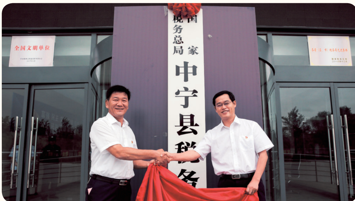
2018年7月20日，国家税务总局宁夏回族自治区税务局联合党委副书记、局长郑文敏（右）出席国家税务总局中宁县税务局挂牌仪式。