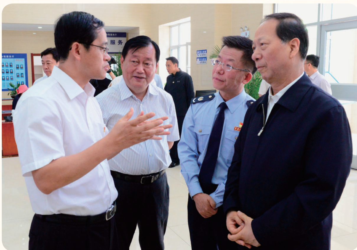
2018年5月24日，自治区党委书记石泰峰（右一）在银川市兴庆区税务局办税服务厅调研指导税收工作。