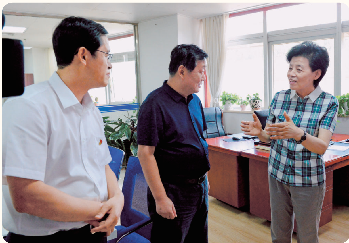
2018年7月9日，自治区主席咸辉（右一）在宁夏回族自治区税务局调研国税地税征管体制改革工作。