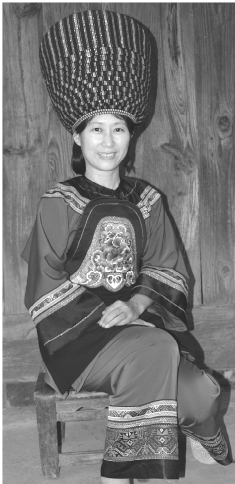
图 1-1-1 松桃苗族服饰

《红苗归流图》记载：其服饰，皆短衣窄袖，绔止蔽膝，用红布为裹里以束腰，衣领亦饰以红。妇人无约，止以裙蔽下体。虽隆冬御寒，男女止单衣