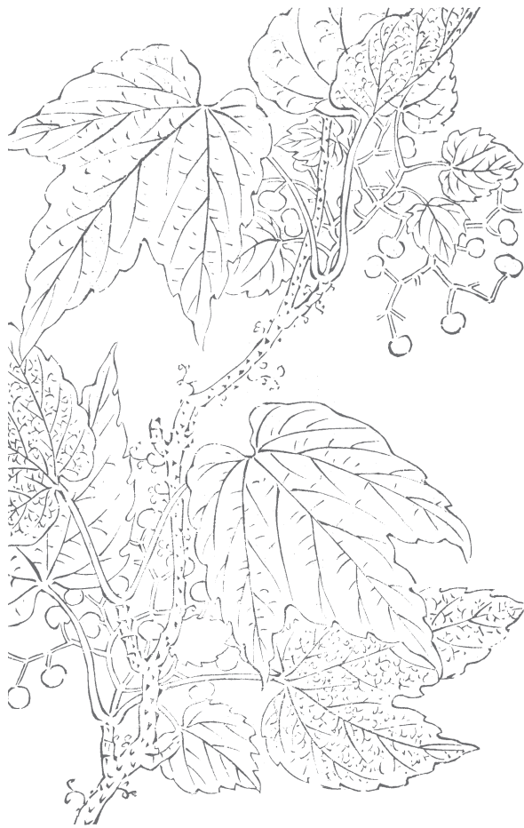
图 951 常春藤

松村、《中志》48（2）：21 和《纲要》： Parthenocissus tricuspidata (Sieb. et Zucc.) Planch.。 吴批：日人释为 Hedera 。