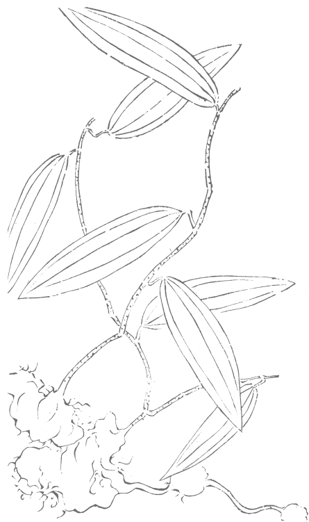
图 949 土茯苓

《长编》卷十收土茯苓主要文献。吴其濬没有对土茯苓加以新的性状描述，《图考》图为新绘（图 949）。绘图显示一攀援藤木；根状茎粗厚，块状；枝条光滑，无刺；叶互生，狭椭圆状披针先端渐尖，三出脉，全缘，具叶柄。上述性状，确属百合科菝葜属 Smilax 植物。其中块状根状茎，无刺，及叶形，较合《中志》15：212 描述的百合科菝葜属植物土茯苓 Smilax glabra Roxb. 的特征。该种在我国产于甘肃（南部）和长江流域以南各省区，直到台湾、海南和云南，生于海拔 1 800 米以下的林中、灌丛下、河岸或山谷中，也见于林缘与疏林中。其粗厚的根状茎入药，称土茯苓，性甘平，利湿热解毒，健脾胃，且富含淀粉，可