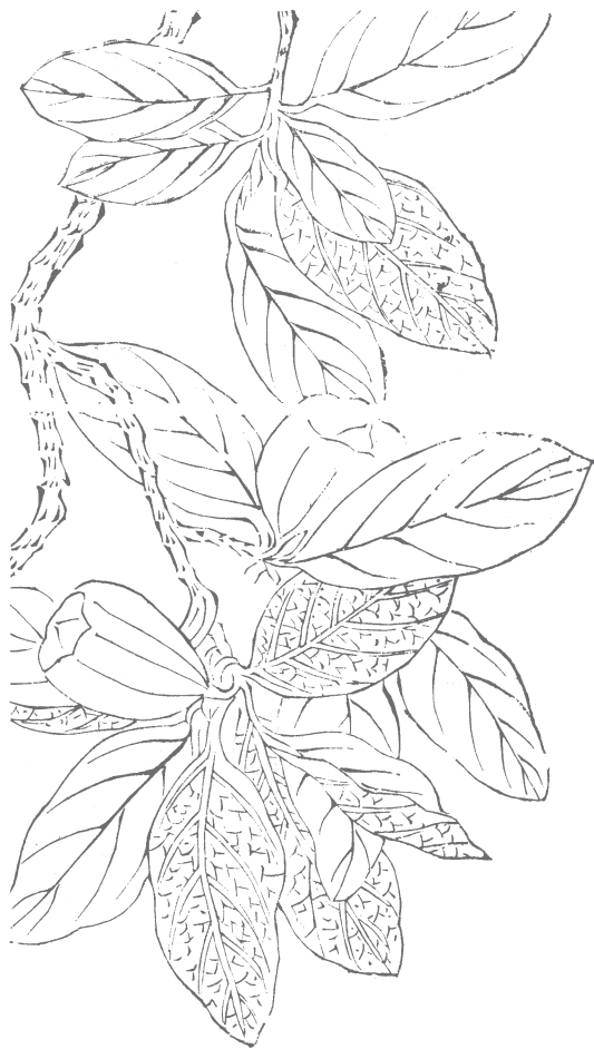
图 950 木莲