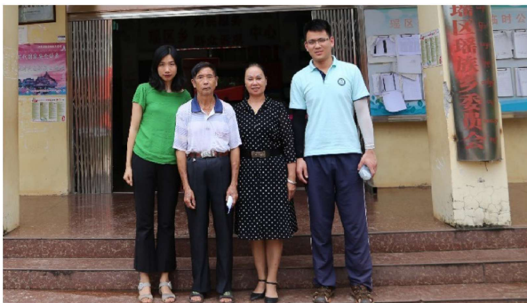
调查组成员与访谈对象在中国西双版纳州勐腊县瑶区瑶族乡人民政府前合影