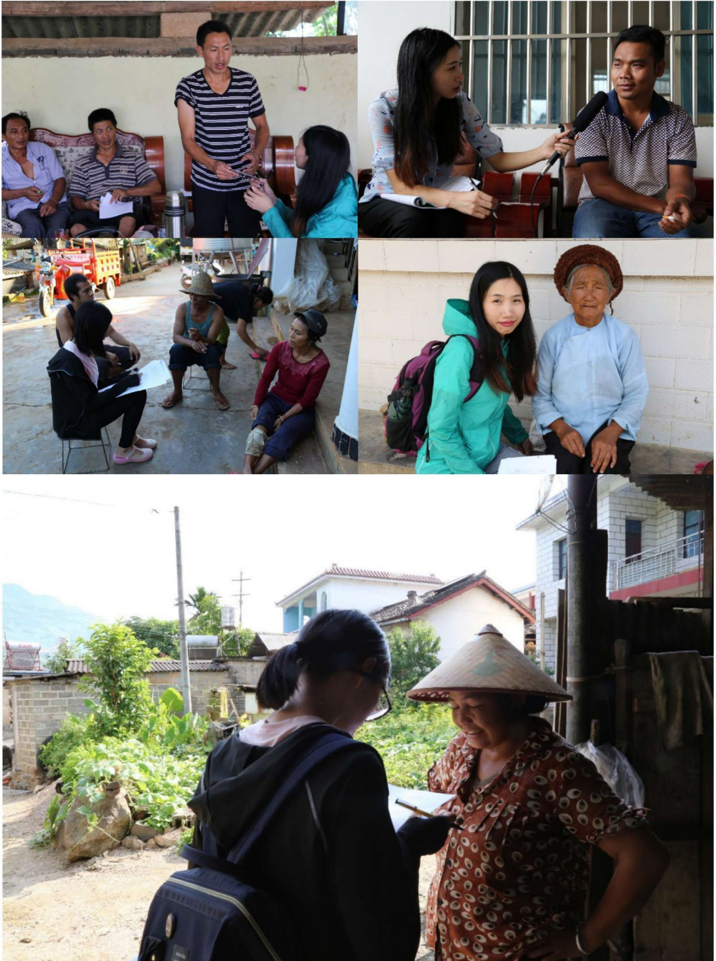
调查小组向中国云南省镇康县调查点村民调查语言情况