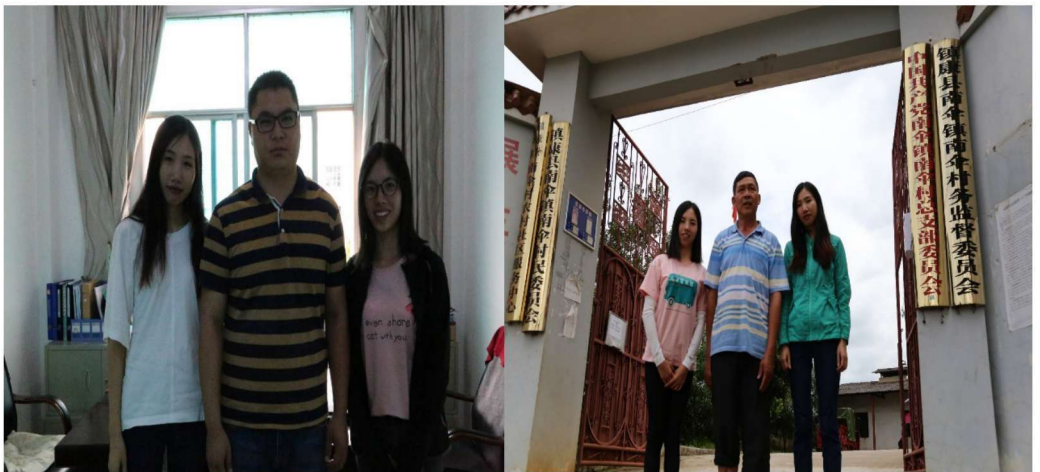
调查小组与中国云南省镇康县部分乡镇、村委会干部合影