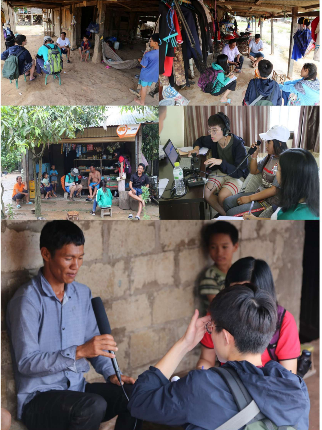
调查小组向老挝勐醒县各族群村民了解语言情况