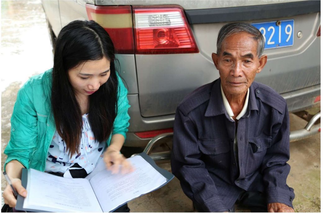
调查小组向在中国云南省镇康县的缅甸果敢人了解果敢语言情况