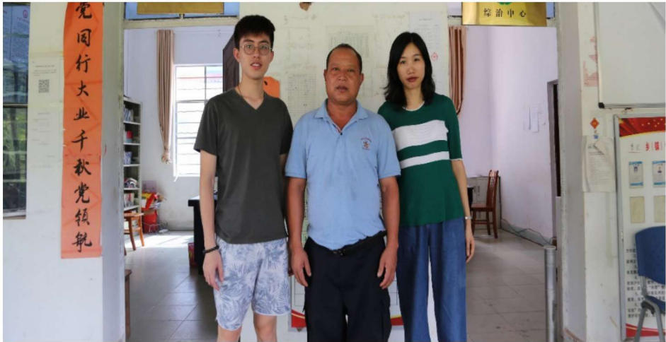
调查小组与缅甸果敢自治区易武镇曼腊村村委会干部合影