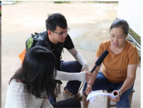
调查小组调查中国西双版纳州勐腊农场湖南籍村民的语言情况