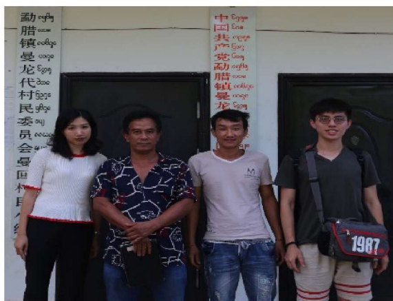
调查小组与中国西双版纳州勐腊镇曼代龙村等村委会干部合影