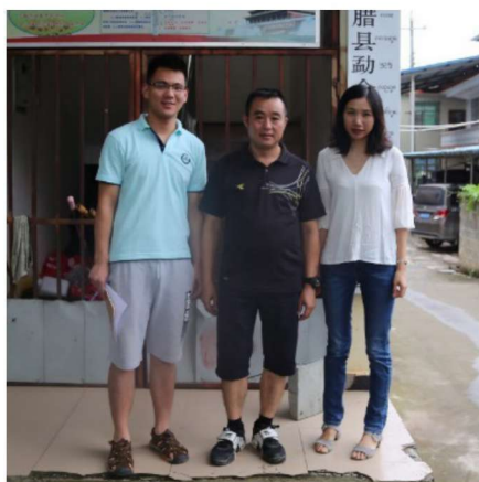
调查小组与缅甸果敢自治区勐仑镇曼边村委会干部合影