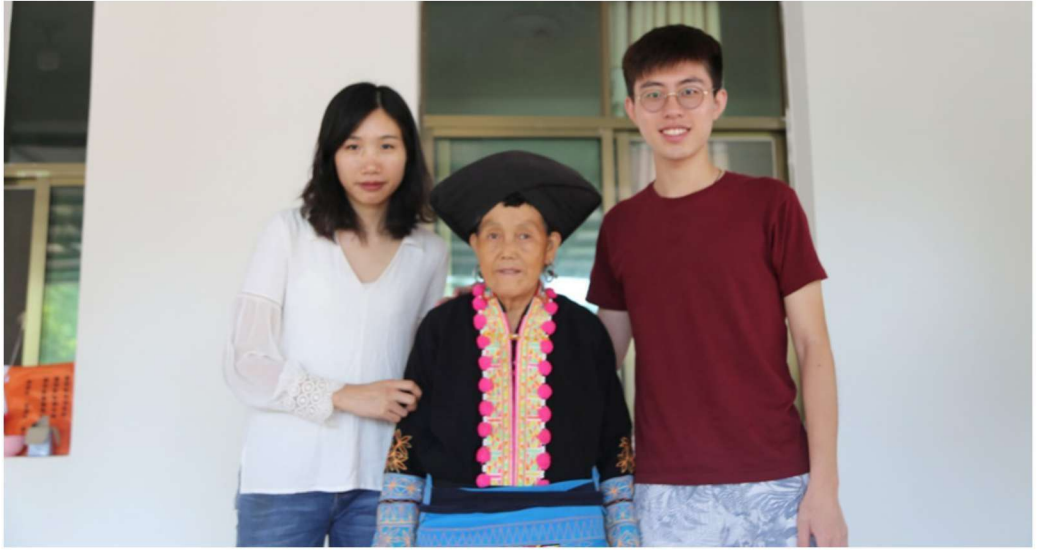
调查小组与中国西双版纳州勐腊县身着传统服饰的瑶族村民合影