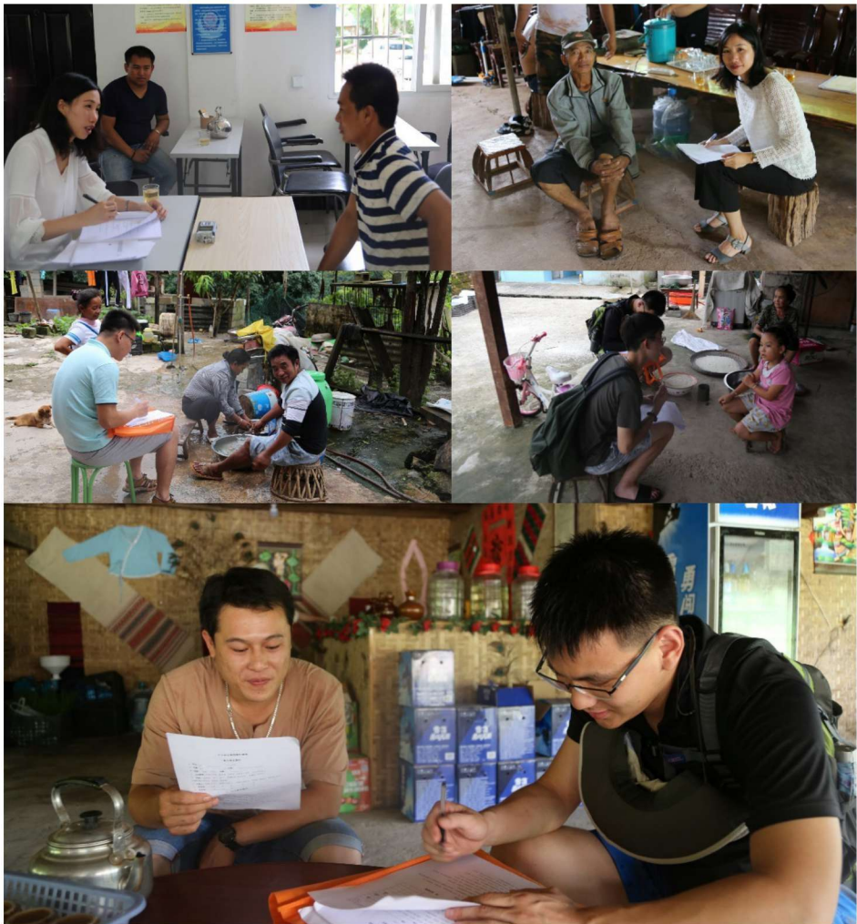
调查小组成员向中国西双版纳州勐腊县各族村民了解他们的语言使用情况