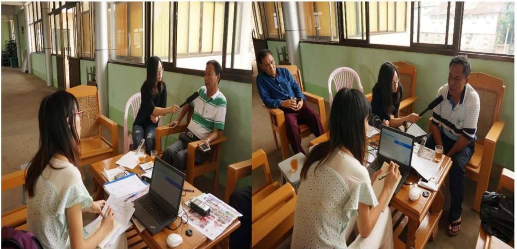
调查小组向缅甸曼德勒果敢民族文化会的干部调查果敢话的情况