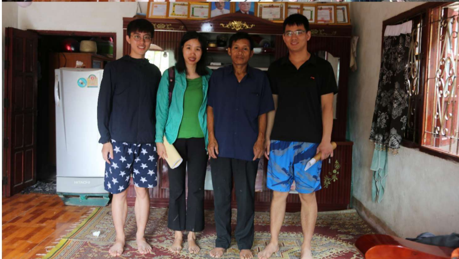
调查小组与老挝勐醒县各调查村寨的村长合影