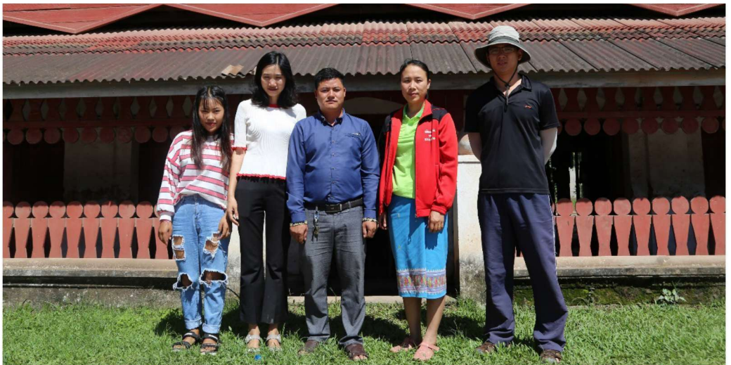
调查小组与老挝勐醒县文化旅游局干部合影