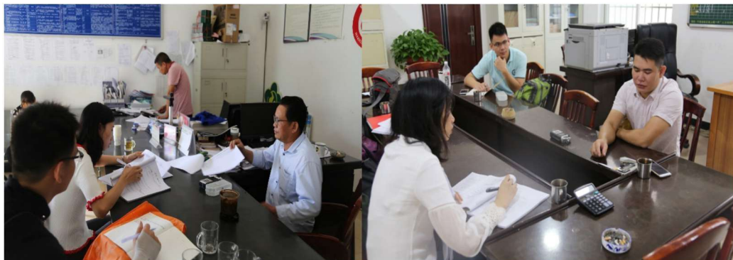
调查组成员在中国西双版纳州勐腊县部分乡镇政府了解语言情况