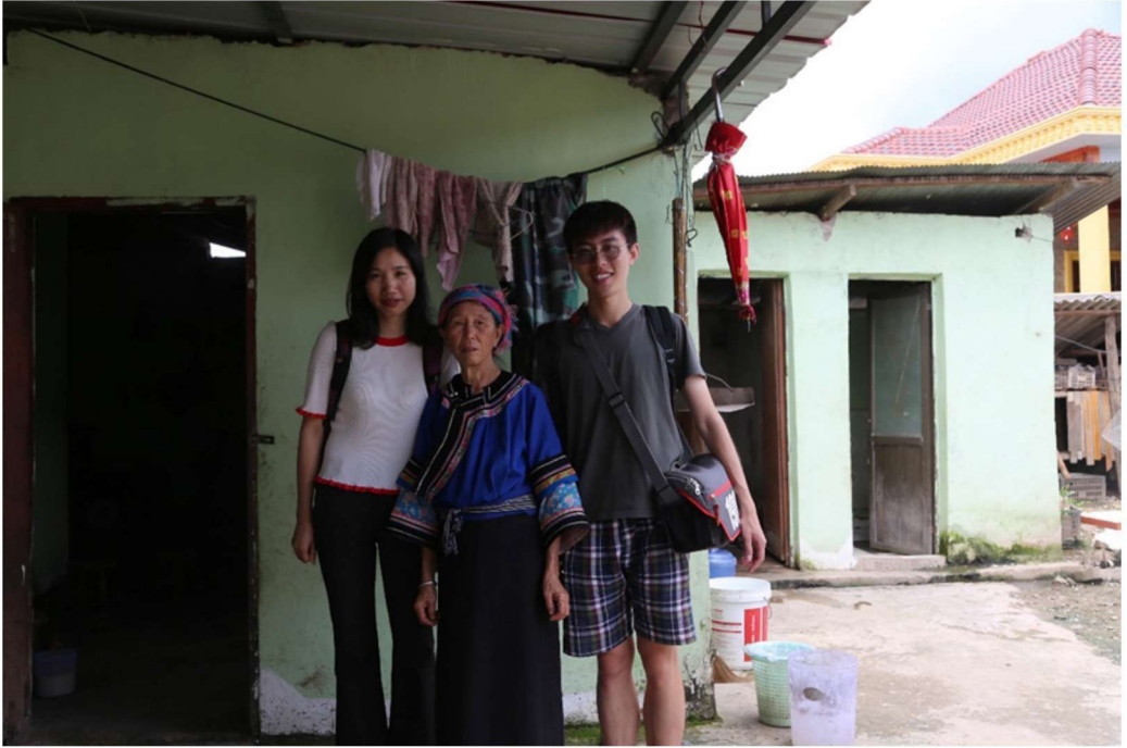
调查小组与老挝勐醒县身着传统服饰的贺族（汉族）村民合影