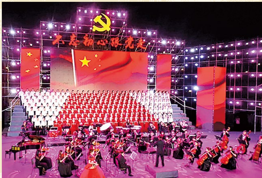
庆祝中国共产党成立 97 周年合唱比赛