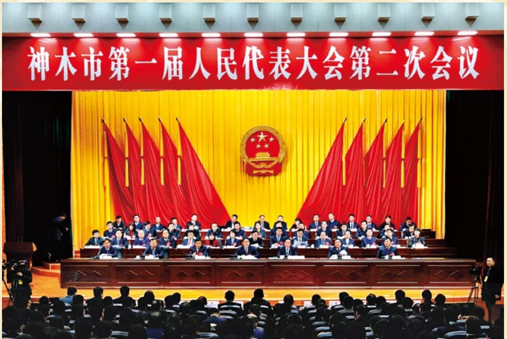
神木市第一届人民代表大会第二次会议