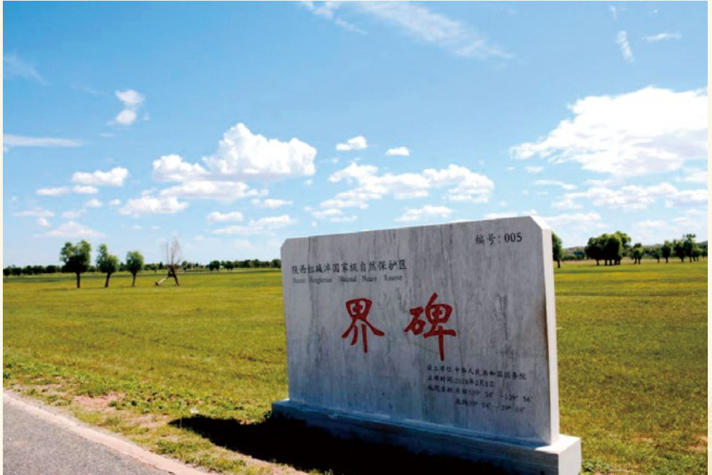
红碱滩被审定为国家级自然保护区