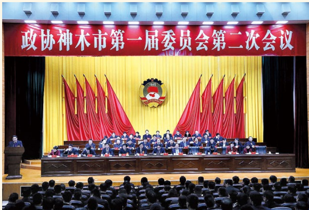
政协神木市第一届委员会第二次会议