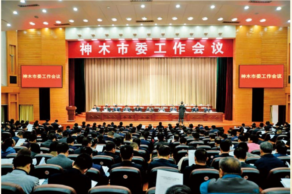
神木市委工作会议