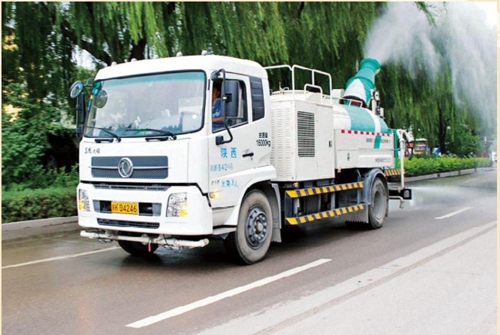
降尘喷雾车正在作业