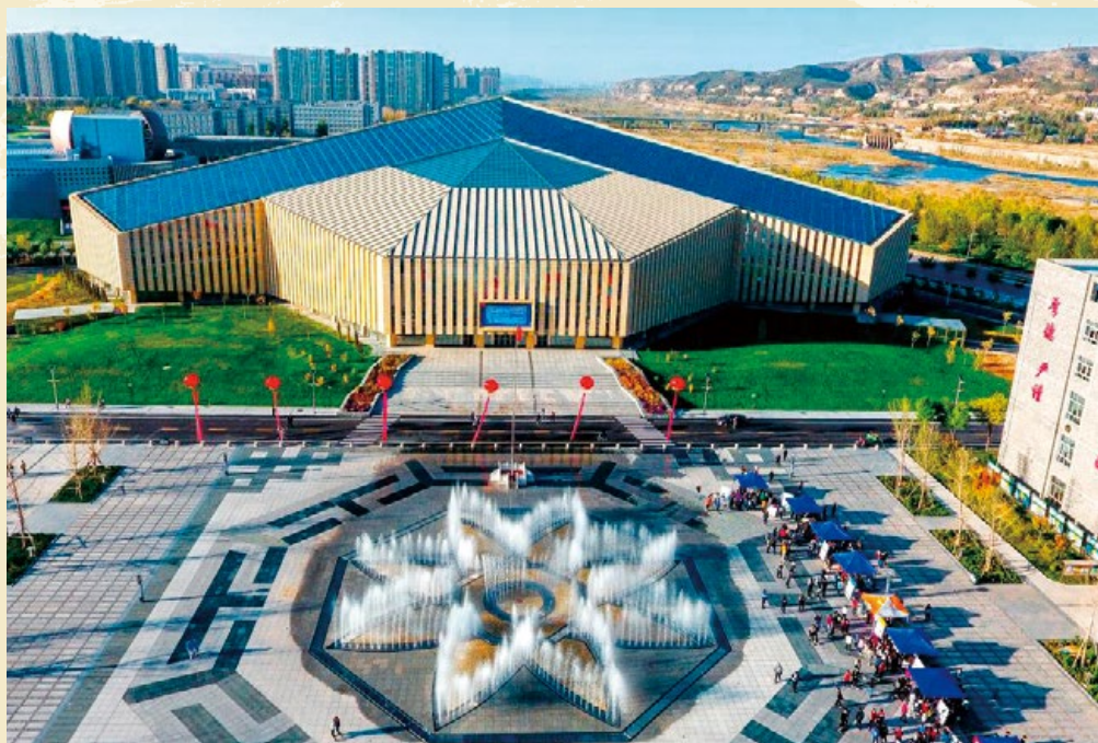
神木职业技术学院实现独立办学