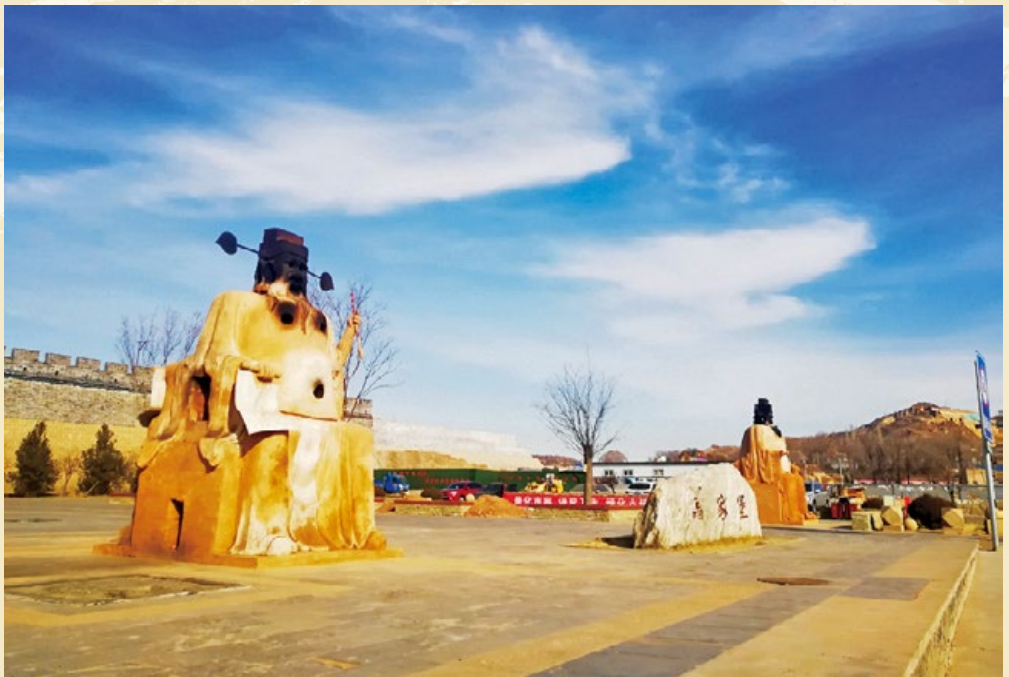
神木火判官被列入陕西省第六批非物质文化遗产名录