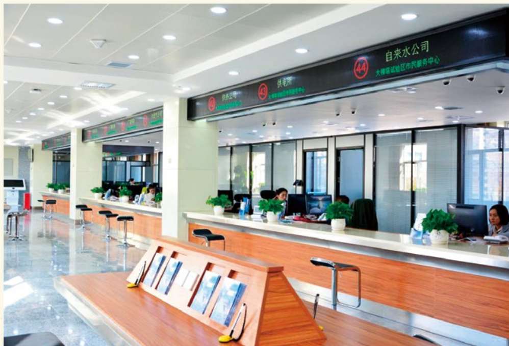
大柳塔市民服务中心