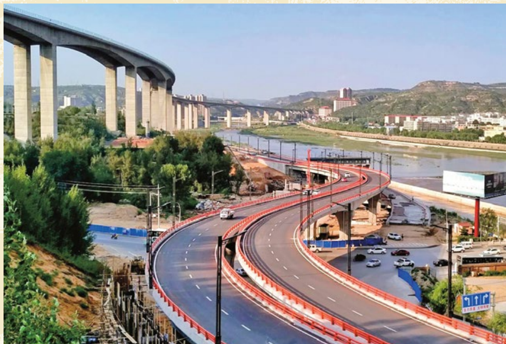
滨河西路至五龙口段建成通车