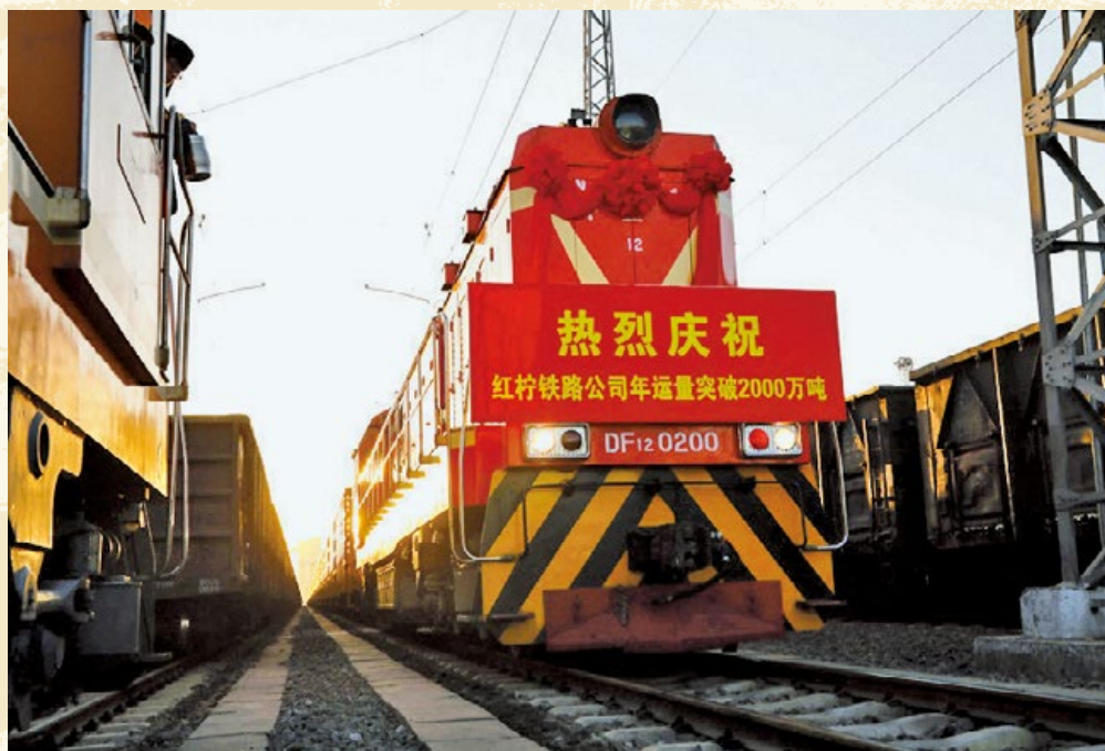
红柠铁路公司年运量突破 2000 万吨