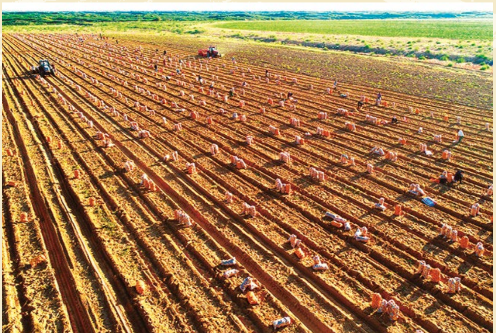
机械化收割马铃薯