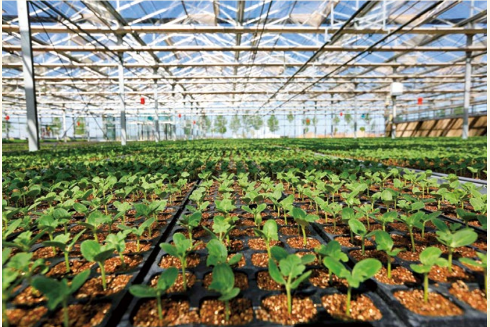
现代特色农业示范园