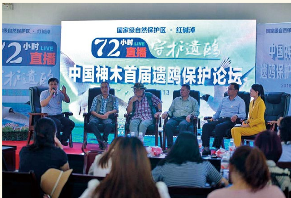
中国神木首届遗鸥保护论坛在红碱淖自然保护区举行