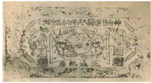
神府特区抗日人民革命委员会银行印制的钞票