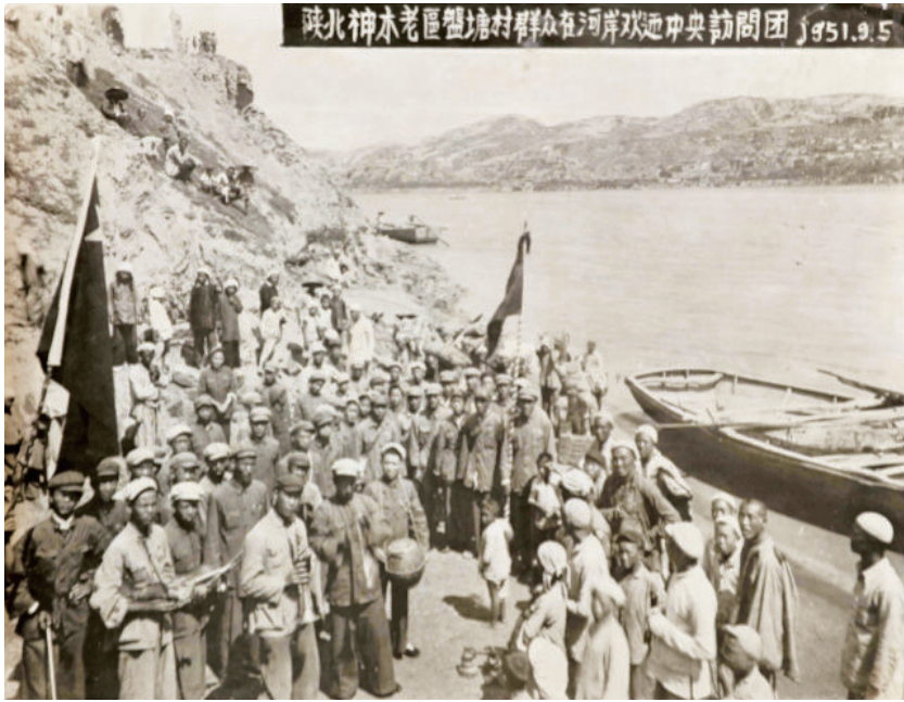
1951年9月5日，盘塘村村民欢迎中央访问团