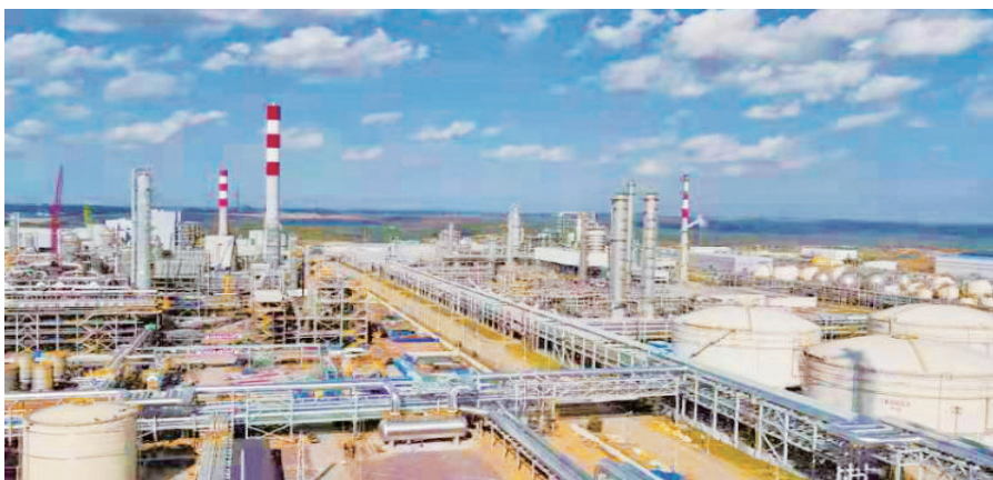
榆林经济开发区一角（大保当）