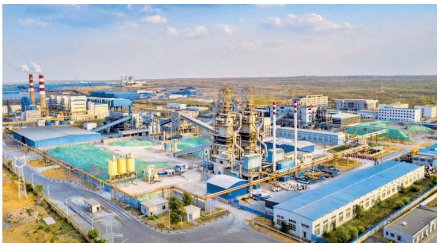
燕家塔工业园区一角