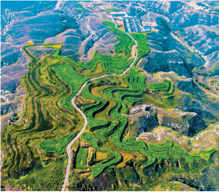
花石崖镇高兴庄村宽幅梯田