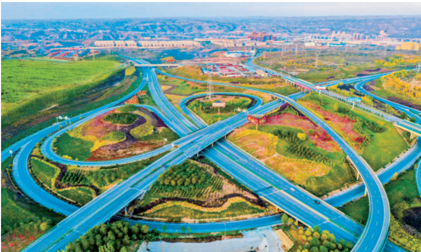
高速公路互通立交（神木进出口）