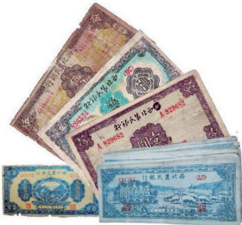
洪涛印刷厂印制的西北农民银行纸币