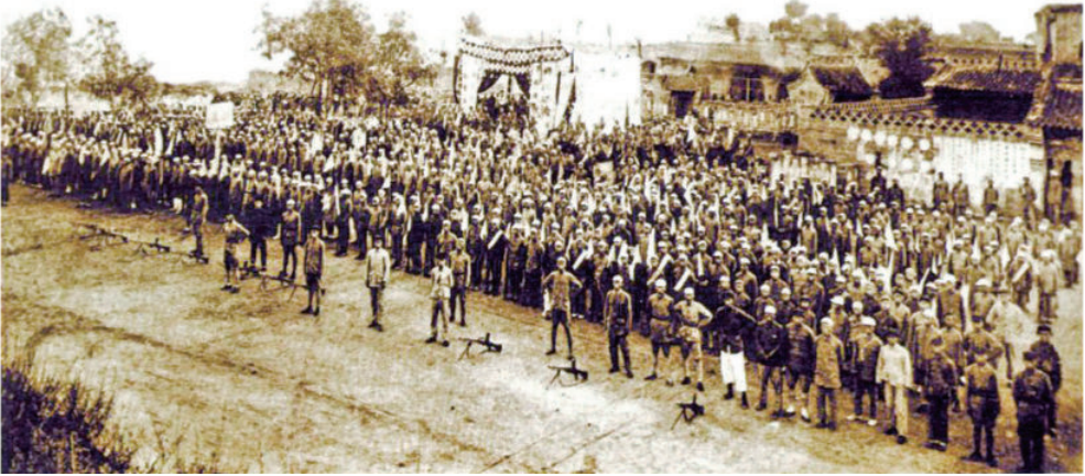
1937年8月1日，在神木县王桑塔村召开庆祝独立师成立一周年暨华北抗日后援大会