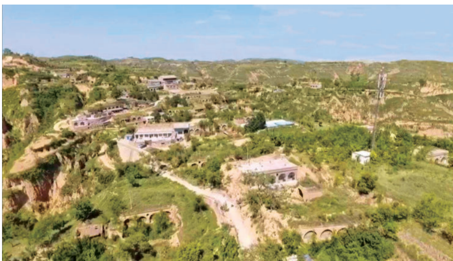
1935年9月18日，红三支队在沙峁王家庄改编为中国工农红军陕北独立师第三团，同时成立神木县革命委员会