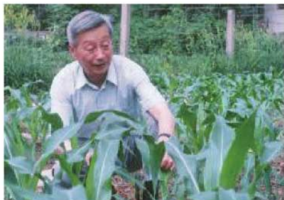
中科院西北生物所研究员、院士山仑在田间观察