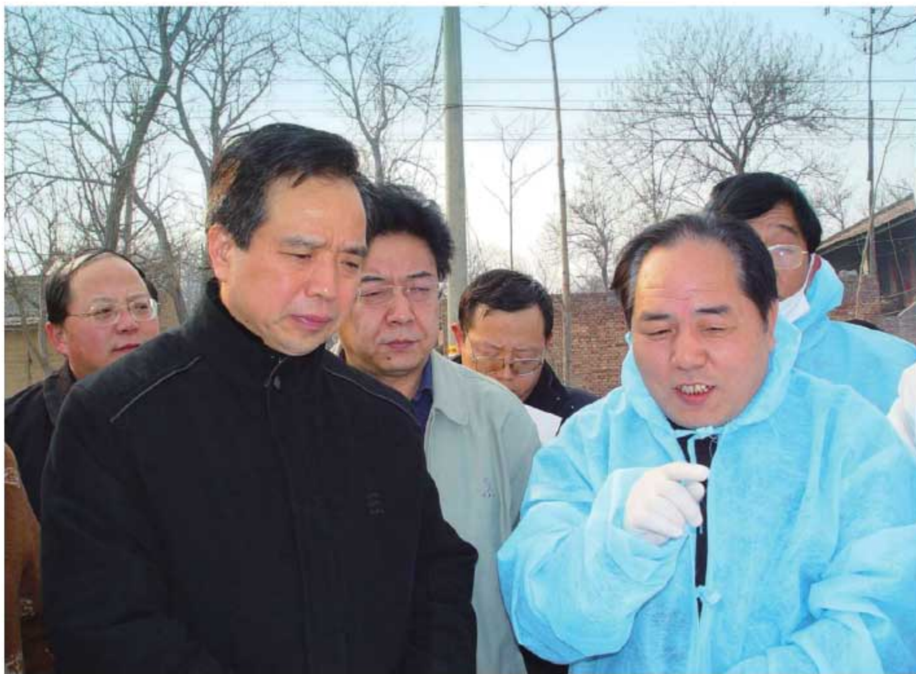
2004年2月4日，省委书记李建国（前左一）在华阴市检查禽流感疫情防控