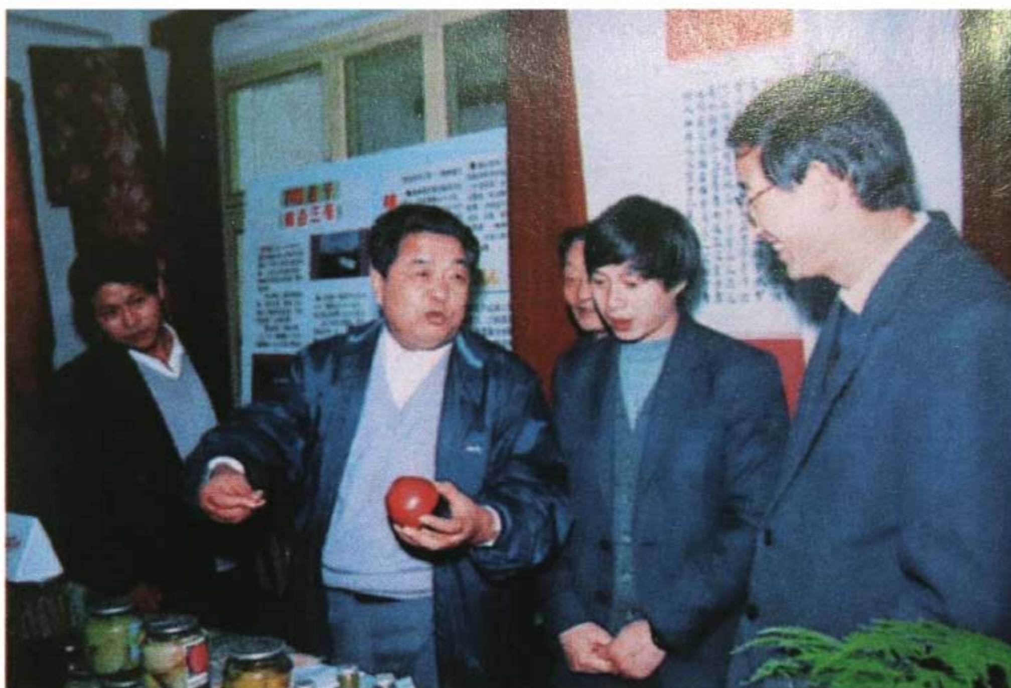
1993年3月9日，副省长王双锡（左二）参观省农科院研究成果展览