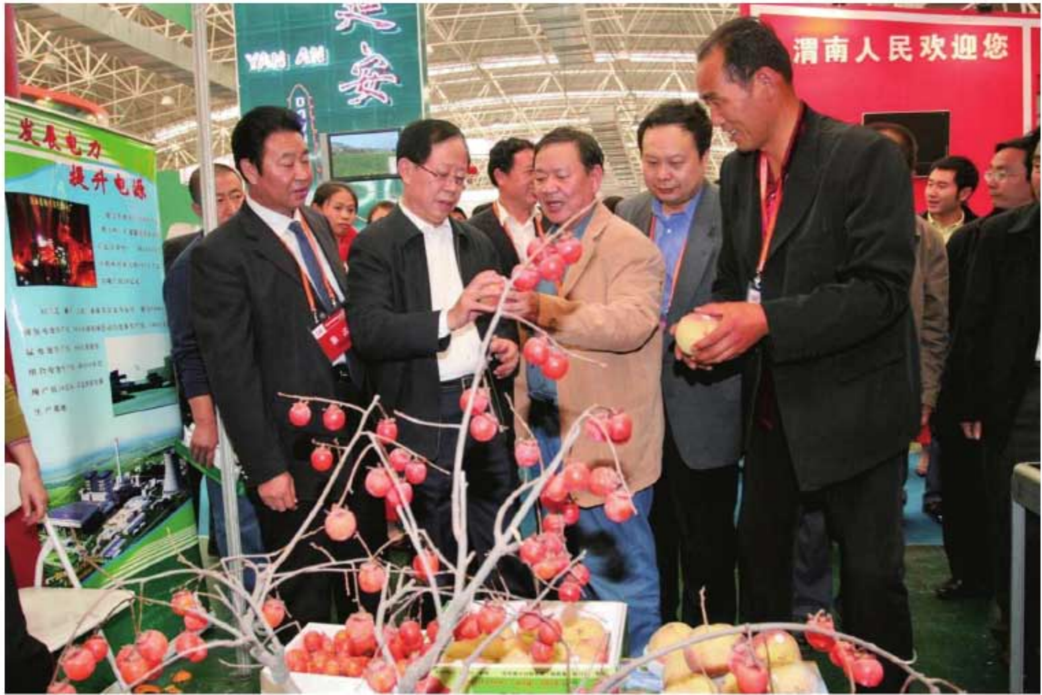
2006年11月5日，农业部副部长危朝安（前左二）参观杨凌农高会展览