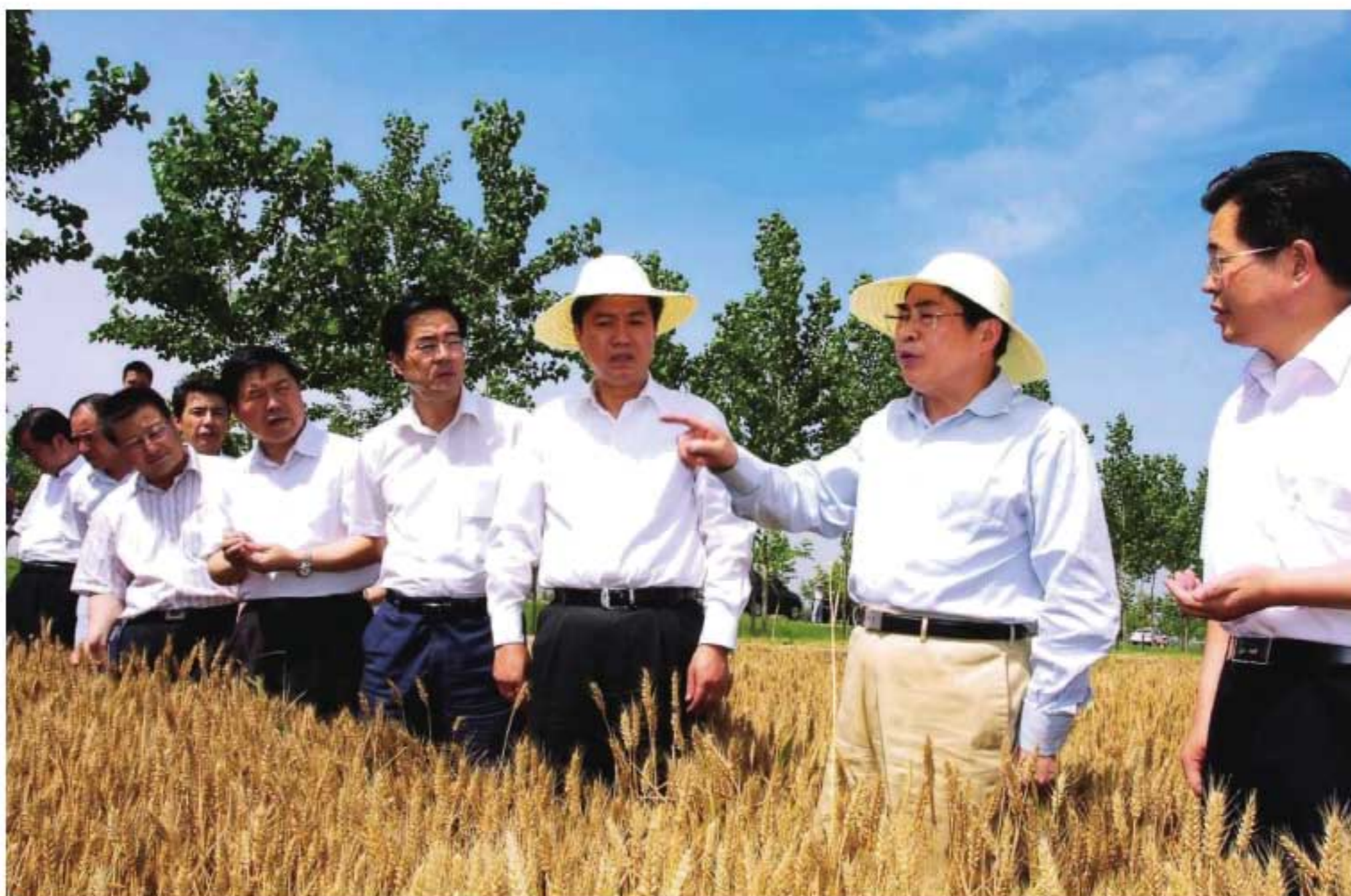
2009年6月1日，省长袁纯清（右二）在三原县考察小麦生产