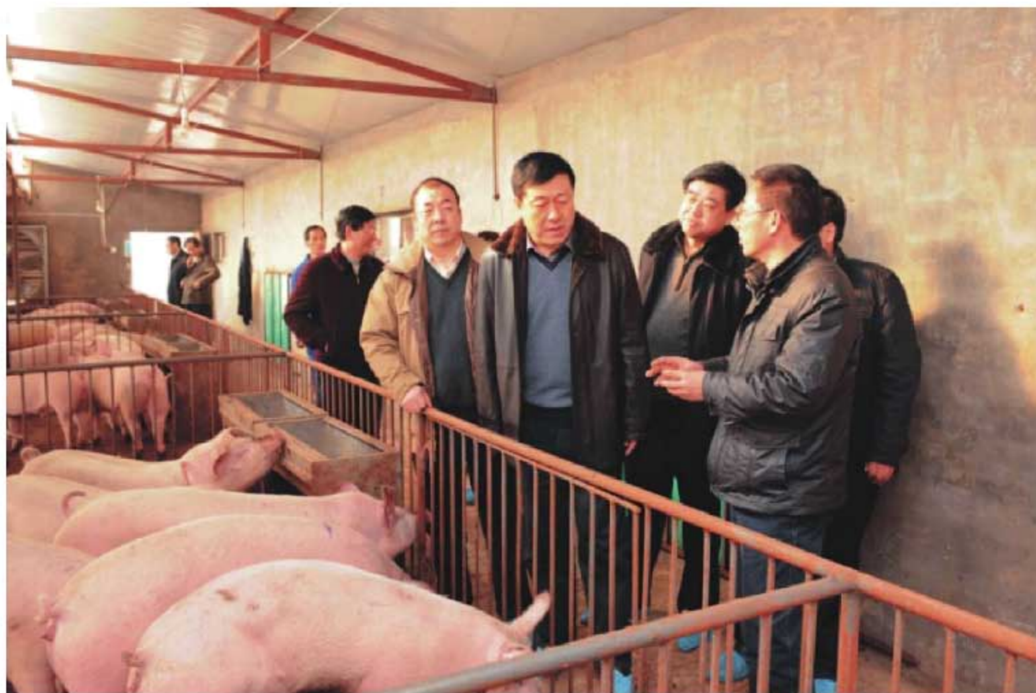
2010年1月24日，农业部国家首席兽医师于康震（右三）在陕西调研畜禽疫病防控