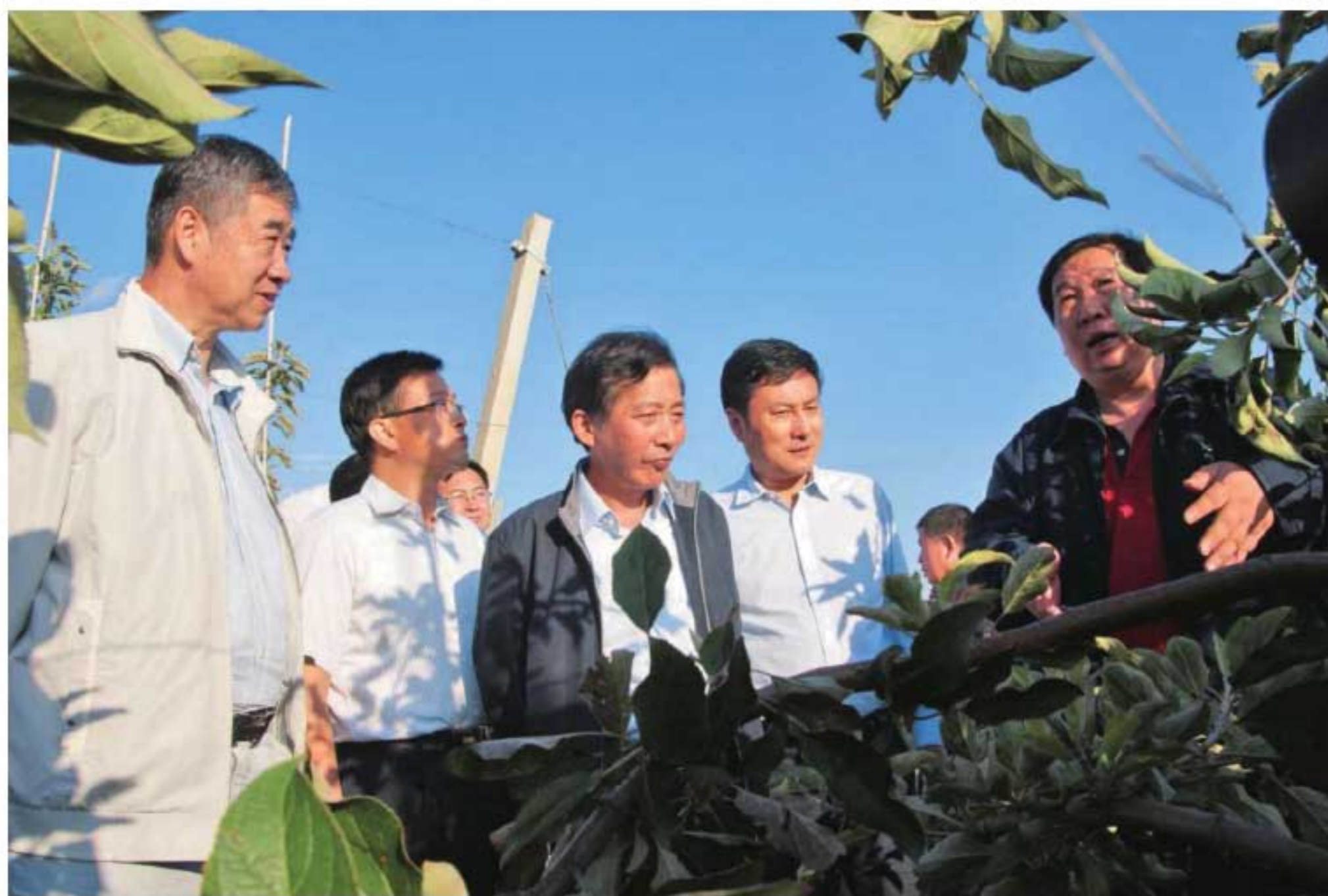
2015年9月22日，农业部副部长陈晓华（中）在陕西调研农业农村工作