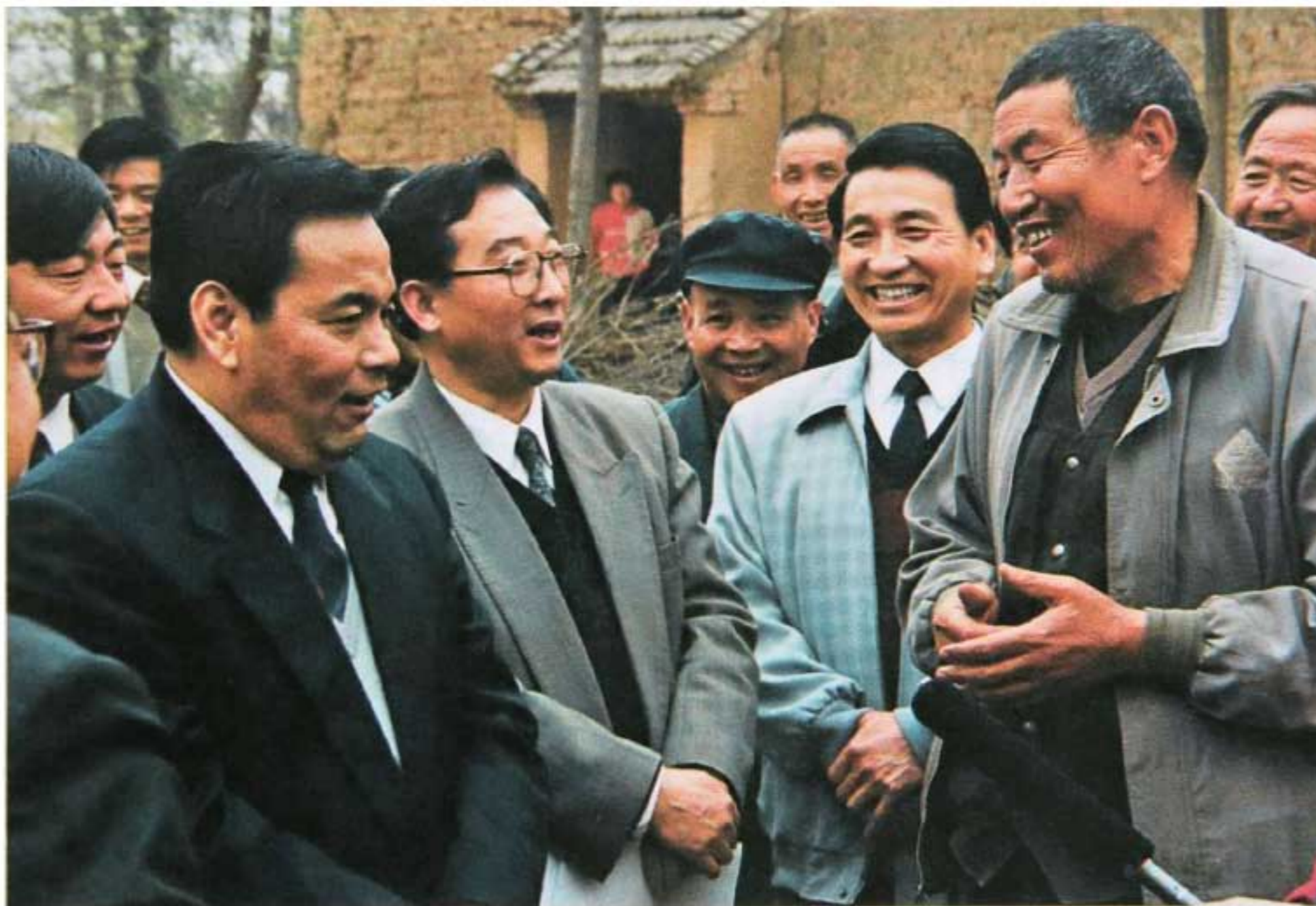
1996年3月12日，农业部部长刘江（前左一）在陕西调研农业农村工作