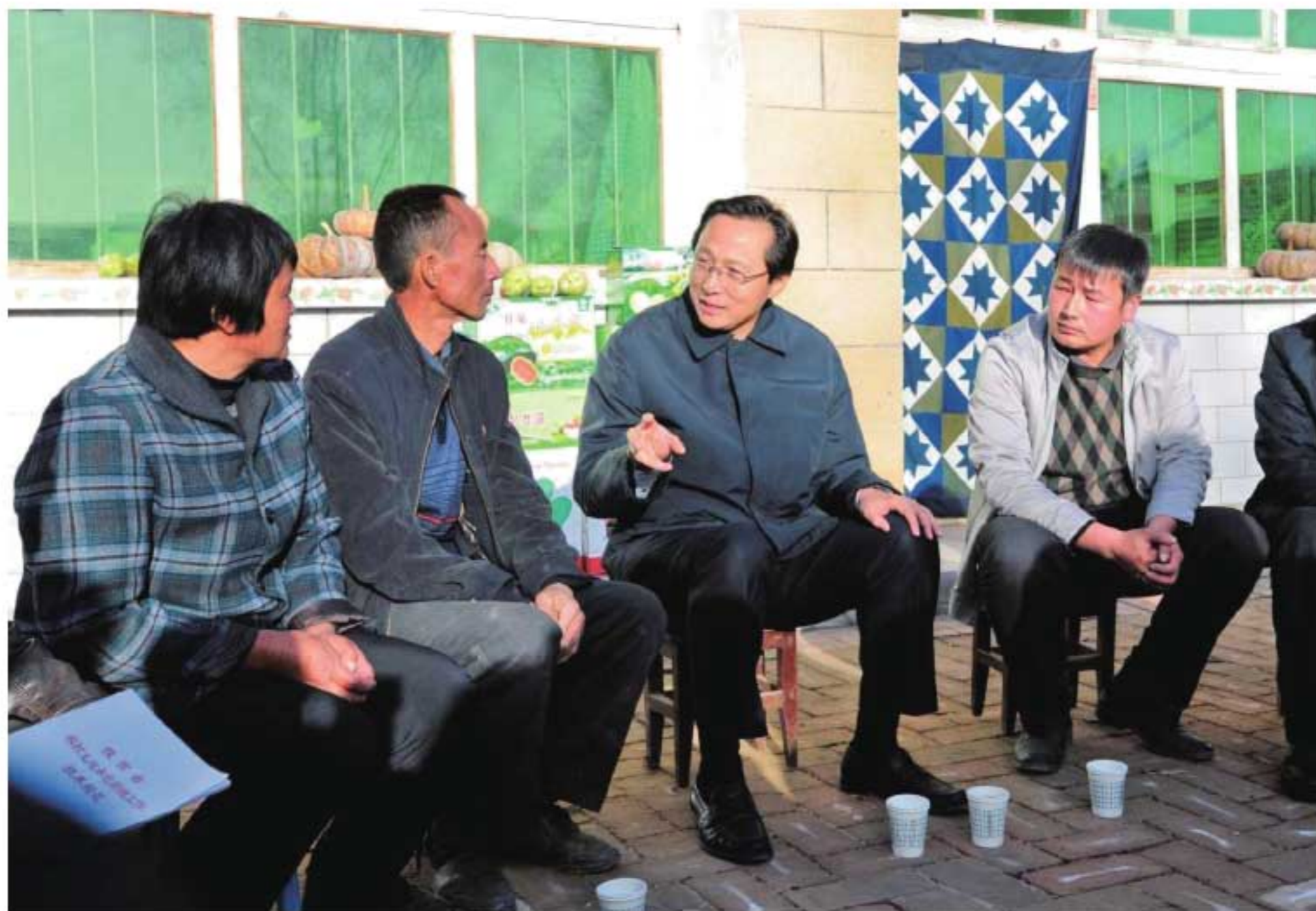
2013年11月16日，农业部部长韩长赋（左三）在甘泉县调研农村土地承包管理工作