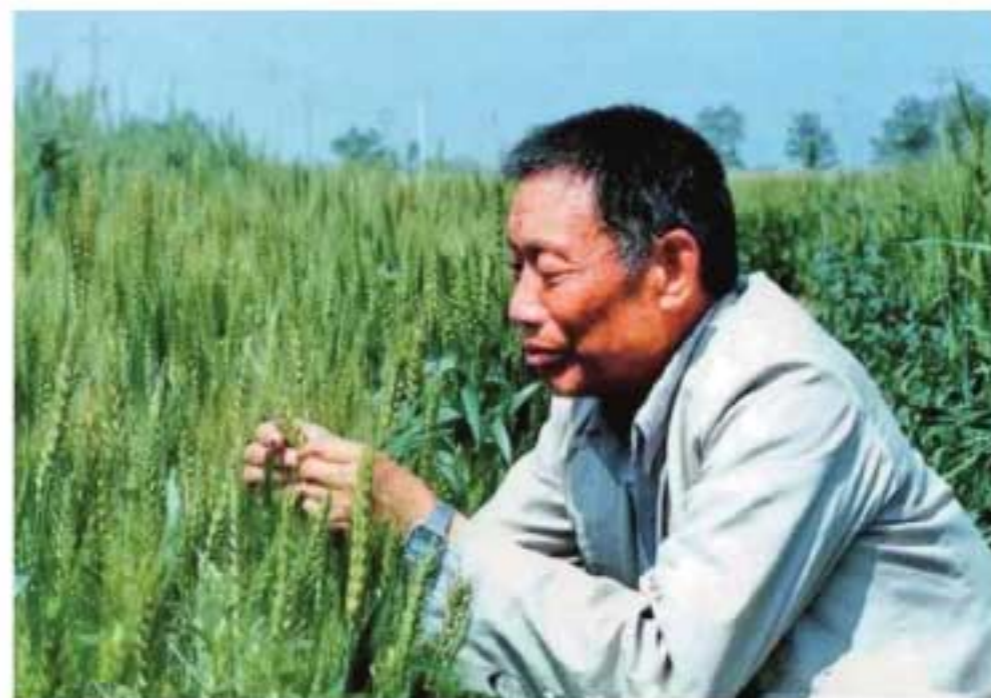
西北农大教授、院士赵洪璋观察小麦生长