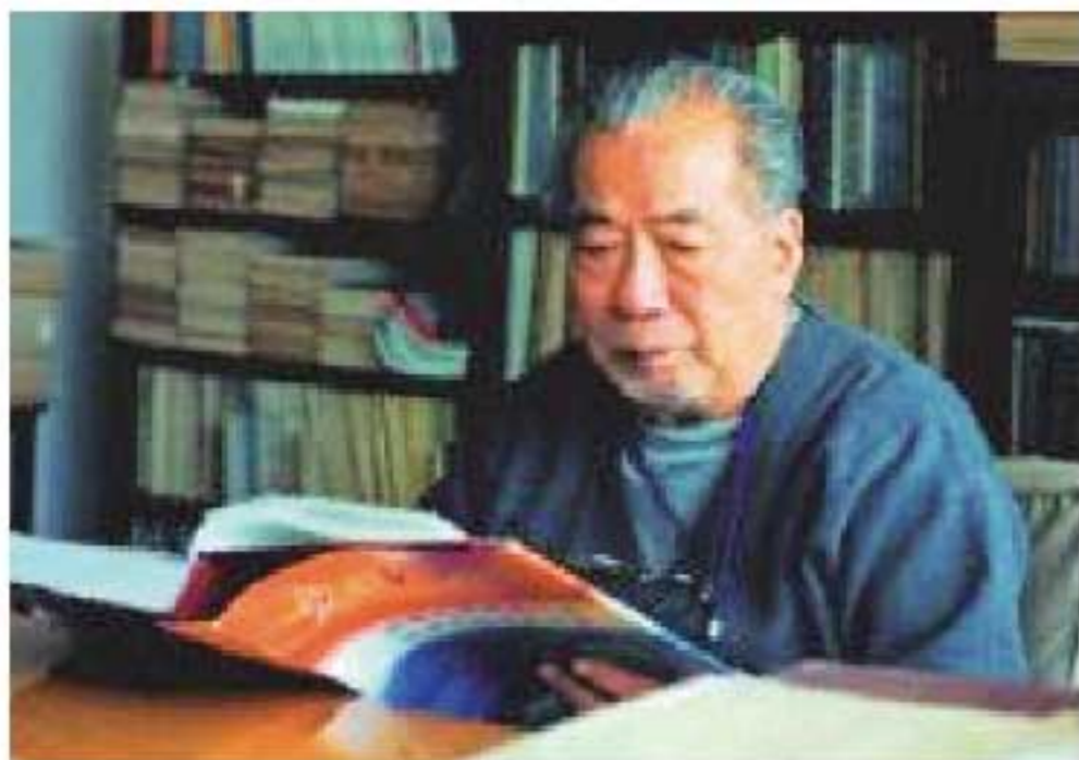
中科院西北水保所研究员、院士朱显谟工作中