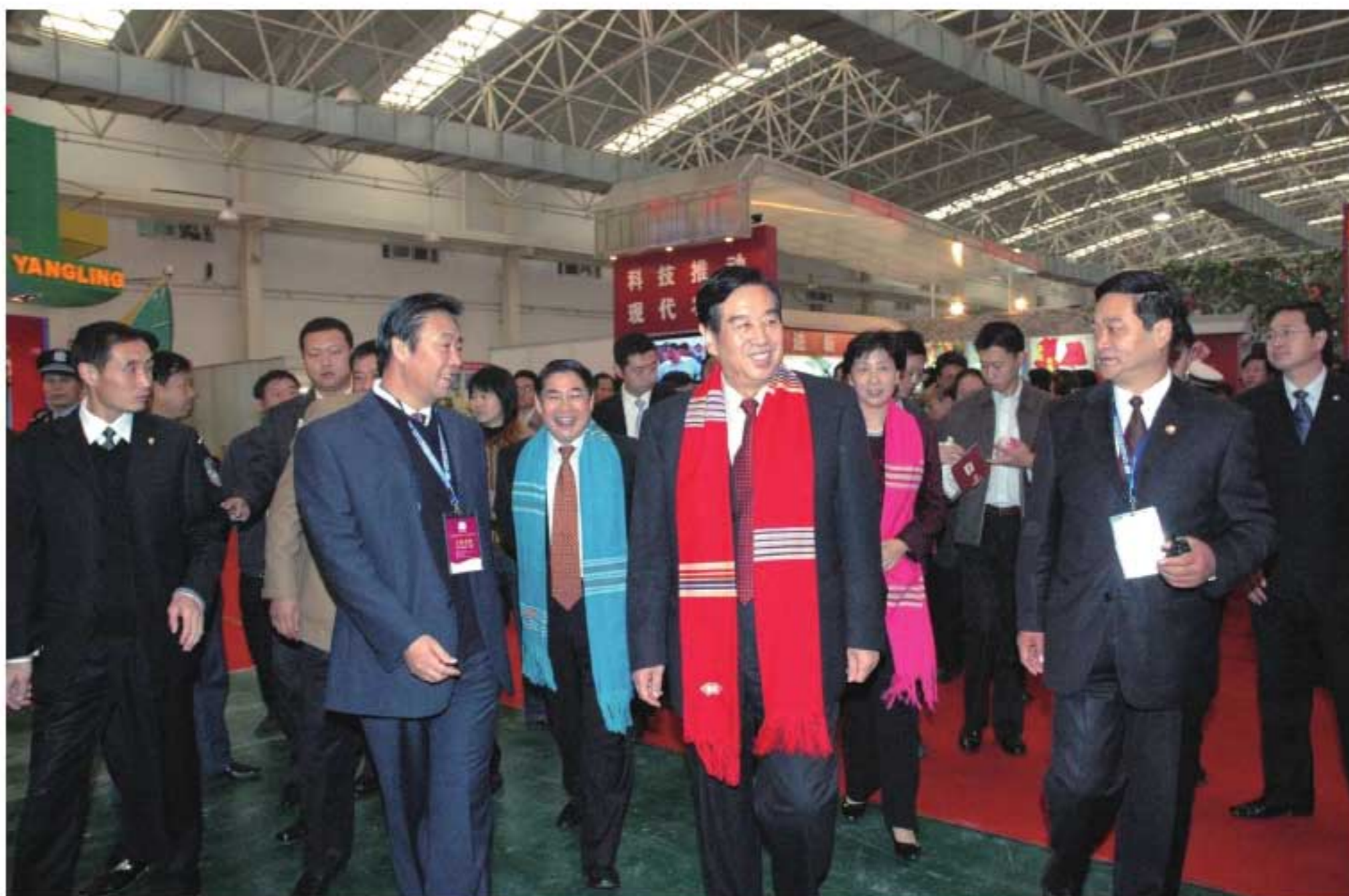
2007年11月5日，全国政协副主席李蒙（前中）参观杨凌农高会展览。