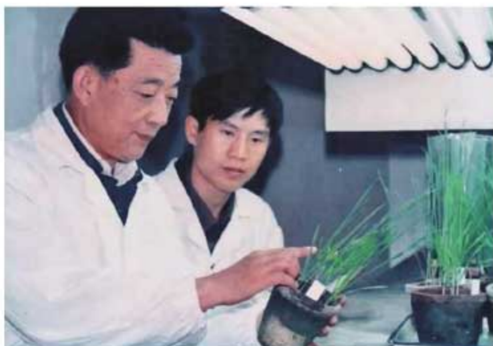
西北农大教授、院士李振岐指导学生