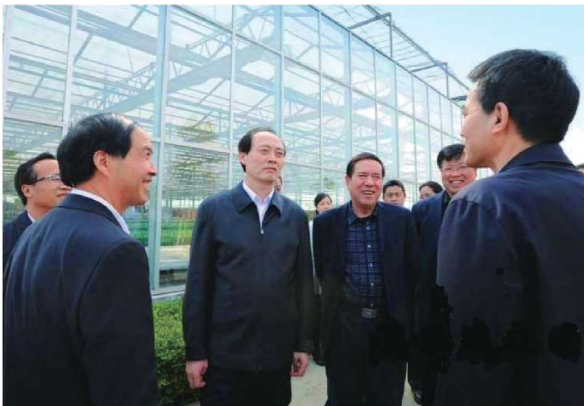
2013年4月20日，农业部副部长余欣荣（前左二）在陕西调研蔬菜产业