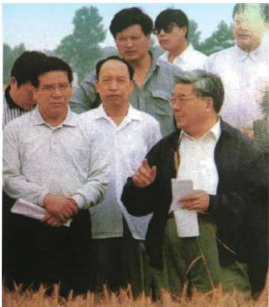
1997年5月31日，省长程安东（前右一）调查省长试验田小麦生产情况