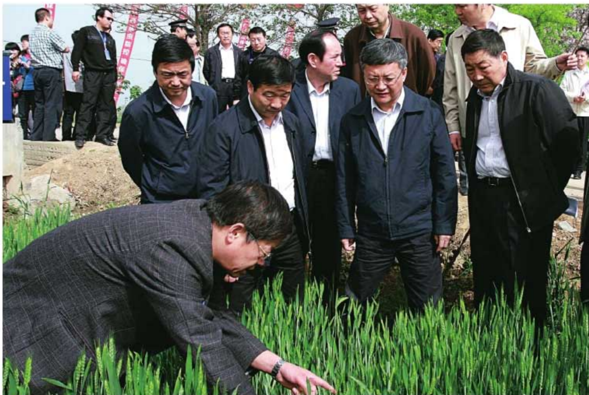
2012年4月25日，副省长祝列克（前右二）在蒲城县观察小麦吸浆虫发生情况