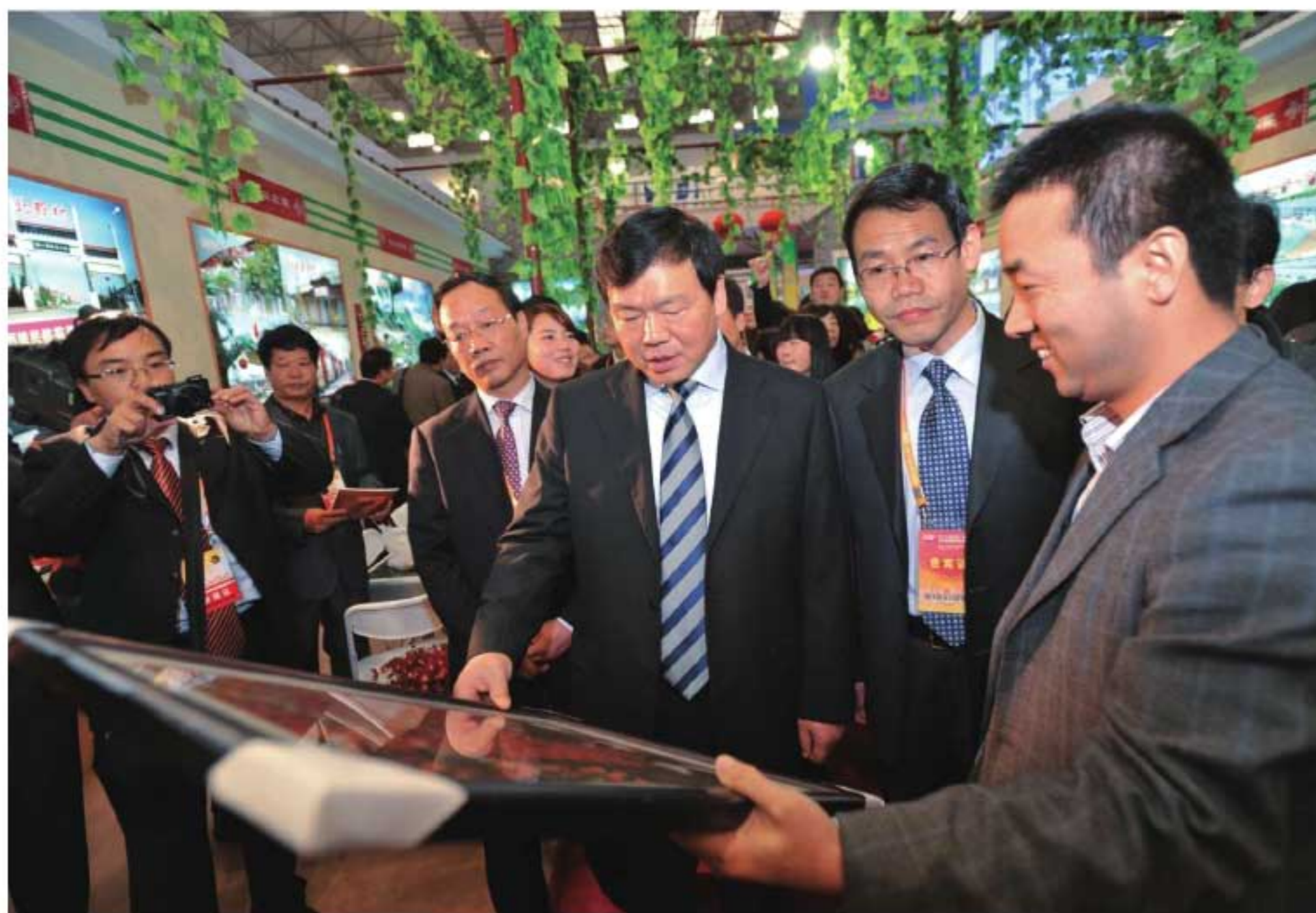
2011年11月5日，副省长姜勤俭（右三）参观一村一品生产成果展览