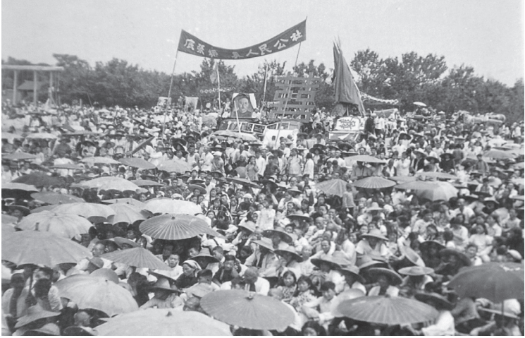
1958年8月24日，三万多名群众在周陵中学集会，欢庆全县实现公社化