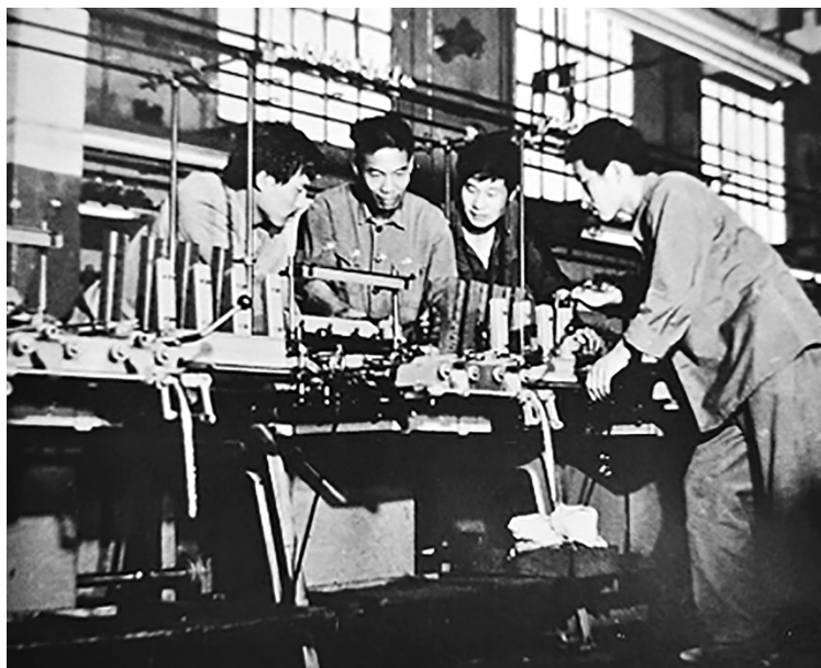
20 世纪 70 年代，在工业学大庆运动中，陕西省第八棉纺织厂工人研究技术革新