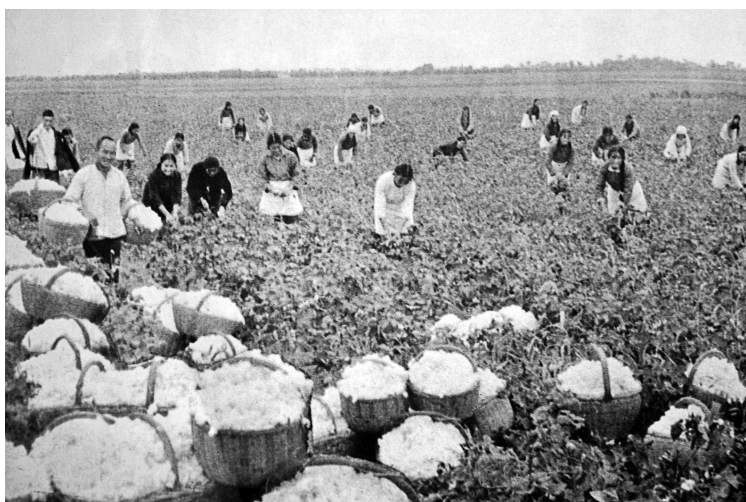
1971年秋，在农业学大寨运动中，咸阳市东风公社跃进大队知青们与农民一起喜摘丰收棉