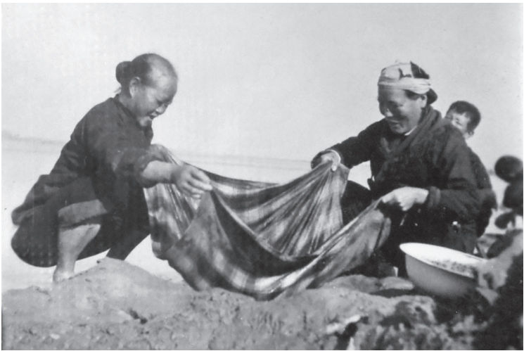
1958年10月，在大炼钢铁运动中，妇女用布单在渭河泥中过滤铁砂