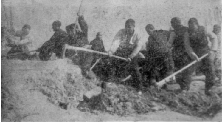
1955年11月，农业合作化时期，为了保证大面积丰产，双照乡双明四社的社员们开展了轰轰烈烈的搜肥运动