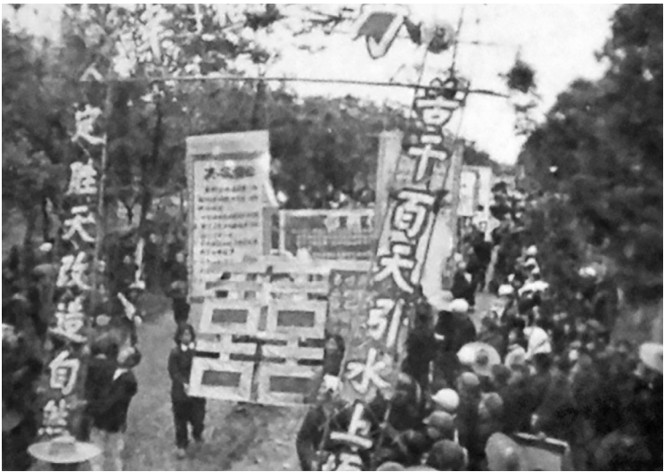
1958年5月12日上午，渭惠渠高塬灌溉工程开工典礼在咸阳周陵中学广场举行