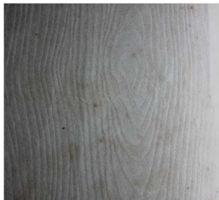
《丁玲选集》封面压纹：木 纹，天马书店 1933 年 12 月出版， 32 开本