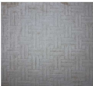
《唐代诗学》封面压纹：席 纹，（南京）正中书局 1935 年 5 月出版，大 32 开本