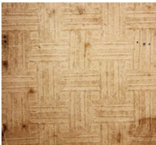
《婚姻与社会》封面压纹： 席纹，天马书店 1934 年 6 月出版， 32 开本