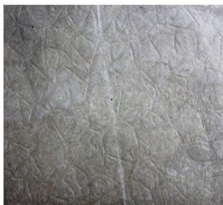
《洪深戏剧论文集》封面压 纹：乱石纹，天马书店 1934 年 1 月出版