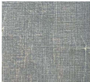
《达夫自选集》封面压纹： 麻布纹，天马书店 1933 年 3 月 出版，32 开本