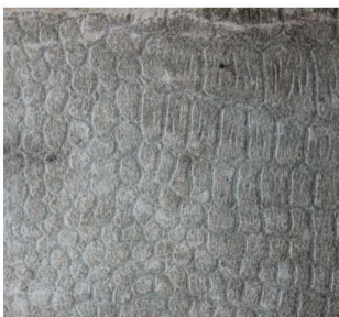
《茅盾散文集》封面压纹： 鳄鱼皮纹，1933 年 7 月天马书店 出版，32 开本