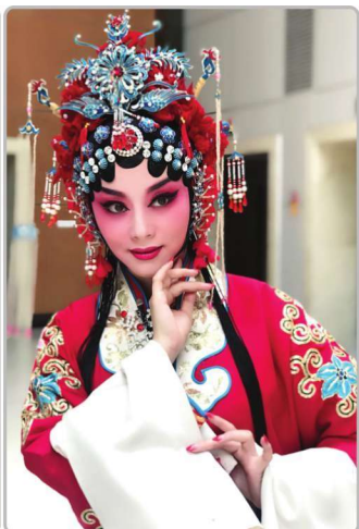
秦腔四小名旦之一梁少琴饰演《游龟山·洞房》中的卢凤英