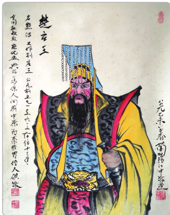
秦腔界的第一位开山鼻祖楚庄王熊侣