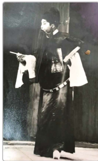
著名秦腔实力派表演艺术家董建 民先生在《杀驸》中饰吴承恩