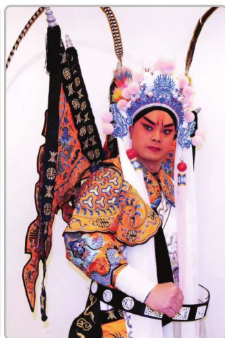
当红优秀青年演员宋少峰在《少逼宫》中饰姬寤生