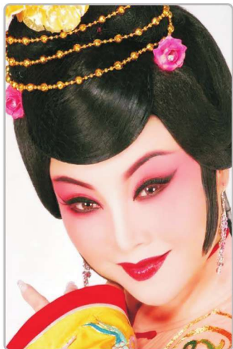
中国戏剧家协会副主席、中国戏剧梅花奖二度梅获得者、全国中青年德艺双馨文艺工作者柳萍在《庄妃与多尔衮》中饰庄妃