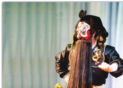
兰州耿派著名表演艺术家张菁先 生饰演《火焰驹·传信》中的艾谦