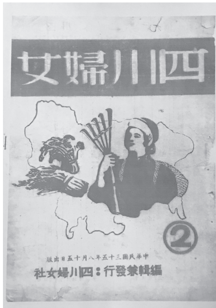
民国三十五年（1946年）《四川妇女》关于邻水妇女生活状况的报道