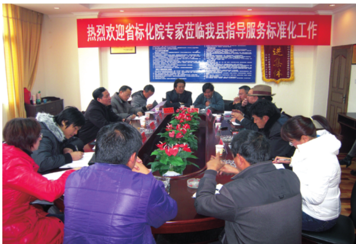
2011年，云南省标准化研究院专业人员在院领导的带领下到藏区迪庆州指导标准化工作，图为松赞林景区和藏民家访服务标准化试点工作研讨会