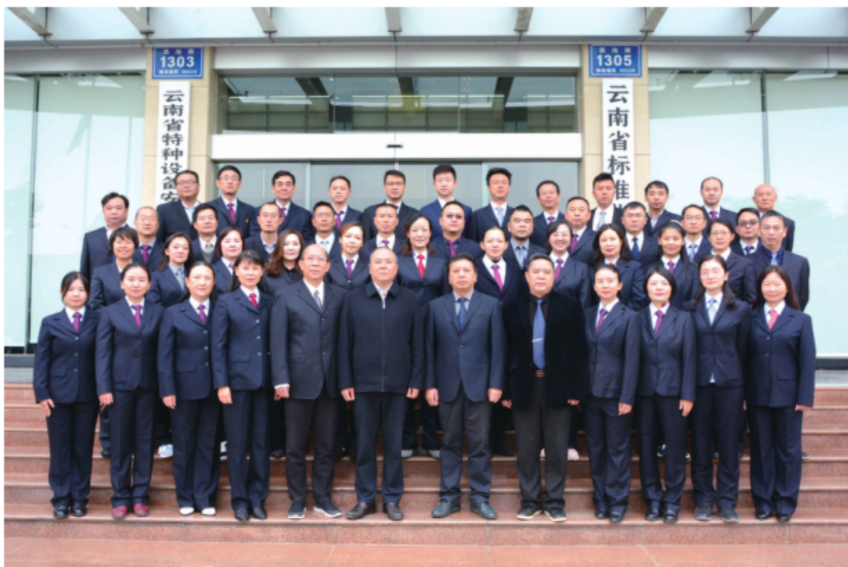
2019年，云南省标准化研究院职工合影