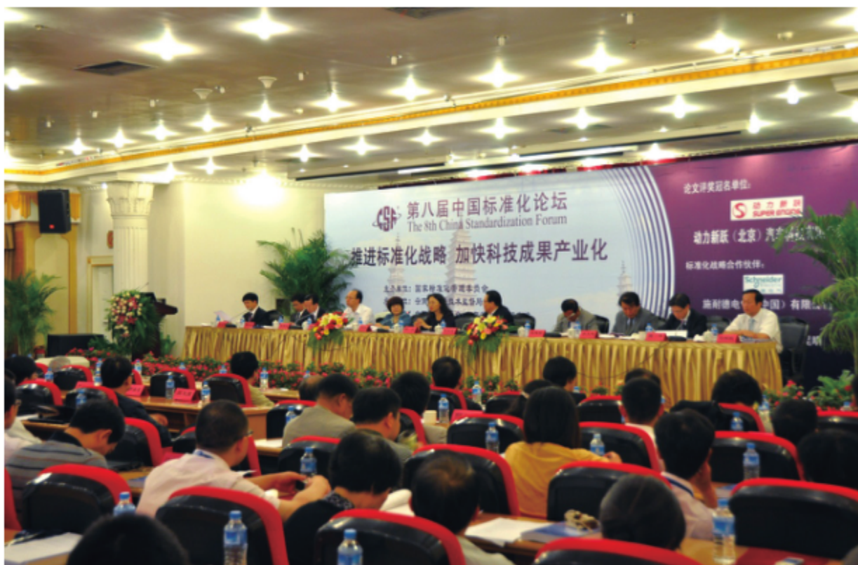
2011年9月21日，云南省标准化研究院协办第八届中国标准化论坛