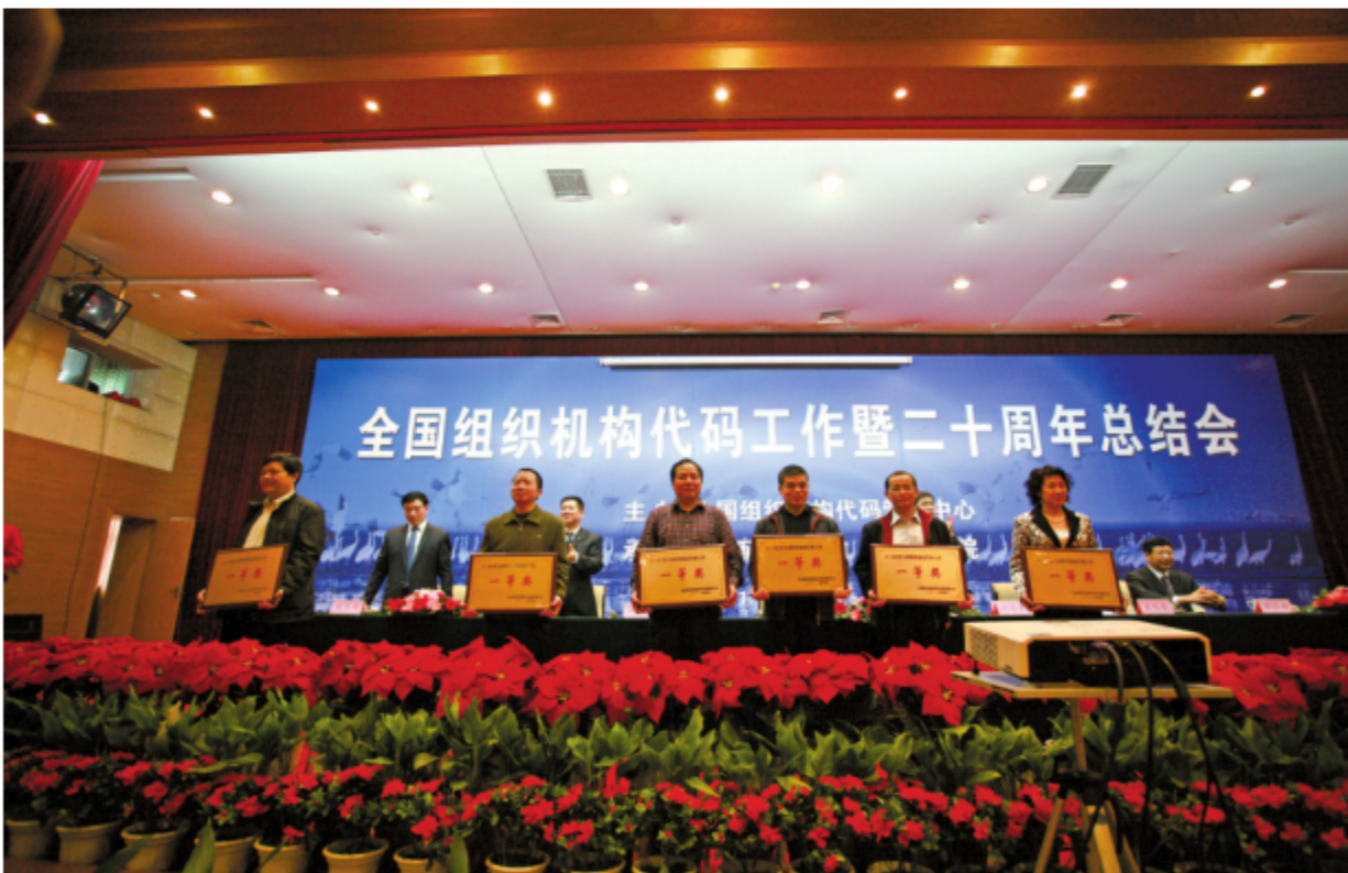
2011年4月14日，全国组织机构代码工作暨二十周年总结会获奖单位合影 (云南省组织机构代码管理中心荣获一等奖)