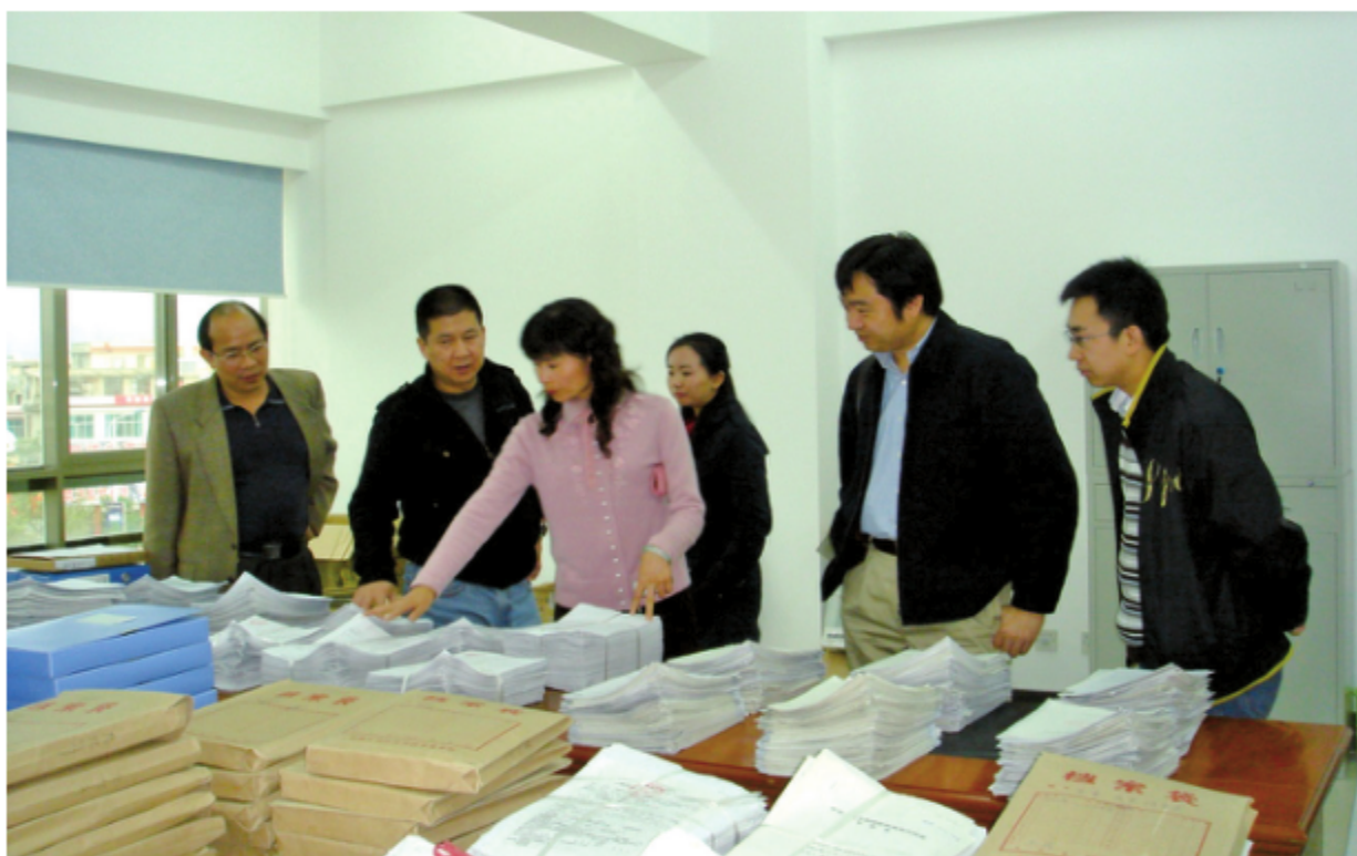
2008年10月28日，云南省组织机构代码管理中心帮助西藏自治区完成组织机构代码历史档案电子文档的建立，图为全国组织机构代码管理中心领导到现场进行验收