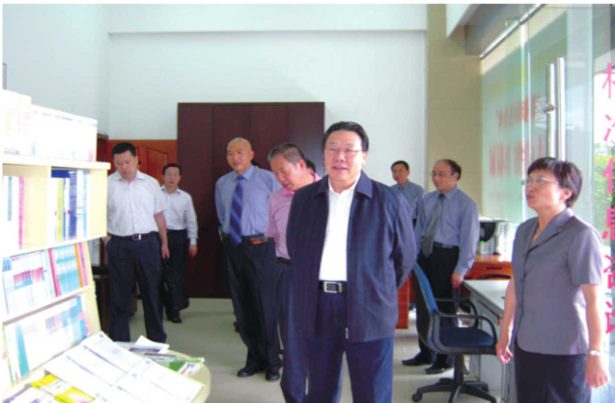
2009年8月20日，国家标准化管理委员会主任纪正昆等领导莅临云南省标准化研究院调研指导工作