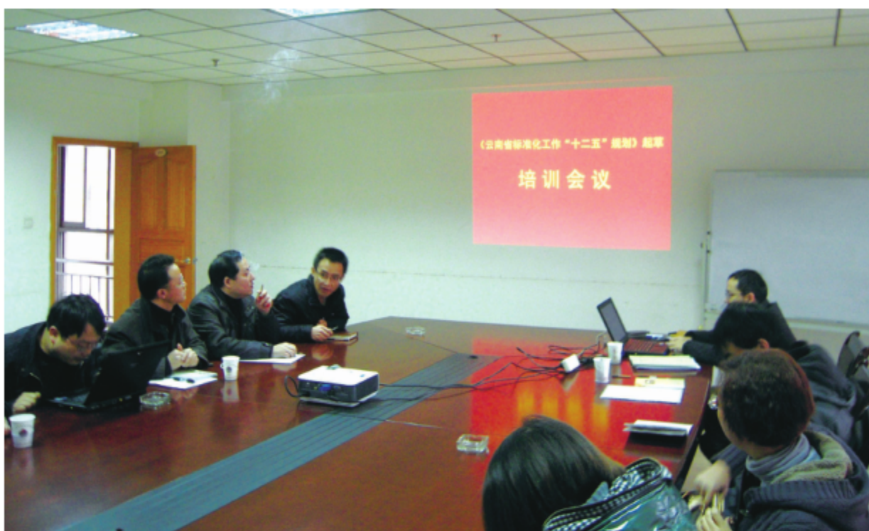
2011—2012年，云南省标准化研究院承担的《云南省标准化工作“十二五”规划起草》项目荣获2015年度云南省科技进步三等奖，图为省发改委专家就规划起草进行培训