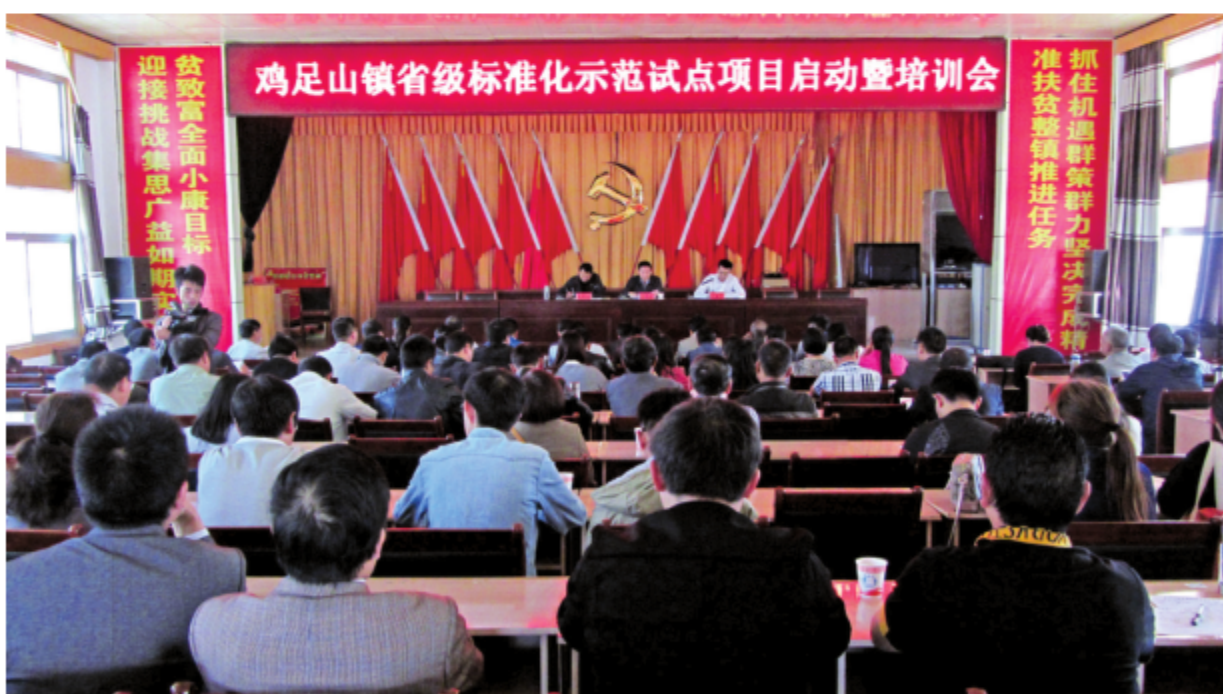
2016年，云南省标准化研究院专业人员赴宾川县鸡足山镇开展美丽乡村、农业和服务业等5个标准化示范试点项目建设培训会