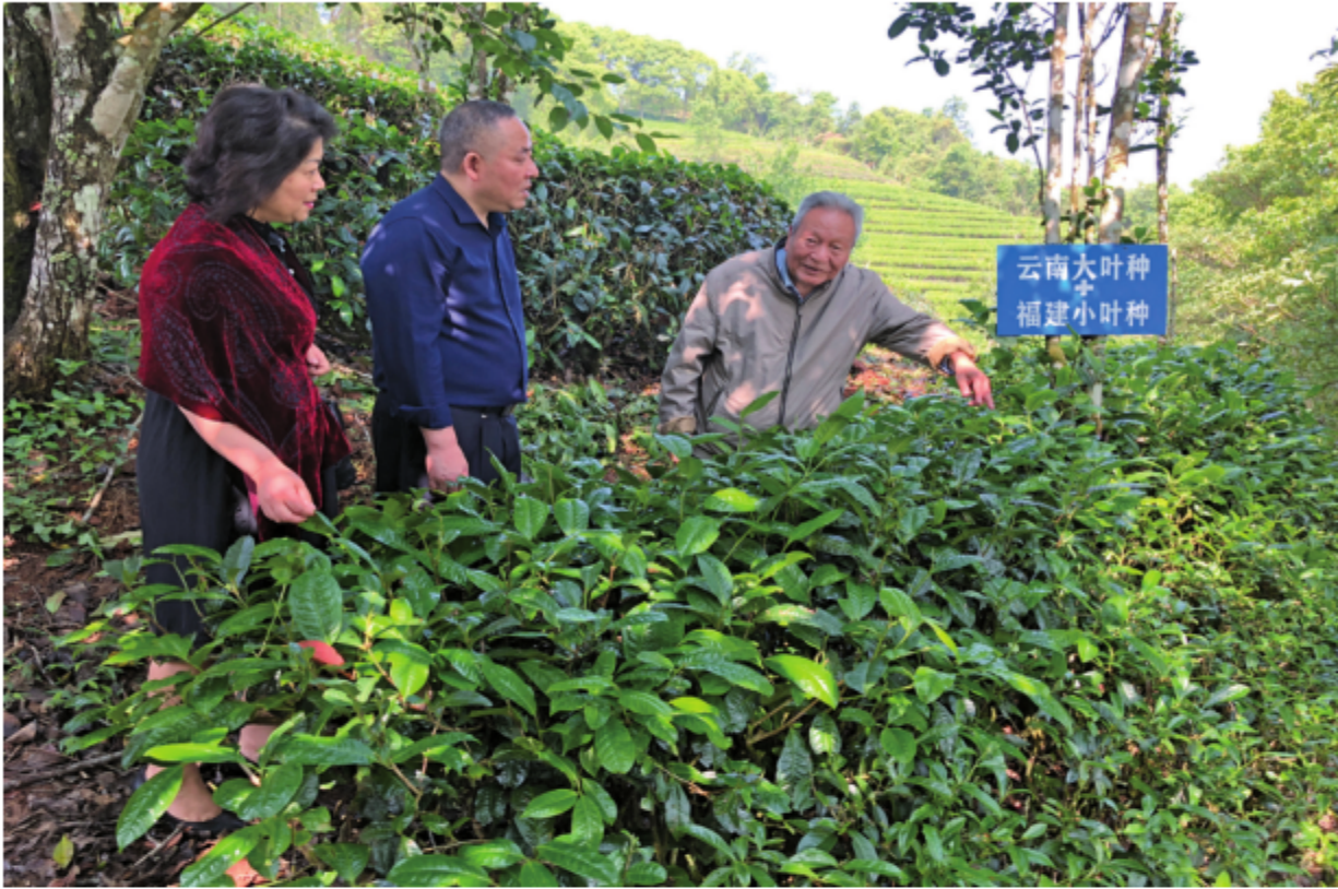
2018年，云南省市场监督管理局标准化处和云南省标准化研究院联合开展普洱茶标准体系调研工作