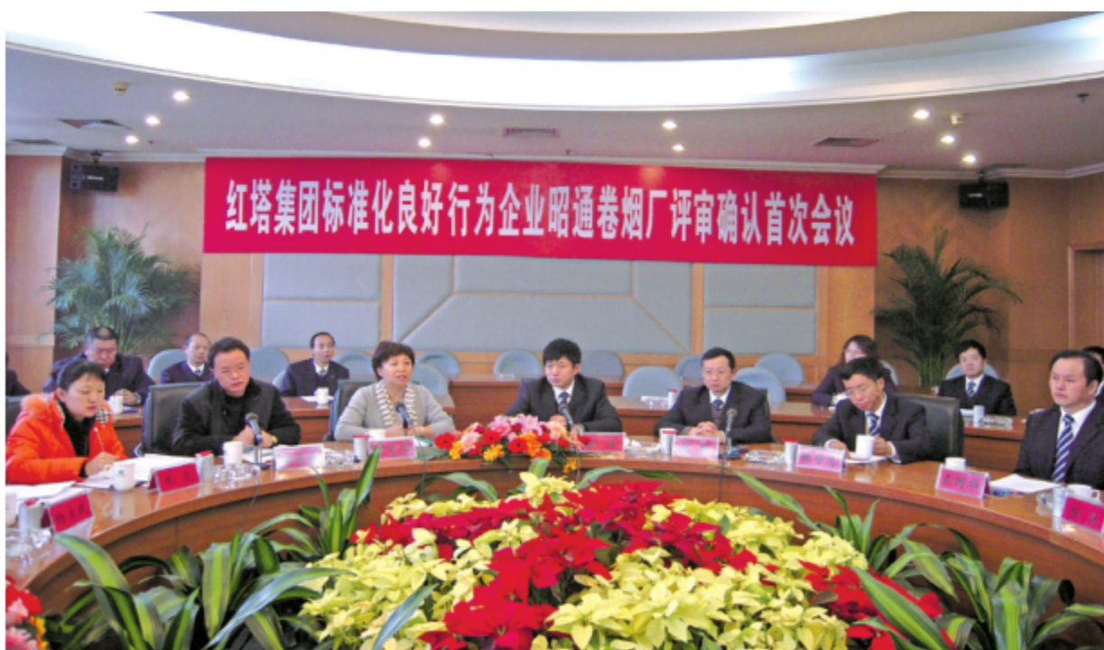
2008—2010年，云南省标准化研究院为红塔集团提供标准化技术指导，制定企业标准4000余项，红塔集团通过国家级AAAA级标准化良好行为企业确认，图为昭通卷烟厂确认首次会议