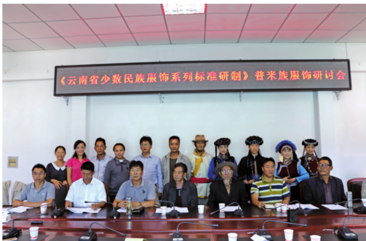
2015年，民族服饰标准起草组在怒江州兰坪县开展研讨工作