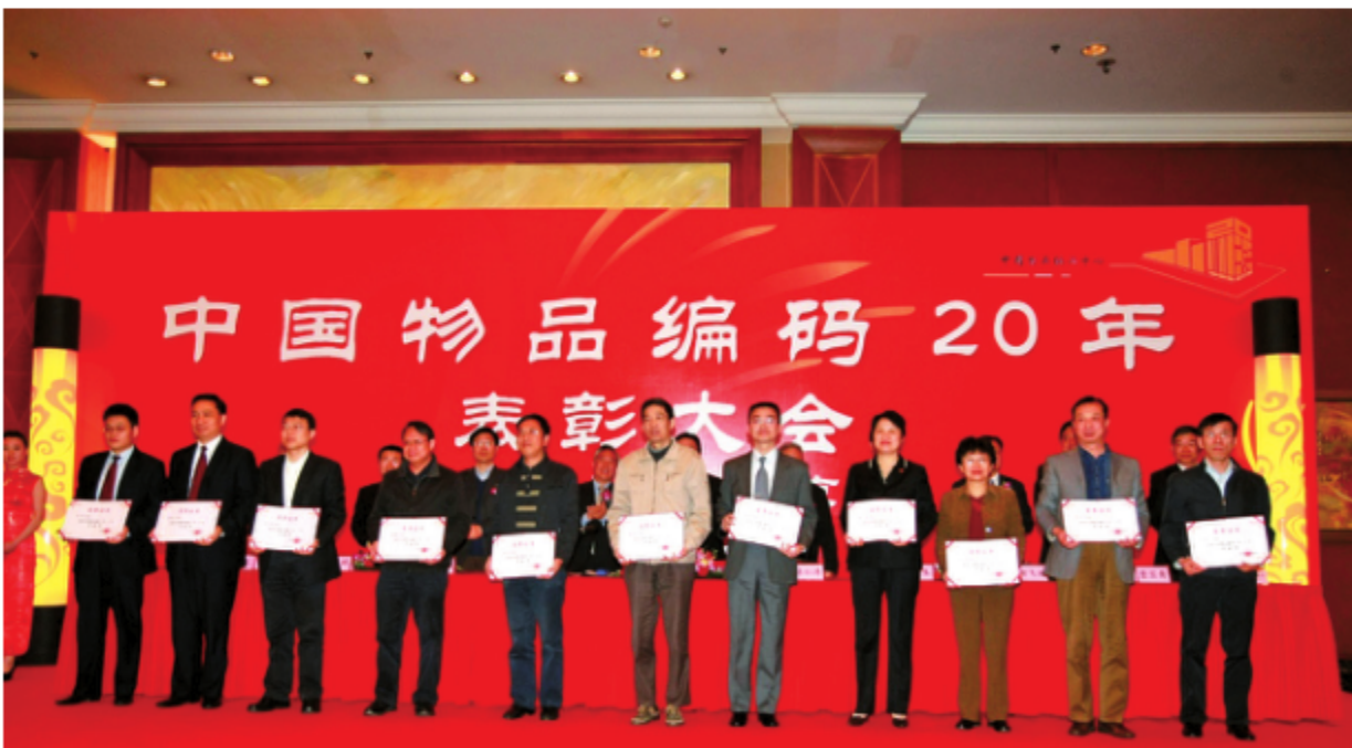
2009年3月27日，中国物品编码20年贡献奖获得者合影 (中国物品编码中心云南分中心荣获优秀分支机构奖)