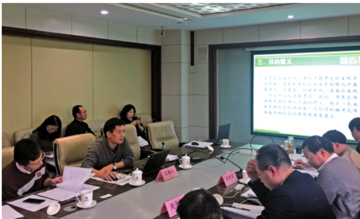
2017年，云南省标准化研究院主导制定的《农业废弃物综合利用 通用要求》（GBT 34805-2017）国家标准技术审查现场