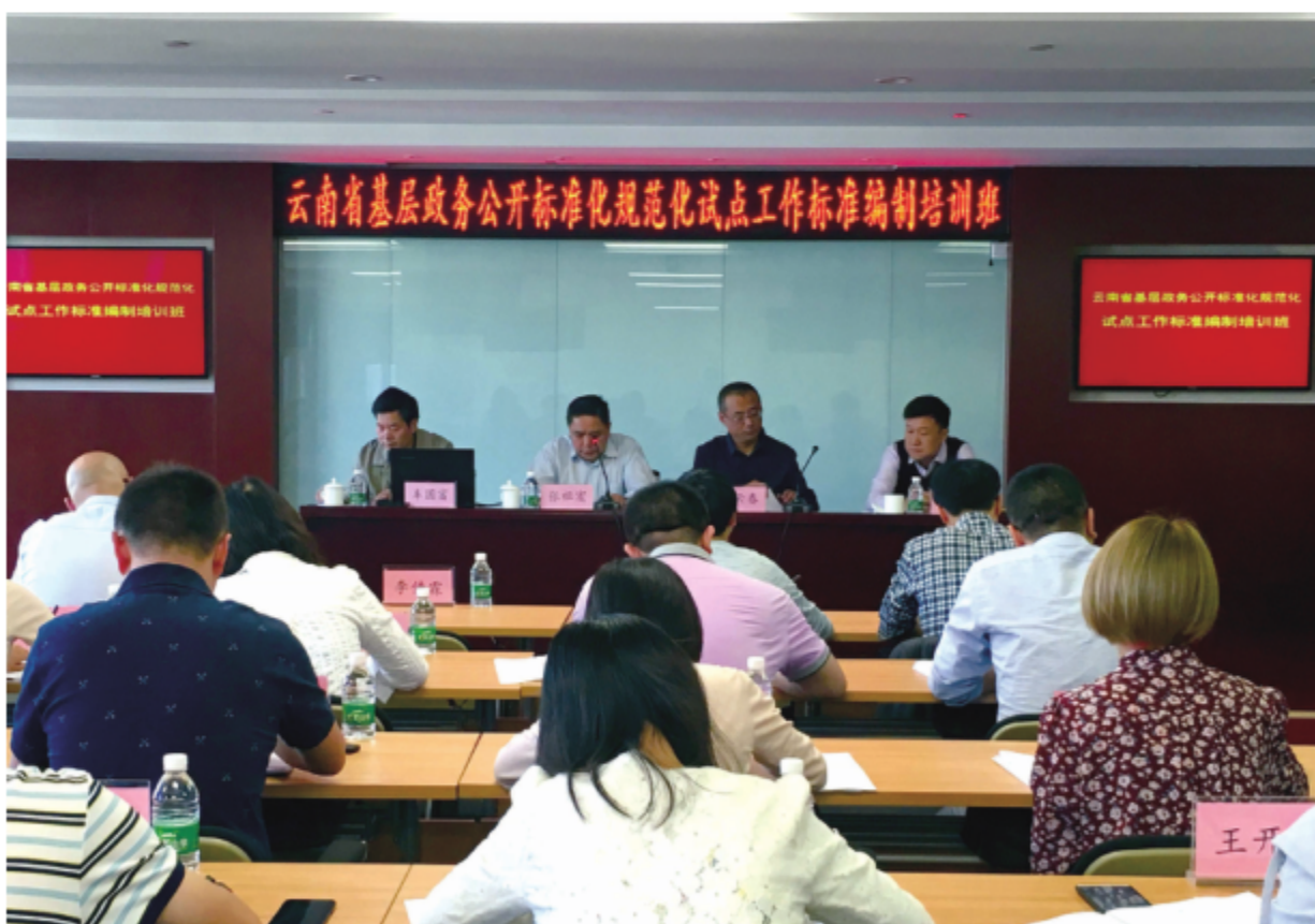
2017—2018年，云南省标准化研究院全程参与了国务院办公厅下达的云南省基层政务公开标准化规范化试点工作，图为承办的试点工作培训会