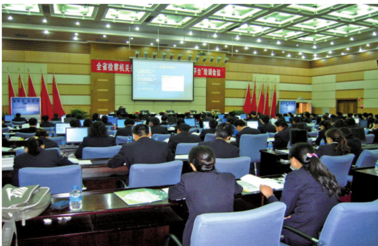
2010年3月12日，云南省组织机构代码管理中心为全省检察机关培训“全国组织机构代码共享平台”