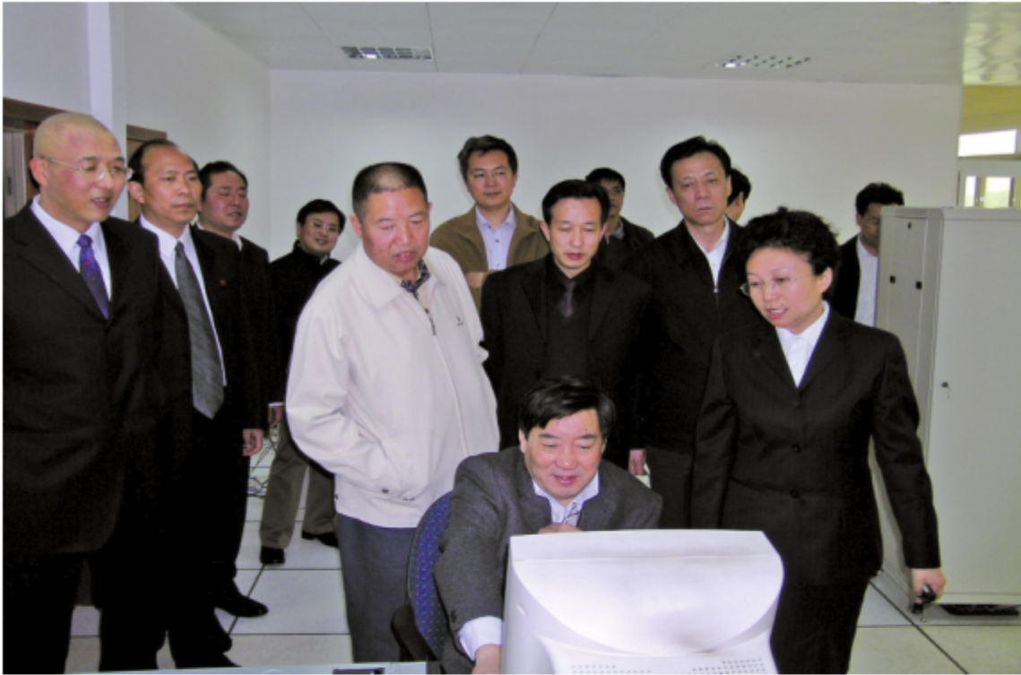
2007年3月15日，国家质量监督检验检疫总局党组书记、副局长李传卿（最前排）在云南省质量技术监督局党组书记、局长李元书（第二排中）等领导的陪同下莅临云南省标准化研究院调研指导工作