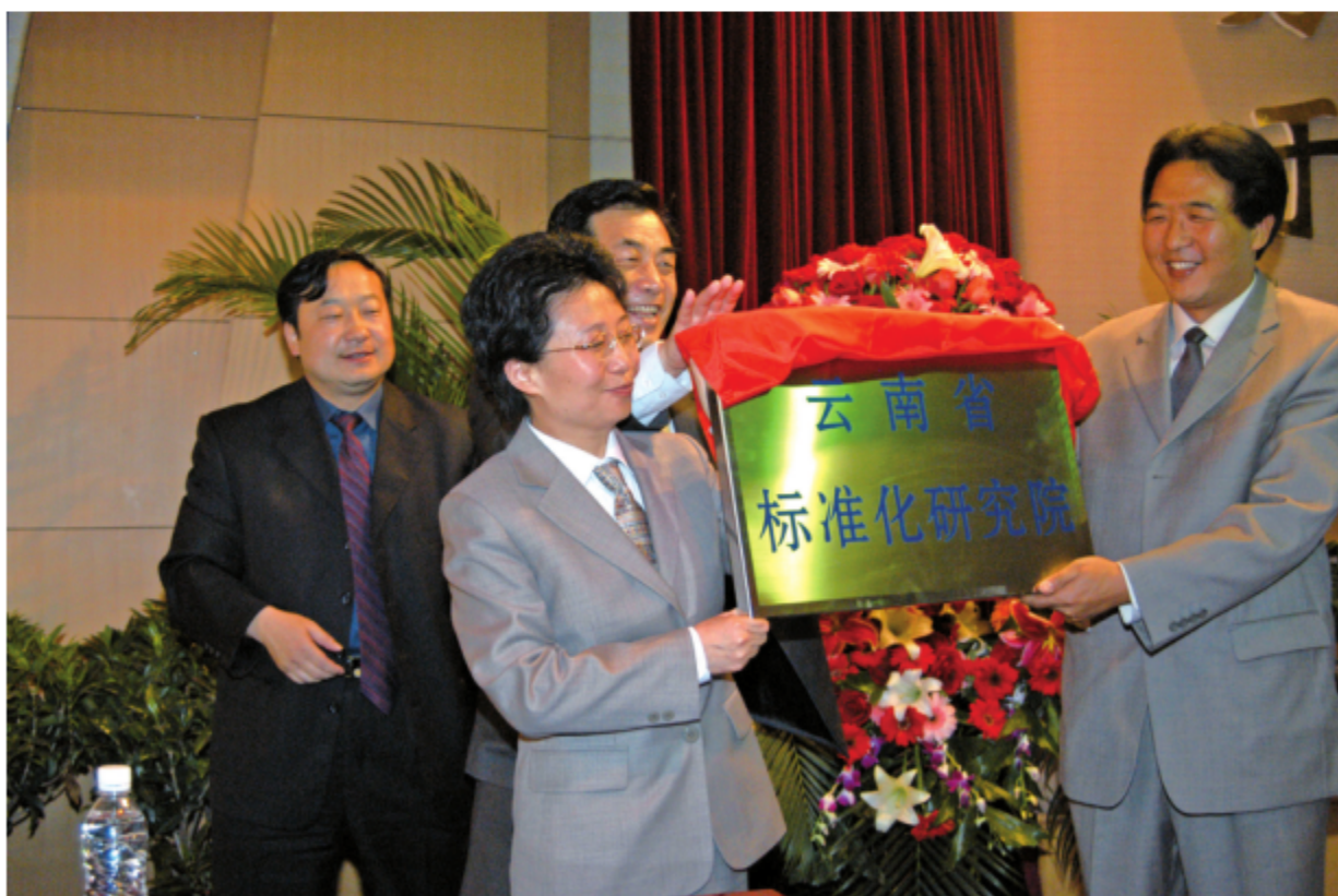
2004年4月28日，云南省标准化研究院揭牌