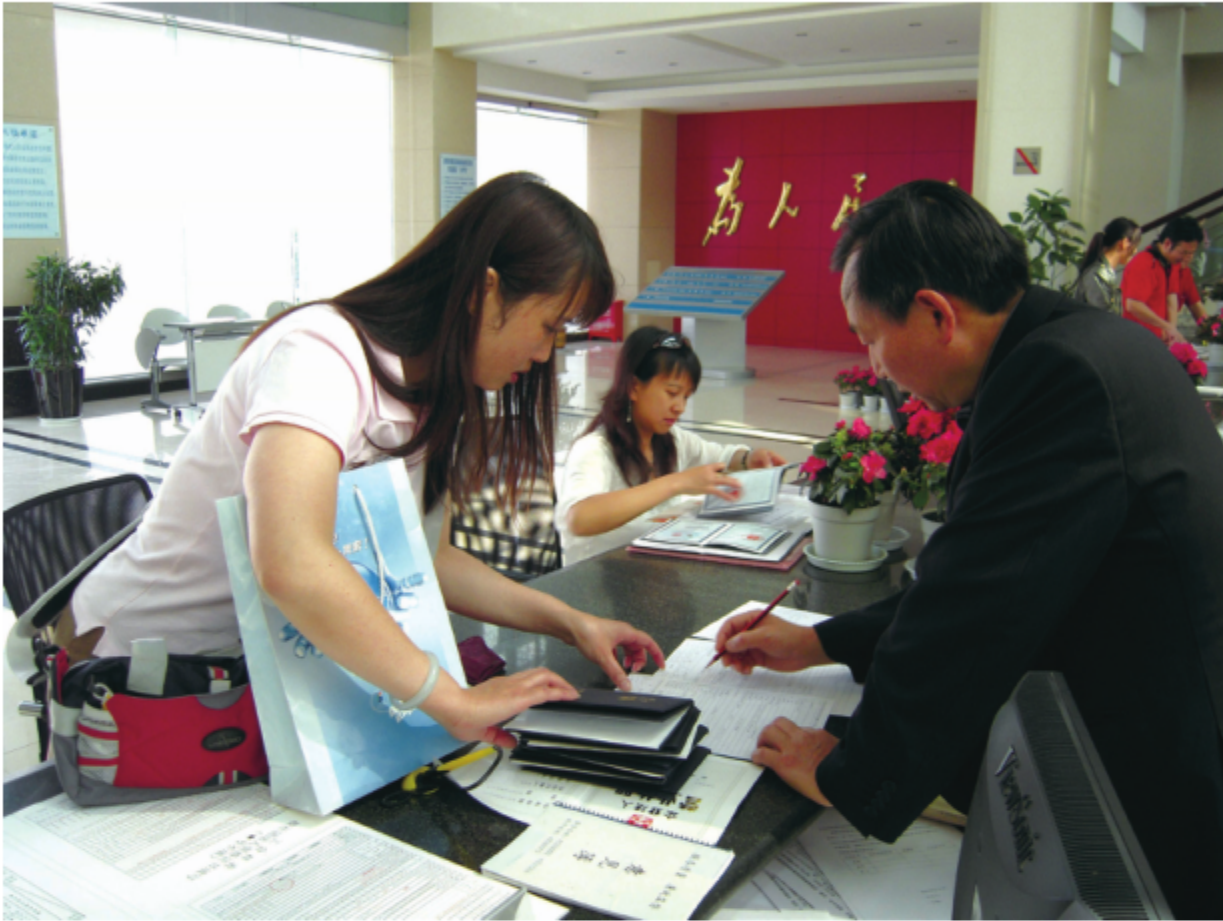
云南省标准化研究院办证大厅，图为省直组织机构代码代码颁证现场