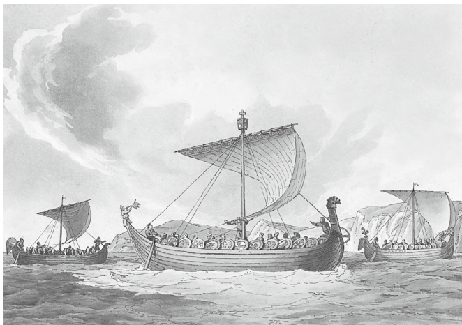
航行在英吉利海峡的诺曼舰队

英格兰遭遇的四次入侵在每个英格兰人的脑海中留下了永恒的印记。每次入侵都带来了惨痛后果，不仅让人民饱受摧残，往往还会引发英格兰的法律、语言和土地制度的剧变。因此，诺曼人征服英格兰后，无论是曾经的征服者还是被征服者，所有英格兰人都能够通过加强防御、维持稳定的政治秩序等方式，迅速团结起来，抵抗外敌入侵。