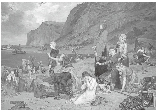
老弱妇孺目送诺曼人的舰队远征英格兰