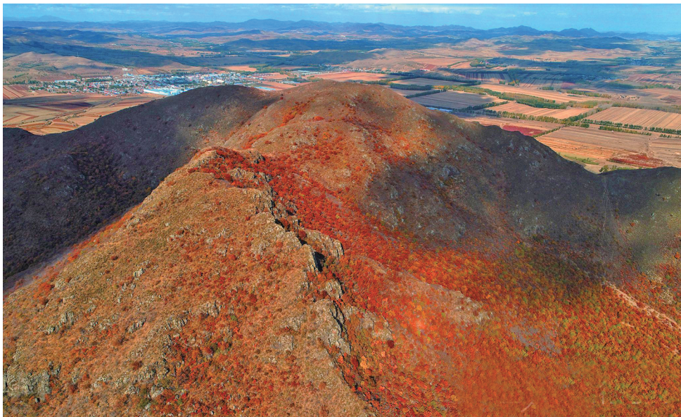
洮南敖牛山醉美金秋美如油画

洮南西北部为低山丘陵区,属大兴安岭余脉,平均海拔300—600米。境内大小山800余个,多分布在洮南市西北部胡力吐、万宝、煤窑、东升、那金、野马、聚宝等乡镇境内。其中,海拔在300米以上的37个,有位于万宝镇境内的北石坑山、锅底山、马鞍山、石板山;位于煤窑乡境内的敖牛山、大黑山、奶子山;位于东升乡境内的狼洞山、酸塔山、尖山、公鸡山、黑条山;位于聚宝乡境内的黑顶山、九顶山、红山;位于那金镇境内的昂岱山;位于胡力吐蒙古族乡境内的道布吐山、大砬子山、老头山、老鹰山、胡力吐山和相辟埡如山;位于野马乡境内的野马图山等。 ① 这些分布在洮南市西北部山冈,是洮南市地势地貌的显著特征,也是吉林省西部平原地区唯一的一个山地资源丰富的地方。