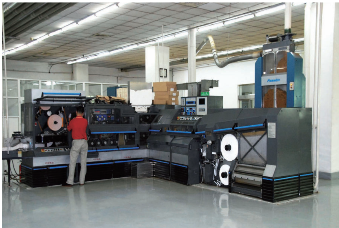
1999年引进的PASSIM卷接机组