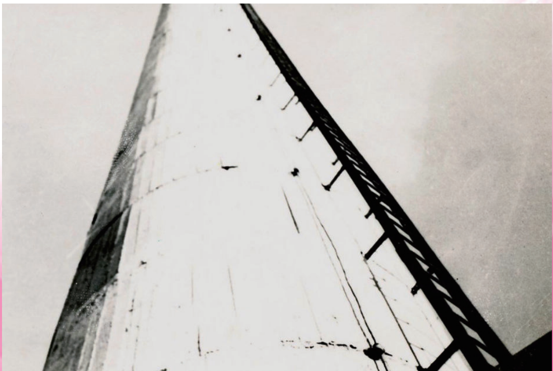
东北沦陷时期 满洲烟草株式会社”大烟囱