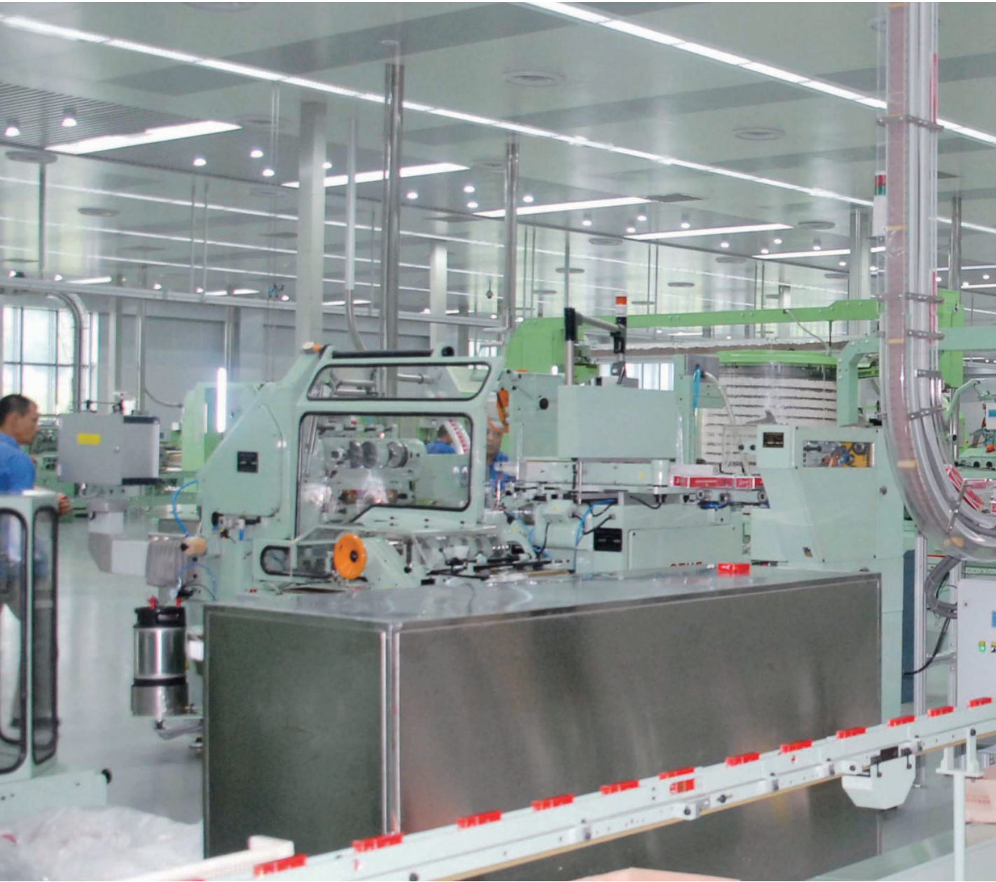
长春卷烟厂“十一五”易地技