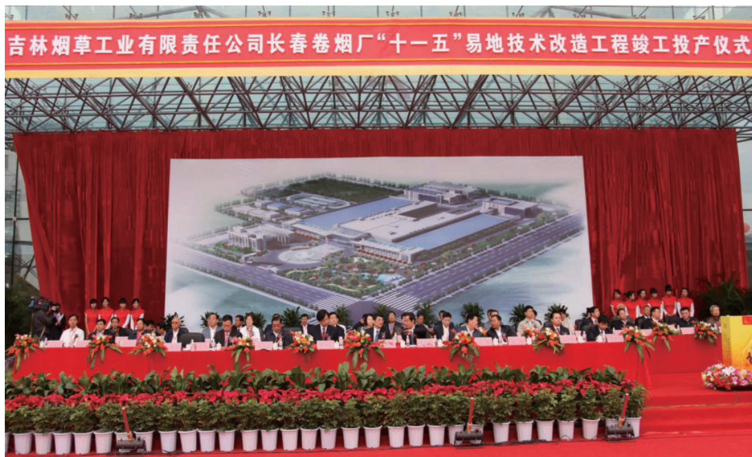
2010年9月16日，长春卷烟厂举行“十一五”易地技改工程竣工投产仪式，国家烟草专卖局副局长李克明（前左四）、中共长春市委书记高广滨（前左五）出席并在主席台前排就座