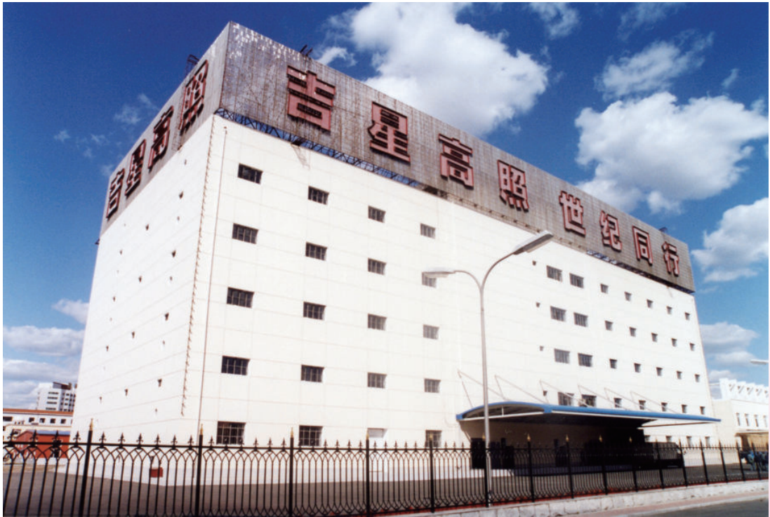
20世纪90年代工厂高层库房