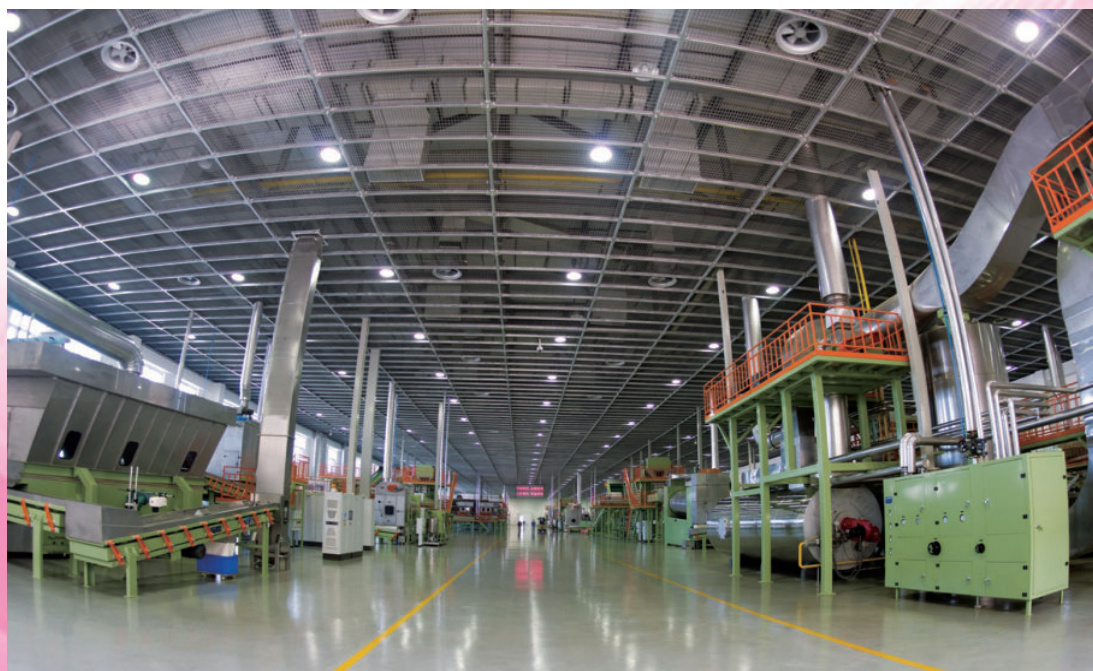
长春卷烟厂“十一五”易地技改新建的现代化制丝生产线