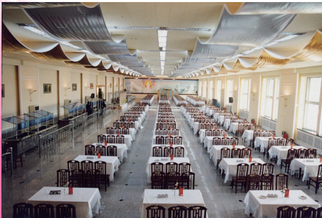
20世纪90年代工厂职工食堂