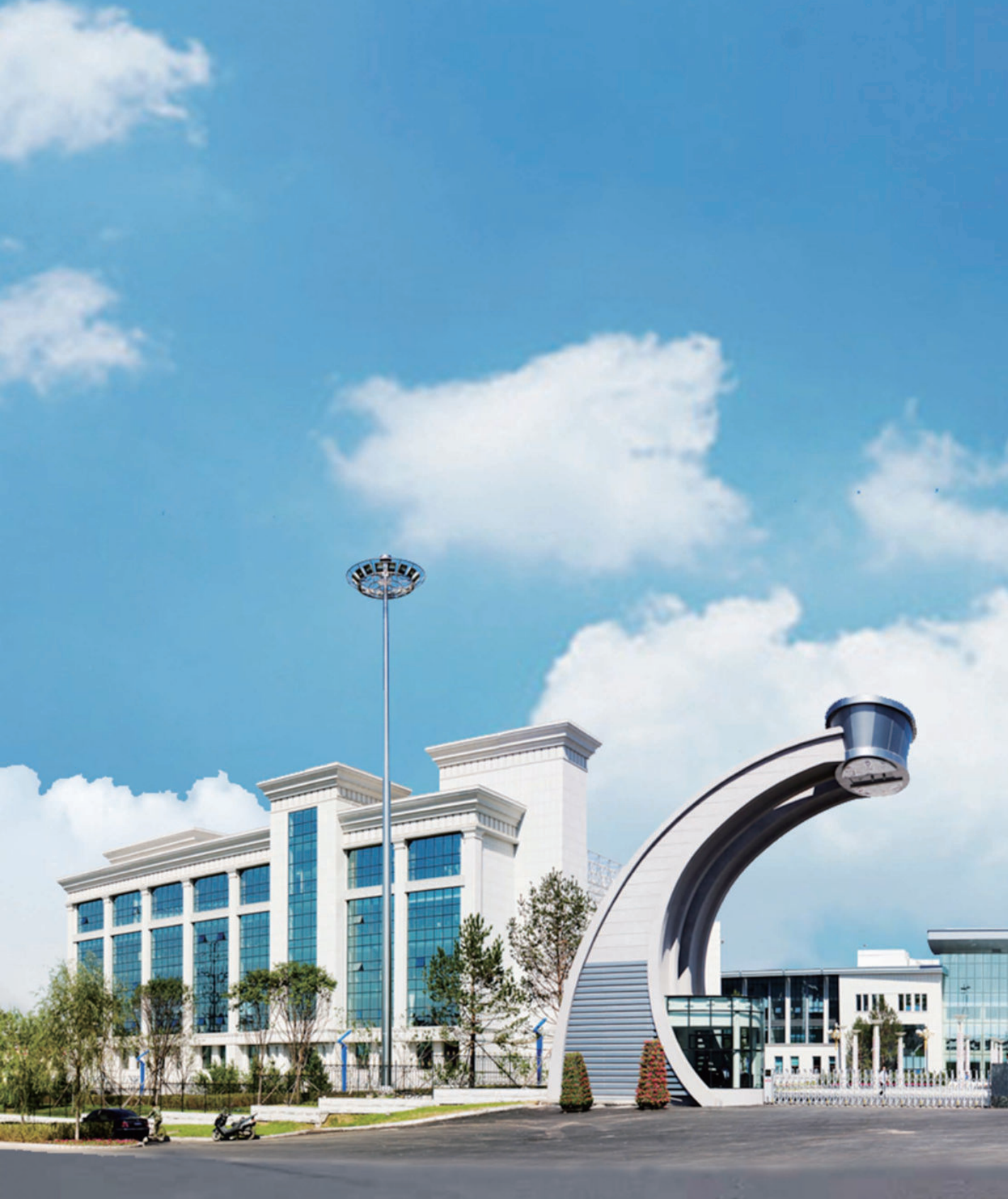
吉林烟草工业有限责任公司长春卷烟厂