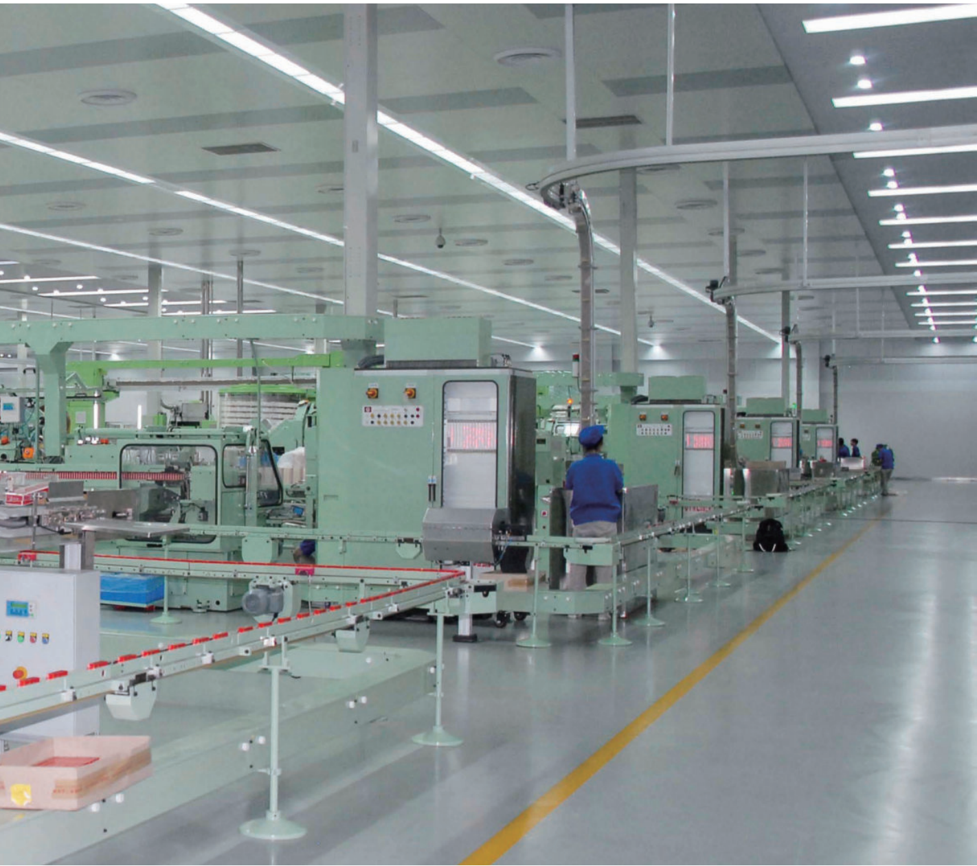
改后的现代化卷烟生产车间