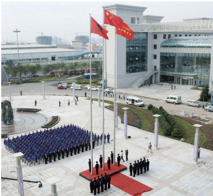
2010年9月10日，长春卷烟厂“十一五”易地技改工程竣工，新工厂举行升旗宣誓仪式