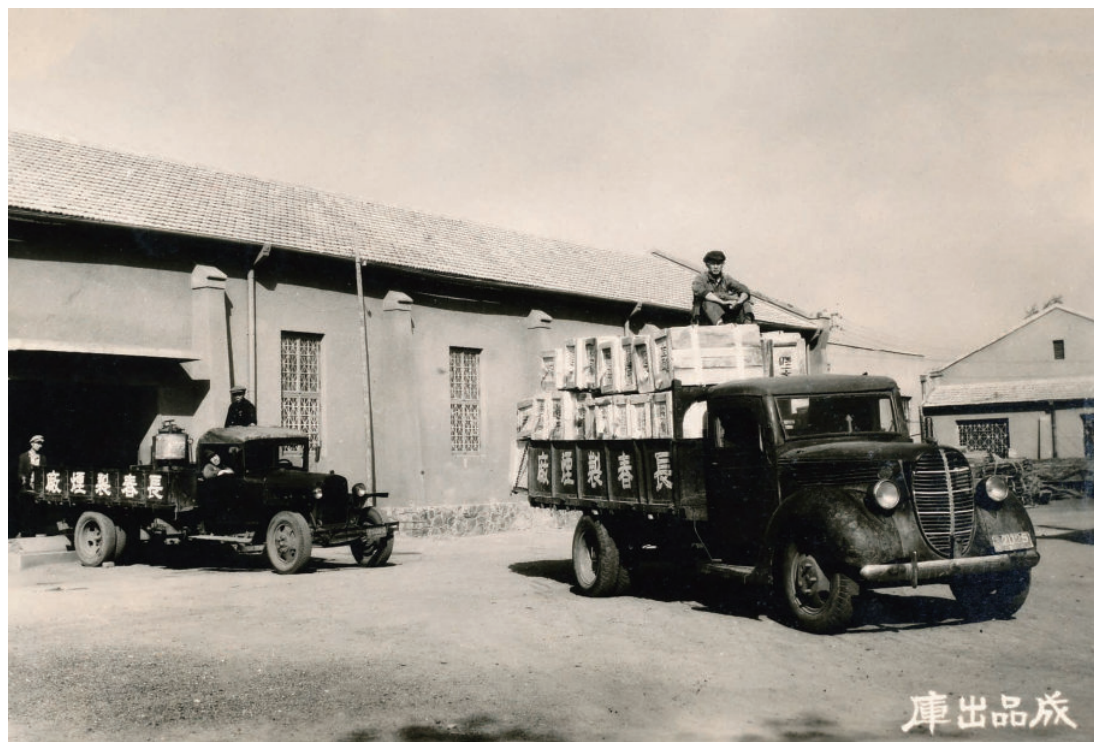
20世纪50年代初长春制烟厂运输成品车辆