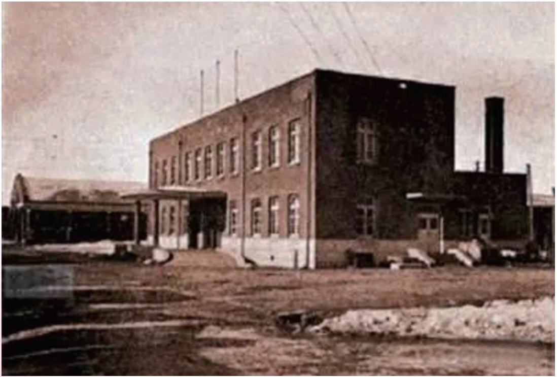
东北沦陷时期 “满洲烟草株式会社”