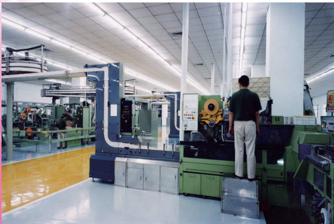
1990年从德国豪尼公司引进的PROTOS卷接机组