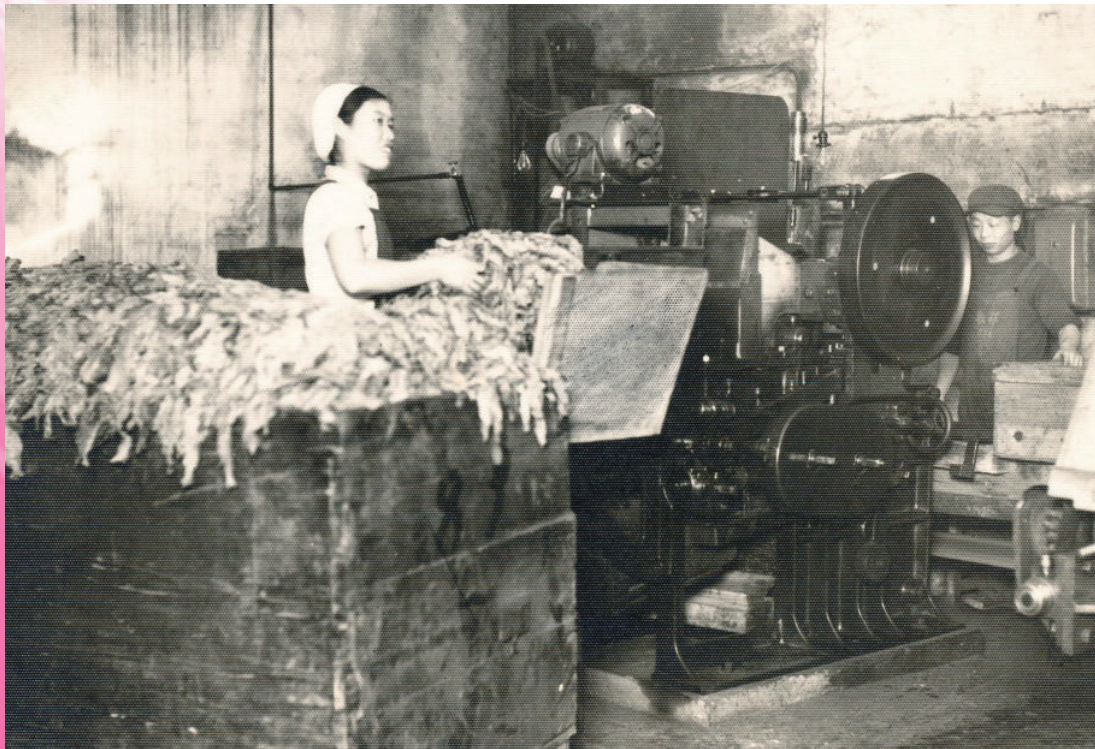
20世纪50年代制丝车间的切丝机