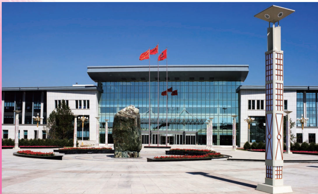
2010年9月16日，长春卷烟厂“十一五”易地技改工程竣工后的联合工房