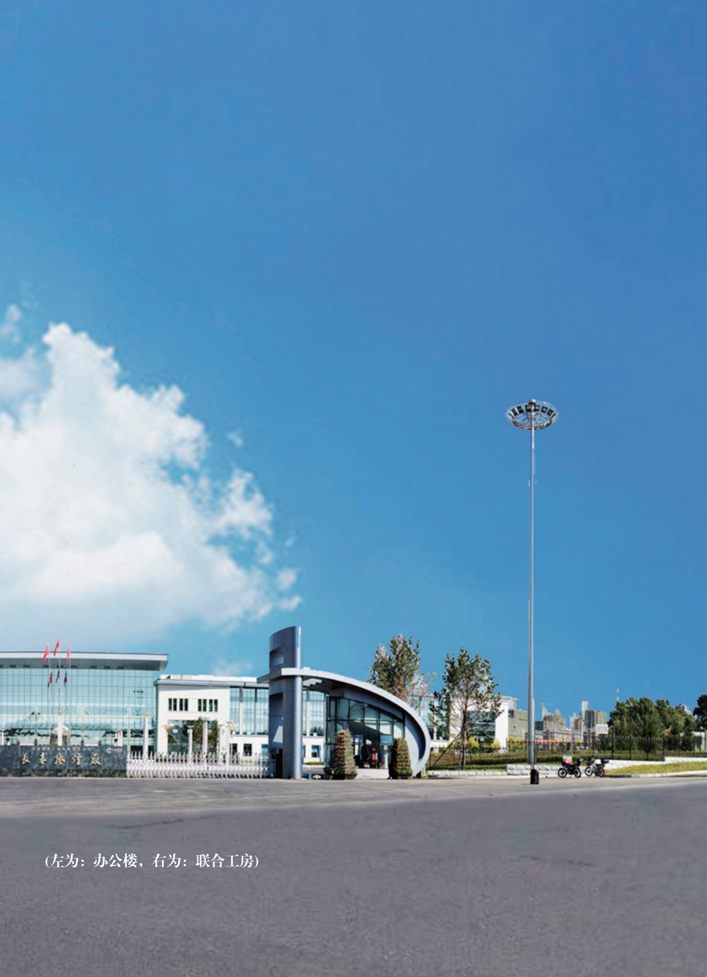
(左为：办公楼，右为：联合工房)