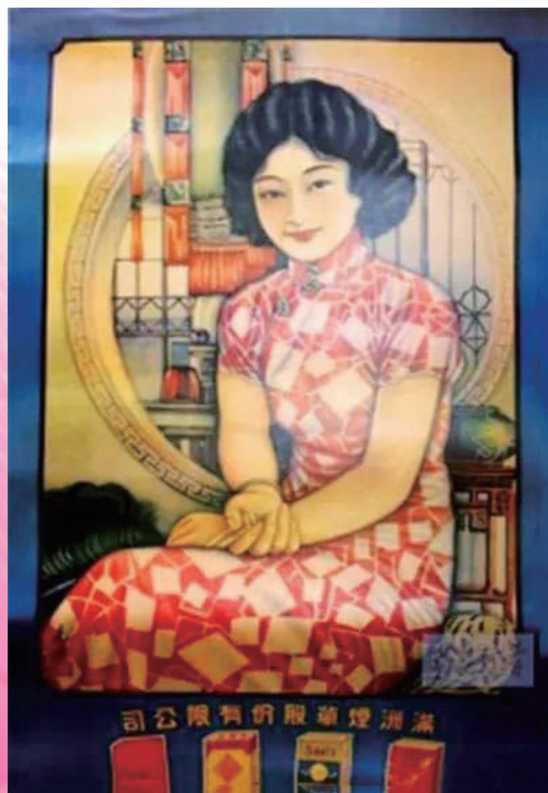
东北沦陷时期 “满洲烟草股份有限公司”（后改为 “满洲烟草株式会社”）广告牌