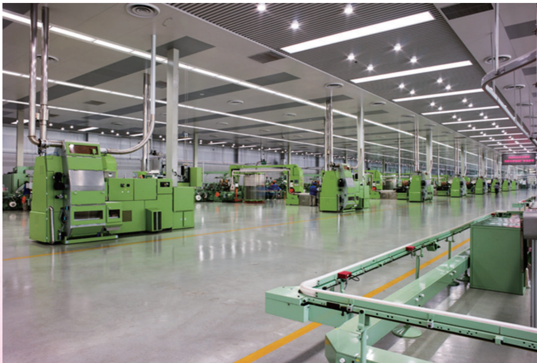
长春卷烟厂“十一五”易地技改新建的现代化卷包生产线