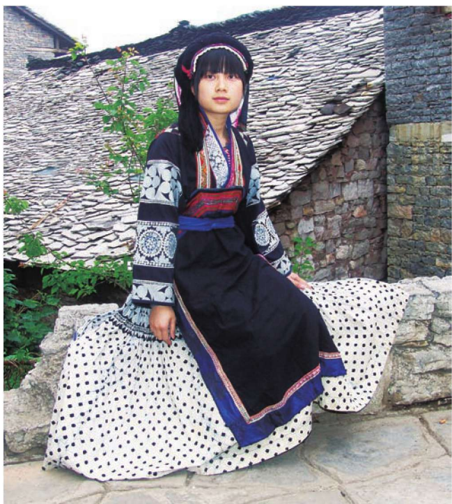
图 1-9 镇宁布依族蜡染服饰

唐书·西南蛮》记载：“男子左衽、露发、徒跣，妇女横布两幅。穿中而贯其首，名为通裙。”在头饰上，布依族妇女是包头帕，挽椎言《史记：西南夷传》谓：