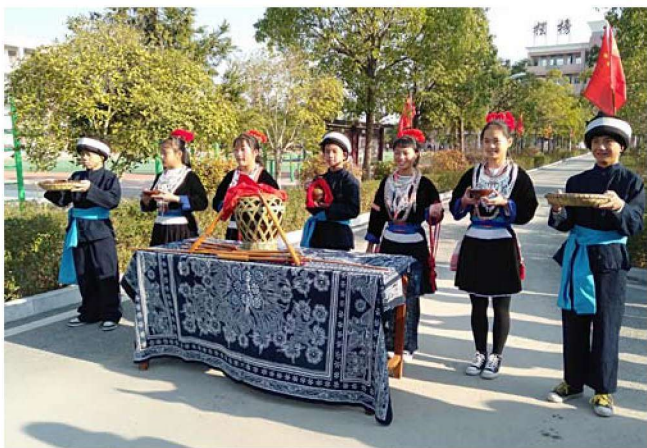
图 1-11 惠水布依族服饰

“西南夷君长以数十，夜郎最大——此皆魁结，耕田，有巴聚。”其头饰沿袭了古越人的特点，由此可见，布依族服饰主要特征是穿裙、椎髻、身、袖、腿都较宽松。清初西南地区的人们还保留着穿传统服饰的习俗，后来发生了一些变化，但至今仍有些地区还保留着短衣长裙的服饰。