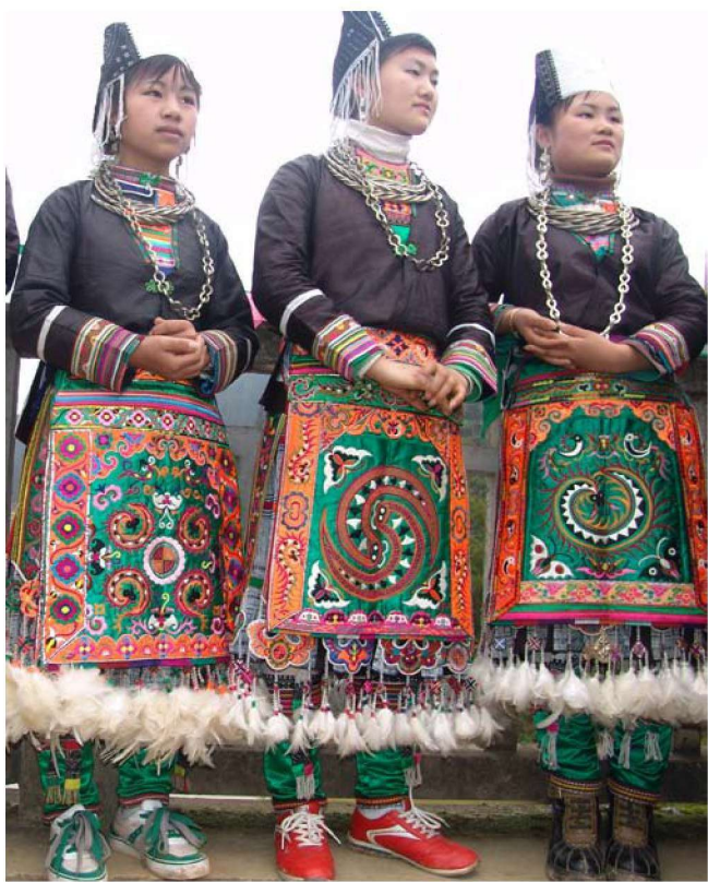
图 1-8 丹寨型榕江苗族蜡染服饰

布依族的祖先自古以来生息繁衍于贵州南盘江、北盘江、红水河流域及其以北地带。根据现有的汉文史籍记载和民族学资料的分析，布依族祖先最早可以追溯到古代的越人。在殷商时期，古越人已大量活动在我国长江以南的广大地区，在历史上由于居住地域以及文化差异，形成称谓不同的许多支系，即“东越”“闽越”“东瓯”“夔越”“南越”“西瓯”“滇越”“骆越”等。布依族来源于“骆越”的一支，分布在广西中北部和贵州南部。春秋时期布依族居住在牂牁江的牂牁国境内，到秦汉时期在牂牁江流域建立夜郎国。布依族传统服饰男着衣衫，妇女着衣裙，有蜡染、挑花、刺绣图案装饰，保留着古老越人的服饰特点。《旧