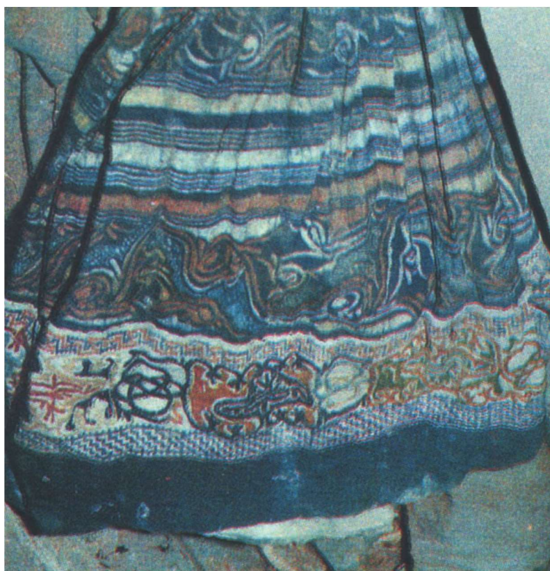
图 1-6 宋代苗族彩色蜡染服饰（局部）