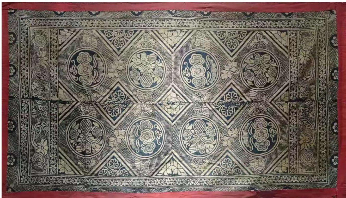
图 1-3 清代中期布依族枫香染实物（惠水洛平陈光举藏）