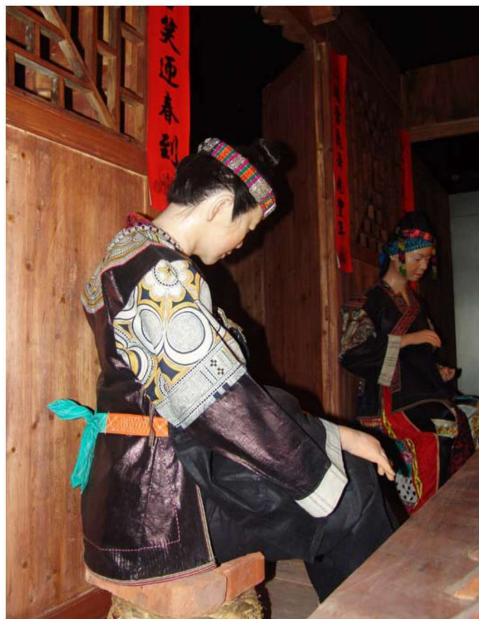
图 1-5 丹寨苗族蜡染服饰