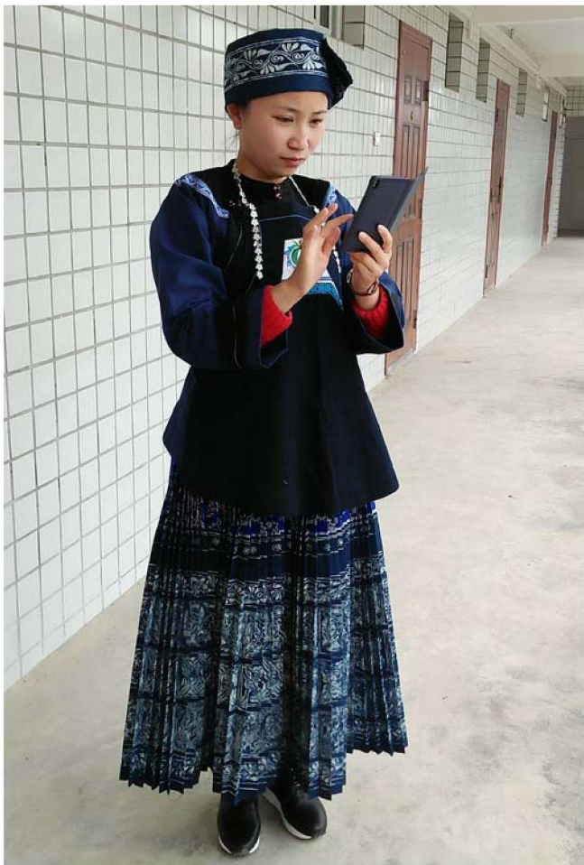
图 1-12 惠水布依族服饰

民间蜡染是布依族传统服饰制作工艺之一，并久负盛名，《宋史》四九三卷记载：“南宁特产名马、朱砂……蜜蜡、蜡染布……”，宋代的南宁州在今惠水县境内，这一带自古以来就是布依族聚居区，南宁州“蜡染布”就是布依族先民的染织制品。由此可见，宋代布依族枫香染或蜡染制作很盛行，而且沿袭了下来。清乾隆《贵州通志·苗蛮》记载：“永丰之罗斛，册享等处……妇人首蒙青花手巾。”民国初年编纂的《关岭县志访册·黄夷》也有布依族妇女“长裙细褶，或青花布为之”的记载，“青花手巾”和“青花布”就是蜡染织品。可见，布依族妇女的服饰装饰与枫香染或蜡染有着密切的关系，至今在大部分地区的布依族还保留着传统枫香染或蜡染技艺，还沿袭着将枫香染或蜡染制品用于日常生活和婚娶嫁的传统，并世代代传承。