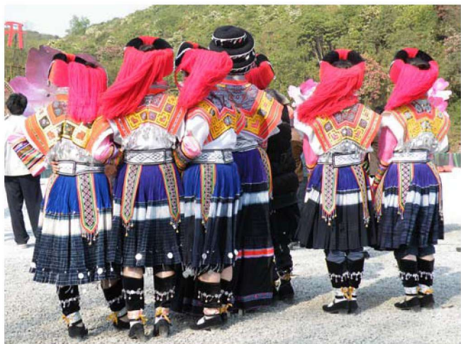
图 1-7 毕节纳雍苗族服饰

自古以来，贵州苗族进行过大规模长期迁徙，他们从中原和长江中下游向西、向南大迁徙，迁入黔、滇、湘、川、鄂、桂、琼深山密林。迁徙到贵州高原的苗族，居住在深山老林，受大山阻道，与外世相隔，外来文化影响较少，自给自足的农耕经济更好地保留着苗族自身传统文化。蜡染技术在中原早已被先进的印花技术所代替。在贵州少数民族群体中大部分仍保留蜡染技术和蜡染服饰。为了便于同一支系民族相认和识别，加强宗族内部的凝聚力，在其服饰纹样和工艺上保持相对的稳定，千年不变，传承至今。