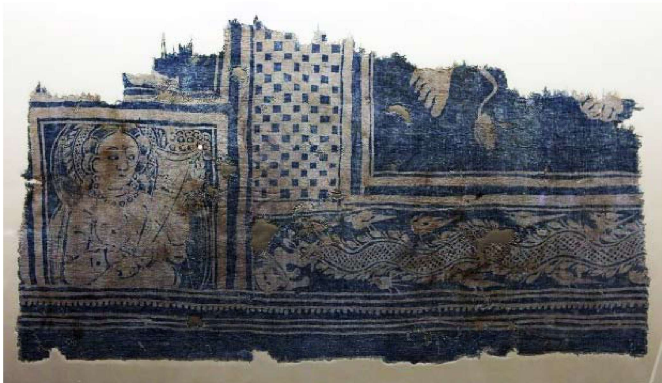
图 1-2 东汉蜡染蓝白印花棉布残片（新疆和田民丰尼雅遗址 1 号墓出土）

画下发现的唐代废置的大量蜡缬残幡，从丝绸之路上出土的蜡缬实物和日本正仓院收藏的我国唐代时期蜡染物品为实物证据。到宋代以后，中原及江南地区生产力水平提高，用石灰豆浆作为防染剂的“药斑布”即后世称为“蓝印花布”，由于加工成本较低、生产效率高，这种技术逐渐被广泛运用，蜡染技术被淘汰，从此以后蜡染在全国各地开始从高潮走向低谷。元、明、清时代由于封建统治者对蜡染“药斑布”的排挤，使染织生产业受到严重影响。到了清朝末期，西方化学合成染料大量引进，如“阴地科素”和“阴丹士林”进入我国染织市场，我国中原及江南地区的传统蜡染工艺及靛蓝染料技术逐渐被先进印花工艺和技术取代，蜡染文化在中原及江南地区逐渐消失，而迁徙到西南地区的贵州少数民族由于受到大山阻隔，交通闭塞，自给自足农耕经济的影响，蜡染工艺得到很好的保存和发展。如今西南地区特别是贵州布依族、苗族、水族、瑶族、仡佬族，以及侗家等的居住地区，将蜡染（枫香染）文化代代传承（说明：枫香染是蜡染的变种，原型一样，只是防染材料不同）。