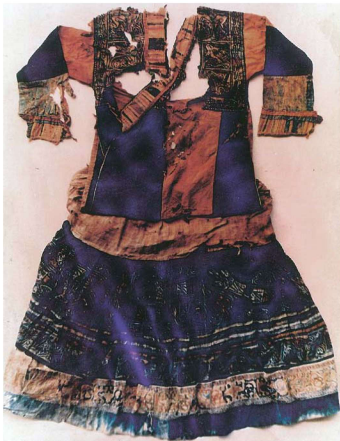
图 1-4 宋代苗族彩色蜡染服饰（1987 年出土于平坝桐材洞）