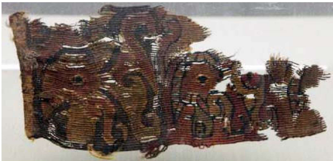
图 1-1 汉代鹿头纹毛织物残片（新疆洛浦山普拉 2 号墓出土）

据《中国染织史》一书记载，距今约三万年的山顶洞人就使用氧化铁的矿物质为染料。进入新石器时代，人们在应用矿物质染料的同时开始使用植物为染料。到商代，人们获取了红、黄、蓝三原色，并用它们染出丰富的间色和复色。周代有专职的“染人”从事染色职业生活。春秋时代，生产力发展，原来用的蓼蓝鲜叶浸液染色改进为制成靛蓝后再进行染色。《礼记》等文献记载，丝染色当时设有专官主管，楚国还设有主持生产靛青的“蓝尹”工官。据史料研究，中