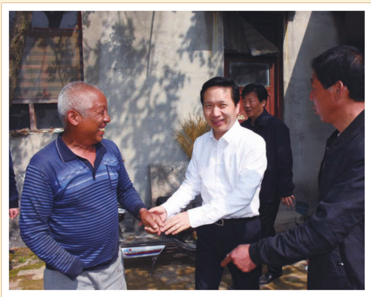
2018年4月27日，中共河北省委副书记赵一德在邢台市广宗县调研脱贫攻坚工作。图为赵一德在郭家屯村入户走访贫困群众。