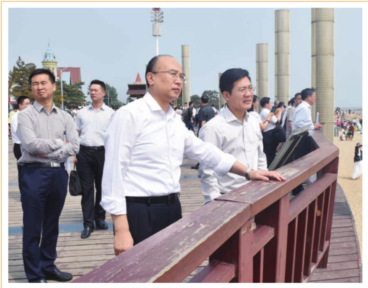
2018年6月16日，中共河北省委副书记、省长许勤就旅游服务保障工作到秦皇岛市调研检查。图为许勤调研检查老虎石海水浴场时，详细了解旅游场所服务保障情况。