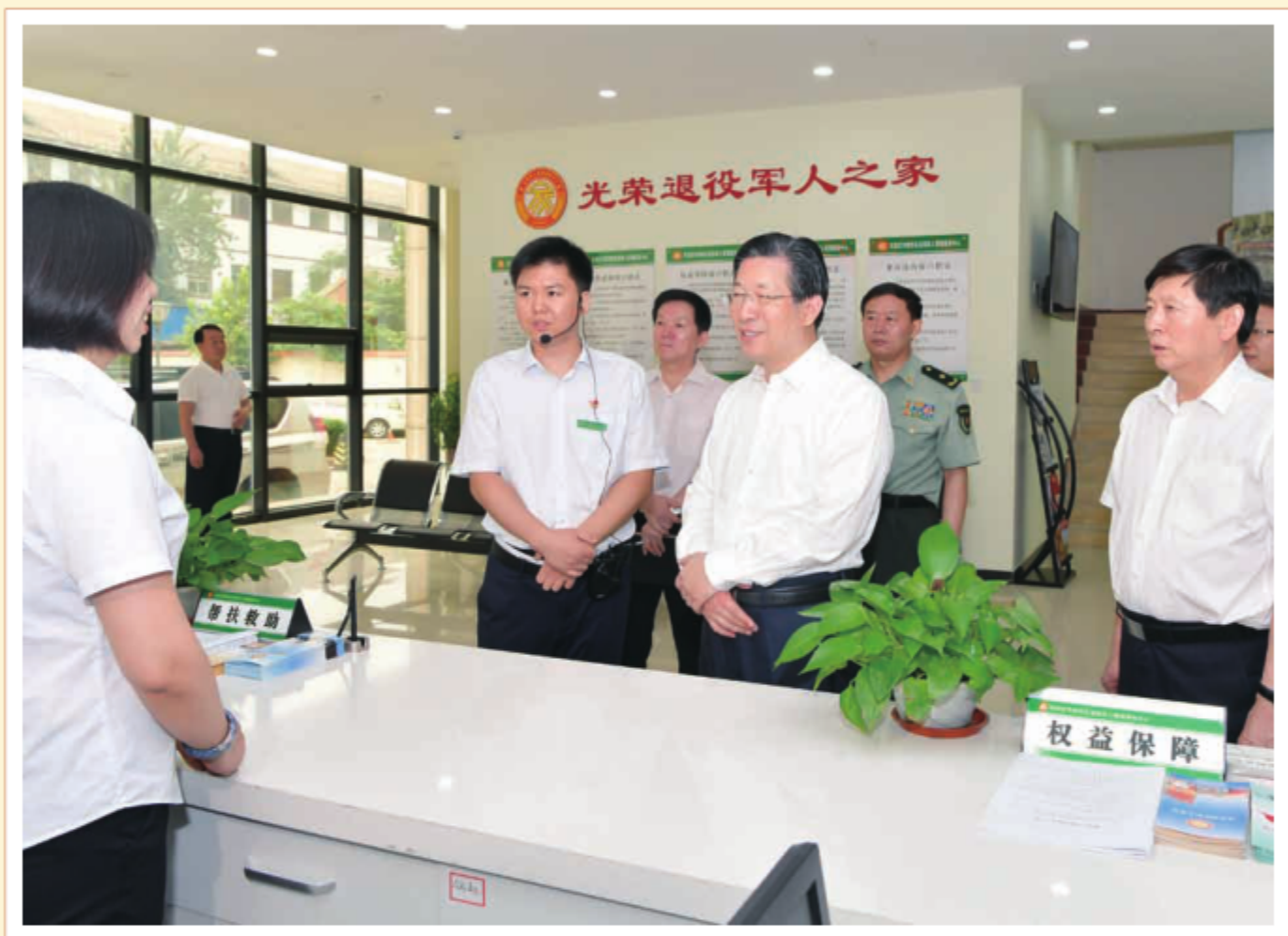
2018年7月27日上午，在八一建军节即将到来之际，中共河北省委书记、省人大常委会主任王东峰到石家庄市调研检查退役军人管理服务机构工作并走访慰问退役军人。图为王东峰在石家庄市新华区退役军人管理服务中心，详细了解管理服务场所和设施的建设运行情况。