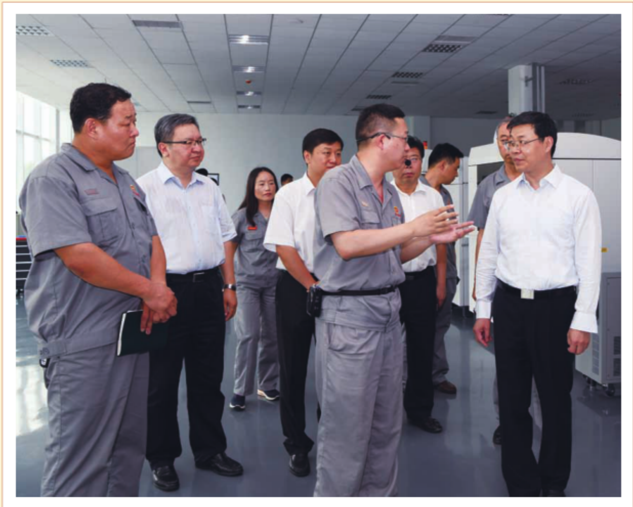
2018年7月19日，中共河北省常委、组织部部长梁田庚到敬业集团（平山县）进行“双创双服”包联企业调研。 图为梁田庚参观河北敬业增材制造科技有限公司3D打印项目。