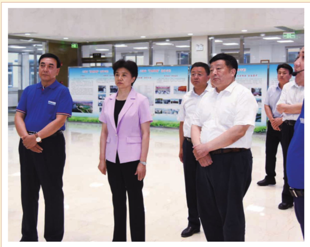
2018年6月13日，中共河北省常委、省纪委书记、省监委主任梁惠玲到廊坊市调研。图为梁惠玲在三河同飞制冷股份有限公司考察。