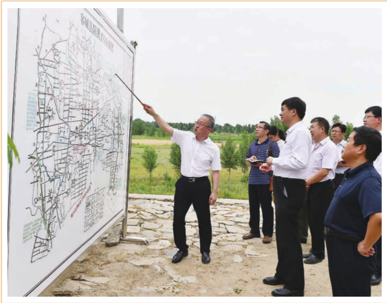
2018年6月8日，中共河北省常委、雄安新区党工委书记陈刚到南拒马河调研防汛工作。图为陈刚听取容城县防洪工程有关情况介绍。