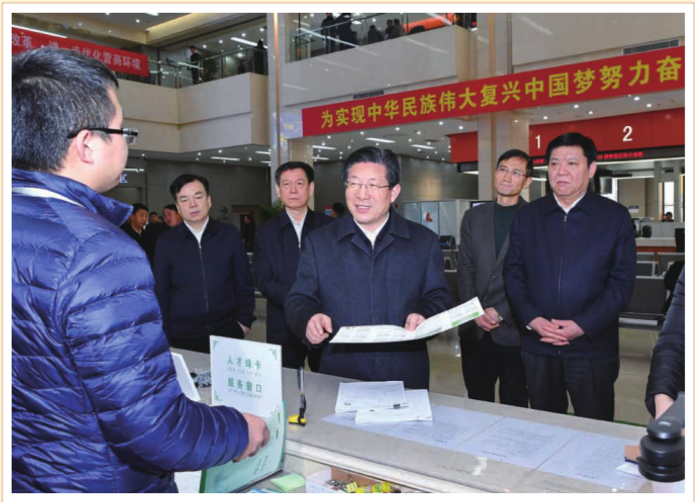
2018年12月14日下午，省委书记、省人大常委会主任王东峰到石家庄市行政服务中心、裕华区尖岭小区社区、裕东街道暗访检查。图为王东峰在石家庄市行政服务中心仔细考察服务窗口，深入了解商事登记、人才引进、项目建设等方面审批情况。