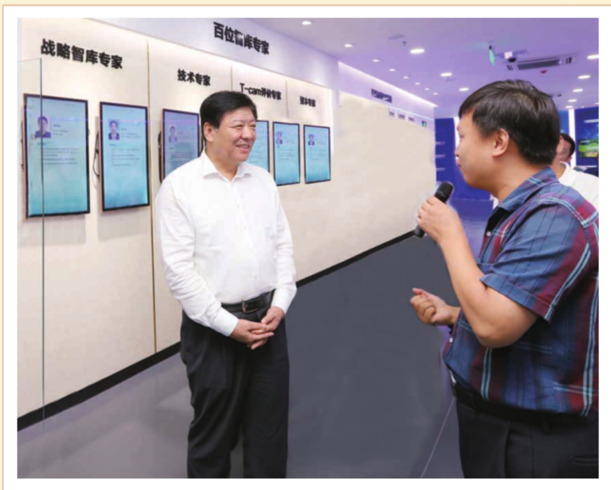
2018年8月29日，全省“双创双服”活动观摩调度会议在衡水召开。中共河北省常委、常务副省长袁桐利出席会议并讲话。图为袁桐利在衡水市科创中心听取有关工作情况介绍。