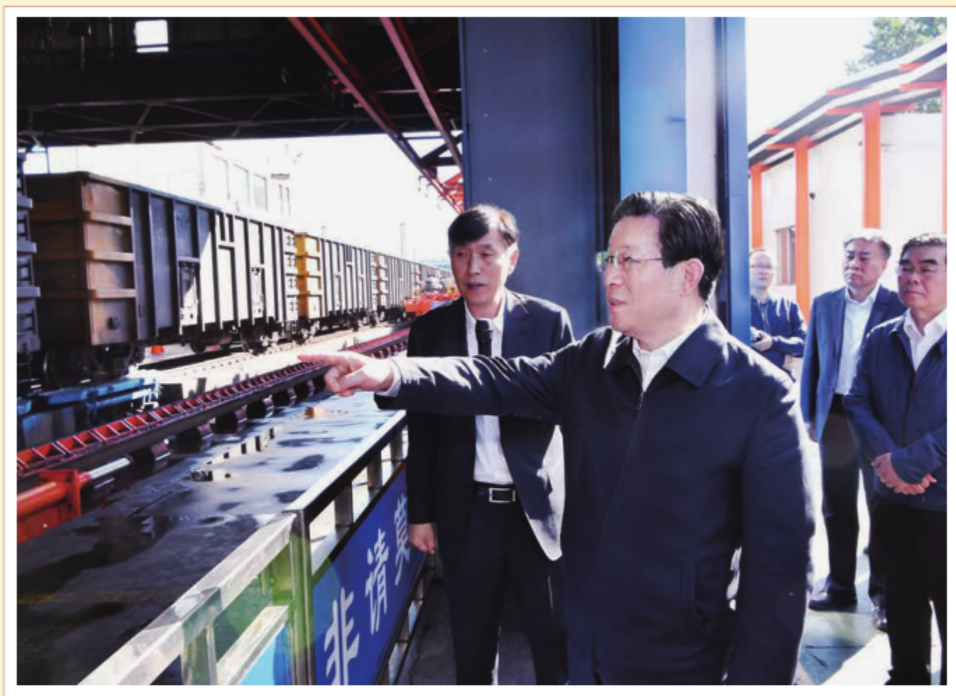
2018年10月1日至2日，中共河北省委书记、省人大常委会主任王东峰到秦皇岛市调研检查。图为王东峰在秦皇岛港第六分公司卸车机房详细了解煤炭码头转型改造情况。