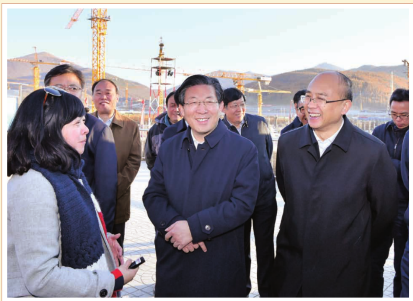
2018年10月11日至13日，中共河北省委书记、省人大常委会主任王东峰，省委副书记、省长许勤到张家口市调研检查。图为12日王东峰、许勤考察崇礼太子城冰雪小镇规划建设情况。