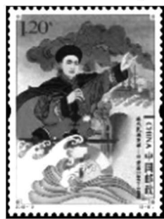
图二:近代民族英雄邓世昌纪念邮票