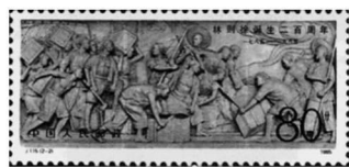
图一:林则徐诞生二百周年纪念邮票

历史主题的纪念邮票是我们丰富历史知识的窗口。通过邮票方式纪念历史上的重要人物、事件和现象,反映着一个民族的情感态度和价值取向。