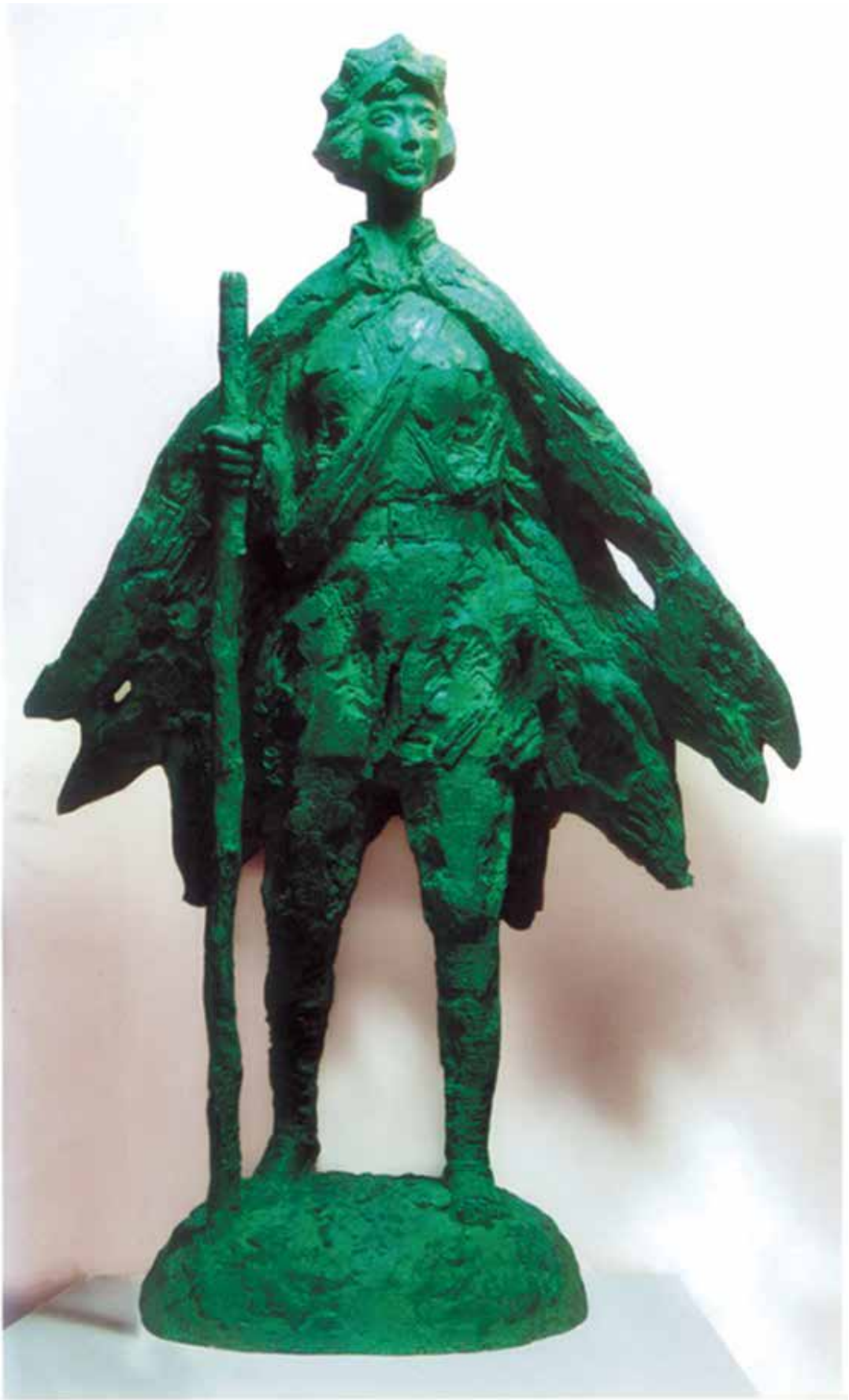
路漫漫 青铜 85cm×134cm×50cm 2004年