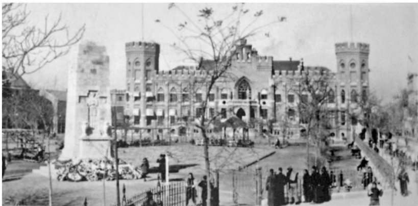
图 1-1-4 英租界工部局

路),西北起至宝士徒道(今营口道),东南至博目哩道(今彰德道),占地 30.67 公顷(460 亩),后被称为“原订租界地”。英租界设立后,在开发过程中不断向周边扩张。1894 年甲午战争后,英国要求向西扩大租界至墙子河内侧,扩大面积计 1 630 亩。经 3 次扩展,英租界面积共达 6 149 亩。