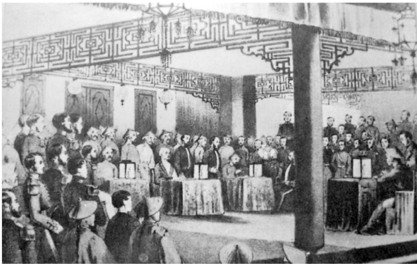
图 1-1-1 1858 年 6 月在海光寺签订《天津条约》情景

1858 年 5 月 20 日,英法联军舰队开始进攻大沽炮台,战斗进行了 1 个多小时,炮台失陷。随后,英法与美俄联军水陆并进,抵达津郊,清朝派大学士桂良等与其谈判,被迫接受侵略者的条件。6 月 26 日和 27 日,中英、中法分别签订《天津条约》56 款附约 1 款、42 款附约 6 款。其中规定:外国公使驻北京,开放牛庄、登州、南京、镇江等口岸,外国军舰、商船可驶入长江及各通商口岸;修改税则;外国传教士得入内地自由传教;进一步明确有关领事裁判权的规定;清朝对英赔款 400 万两,对法赔款 200 万两。《天津条约》的签订,反映出外国已把注意力从南方转移到北方,直接威胁清朝统治的核心——北京。在此以前,沙俄已经