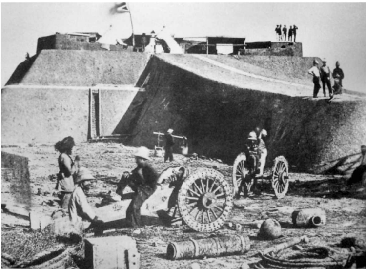
图 1-1-2 1860 年 8 月,英法联军攻占北塘炮台