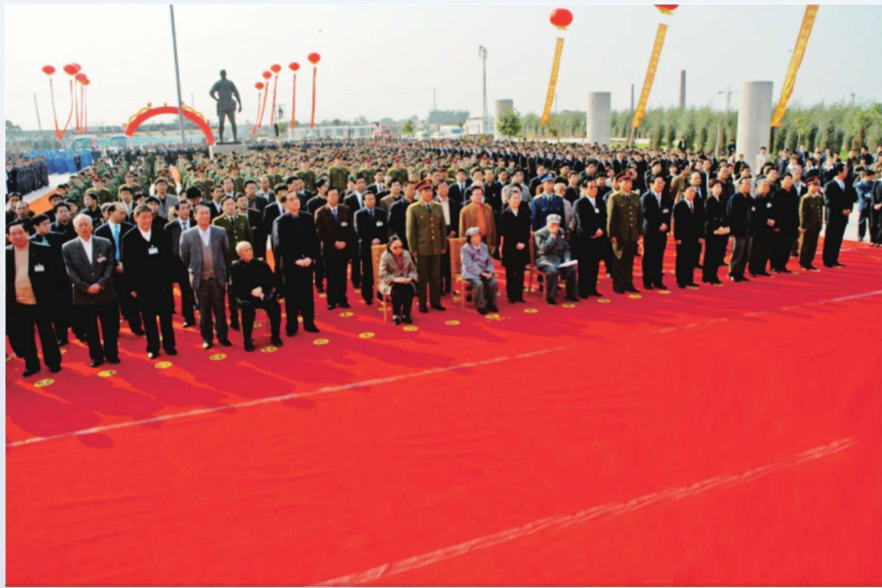
2006年10月，董振堂事迹陈列馆揭幕仪式