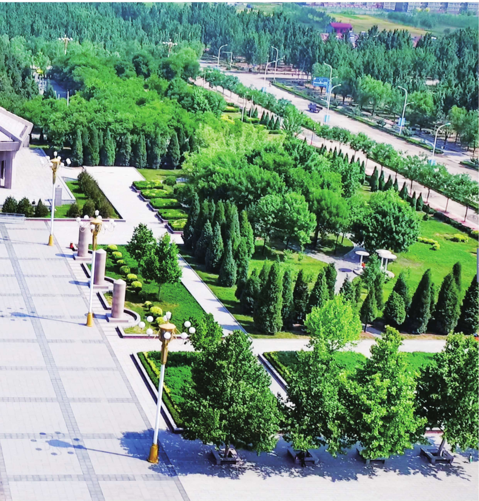
董振堂事迹陈列馆