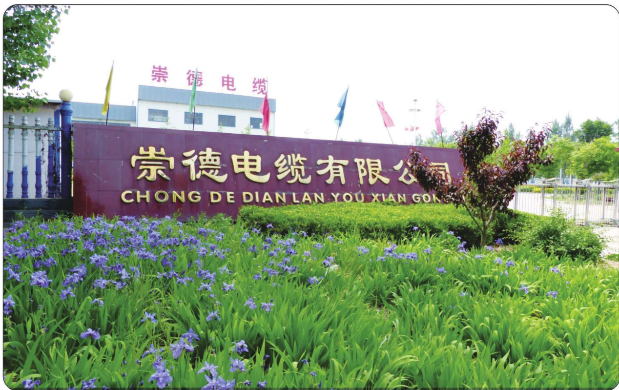
崇德电缆有限公司