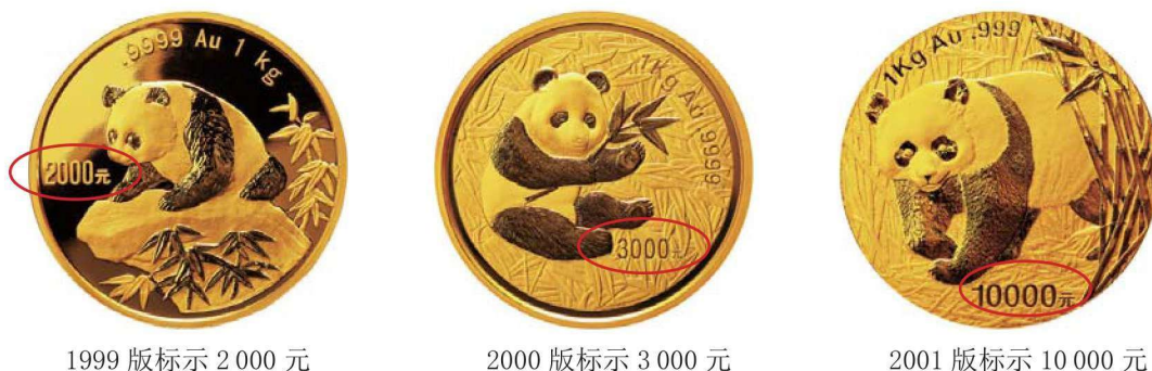
图 1-5 中国熊猫币 1 千克规格面值调整

在以克为计量单位的中国熊猫币中，还有三枚特殊的熊猫铜币，面值标示“壹圆”；以及 2017 年“中国熊猫金币发行 35 周年纪念”熊猫双金属币是盎司改克后的第一枚，面值标示“500 元”。