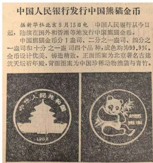
图 1-2 1982 年 9 月 16 日《人民日报》报道中国熊猫金币发行新闻

中国熊猫币之所以从“出生”的那刻起，就引起了世人广泛和高度的注视；这让我们想起一个组织——世界自然基金会（WWF），它是全球享有盛誉的、最大的独立性非政府环境保护组织之一；1961 年成立，总部在瑞士格朗。为什么世界自然基金会（WWF）选择熊猫作为标志呢？是 1961 年，中国大熊猫“熙熙”被英国伦敦动物园借展，造成了万人空巷的景象。世界自然基金会（WWF）意识到一个具有影响力的组织标志是可以克服语言障碍而得到全世界人们的认同，于是将胖乎乎的人见人爱的大熊猫选为该组织的象征，成为国际组织的标志。