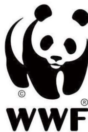
（世界自然基金会标志）