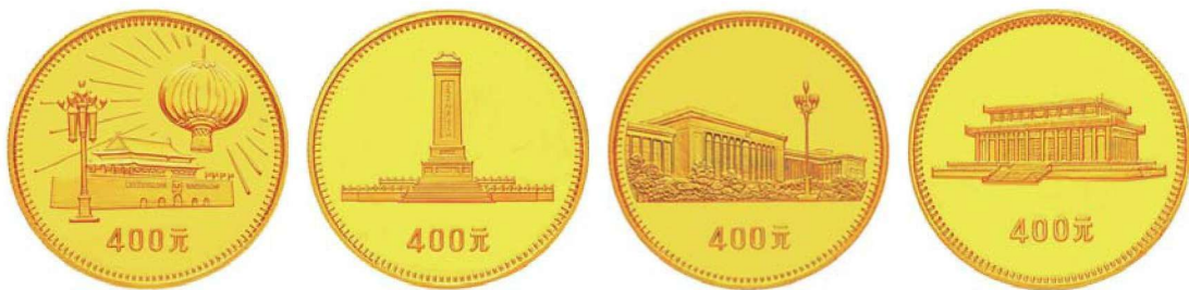
图 1-6 中华人民共和国成立 30 周年纪念金币背面图案

1982 年初，经中国人民银行总行同意，在朱纯德等相关单位领导的主持下，克服了高精度铸币设备的缺乏，反复琢磨雕刻工艺，历时半年多，终于研制出中国第一枚——熊猫普制金币。