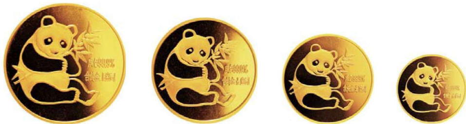
图 1-1 1982 版熊猫普制金币

那中国熊猫币是如何诞生的呢？在20世纪80年代初期中国人民银行委派享有“中国现代金银币之父”美誉的朱纯德先生率代表团赴美国、加拿大等国考察。考察的任务：