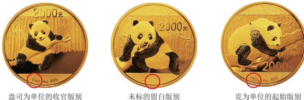
盎司为单位的收官版别

以盎司为主要规格的中国现代贵金属纪念币的发行，在 2015 年画上了句号，于是出现了中国熊猫币唯一的未标注重量、材质与成色的背面图案。在标注上形成了 2014 版以盎司为单位的收官版别，2015 版的留白版别，2016 版以克为单位的起始版别（见图 1-4），这么一个特殊的转换承接的现象。有人认为，国家经济经过几十年的巨大发展，是时候将盎司改为克，争取中国在国际黄金市场的话语权和定价权。