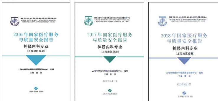
图 1-3 连续三年出版国家医疗服务及质量安全报告白皮书

数据库建立以来,4S 数据库中已经纳入了累计近 10 万的急性缺血性卒中病例数据,为今后开展上海地区卒中人群特点的研究建立了良好的基础。截至 2019 年,我们已经连续出版了三部省级神经内科临床质量控制白皮书(图 1-3)。