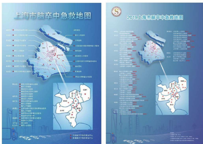
图 1-2 2017 年版和 2019 年版本上海地区脑卒中急救地图

数据库建立以来,4S 数据库中已经纳入了累计近 10 万的急性缺血性卒中病例数据,为今后开展上海地区卒中人群特点的研究建立了良好的基础。截至 2019 年,我们已经连续出版了三部省级神经内科临床质量控制白皮书(图 1-3)。