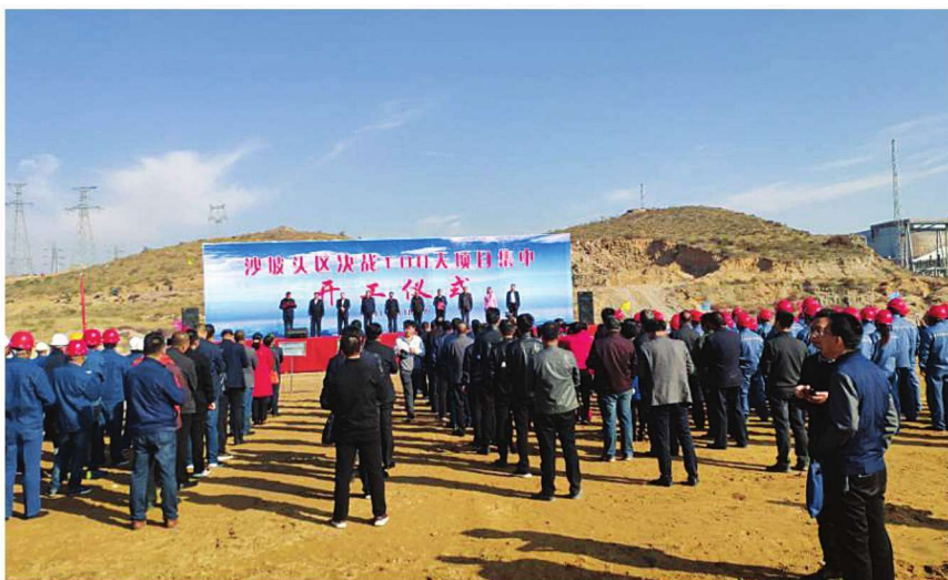
2018年10月17日上午,沙坡头区举行“决战100天”项目集中开工仪式