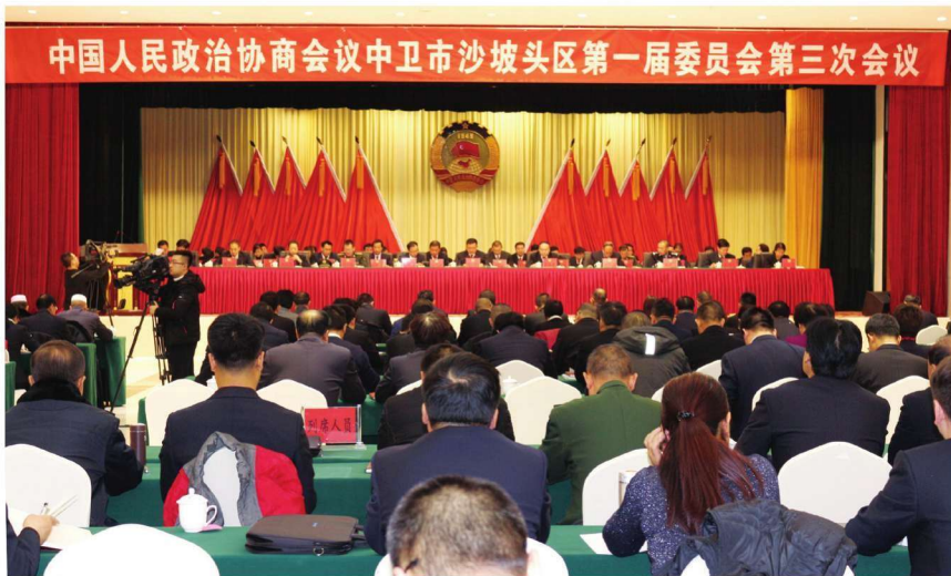
2018年1月5日,政协沙坡头区委员会召开第一届委员会第三次会议