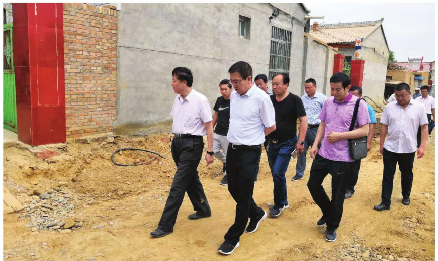
2018年6月26日,自治 区住房与城乡建设厅相关人 员到沙坡头区督导美丽村庄 建设