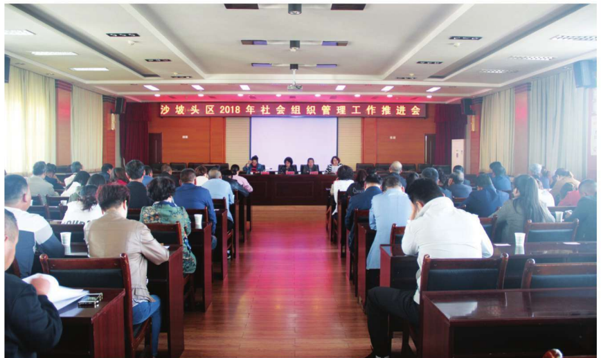
2018年4月25日,沙坡头区召开社会组织管理工作推进会