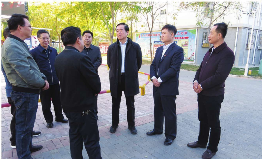
2018年10月26日,自治区党委常委、纪委书记许传智(右三)调研文昌镇五里村村级权力监督平台