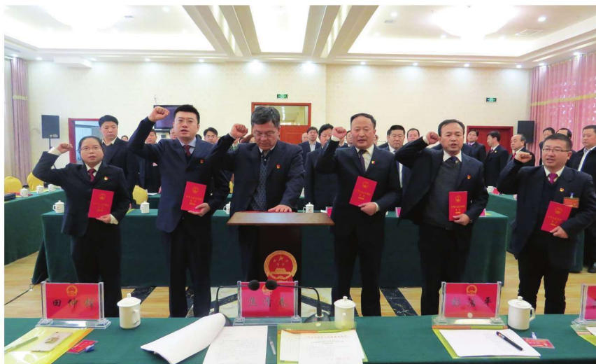
2018年1月7日,沙坡头区第一届人民代表大会常务委员会第十一次会议选举产生的监察委员会副主任、委员向《中华人民共和国宪法》宣誓就职