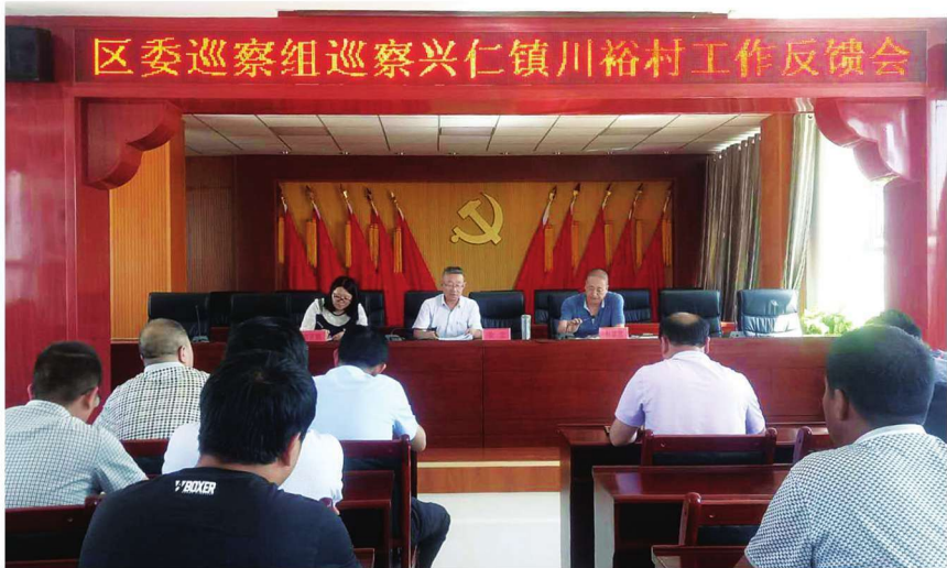
2018年7月11日,沙坡头区委巡察组召开巡察兴仁镇川裕村工作反馈会