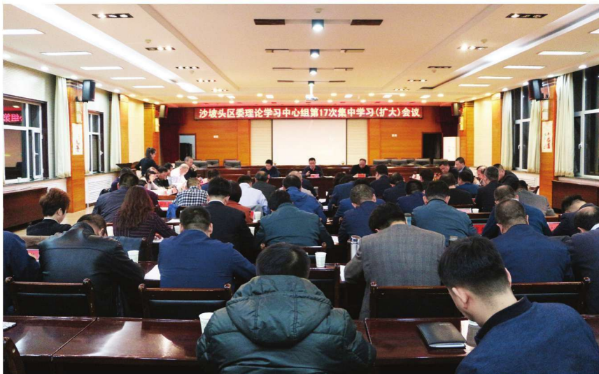
2018年11月12日,沙坡头区委召开中心组第十七次集中学习(扩大)会议