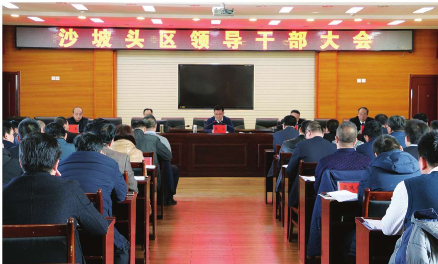
2018年2月1日,沙坡头区召开领导干部大会