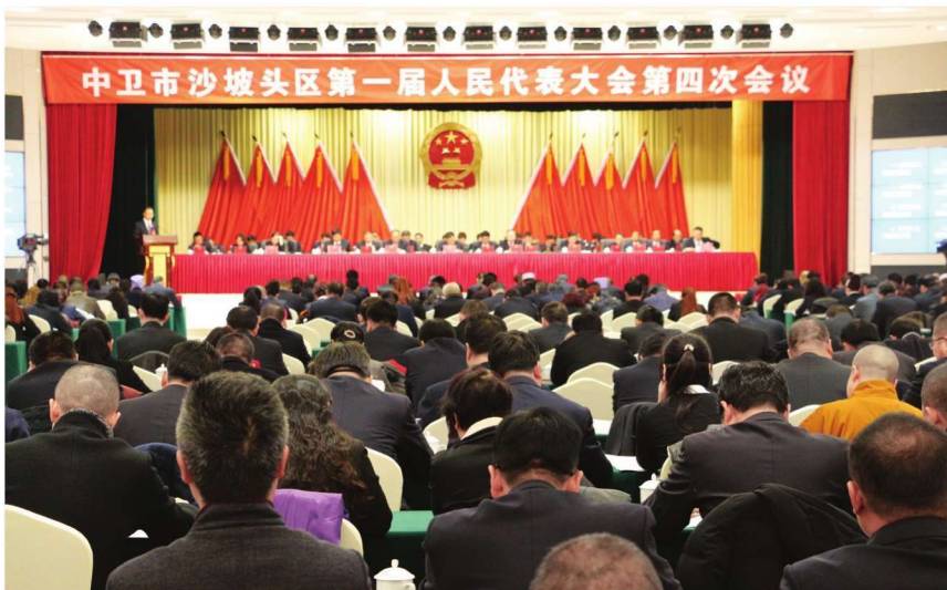
2018年1月5日—7日,沙坡头区召开第一届人民代表大会第四次会议