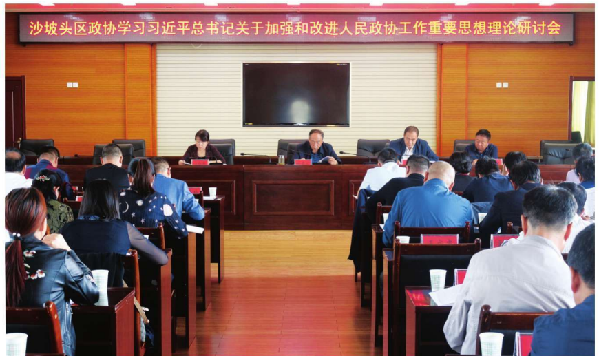
2018年9月6日,沙坡头政协组织召开学习习近平总书记关于加强和改进人民政协工作重要思想理论研讨会