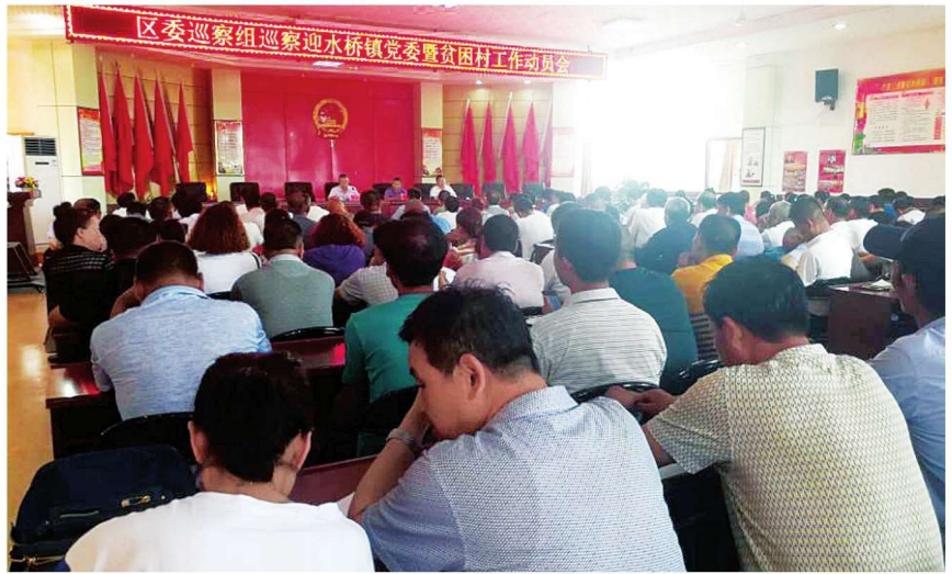
2018年7月18日,沙坡头区委巡察组召开巡察迎水桥镇党委暨贫困村工作动员会