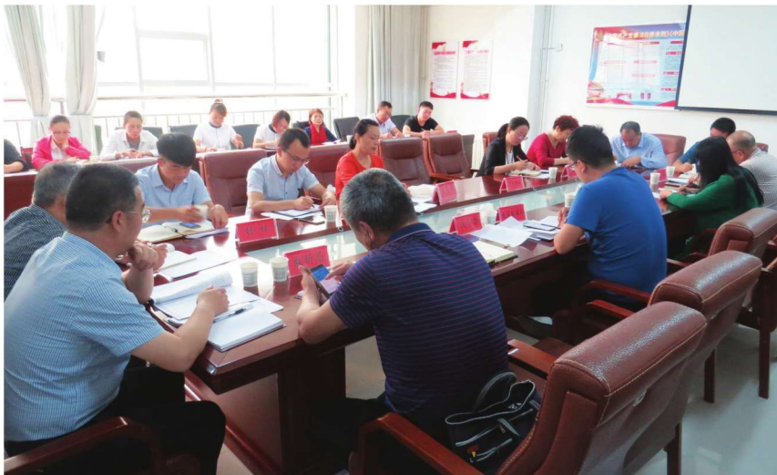
2018年8月8日,中卫市发改委调研组到沙坡头区发改局视察调研并召开座谈会