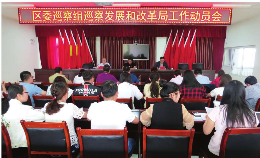
2018年5月25日,沙坡头区委巡察组召开巡察发展和改革局工作动员会