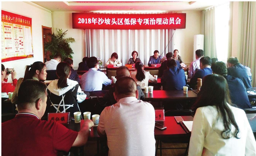
2018年5月11日,沙坡头区召开低保专项治理工作动员会