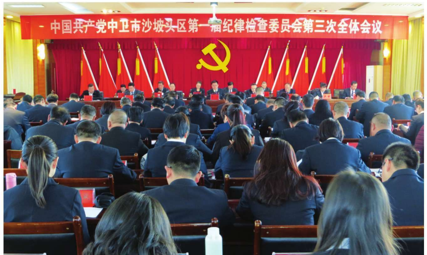
2018年2月11日,中共中卫市沙坡头区纪律检查委员会召开第一届委员会第三次全体会议