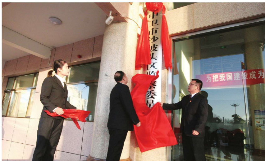
2018年1月8日,中卫市沙坡头区监察委员会挂牌成立