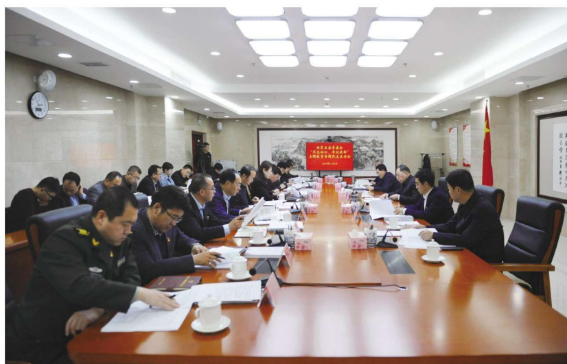
2019年12月4日，西夏区委召开“不忘初心、牢记使命”主题教育专题民主生活会