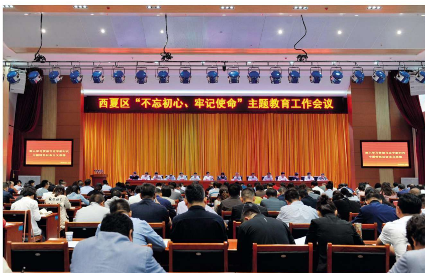
2019年9月11日，西夏区召开“不忘初心、牢记使命”主题教育工作会议