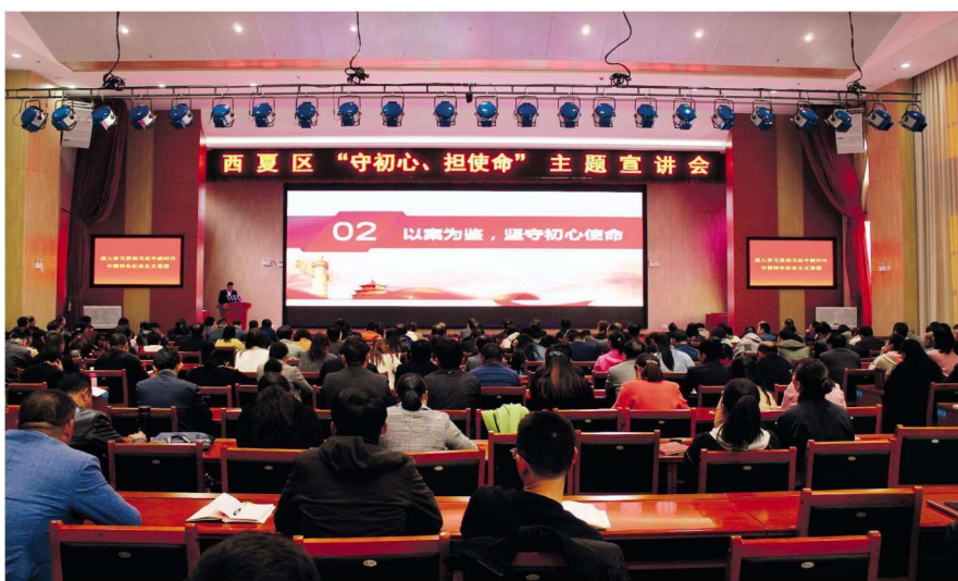
2019年10月22日，西夏区举办“守初心、担使命”主题宣讲会