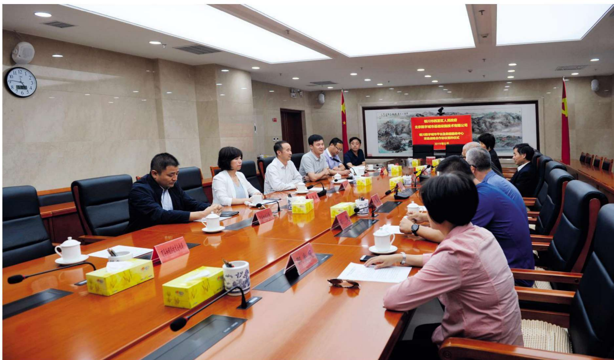
2019年5月31日,西夏区政府与北京数字城市基础设施技术有限公司签订银川数字城市平台及数据服务中心项目战略合作协议