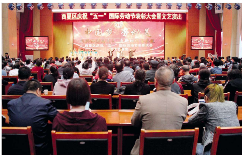
2019年4月25日， 西夏区举办庆祝“五一”国 际劳动节表彰大会暨文艺 演出