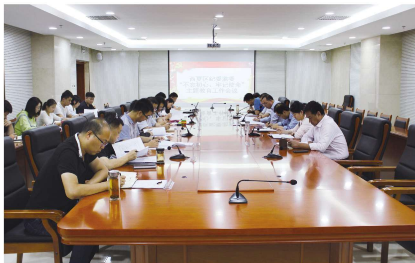
2019年9月12日，西夏区纪委监委召开“不忘初心、牢记使命”主题教育工作会议