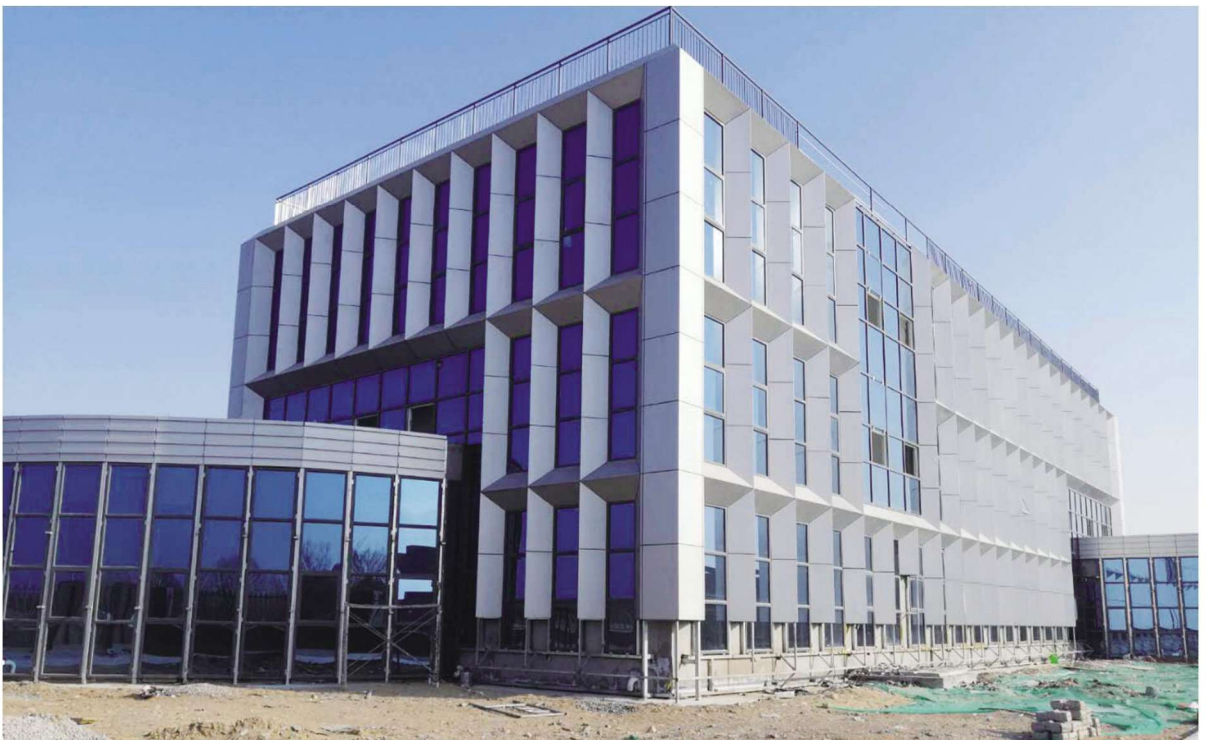
西夏区妇幼保健服务中心建设项目