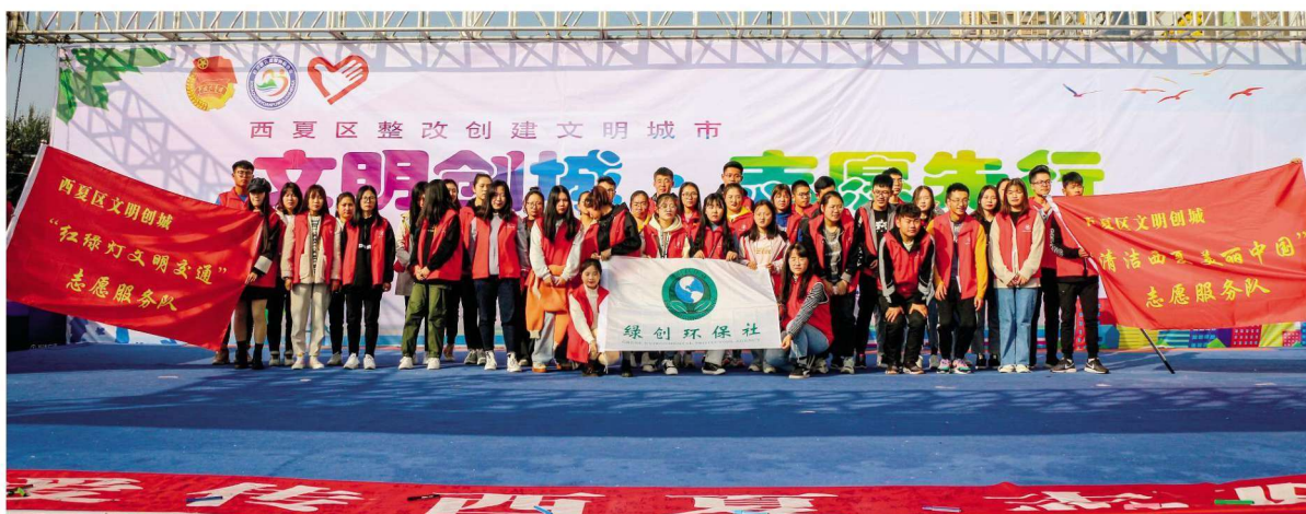
2019年10月15日,西夏区举办整改创建文明城市志愿服务誓师大会