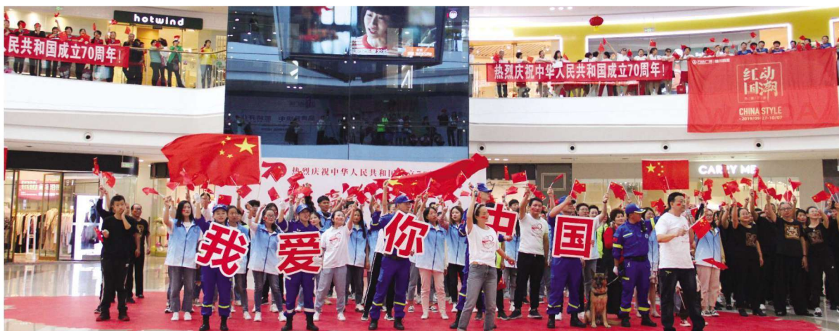
2019年9月28日,西夏区团委在西夏万达举办我和我的祖国快闪活动