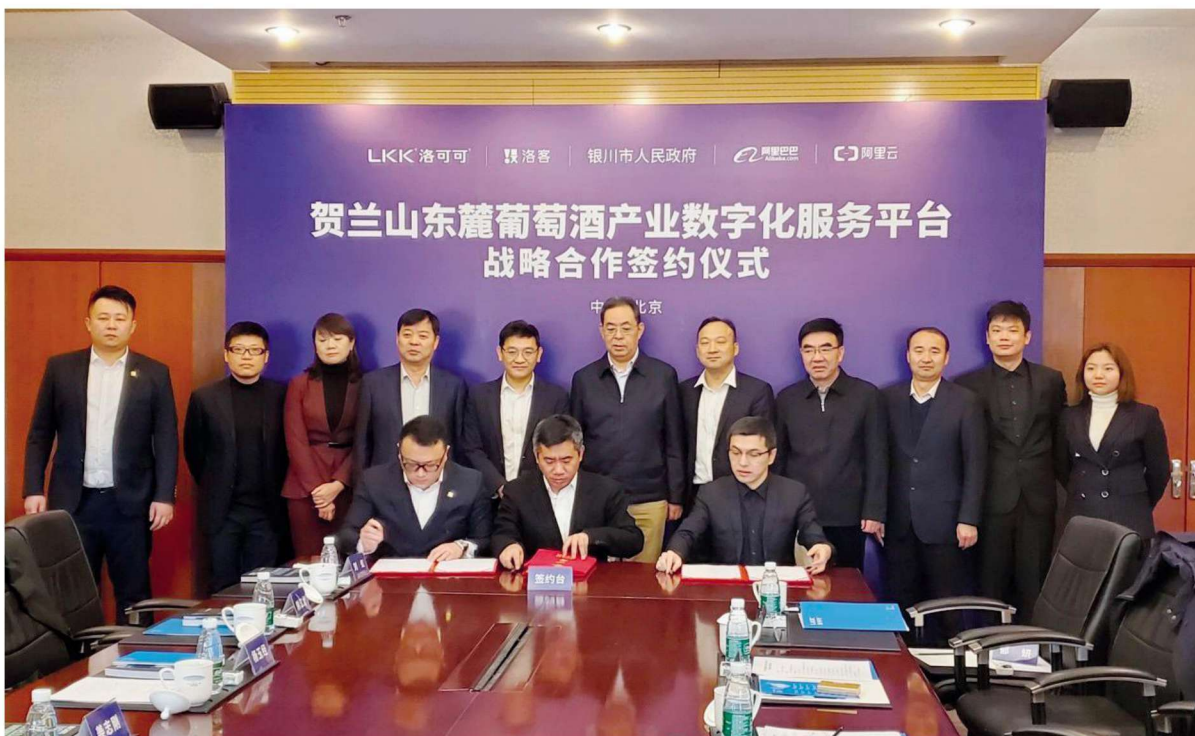
2019年12月22日,西夏区与洛可可创新设计集团、阿里云签订贺兰山东麓葡萄酒产业数字化服务平台战略合作签约仪式