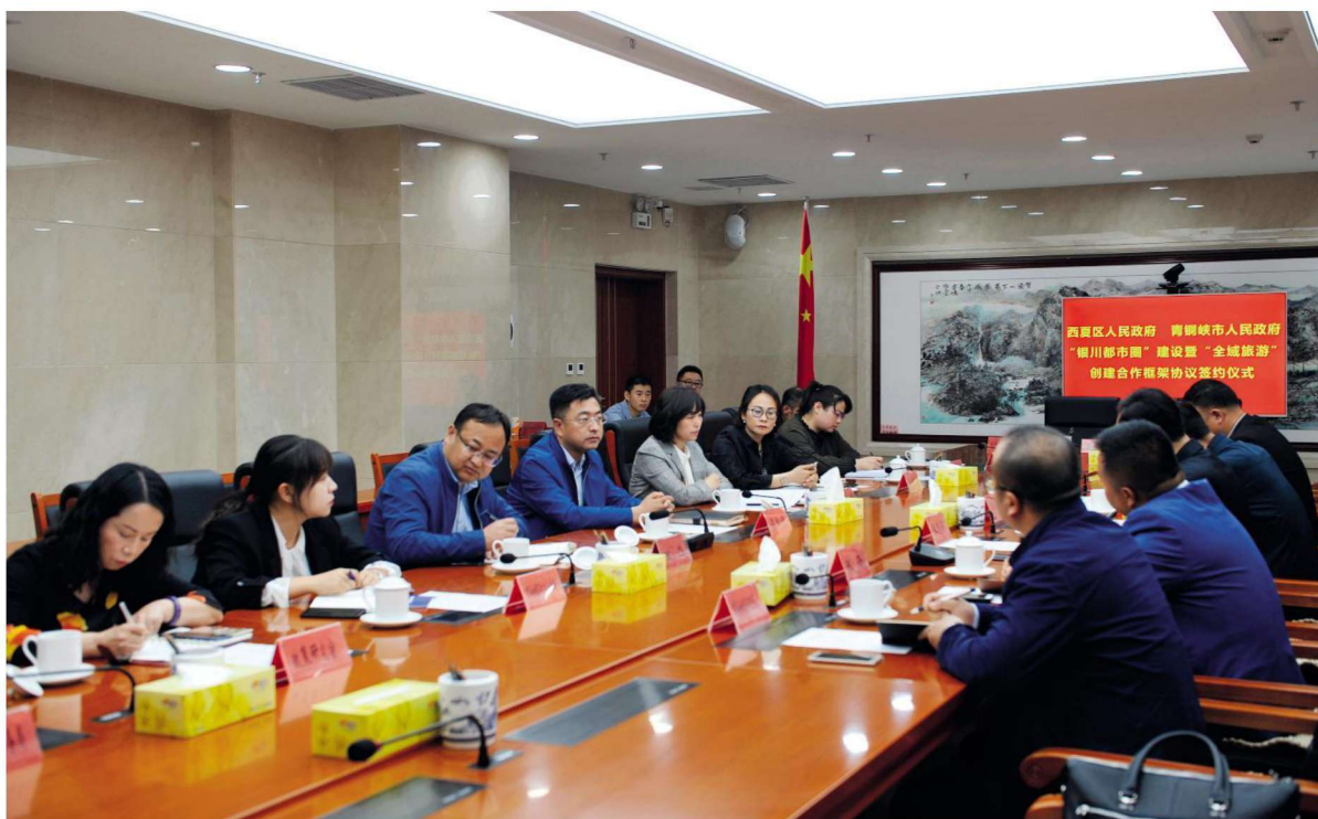
2019年5月14日,西夏区政府与青铜峡市政府举行“银川都市圈”建设暨“全域旅游”创建合作框架协议签约仪式