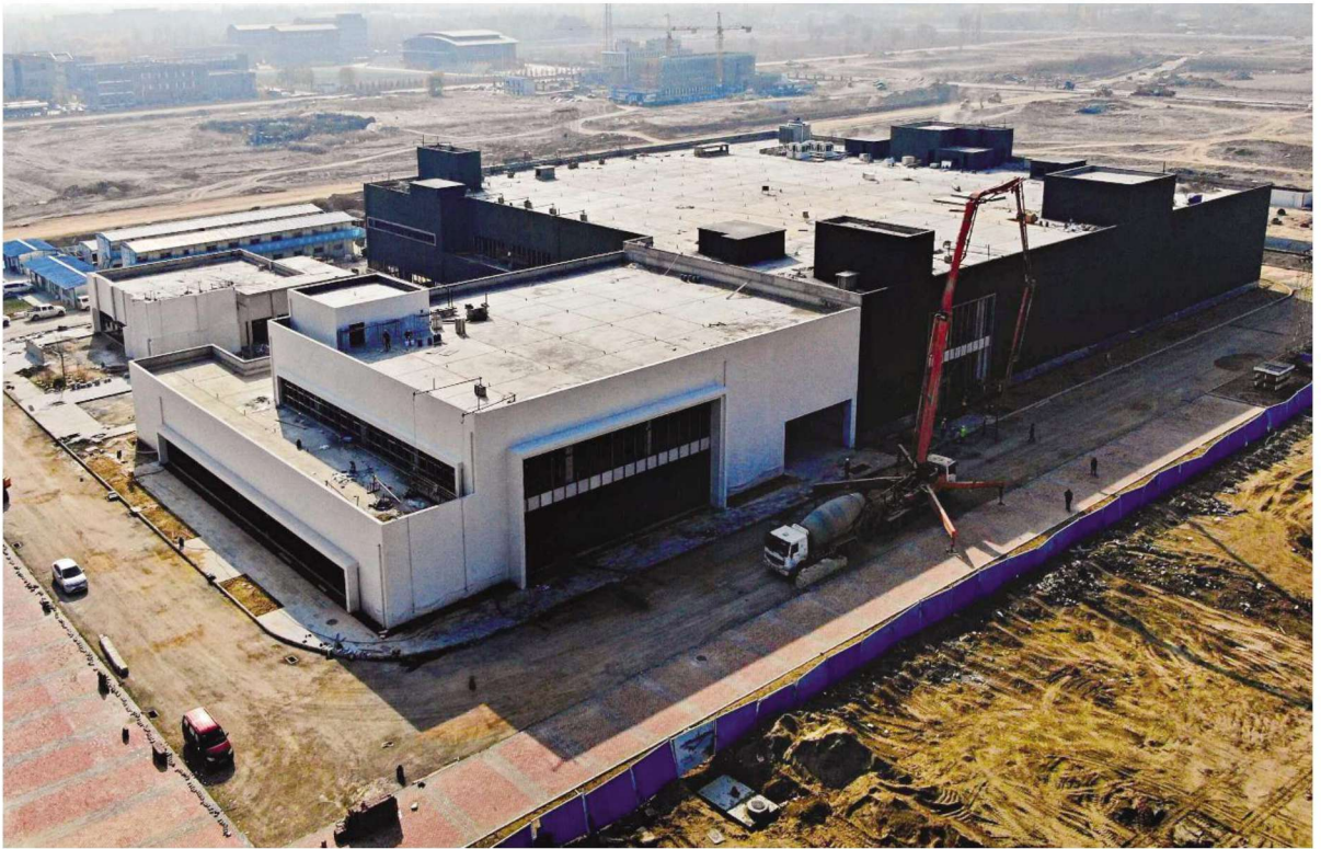
宁夏储芯集成电路产业研发中心项目