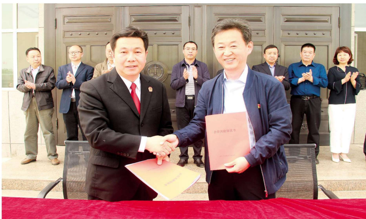
2019年4月19日,院校合作共建“教学实践基地”暨“大学生志愿者基地”在西夏法院签约揭牌