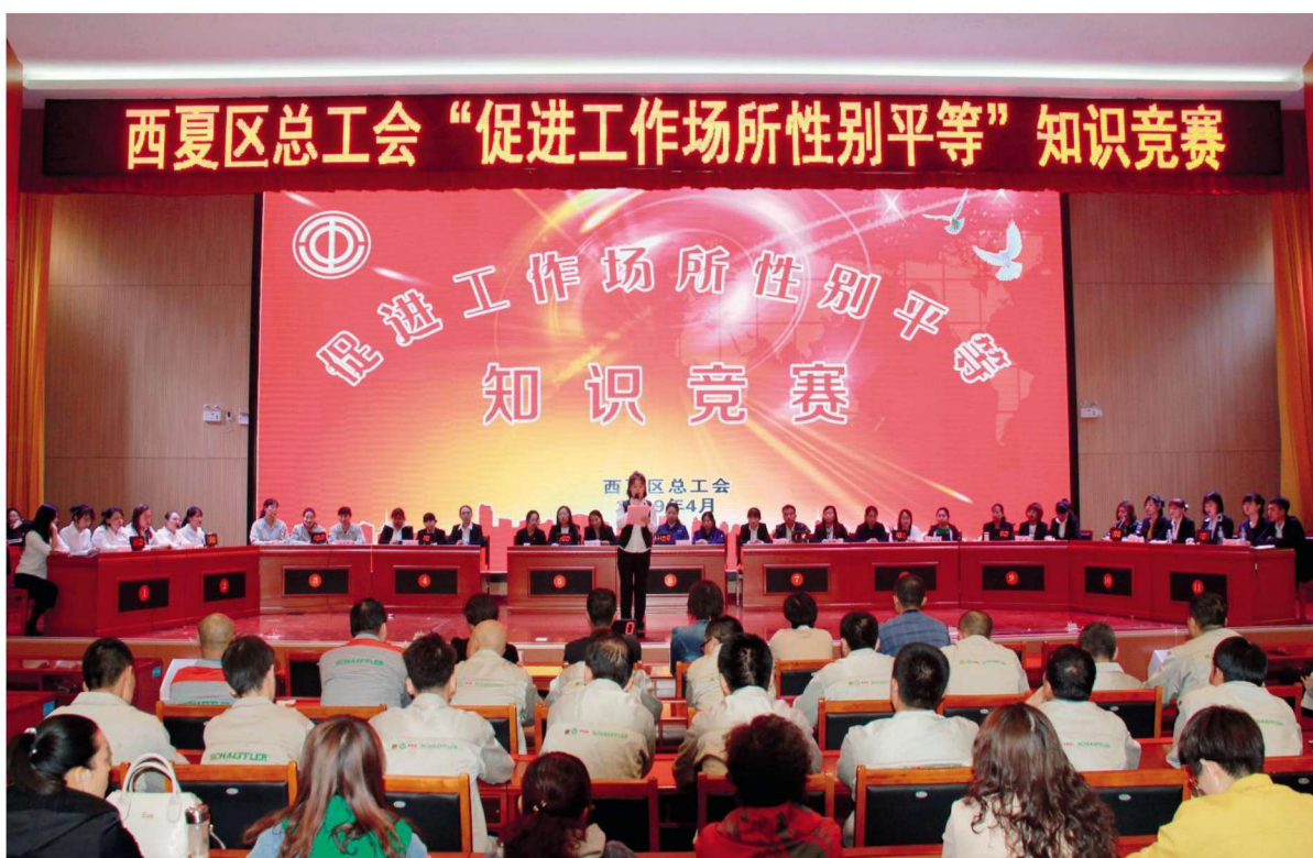
2019年4月3日,西夏区总工会举办“促进工作场所性别平等”知识竞赛