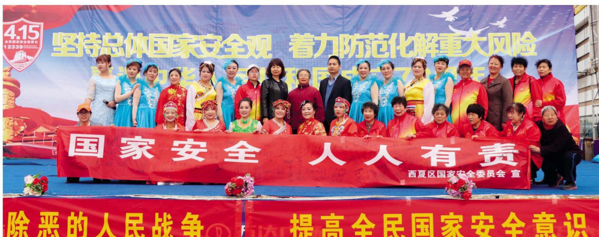
2019年4月15日,西夏区举办“4·15”国家安全教育日暨扫黑除恶专项斗争宣传活动