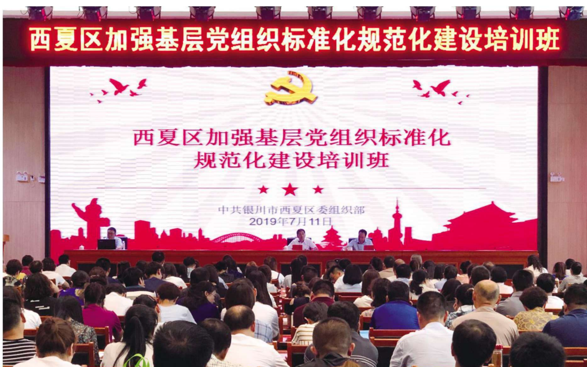
2019年7月11日,西夏区委组织部举办加强基层党组织标准化规范化建设培训班