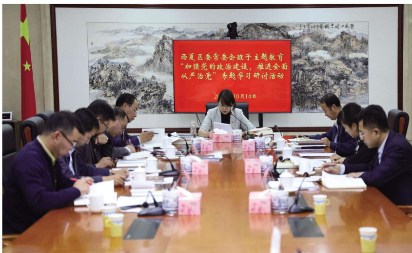
2019年10月14日，西夏区委举办常委班子主题教育专题学习研讨活动