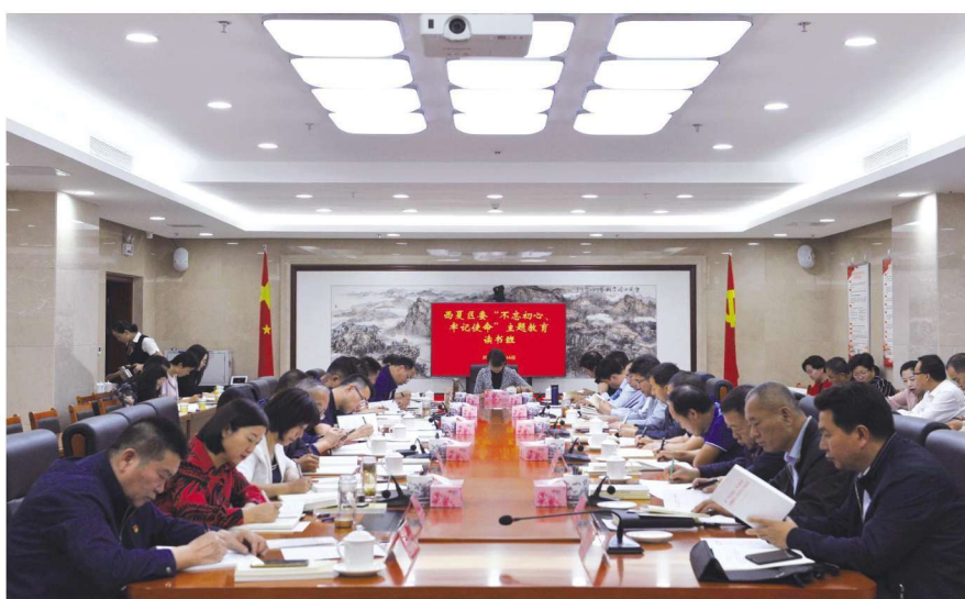
2019年9月16日，西夏区委举办“不忘初心、牢记使命”主题教育读书班