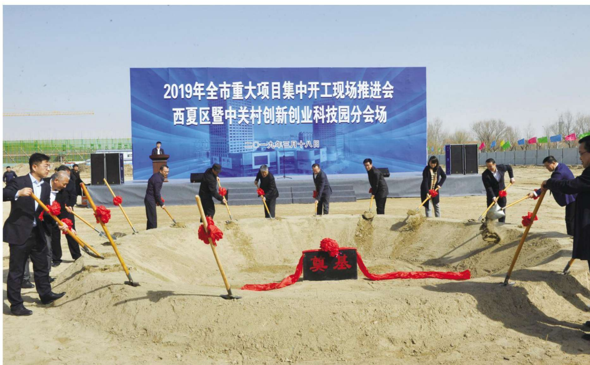
2019年3月18日,西夏区暨中关村创新创业科技园分会场举行项目奠基仪式