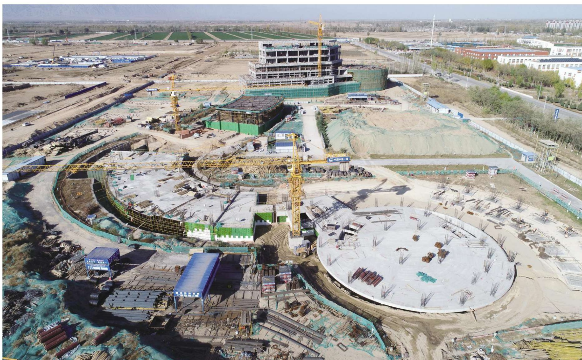
中国葡萄酒产业技术研究院项目