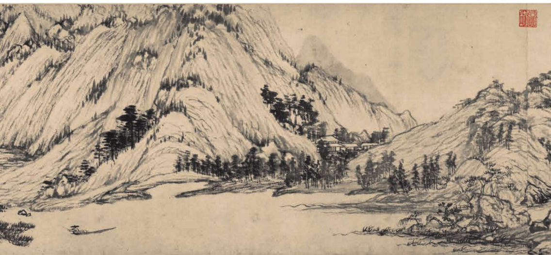
黄公望《富春山居图》（局部）