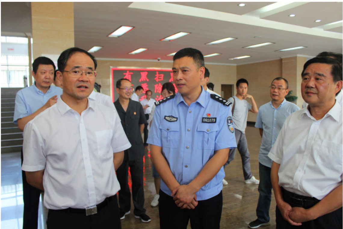
8月20日，浙江省委常委、政法委书记王昌荣（前排左一）到开化调研诉源治理、政法一体化办案及信访代办工作