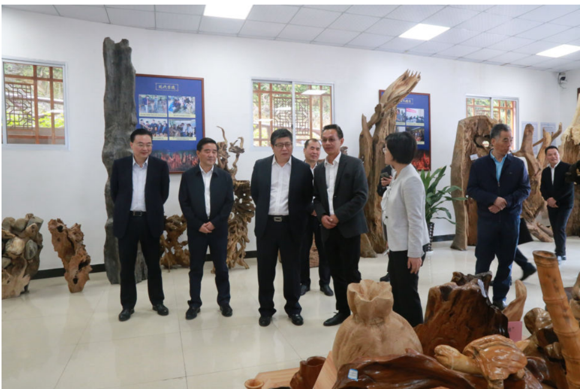
11月8日，浙江省副省长成岳冲（左三）到开化开展主题教育蹲点调研职业教育工作