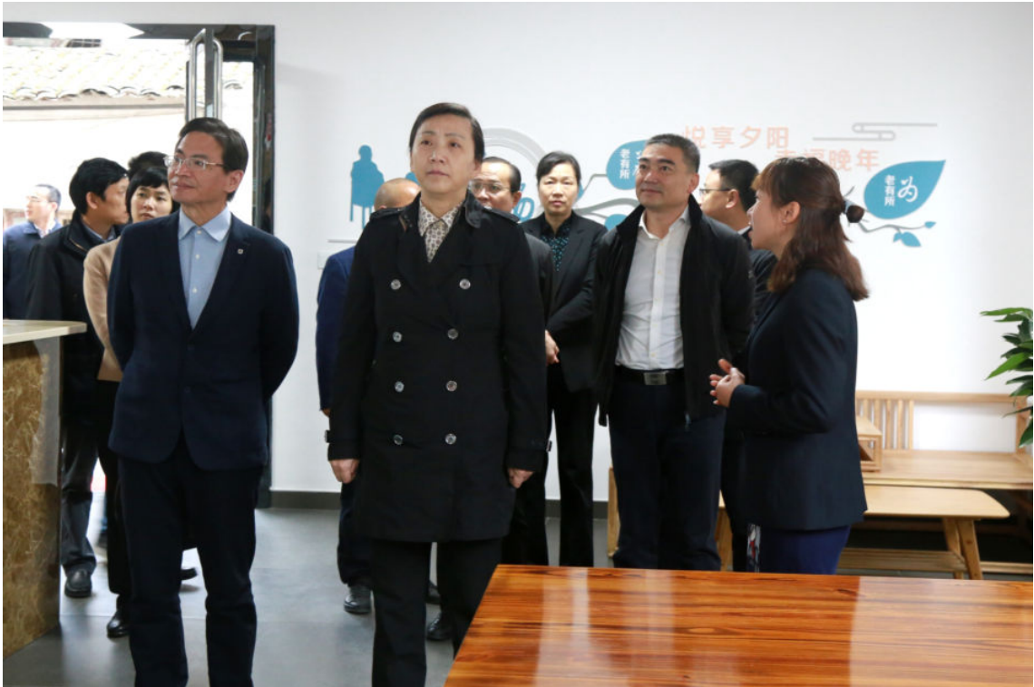
11月26日，浙江省副省长王文序（前排右一）到开化调研“三留守”人员关爱服务工作