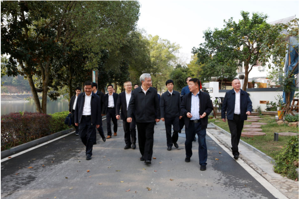
11月4日，中央纪委常委、国家监委委员、中央巡视办主任王鸿津（中）到开化调研县级巡察工作情况（县委办提供）