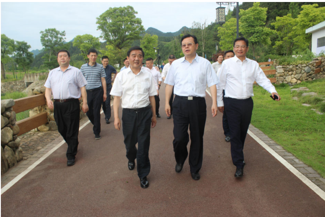
5月29日，水利部副部长蒋旭光（右二）开化县调研治水造景助推乡村振兴工作