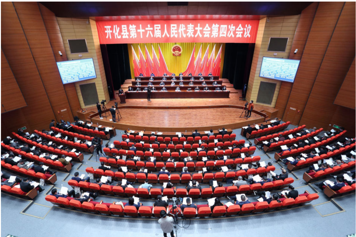
4月20—22日，开化县第十六届人民代表大会第四次会议召开