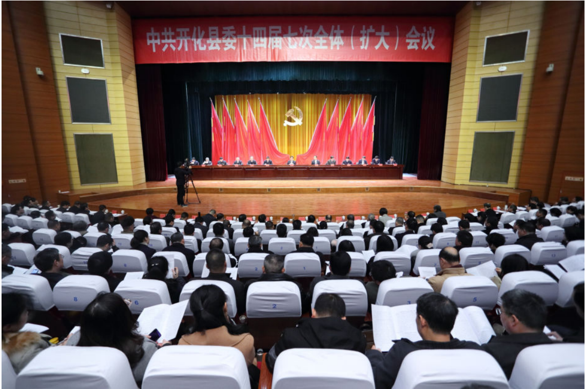
1月28日，开化县召开县委十四届七次全体扩大会议