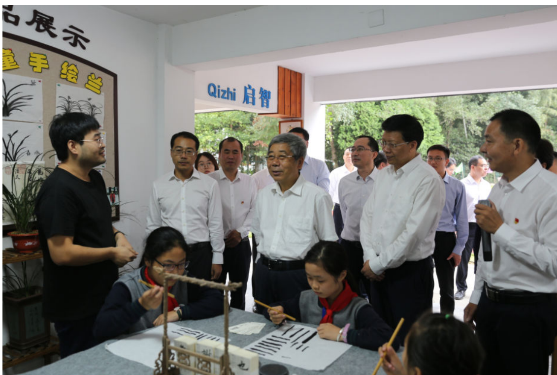
10月14日，教育部党组书记、部长陈宝生（前右三）到开化调研县域义务教育优质均衡发展工作