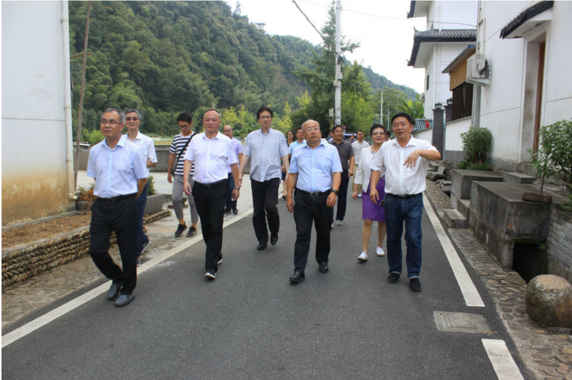
8月19日，浙江省政协副主席周国辉（前排右二）到开化开展专题重点提案协办调研