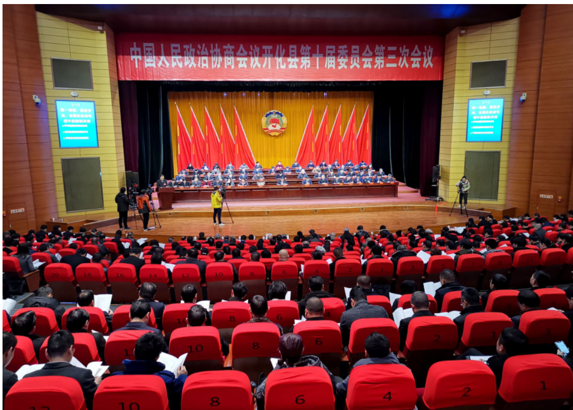
2月14—17日，中国人民政治协商会议开化县第十届委员会第三次会议召开