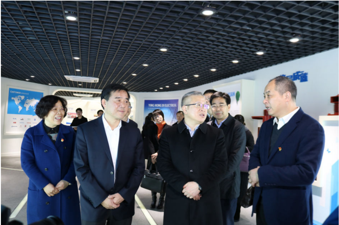
1月15日，衢州市委书记徐文光（前排中）到开化考察“七一电器”走访服务企业