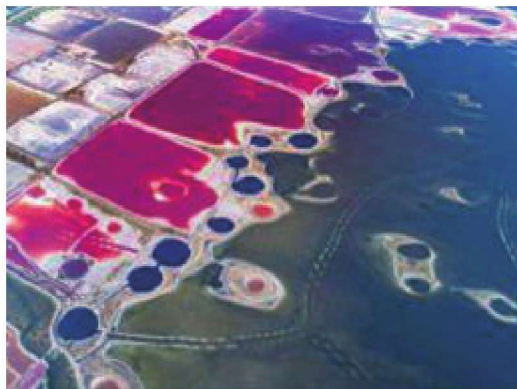
图1-4 大自然的多样色彩