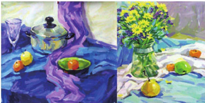
图1-7 通过色彩静物写生表现光源色、固有色与环境色表现