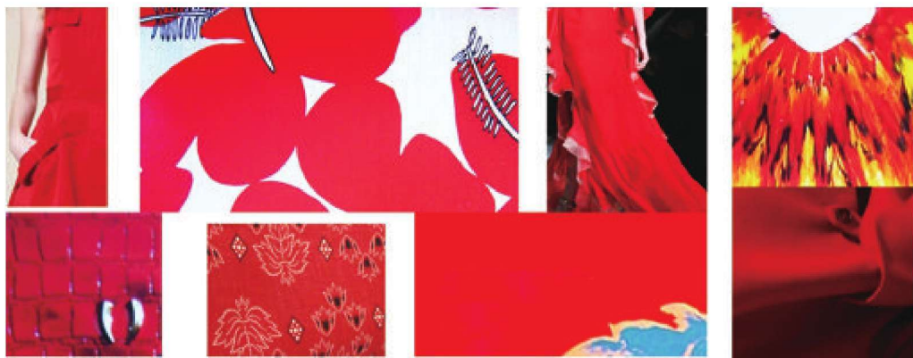
图1-22 红色表现在不同质地上的视觉效果

其次，在服装色彩中，因为面料与色彩的关联性尤为重要，所以对面料色彩的研究也是必不可少的。在服装设计中面料的质感发生变化的时候，色彩也会随之产生丰富的变化与情感表达，例如，大红色系，在粗纺面料上其色彩面貌反映的是粗犷、奔放；在提花锦缎上表现出来的就是浓艳与华丽；在真丝面料上表现出来的就是轻快与优美；在皮革质地上则表现出饱满与理智（图1-22）。在服装设计中必须高度重视面料质感对于色彩的影响，不能完全模式化地套用色彩。要根据细节的变化做细微的调整设计，更好地把握色彩设计语言。