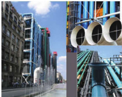
图 1-8 色彩应用在建筑中