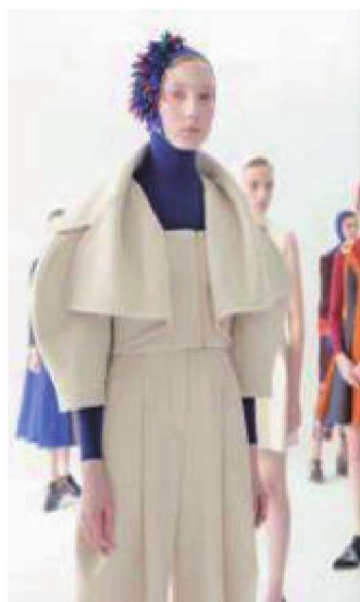
图1-13 淡雅服装色彩设计应用