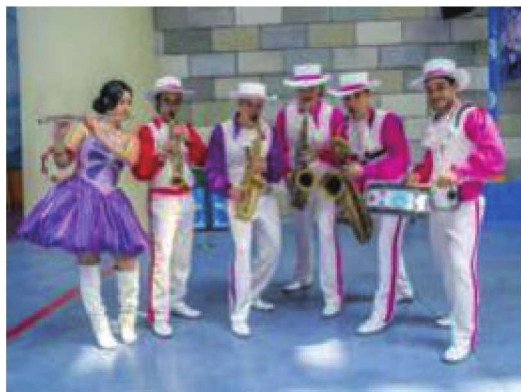
图1-15 演出服装色彩设计应用 (作者: 赵亚杰)

服装色彩设计要符合大众的审美标准, 根据使用场合不同选择相对应服装类型、不同的年龄层次等 (图1-15、图1-16)。