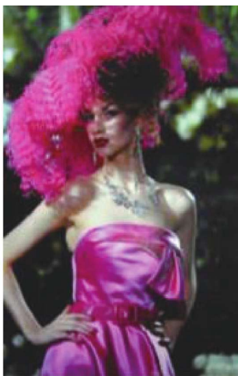
图1-11 服装色彩设计应用