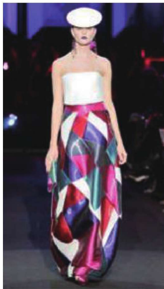
图1-18 流行色彩的礼服裙