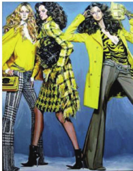
图1-19 整体色彩系列设计效果图 (作者: 安宁)

(4) 服装色彩的季节性: 大自然的色彩随着季节的变化而不断变化着, 服装色彩也