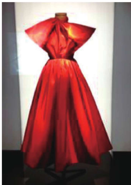
图1-24 “迪奥小姐”礼服色彩设计表现