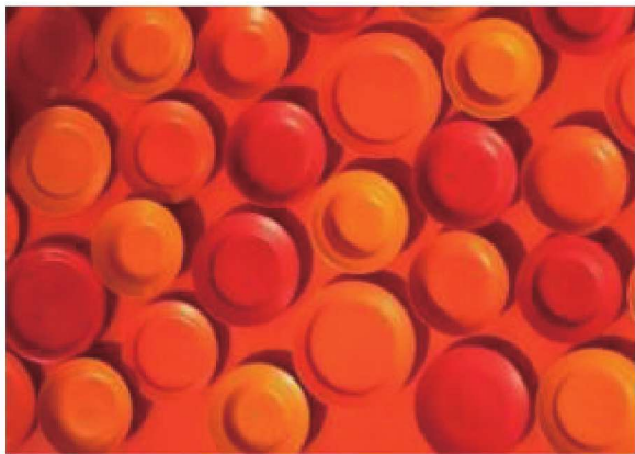
图1-9 单一色调下丰富的色彩效果

色彩象征性指的是一种色彩或几种色彩的组合,能够让见到这种色彩的某个人群引起相应的联想,或对某个人群具有共同的暗示,也就是某个人群、某个民族、某个地区对某种色彩的共同认知。随着社会的发展,各种艺术形式都注重表现精神象征,而完成精神象征的表现关键,色彩起到了相当大的作用,尤其是色彩的象征性,大大增强了艺术作品的表现力和可读性,即使没有具象的造型,也可以通过色彩的象征意义表达作品的主题(图1-9、图1-10)。色彩的象征性在世界范围内也有共通性的一面,但因为地域、民族、信仰、生存环境的不同,导致一些色彩象征意义的差别也是不可避免的,所以了解民族文化差异对艺术设计人员来说是非常重要的。