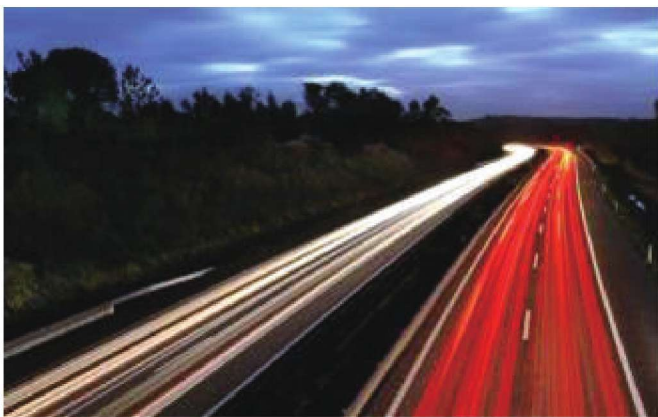
图1-5 高速度下形成色彩的线

光与色是自然界存在的有机整体，有光才有色，没有光就没有任何色彩。在物理学上，光是一定波长范围内的一种电磁辐射，它与宇宙射线、γ射线、紫外线、红外线、雷达、无线电波交流电等并存在宇宙中。色彩的产生与感受使人产生视觉的主要条件就是光，有光才会有视觉，来自外界的一切视觉形象，如物体的形状、空间、位置等区别都是通过色彩的明暗来表现。色依附于形（物），形由不同的色来区分，形与色是不可分割的整体。色彩是不同波长的光刺激眼睛的视觉反映，是光源中可见光在不同质地物体上的反映。为什么不发光的物体会颜色？是因为物体在受到光的照射后，不透明的物体会产生吸收反射等现象。我们平时所说的固有色，是以日光的照射为基本条件，它不是物体本身自有的颜色，而是物体本身具有的反射色光的能力，要求外界条件相对稳定，物体本身具有的反射色光的能力不会因为光源色的改变而改变（图1-5~图1-8）。