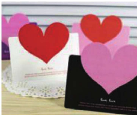
图1-3 色彩绚丽的平面宣传品