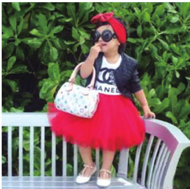
图1-25 童装色彩搭配设计表现

最后, 服装的商品性对于服装色彩流行性的研究, 也是必须要考虑的因素, 流行色的产生是社会经济文化的反映, 新颖的色彩可以强烈地刺激人的视觉, 并给人带来与以往不同的心理感受。国内外预测发布流行色分春夏季和秋冬季两次, 设计作品的色彩搭配要紧跟流行趋势, 充分运用当季的流行色彩, 以达到理想的配色效果。