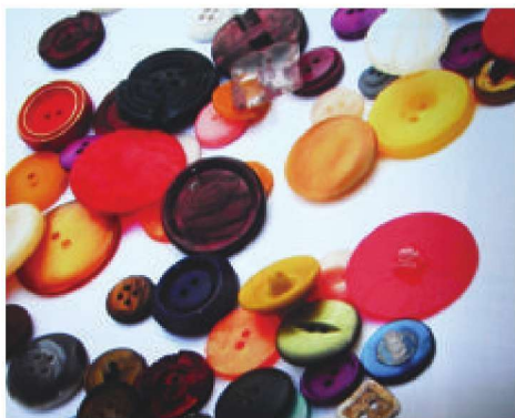
图1-1 五彩缤纷的纽扣

我们生活在一个斑斓瑰丽的世界里，色彩作为一个元素渗透在人类生活的每个领域。图形、文字、色彩视觉三要素中，色彩是最能够迅速表情达意的，它可以通过不同的变化形式、组合形式来左右人们的心理情感。色彩是我们感受这个世界最直接的方式之一。研究表明，一个正常人从外界接受的信息，87%以上是由视觉器官传入大脑的，人对事物的第一印象往往是色彩的感觉。色彩学是一门集物理学、生理学、心理学、美学等的综合学科，色彩学是艺术设计、工艺美术等教学体系中必不可少的基础类课程，它开设的宗旨是为以后的专业设计打下基础（图1-1~图1-4）。