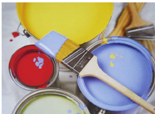
图1-2 色彩斑斓的彩色油漆