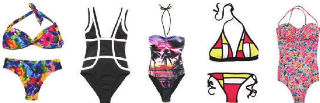
图1-23 泳装的色彩设计实例

再次, 根据不同服装类型进行相应的色彩搭配设计研究, 服装品类丰富多样, 不同类型服装, 也影响并决定色彩设计的使用。如休闲装、职业装、晚礼服、童装以及内衣等, 不同的服装类型, 不同的穿着对象, 不同的穿着环境, 都决定着其色彩应用的不同(图1-23~图1-25)。