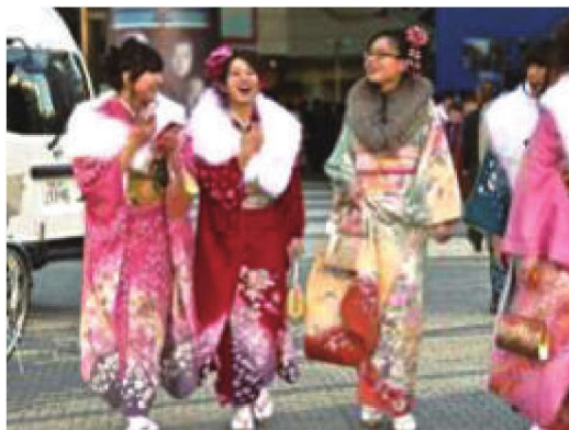
图1-16 特殊场合服装色彩设计应用

(3) 服装色彩的商品性: 色彩作为服装设计的重要组成元素, 某种程度上是为服装的商品性服务的。无论是秀场上展示的高级定制服装, 还是时尚流行的成衣, 都具有商品流通性, 设计师在进行服装设计的时候, 要充分考虑到穿着者的穿用需求或符合当季的色彩流行趋势, 研究不同消费人群年龄层次或职业, 针对不同定位及风格的服装进行色彩的整体搭配, 使服装进入终端销售市场之后可以创造更多的市场价值 (图1-17~图1-19)。