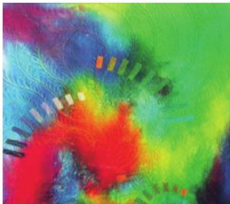
图1-10 色彩渲染织物,鲜艳色调象征活泼富有朝气