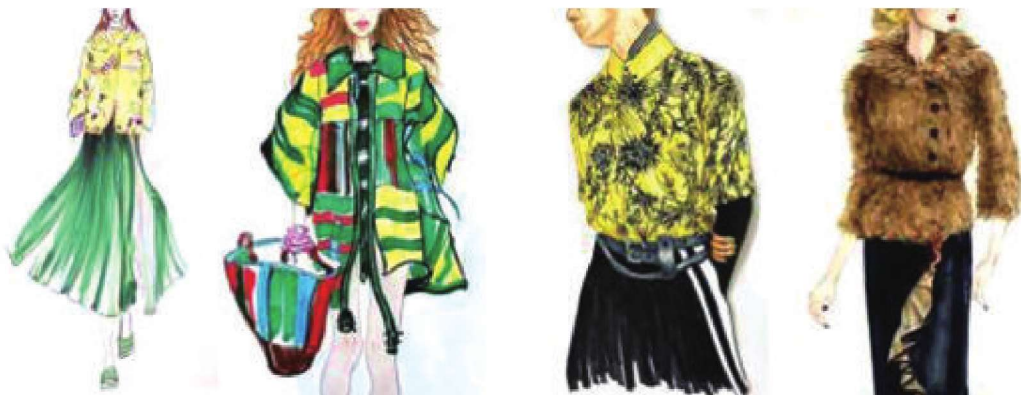
图1-20 春夏季色彩服装效果图（作者：谭嘉丽）

随着季节的更替而不断变化。春季春暖花开、万物复苏，色彩的颜色鲜亮，如草绿色、淡黄色、浅粉色、橘红色等；夏季的色彩更加浓郁，如果绿色、玫红色、粉绿色、大红色、宝蓝色等（图1-20）；秋季的色彩暖色调明显，如土黄色、芥末黄色、橄榄绿色、熟褐色等（图1-21）；冬季气候趋于寒冷，服装面料加厚，色彩多偏向灰暗色或暖调的颜色。