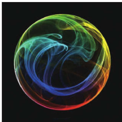
图1-6 通过光的照射呈现彩色的线