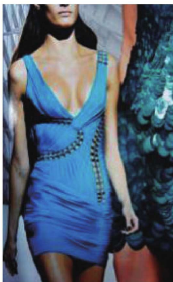
图1-12 浓郁服装色彩设计应用