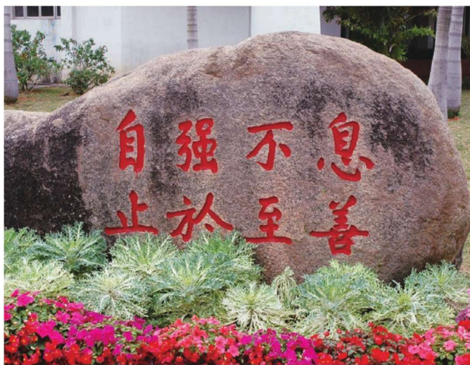
“自强不息，止于至善”校训石

本书以厦门大学建设史话的形式记载着校主陈嘉庚先生创校的家国情怀，记载着厦门大学百年的建设与发展和建设者们攻坚克难的故事，记载着一代又一代厦大人努力奋斗和“爱国、革命、自强、科学”的精神。厦大百年，“嘉庚风格”建筑引领着城市区域的发展和社会的进步，继而走出鹭岛、迈向国际，其间留下了多少为新知而求索的莘莘学子的身影。“自强不息，止于至善”，厦大人谨记的校训，始于厦大而不止于厦大，这样的美必将传播至更加广阔的大地上。在以“弘扬嘉庚精神，奋进一流征程”为主题的百年校庆之际，厦门大学将以更矫健豪迈的雄姿，抵达更高更远的目标与境界，再创新百年的辉煌。