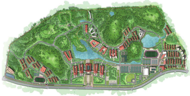
漳州校区总平面图 1