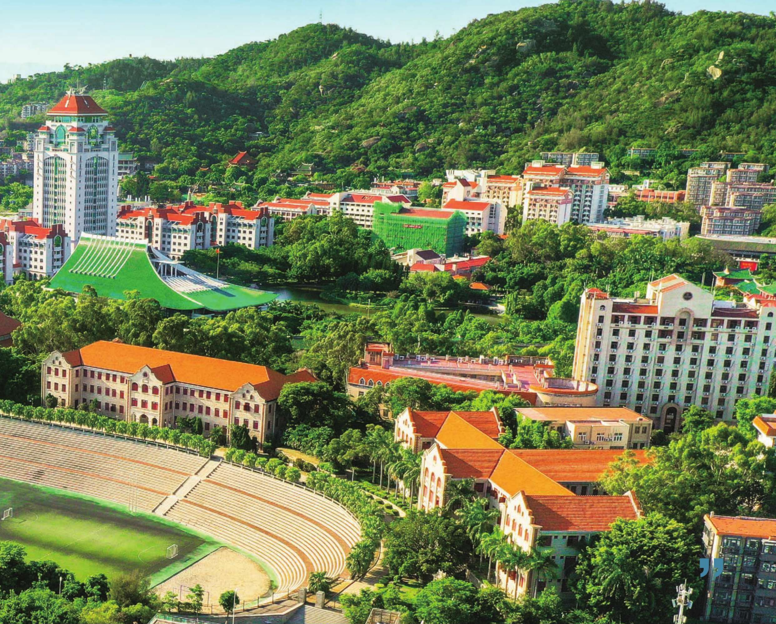
建南大会堂和上弦场

在世纪之交，随着学校事业的发展和新一轮校园建设的需要，同时为解决整个校园校舍布局较为分散的问题，在充分尊重历史，尊重环境的前提下，学校决定对校园核心区进行规划调整，布局优化，筑建了跨世纪的嘉庚楼群，并优化了芙蓉湖自然景观和周边环境。嘉庚楼群传承了“一主四从”的建筑风格和特点，朝东略呈弧形，迎向中心嘉庚广场和开阔的芙蓉