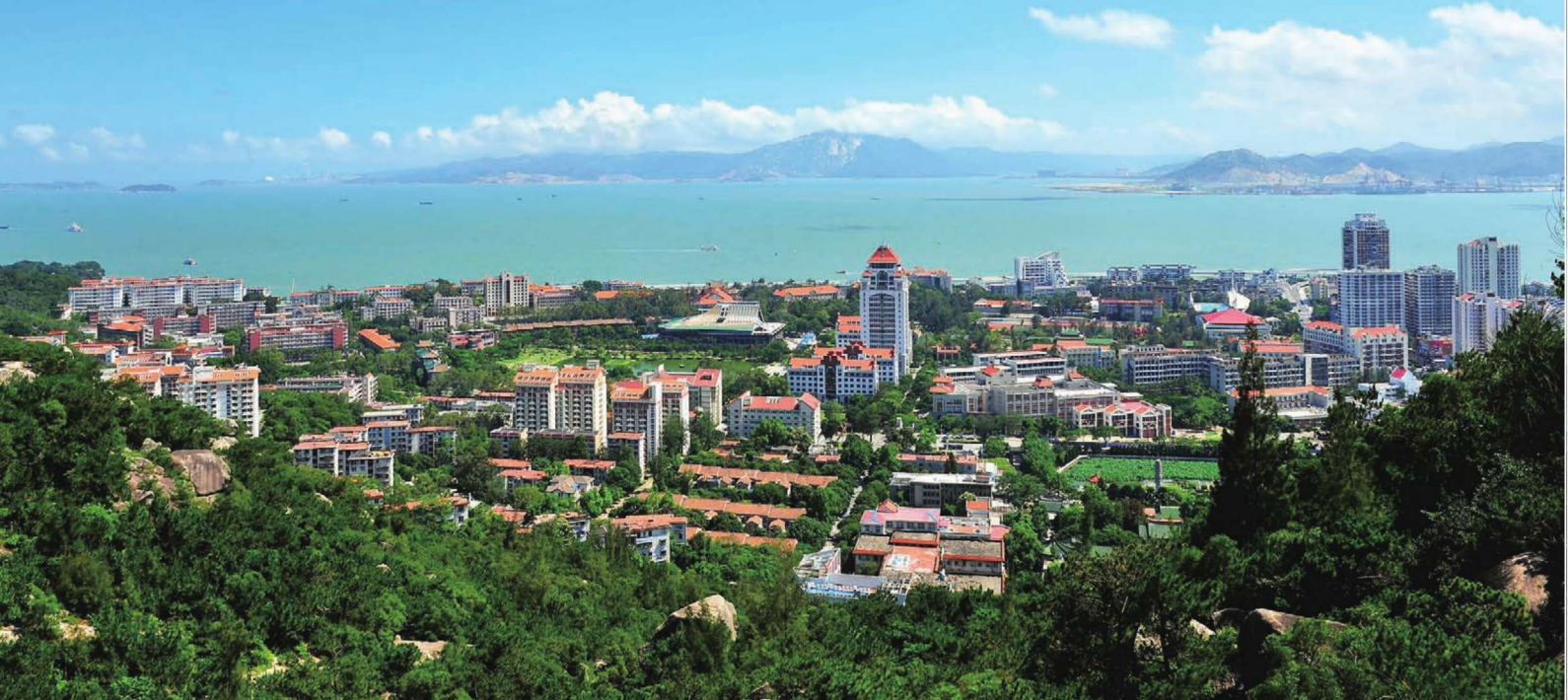
厦门大学思明校区全景之一