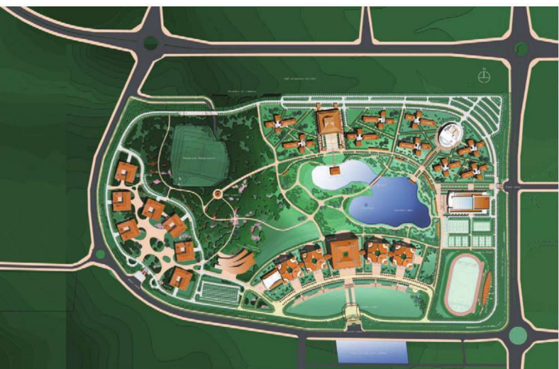
马来西亚分校总平面图 2