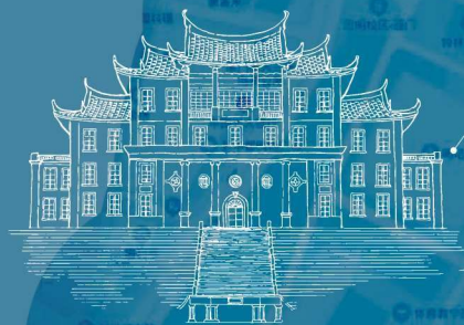
建南大会堂 竣工于1954年 位于思明校区李厝山中部