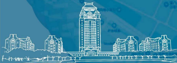
领思楼 竣工于2001年 位于思明校区芙蓉湖畔