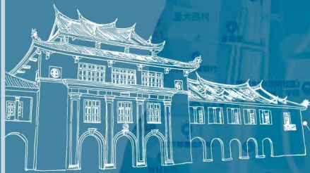
群贤楼 竣工于1922年 位于思明校区演武场北侧