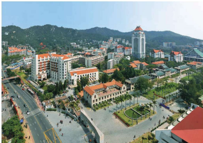
厦门大学思明校区全景之三