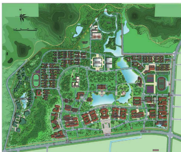
翔安校区总平面图

厦门大学由著名爱国华侨领袖陈嘉庚先生于1921年创办，是中国近代教育史上第一所华侨创办的大学，也是国内最早招收研究生的大学之一，并率先在海外建设独立的大学分校校园。建校以来，学校秉承“自强不息，止于至善”的校训，积累了丰富的办学经验，具有“侨、台、特、海”的鲜明办学特色，成为一所集自然科学、人文科学、社会科学、管理科学、艺术科学、工程与技术科学和医学科等门类齐全的综合性和国际上有广泛影响的综合性大学，在海内外享有很高声誉，是国家教育部直属的“211工程”和“985工程”重点建设的高水平大学。被誉为“南方之强”。2017年，厦门大学入选国家公布的A类世界一流大学建设高校名单。建校迄今，已先后为国家培养了四十多万名本科生和研究生，在厦大学习、工作过的两院院士达六十多人。