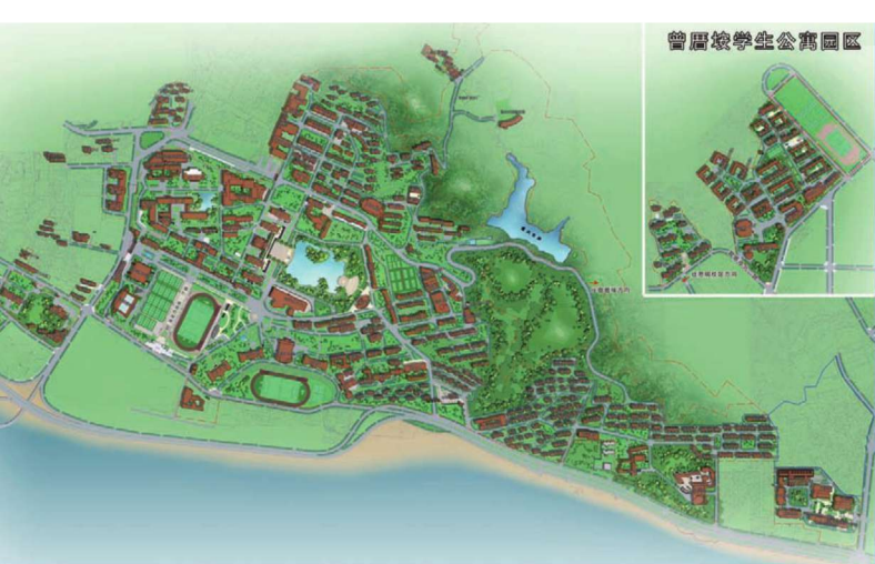
思明校区现状总平面图