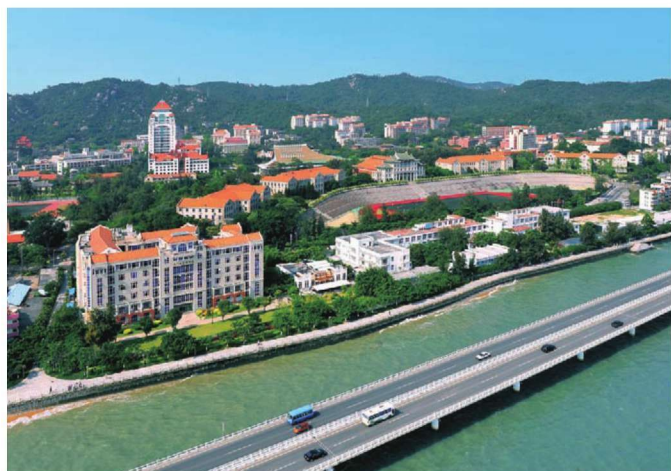
厦门大学思明校区全景之二