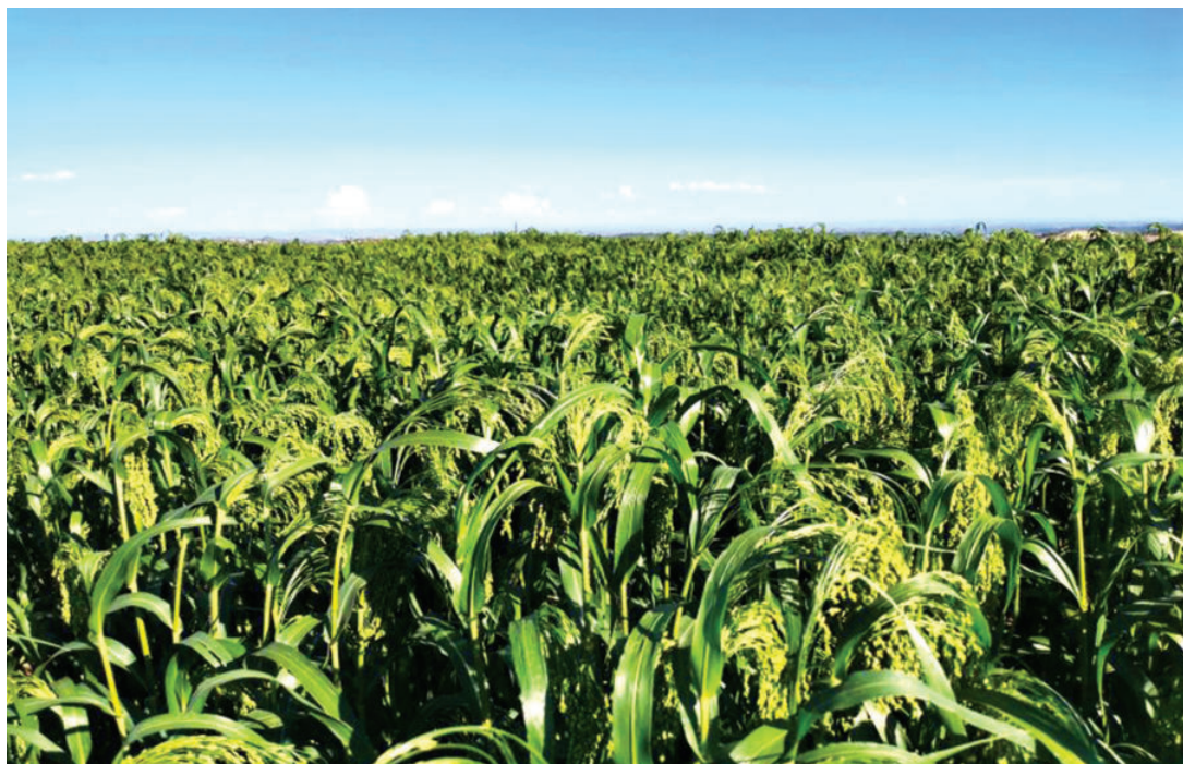
木瓜糜子 (2010年 摄)