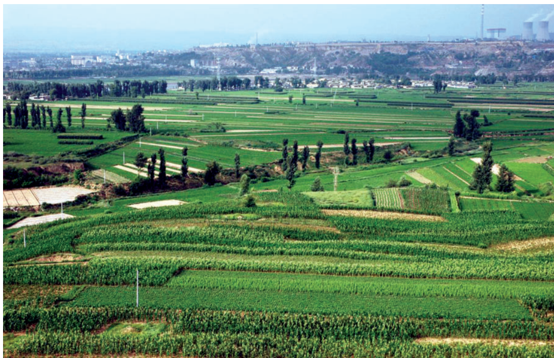
墙头乡高效农业示范区 (2007年 摄)