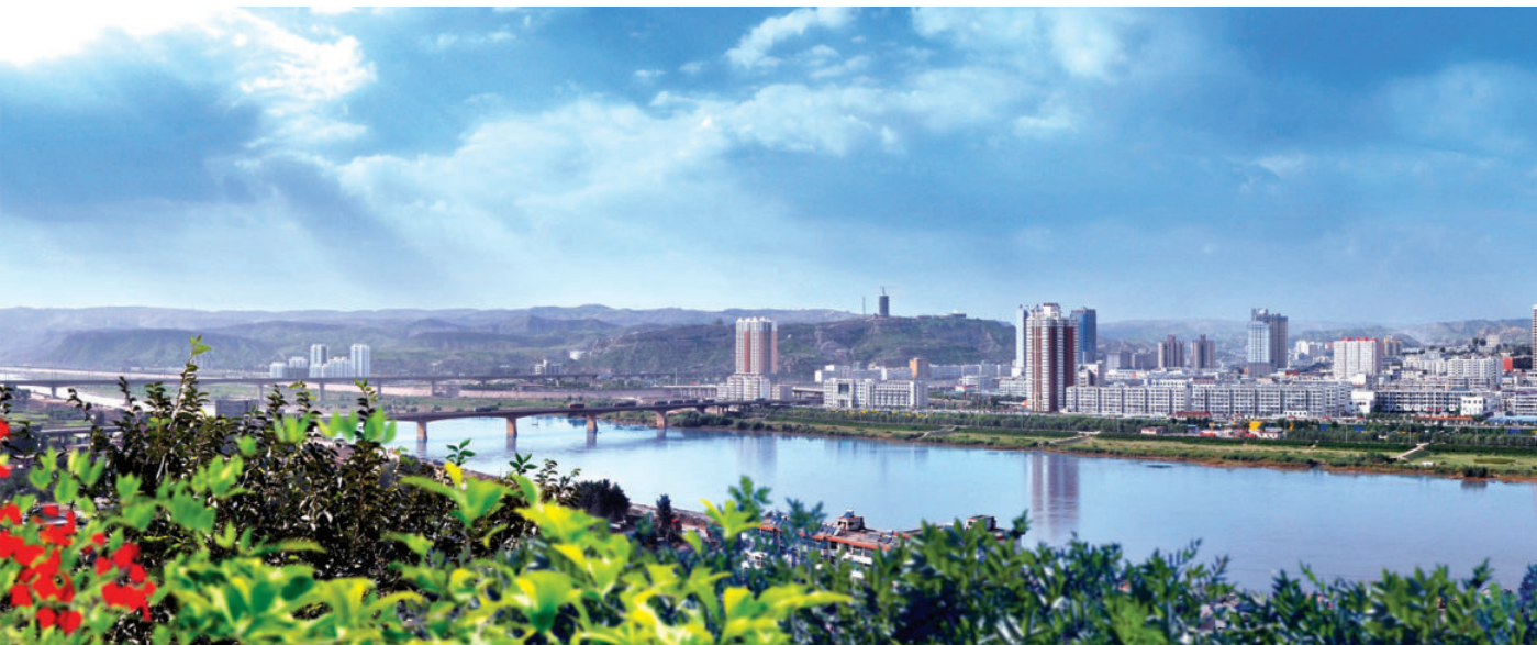
府谷县城全貌（2010年 摄）