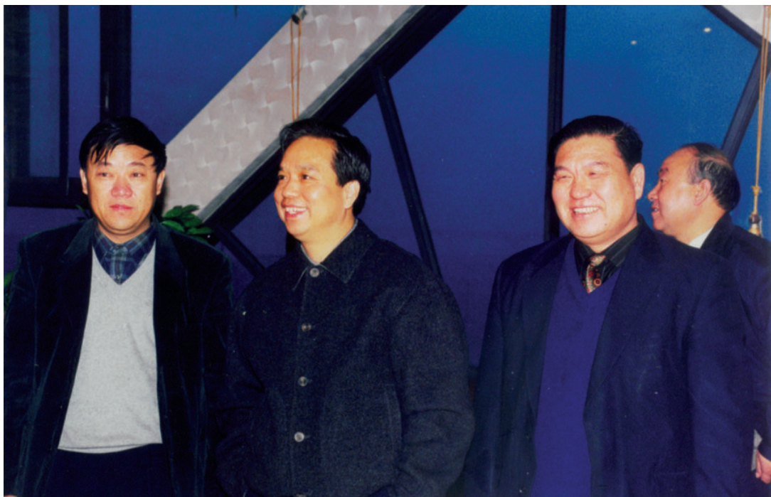
1999年12月16日，中共陕西省委书记李建国（左二）在府谷调研。图为在华龙大桥实地考察。府谷县县长尚洪泽（左一）、民营企业家石掌雄（右一）陪同