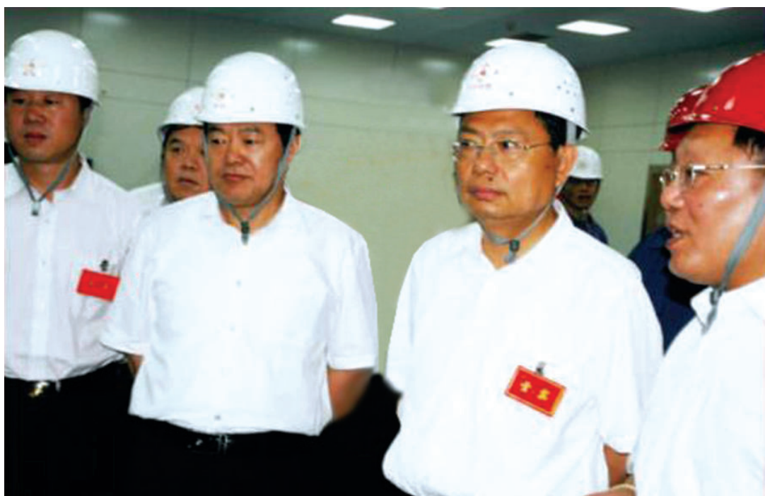
2008年7月16日，中共陕西省委书记赵乐际（前排右二）在府谷考察。图为在工业集中区考察。中共榆林市委书记李金柱（前排左二）、中共府谷县委书记钱劳动（前排左一）陪同