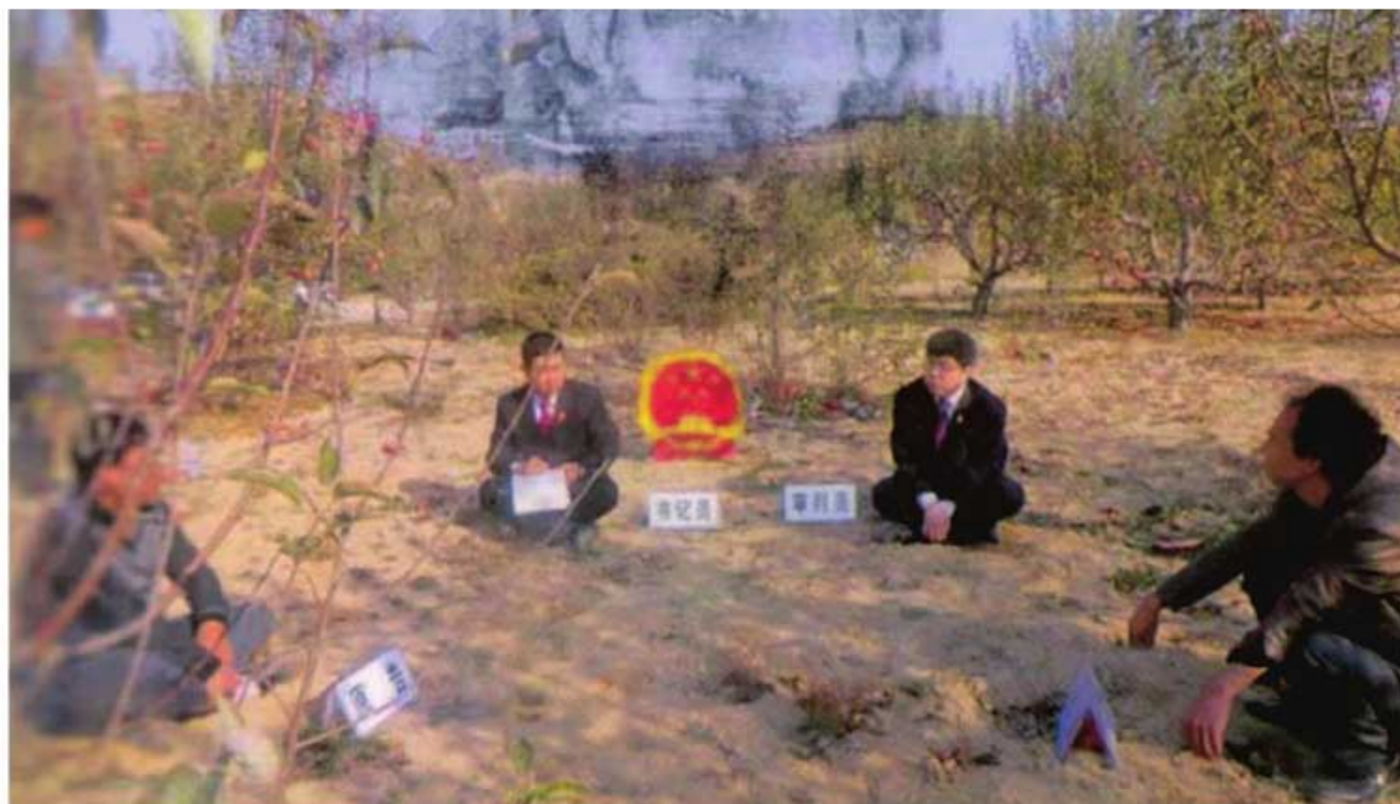
2012年，为方便群众诉讼，礼泉县法院“流动法庭”进果园，进行零距离审判