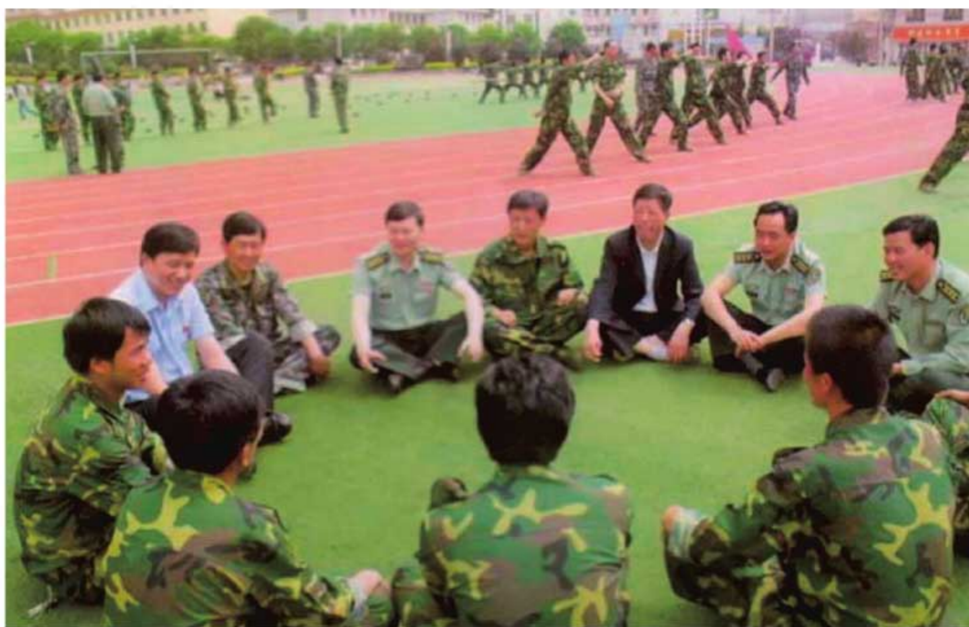
1999年，旬邑县法院法官深入军营训练场，为部队官兵进行法律服务，解答法律咨询，宣传法律法规