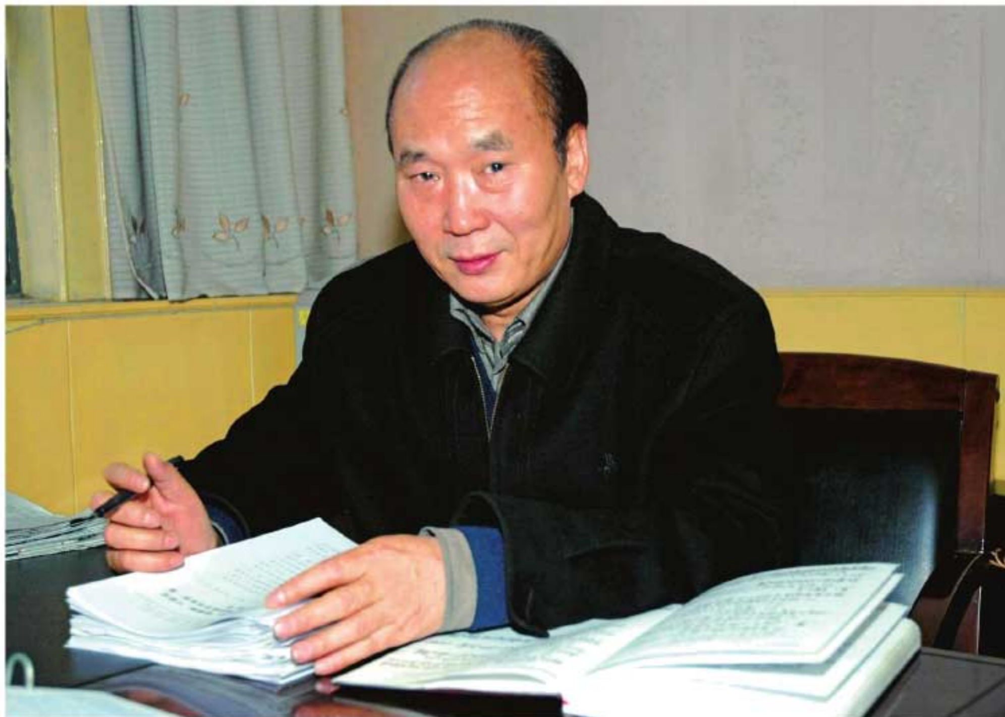
2005年，陕西高院院长赵郭海在认真审查签署裁判法律文书