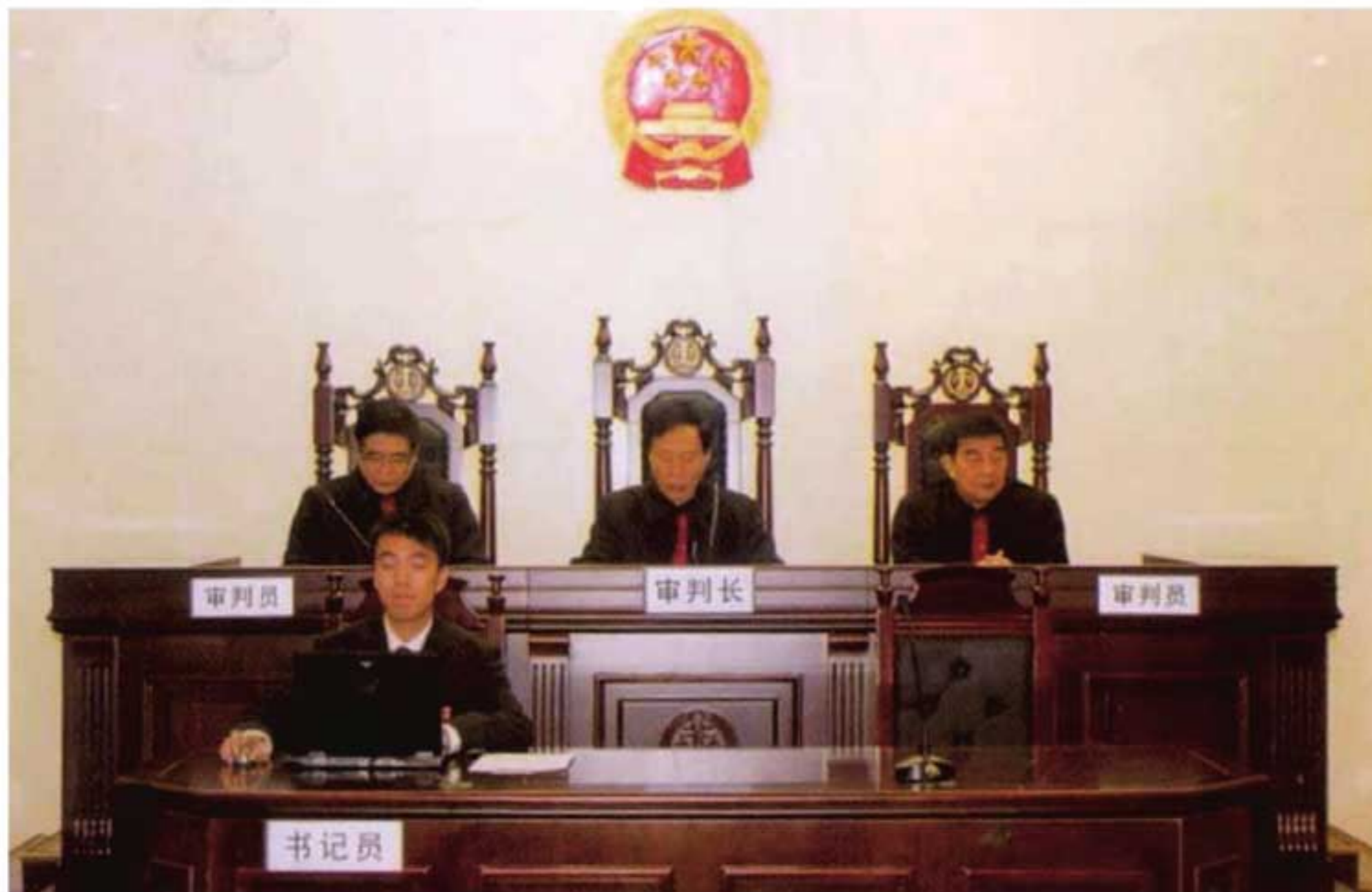
2010年，陕西高院行政审判庭开庭审理行政纠纷案件