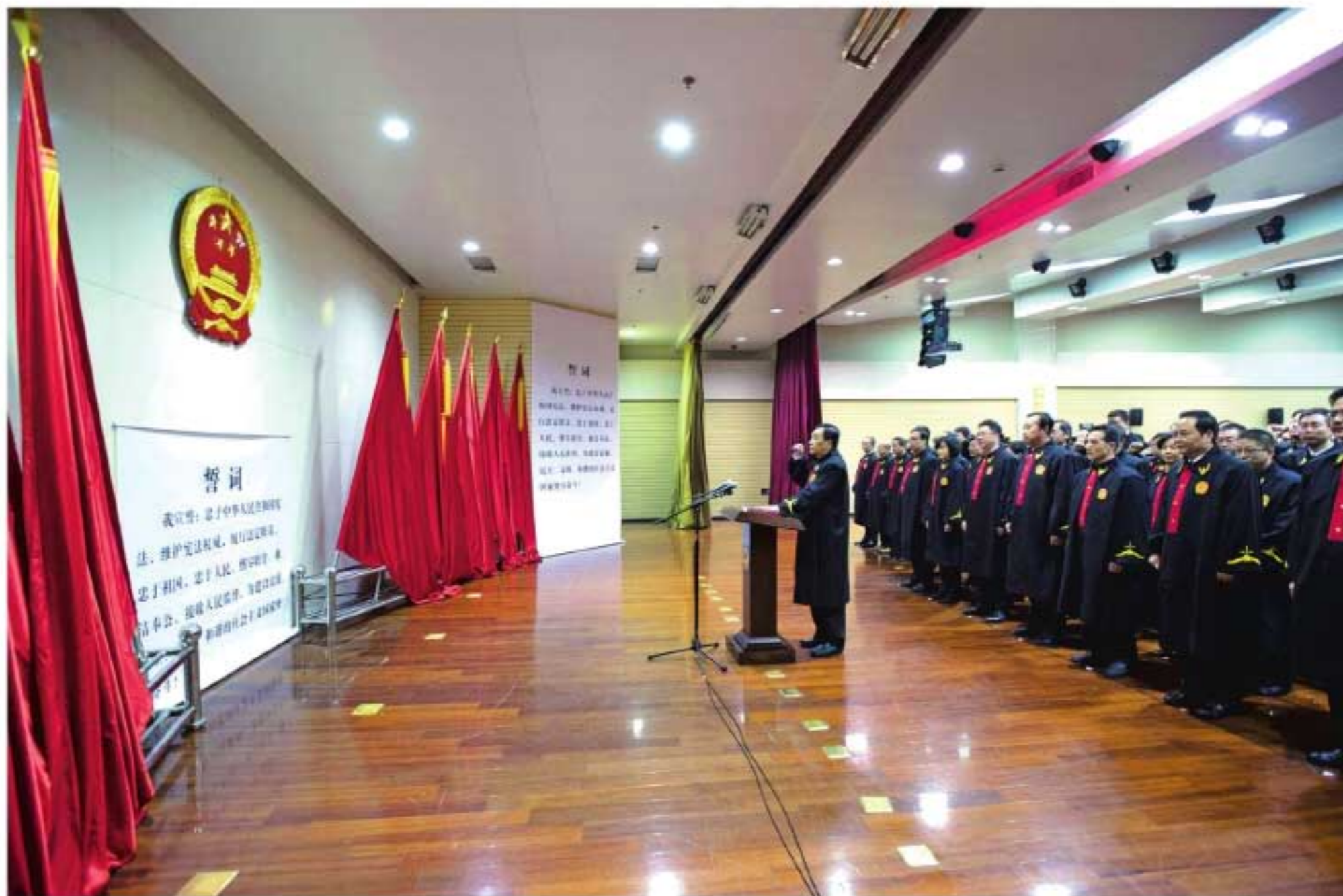
2016年8月21日，陕西高院院长阎庆文与法官举行宪法宣誓