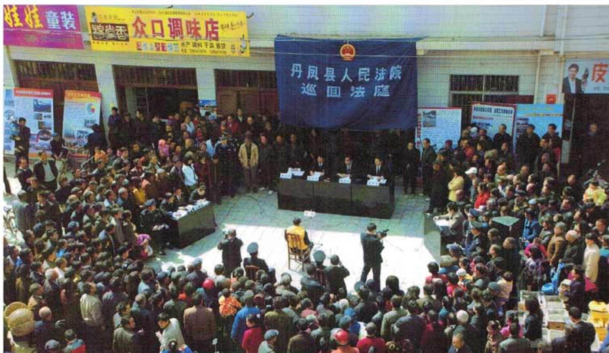
2000年秋，丹凤县法院巡回法庭在乡镇公开开庭，以案释法，教育群众