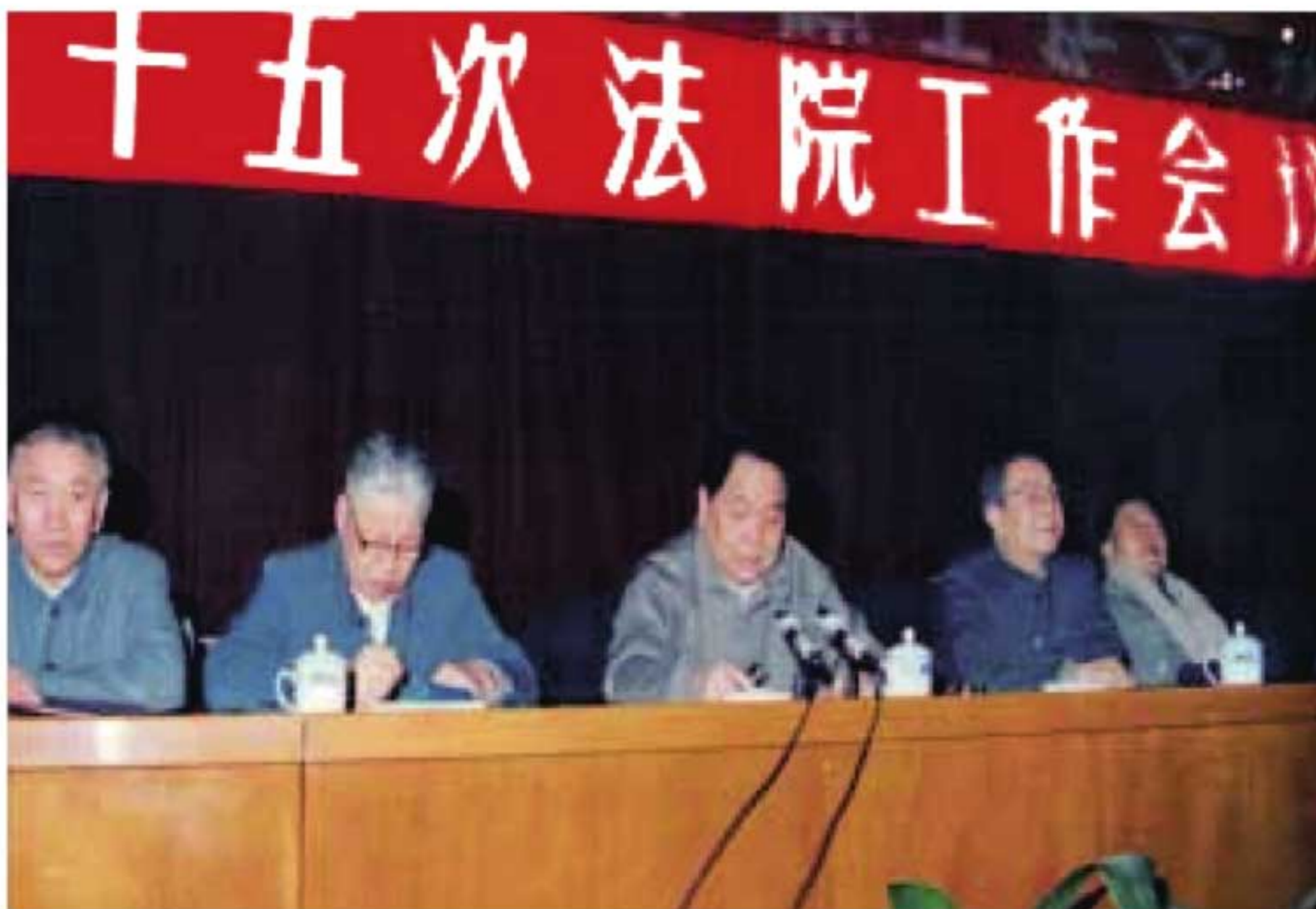
1993年3月，陕西高院院长焦朗亭（左二）在陕西省第十五次法院工作会议上做报告