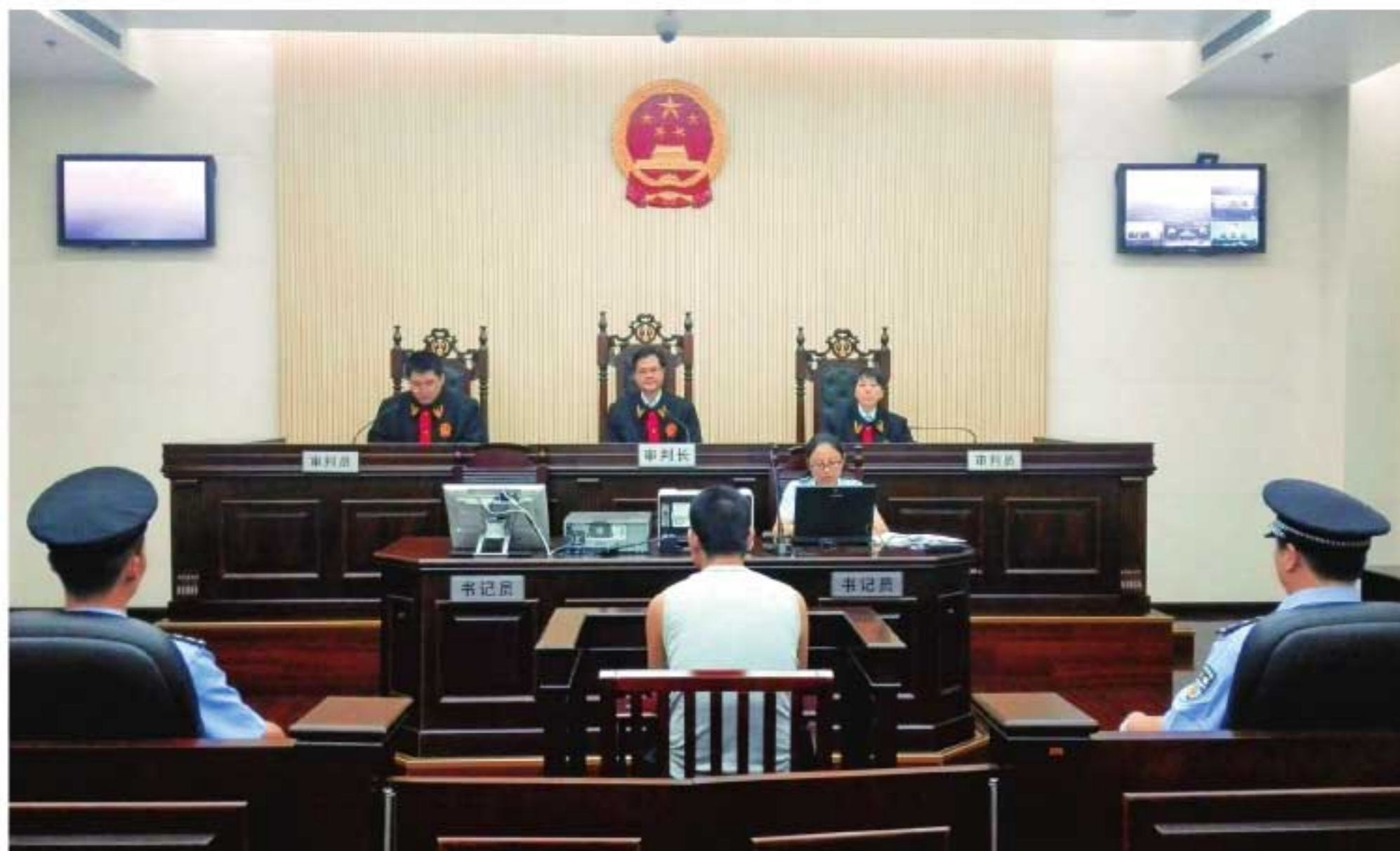
2014年3月，陕西高院副院长田平利任审判长，开庭审理刑事案件