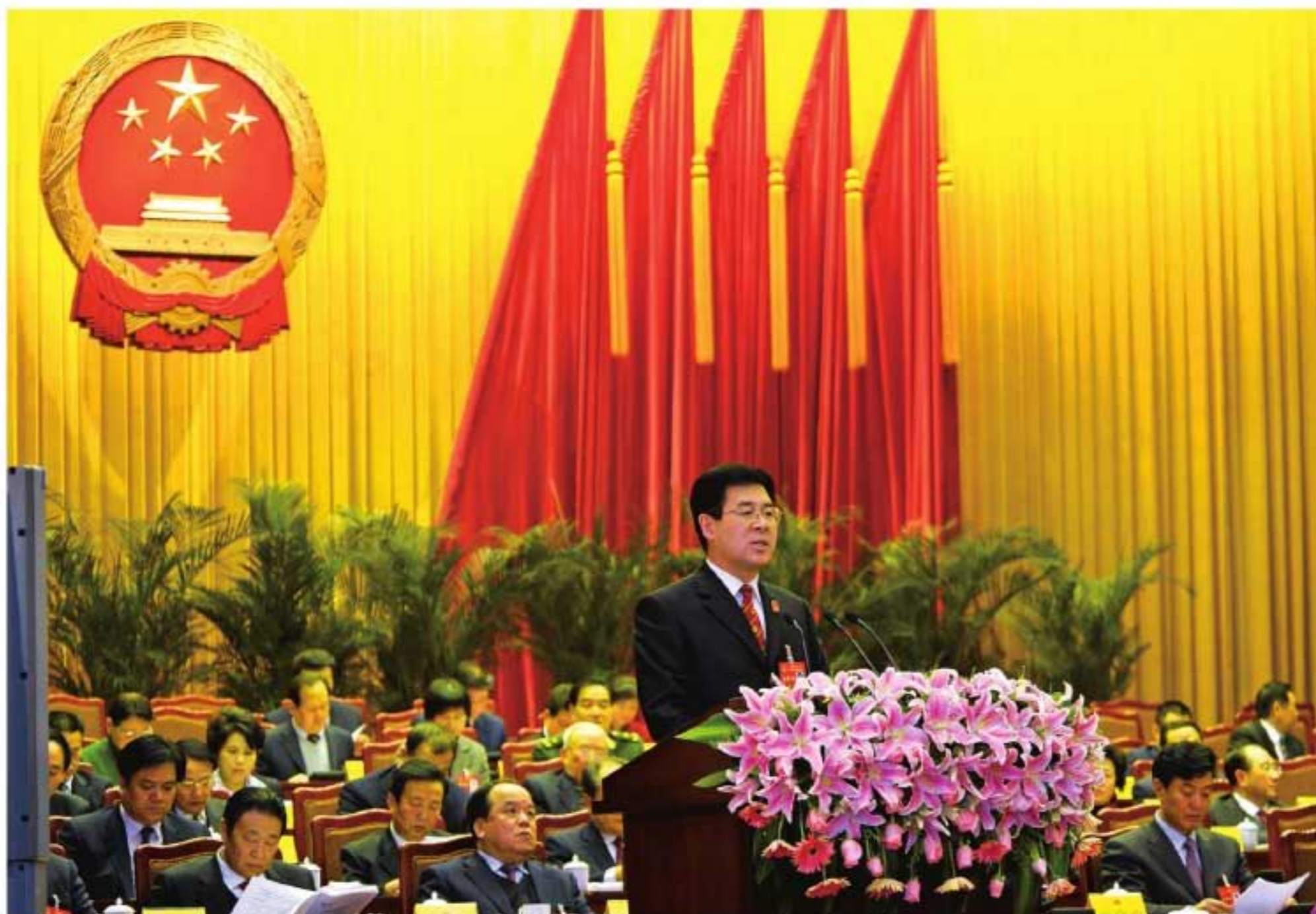
2011年1月19日，陕西高院院长安东在陕西省十一届人大四次会议上做法院工作报告