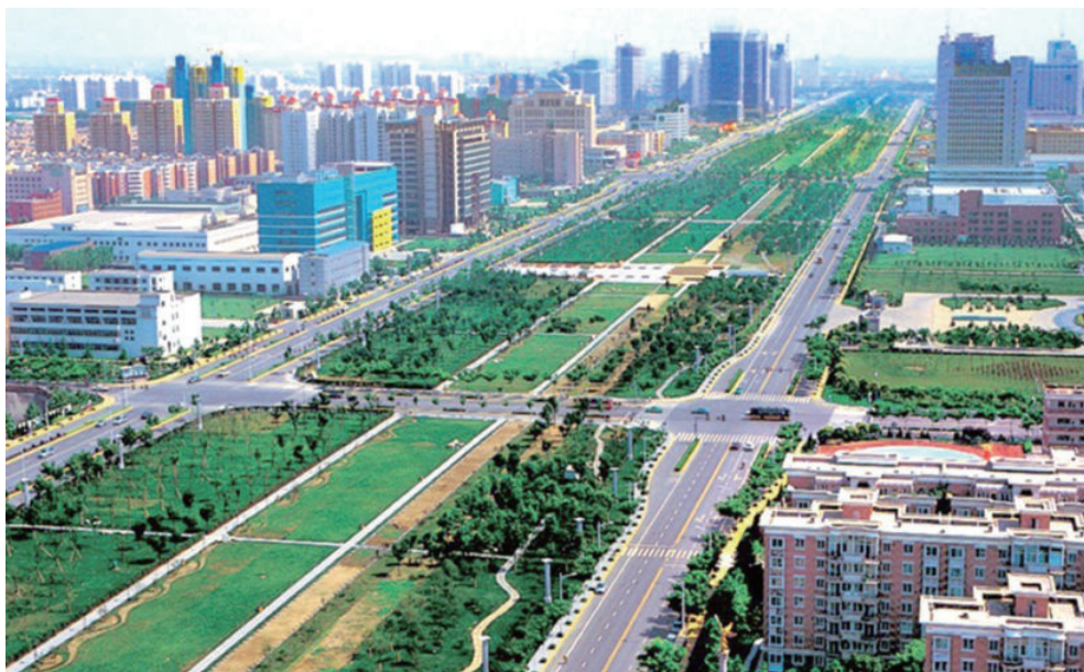
西安高新技术产业开发区1991年6月14日破土动工。图为西安高新区唐延路（摄于2010年9月）