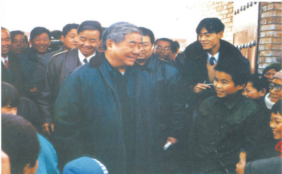
1999年元旦，省长程安东（中）在大荔县朝邑库区进行调研