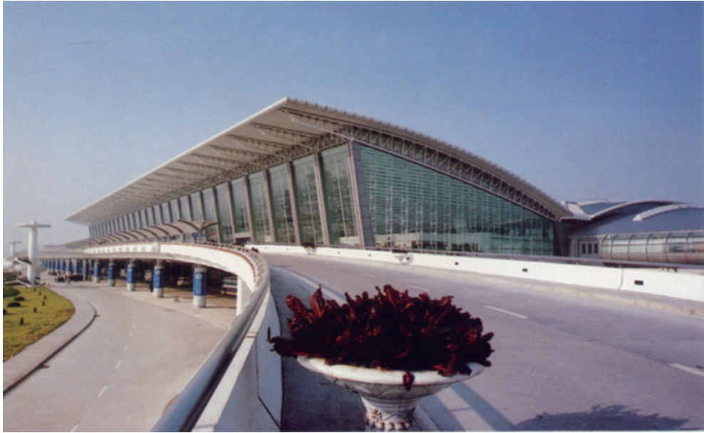
2003年7月24日，西安咸阳国际机场新候机楼竣工。图为新候机楼