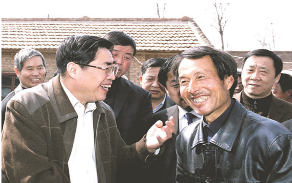
2007年3月21日，省长袁纯清（左一）在铜川市耀州区了解人饮解困项目建成后的农民家庭生活变化