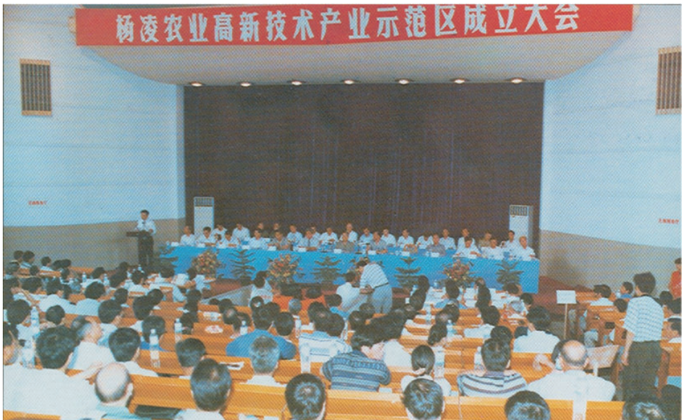
1997年7月29日，杨凌农业高新技术产业示范区成立大会会场