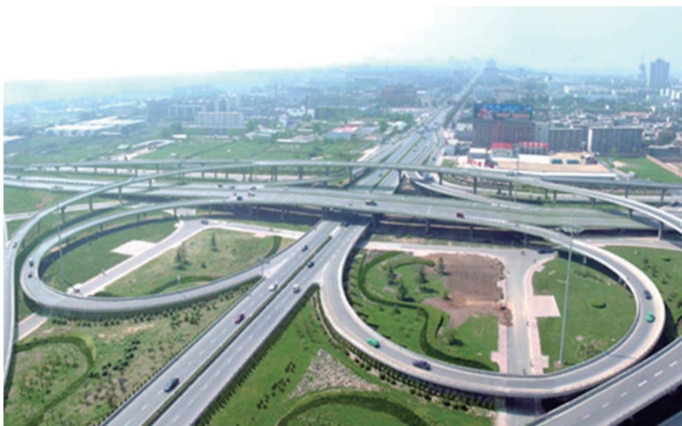
西安市二环路1992年开工建设，2003年9月全线通车。图为北二环未央路立交