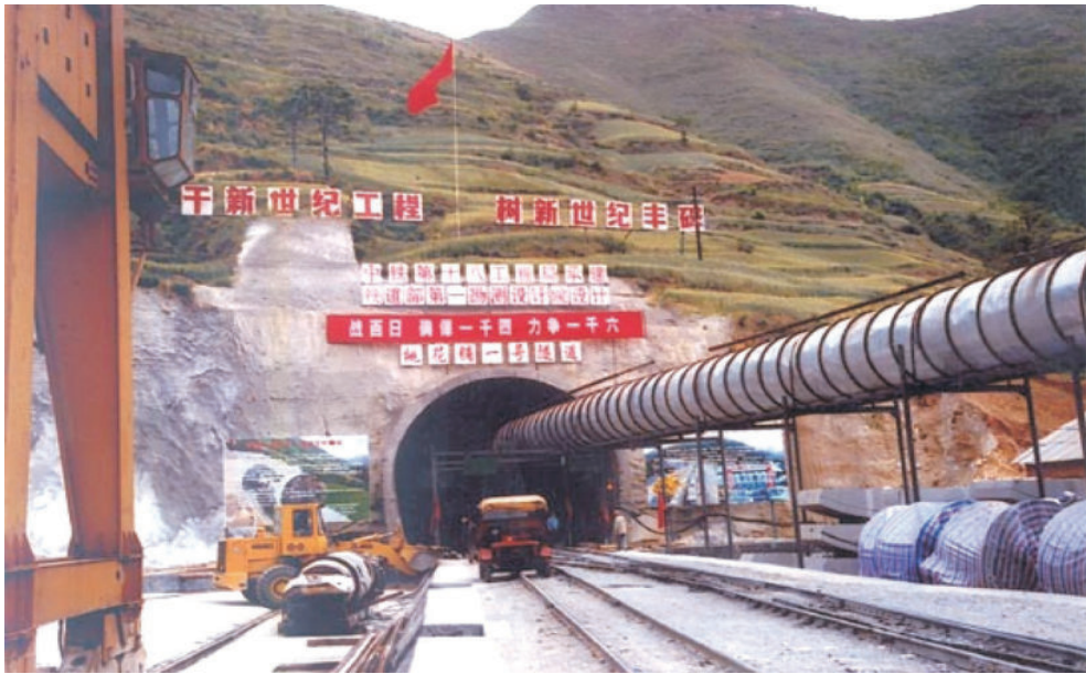
2000年5月28日，西部大开发重点工程西（安）南（京）铁路西安至合肥段开工。图为建设中的西合铁路桃花铺一号隧道