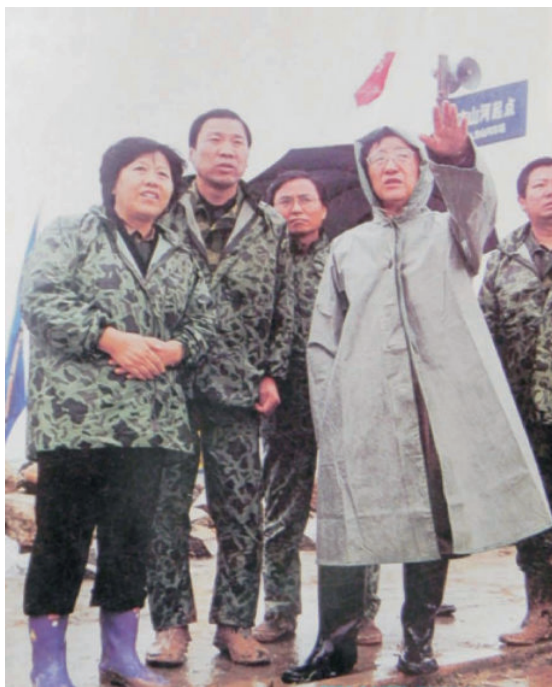
2003年9月，省长贾治邦（右二）在渭南指挥抗洪救灾工作