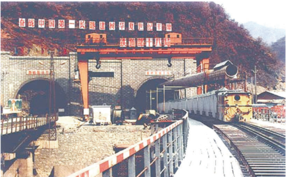
1996年12月18日开工建设西（安）（安）康铁路18460米的秦岭隧道，1999年9月6日全线贯通，2001年1月8日通车运营。图为施工中的秦岭隧道