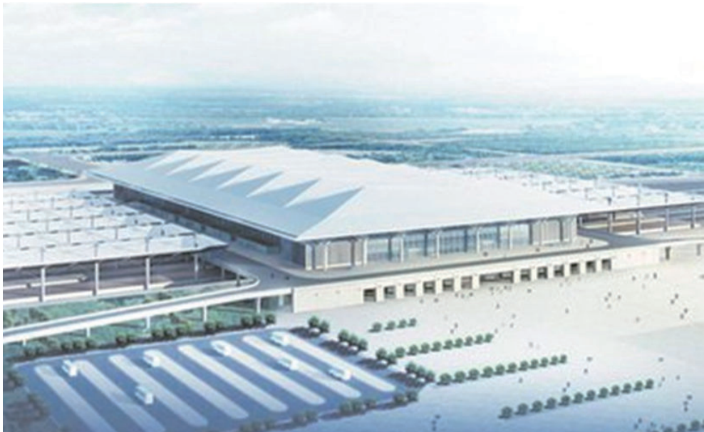
2008年9月19日，西安铁路北客站及地铁2号线北客站同时开工建设。2011年1月11日，西安北客站正式投入运营