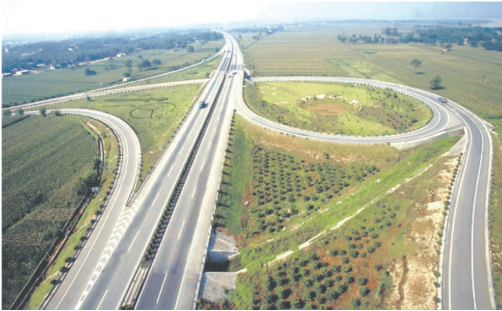
1995年12月，西安至宝鸡高速公路全线建成通车。图为西宝高速公路兴平立交桥