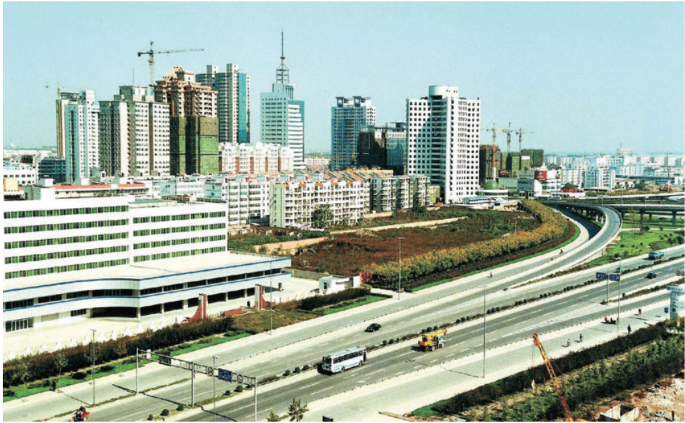
西安经济技术开发区1993年10月开工建设，2000年2月经国务院批准为国家级开发区。图为西安经济技术开发区一隅