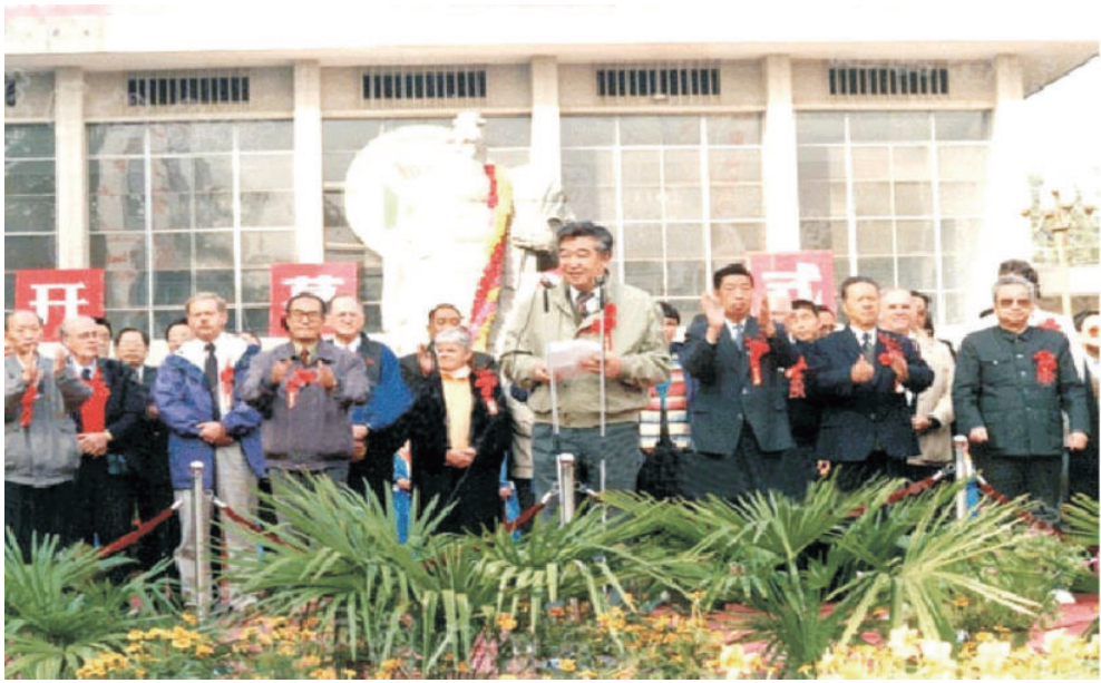
1994年10月18日，第一届杨陵农科城技术成果博览会开幕式，省长白清才致开幕词