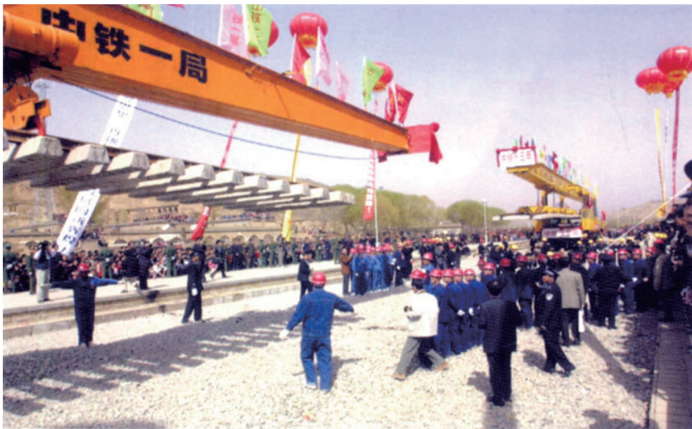
2001年4月15日，国家“九五”重点工程神（木）延（安）铁路提前3个月全线铺通