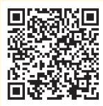
双唇音b p m