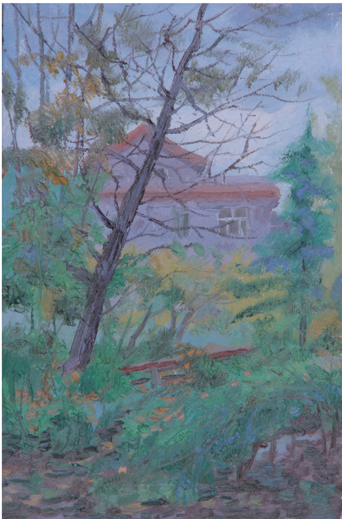
静安 50cm×60cm 2014年