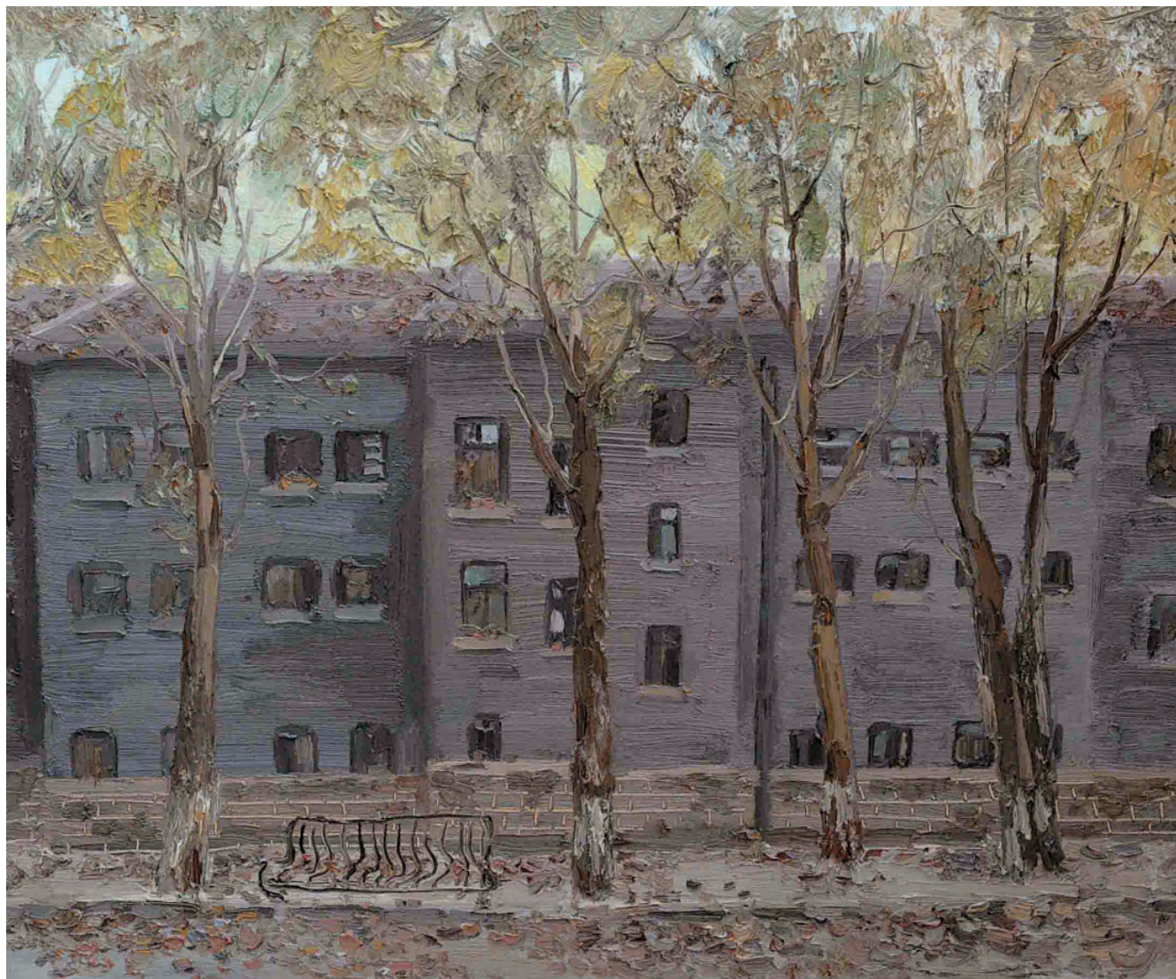
落叶识秋 50cm×60cm 2012年