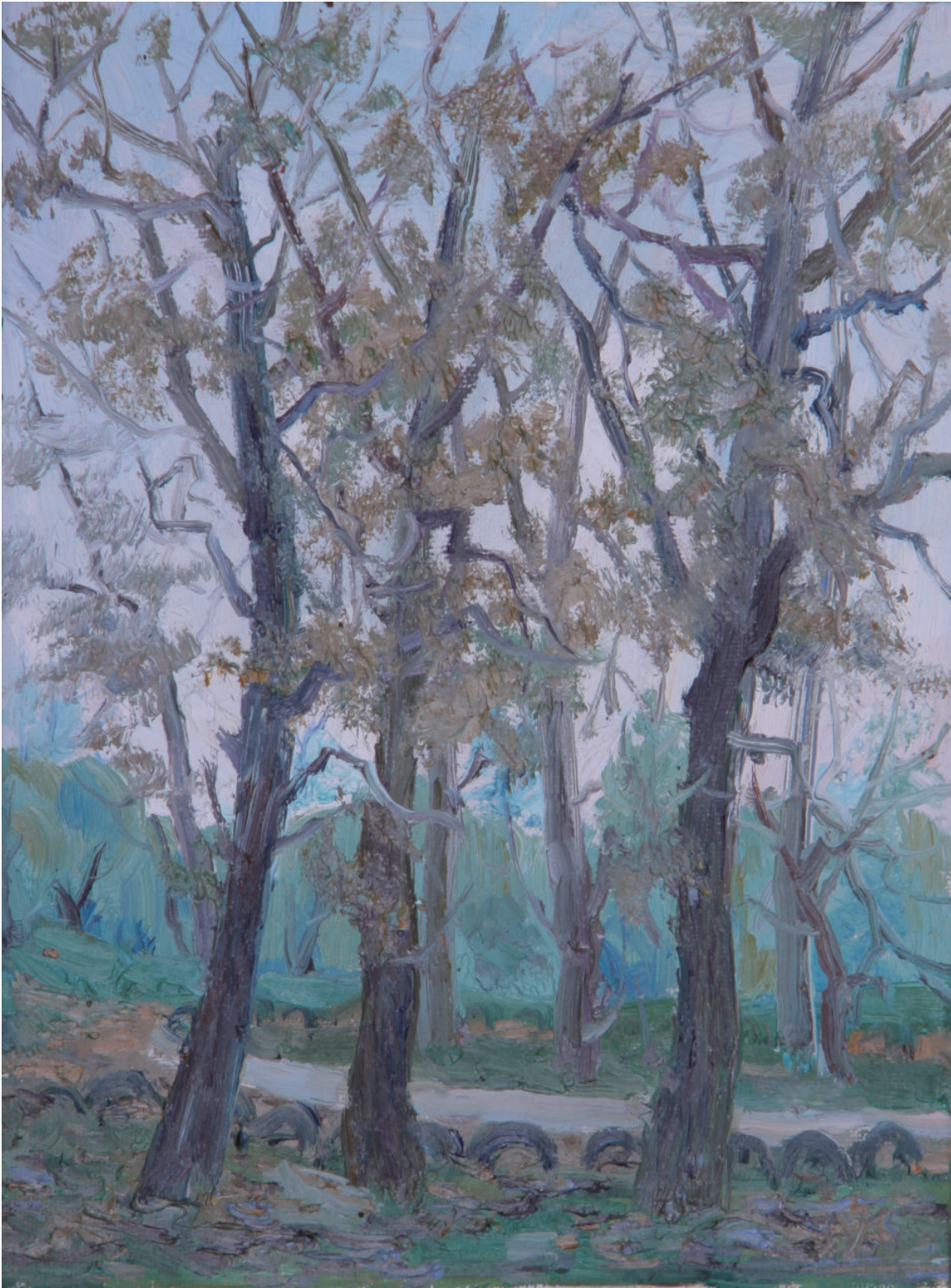
舞蹈 50cm×60cm 2014年