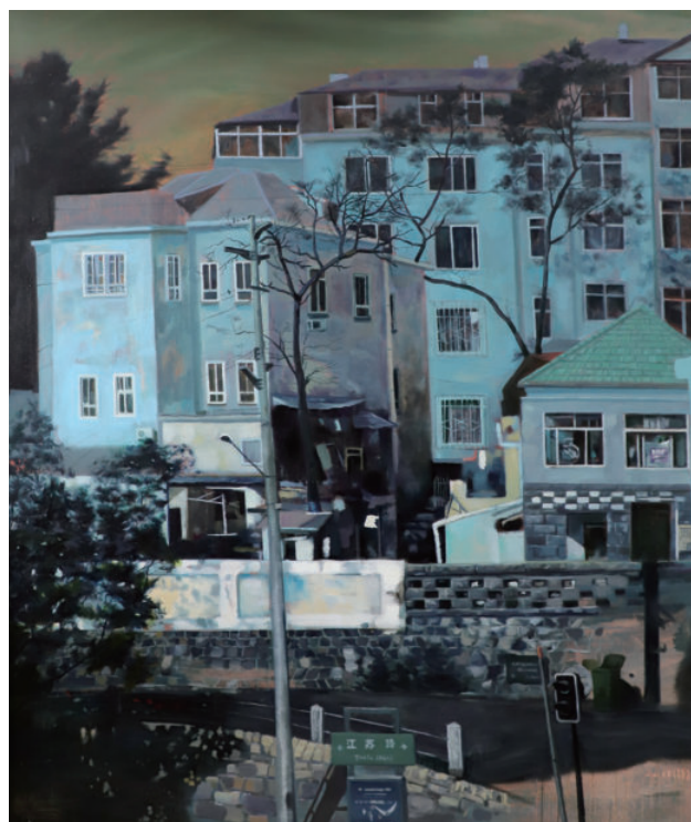
城 140cm×170cm 2015年