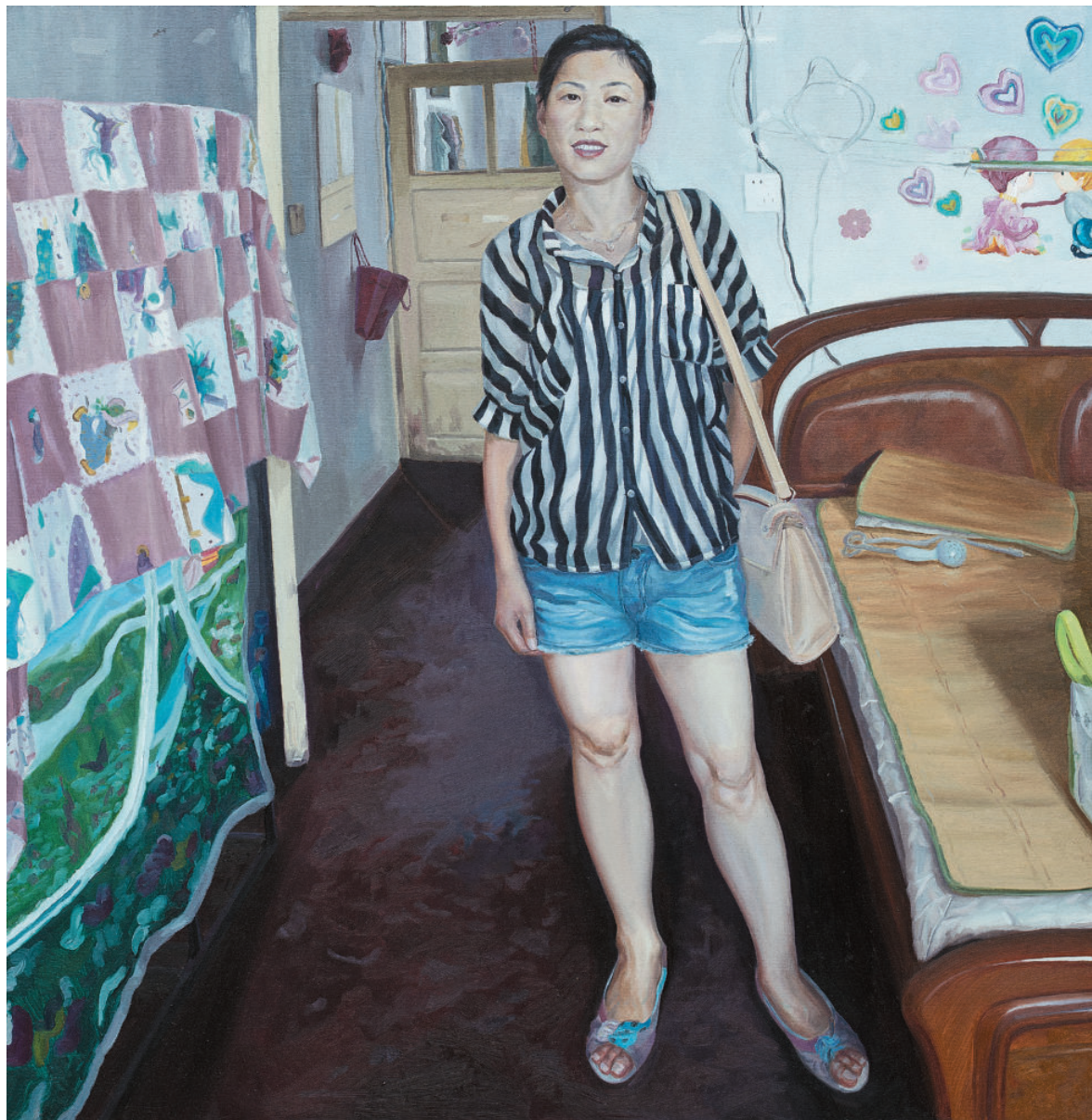
夏 150cm×150cm 2013年