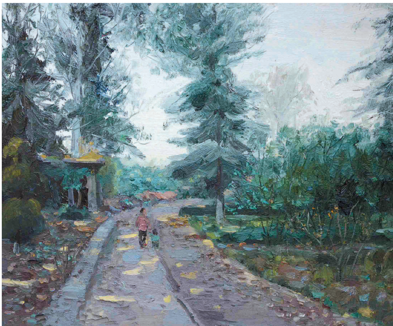
成长 50cm×60cm 2013年