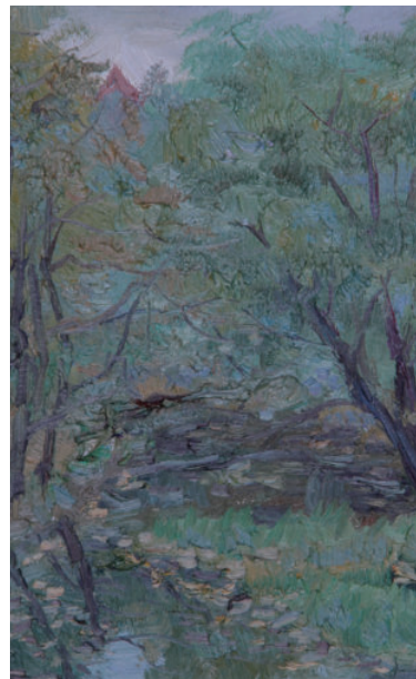
湖光 50cm×60cm 2014年