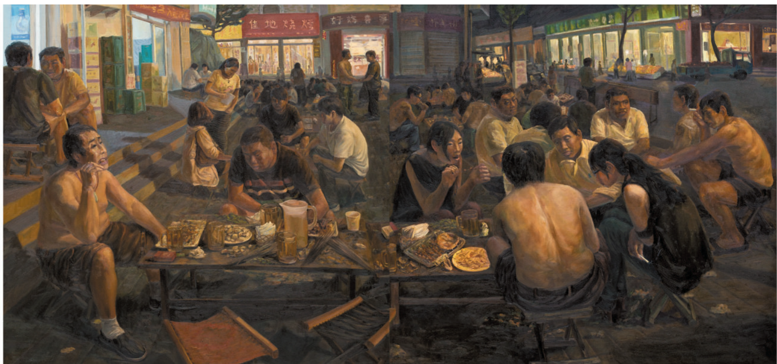
夜宴 150cm×300cm 2013年