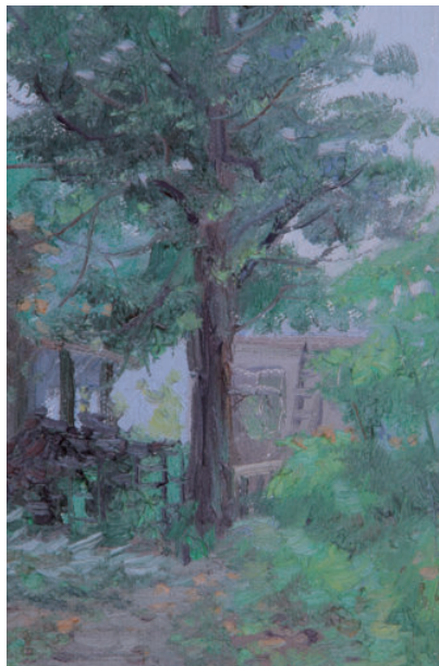
曲径 50cm×60cm 2014年

当然，以西方现代绘画之父塞尚为代表的“后印象主义”开启了油画风景写生的又一次飞跃，后印象派受到了克莱夫·