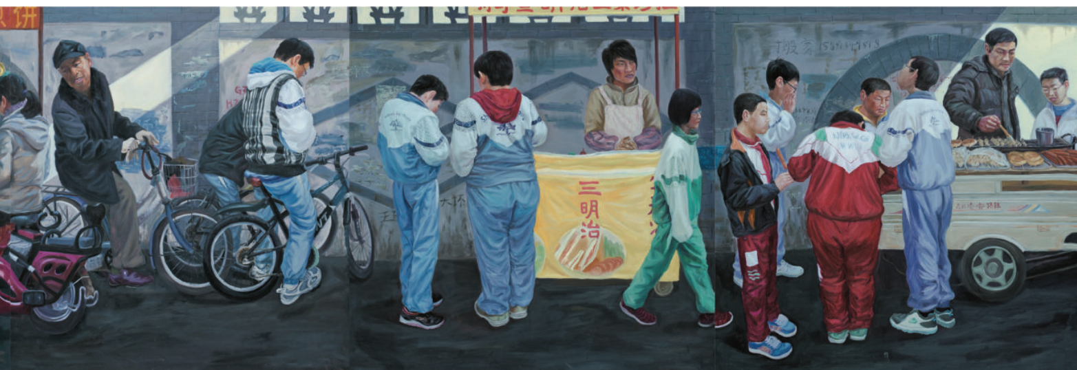
一条街 150cm×900cm 2013-2017年