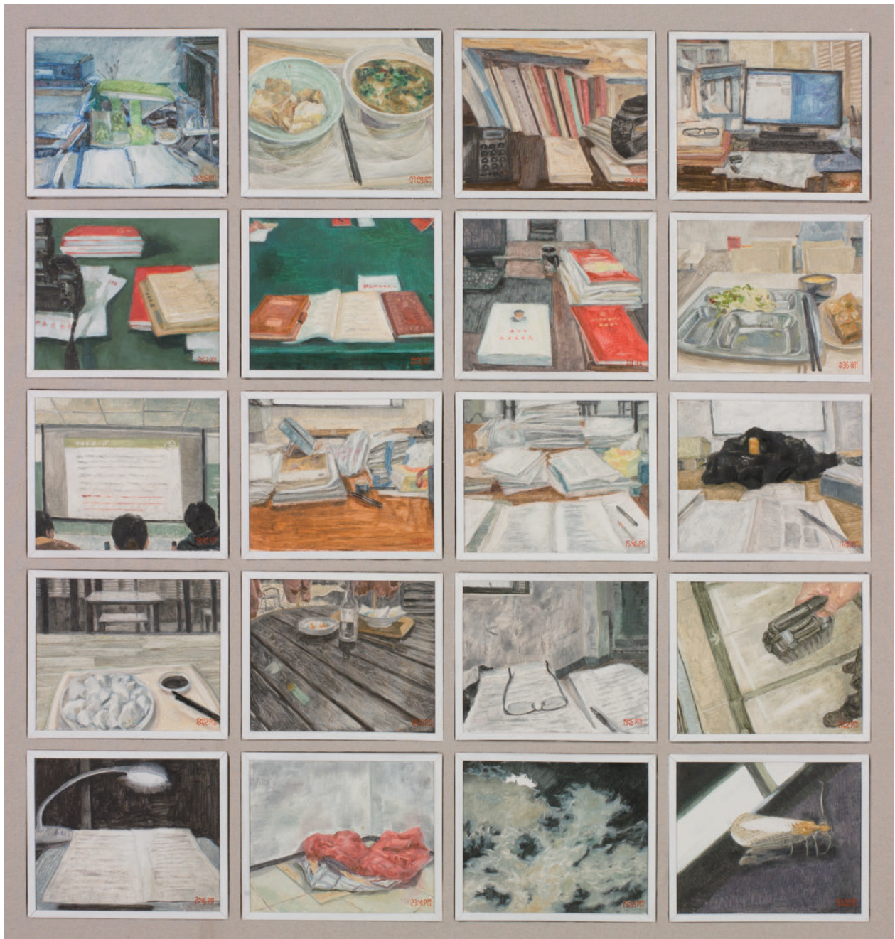
我的一天 185cm×194cm 2019年