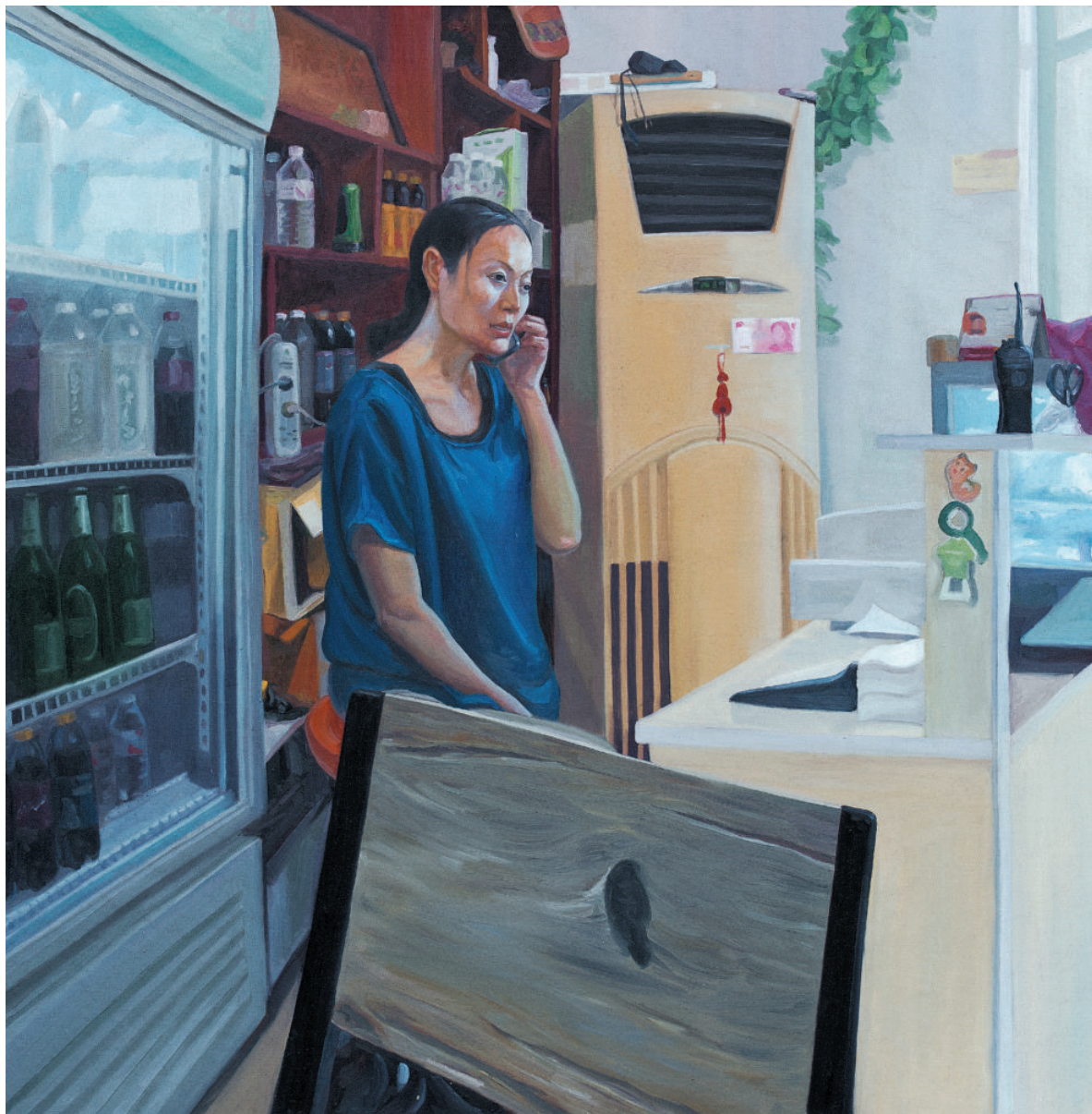
老板娘 150cm×150cm 2013年