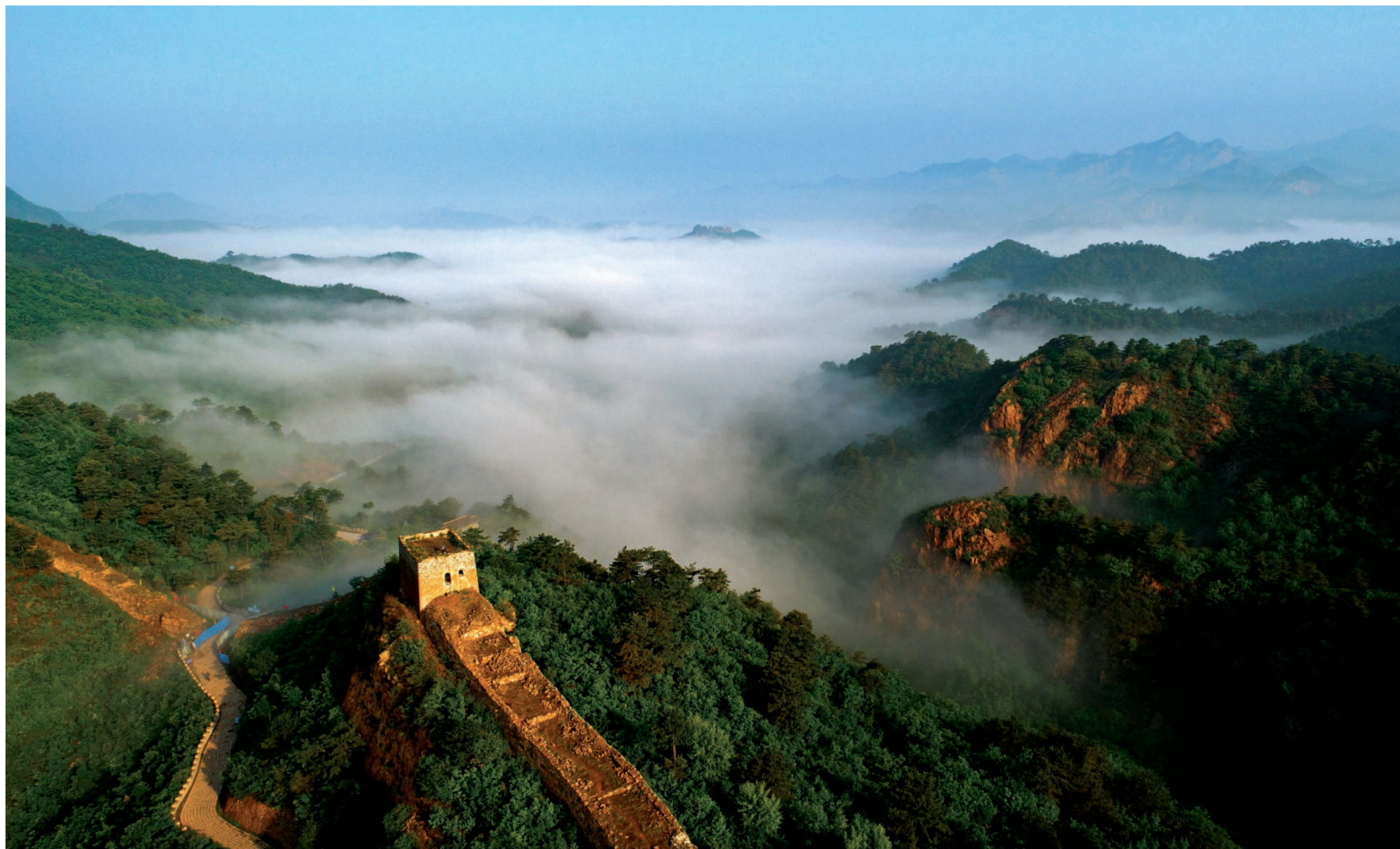
雄襟万里(组照)