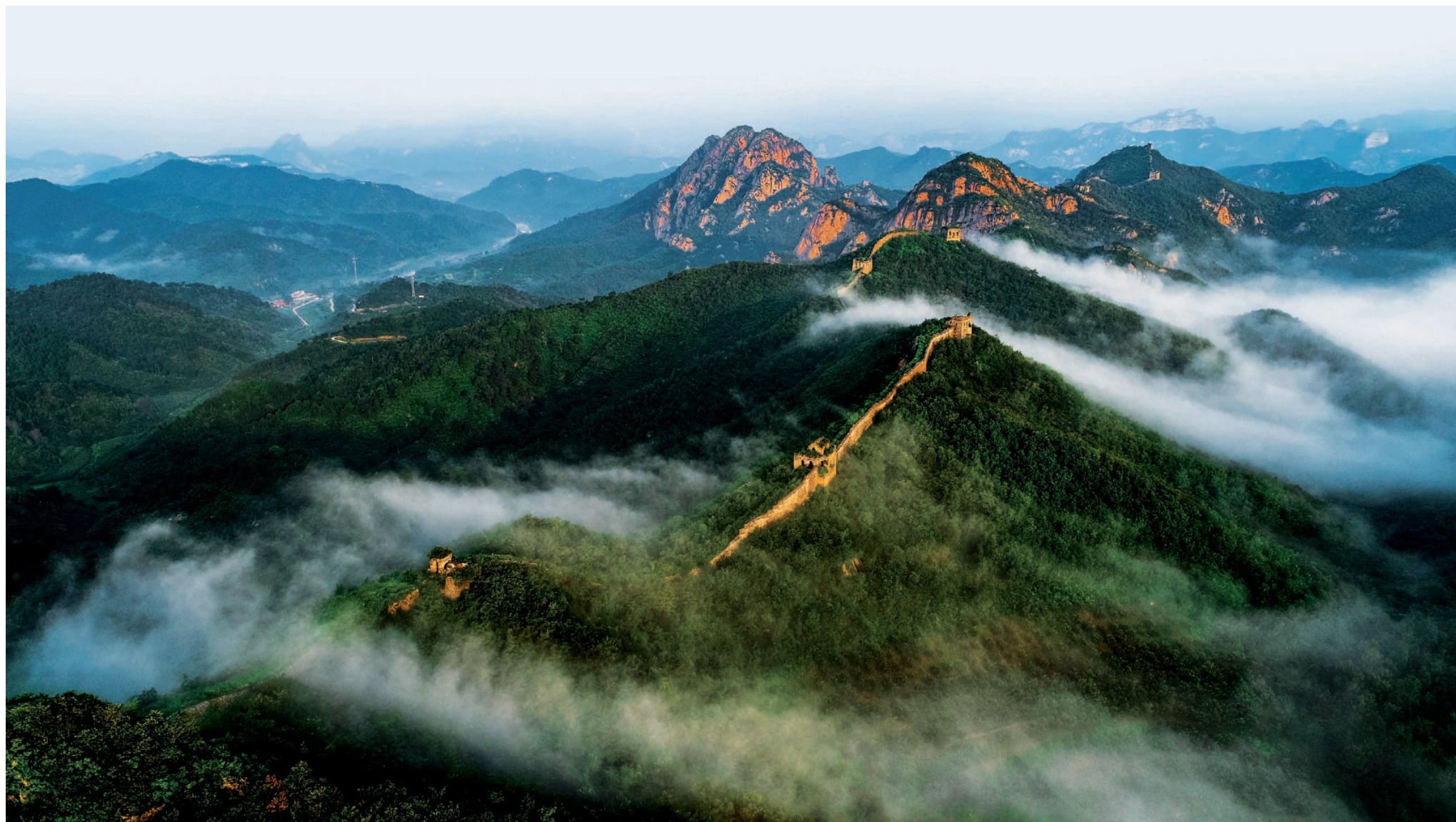
雾漫正冠岭