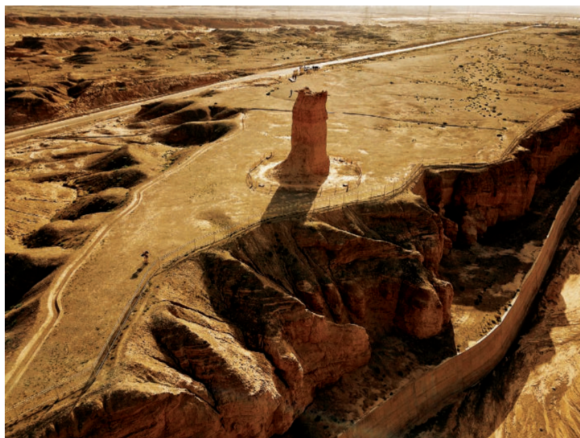
克孜尔尕哈烽燧（组照）