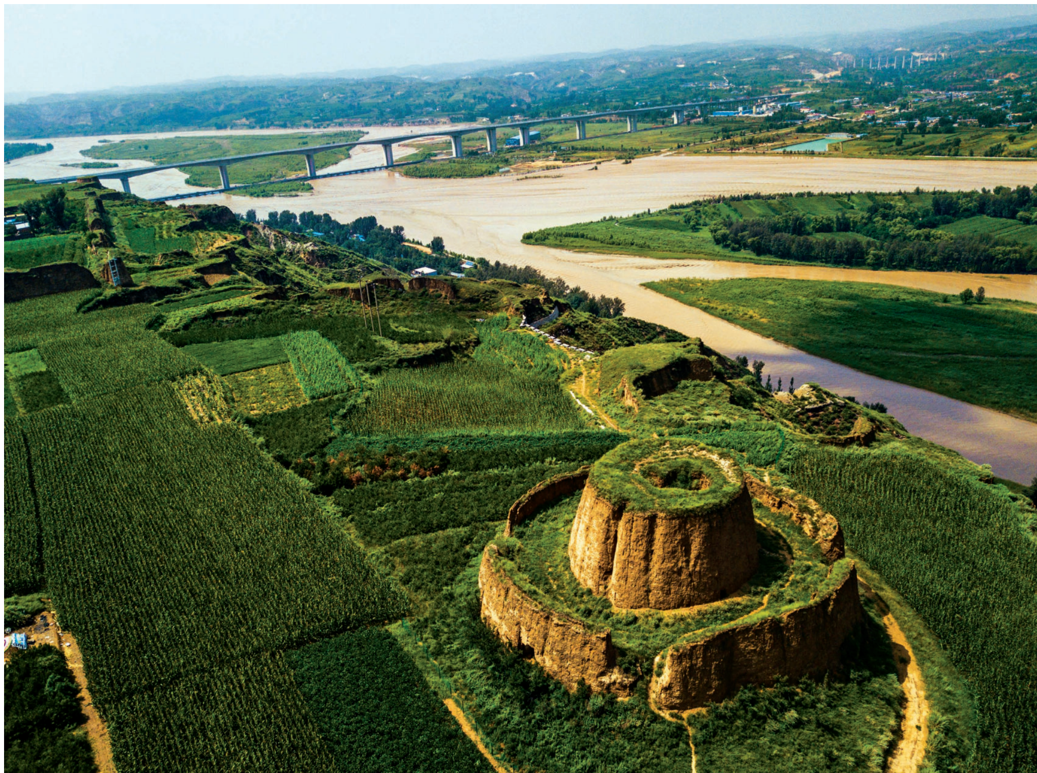
丹霞奇观和长城遗址（组照）