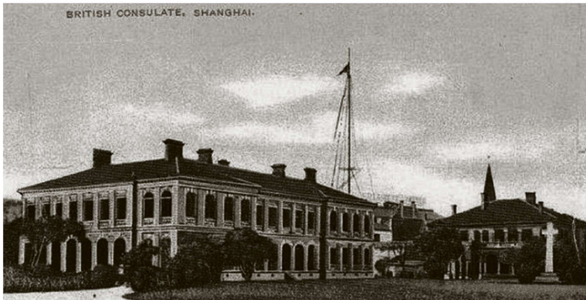
图3-1 英国驻沪总领事馆