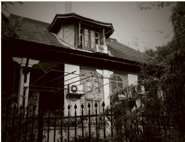
图2-1 海关关署俱乐部 中国以前是没有海关的，从1860年开始四任总税务司都由英国人担任的。第一任海关总税务司李泰国；第二任总税务司赫德；第三任总税务司安格联；第四任总税务司梅乐和。

清同治二年（1863年），赫德来到上海，就任上海江海关税务司，兼管长江各关务。他在沪任职期间，招募了一批西方高级职员，建