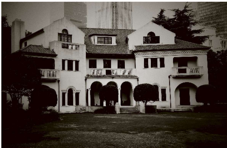
图2-2 税务司官邸 45号府邸第一位入住者为英国人。最后一位入住者为中国人丁贵堂，他是中国人中担任总税务司、副总税务司的第一人。