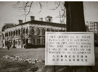
图3-2 英国驻沪总领事馆 从1845年开始的80年里，外滩房屋平均每30年翻造一次。随着产权人的变更，除少数机构如海关、怡和洋行和英国驻沪总领事馆从设立之初就一直在原址矗立以外，其余土地使用者均有变化。 第一代英国驻沪总领事馆毁于一场灾祸。冬末的大火使英国领事馆建筑和里面的家具、档案资料等遭到灭顶之灾。现在看到的是重建的外滩33号建筑。

屋办公，1849年在外滩建成英国驻沪总领事馆。1870年12月，第一代领事馆被一场大火烧毁，1872年开始在原址重建，1873年建成。