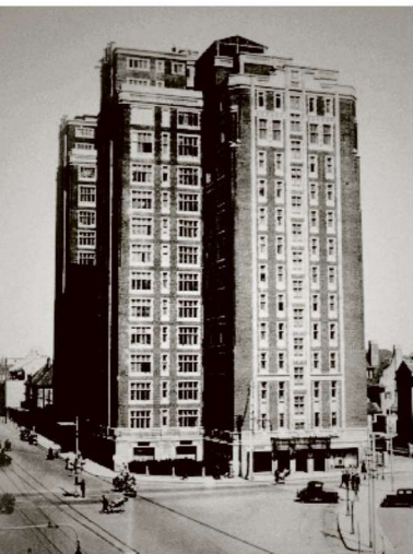
图5-1 华懋公寓(锦江饭店)

贵宾楼原名峻岭公寓，又名格罗斯凡纳公寓、格林文纳公寓、峻岭寄庐、高纳公寓、茂名公寓等，也是沙逊投资，英商公和洋行